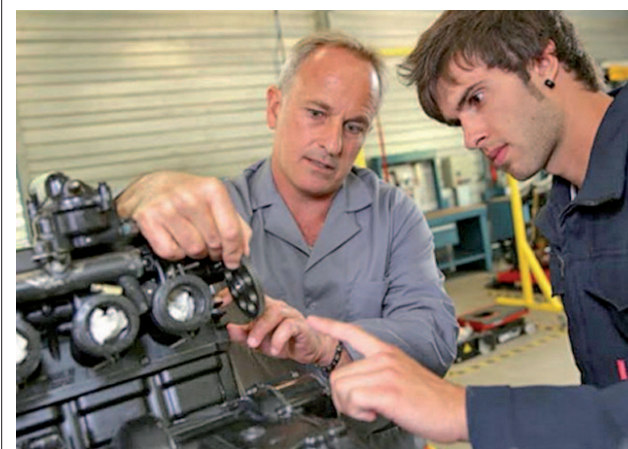
El INE ha facilitado los datos de 2016

El salario mediano, resultante de dividir a los trabajadores en dos mitades, es de 1.594 euros ● Las mujeres tienen menos empleos a tiempo parcial ● A la brecha provocada por el género se unen ahora las generadas por edad y tipo de contrato