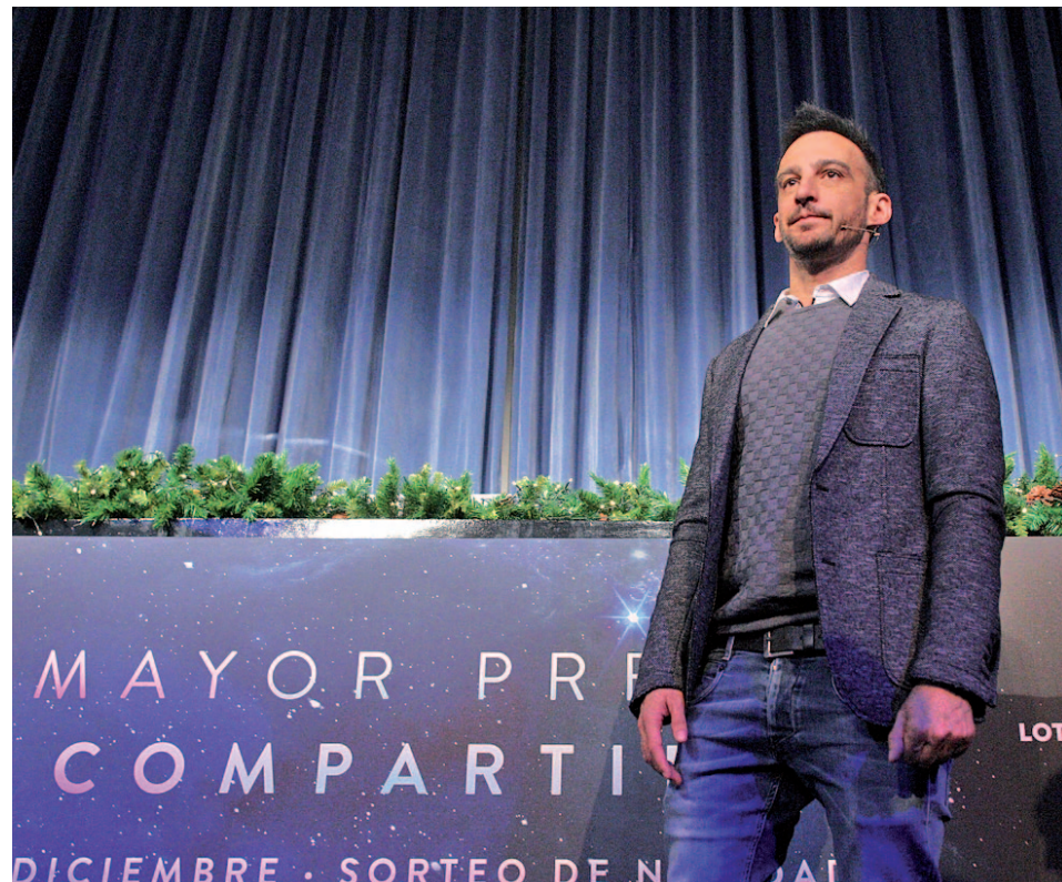
Alejandro Amenábar, en la presentación del sorteo

Durante la presentación del sorteo, la presidenta de la Sociedad Estatal de Loterías y Apuestas del Estado (Selae), Inmaculada García, explicó que este año se han puesto en circulación 170 millones de décimos, es decir, cinco millones más que el año anterior. En concreto, por cada euro jugado, los acertantes del pri-