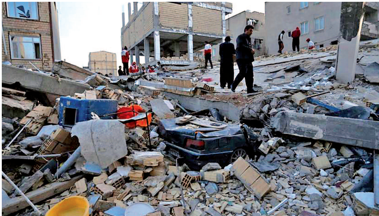
Los daños materiales han dejado a muchas personas sin casa

En octubre, la producción petrolera se situó en 1.955 millones de barriles diarios, en comparación con los 2.085 millones que había producido en septiembre de 2017. Es la primera vez que cae por debajo de los 2.000.