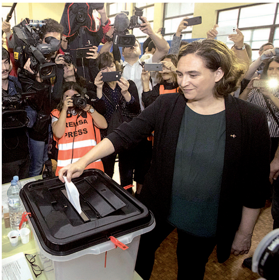
Ada Colau, alcaldesa de Barcelona, votó en el 1-0

“Hay un Gobierno roto, debilitado”, señaló Collboni, que añadió: “El mensaje que enviamos hoy al mundo es que Barcelona es más inestable y está peor que hace una semana”.