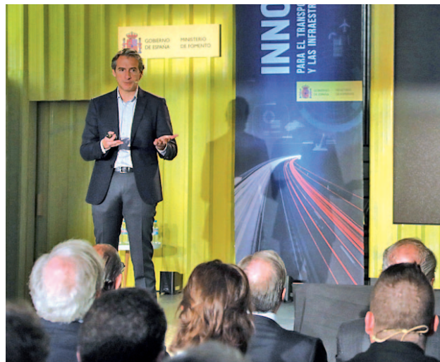
El ministro de Fomento, Íñigo de la Serna

Así, el proyecto se financiará con capital privado a través del sistema de pago por uso, de forma que los constructores que se adjudiquen las obras adelanten los recursos necesarios para llevarlo a cabo. Fomento lo ha diseñado para que estas se beneficien de fondos europeos y de financiación del BEI.