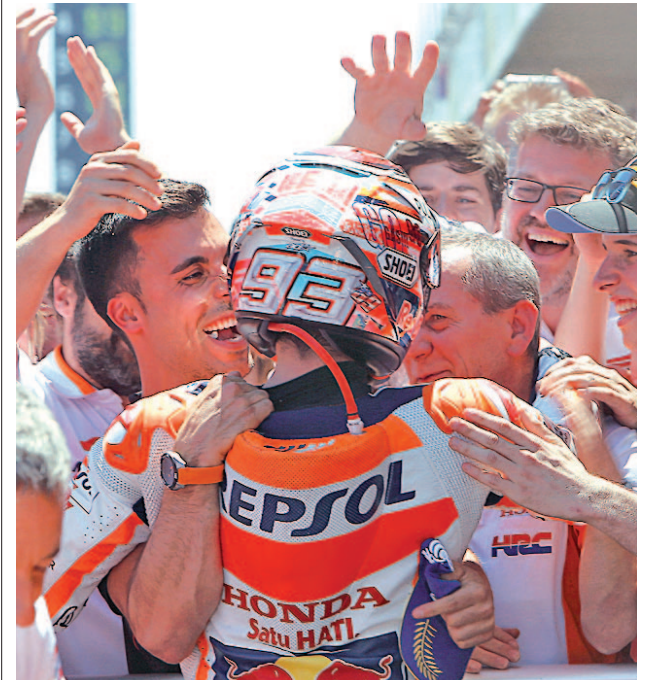
Márquez, durante la celebración de su último Mundial

Ante esta continuidad las novedades han llegado con los dos protagonistas del último Mundial de Moto2, Franco Morbidelli y Thomas Lüthi, quienes darán el salto a MotoGP, aunque en el caso del suizo una lesión evitó que se estrenara en Cheste.