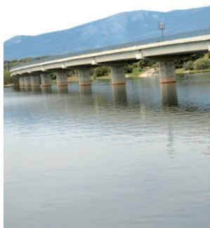
La sequía gana terreno

El precio de la vivienda registró una subida anual del 6,8% en el tercer trimestre, elevándose un 2% respecto al periodo anterior, según el Colegio de Registradores de España. Este dato confirma la tendencia alcista en la valoración de este sector.