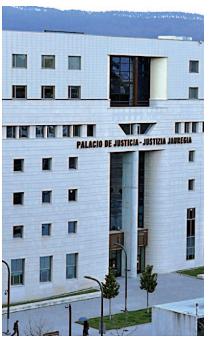
Justicia de Pamplona