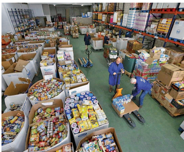
Imagen de banco de alimentos