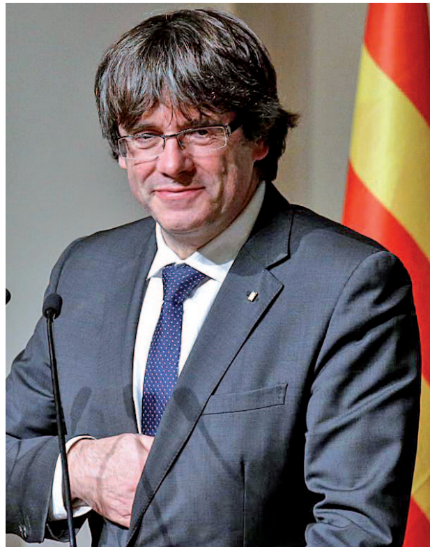
Carles Puigdemont será candidato

Por el momento, ya se sabe que ERC, que parte como fa-