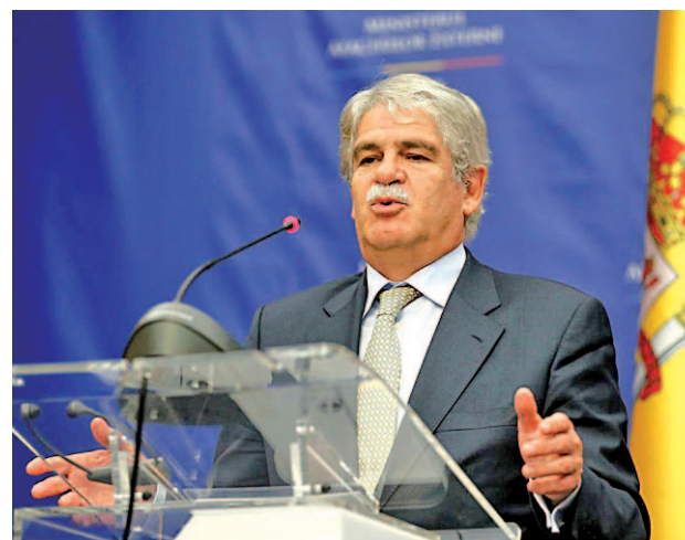
Alfonso Dastis, ministro de Asuntos Exteriores

Precisamente ese mismo día Dastis alertó a sus socios de la Unión Europea de que la “manipulación y desinformación” lanzada contra el bloque comunitario desde redes