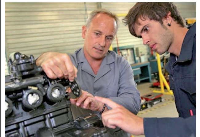
El INE ha facilitado los datos de 2016

El salario mediano, resultante de dividir a los trabajadores en dos mitades, es de 1.594 euros ● Las mujeres tienen menos empleos a tiempo parcial ● A la brecha provocada por el género se unen ahora las generadas por edad y tipo de contrato