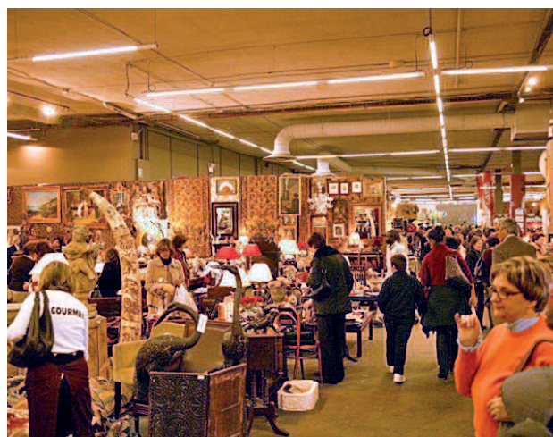
Edición anterior del Rastrillo de Nuevo Futuro

ciparán más de 1.200 voluntarios, que trabajarán a lo largo de los nueve días, y habrá 65 puestos renovados y dedicados a la restauración, las antigüedades, la decoración, la moda o la cultura. Un nutrido grupo de escritores, además, se acercarán al Pabellón de Cristal para firmar ejemplares de sus libros.