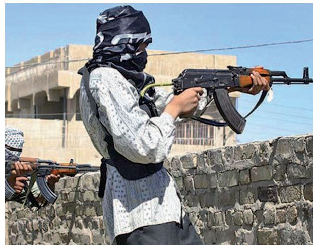
25.673 personas perdieron la vida en atentados

terrorista Estado Islámico mató a un 50% de personas más que el año anterior, según se desprende del Índice Global de Terrorismo 2017 publicado este martes. En total, 25.673 personas perdieron la vida en atentados terroris-