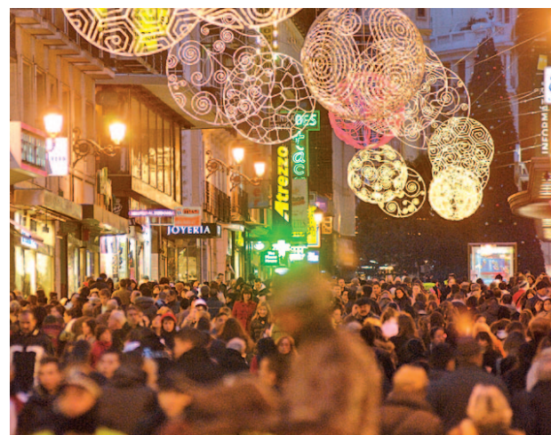
Diciembre es el mes tradicional para adquirir los regalos

Según los encuestados, las razones por las que esperan hasta diciembre es seguir la tradición de comprar en el último minuto (33%), la falta de tiempo (20%) y los escasos descuentos (17%). Además, el 30% de los españoles confirma destinar días enteros a encontrar un único presente.