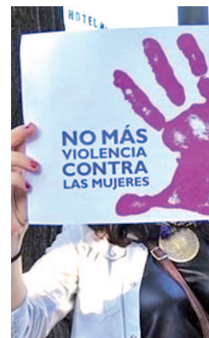
Protesta contra el maltrato

Asimismo, existen otros motivos que las llevan a la inacción frente a los abusos que