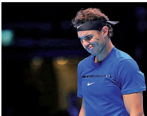
El balear sólo pudo jugar un partido en Londres

Eso sí, el balance del jugador balear en este 2017 es sobresaliente, con seis torneos ganados.