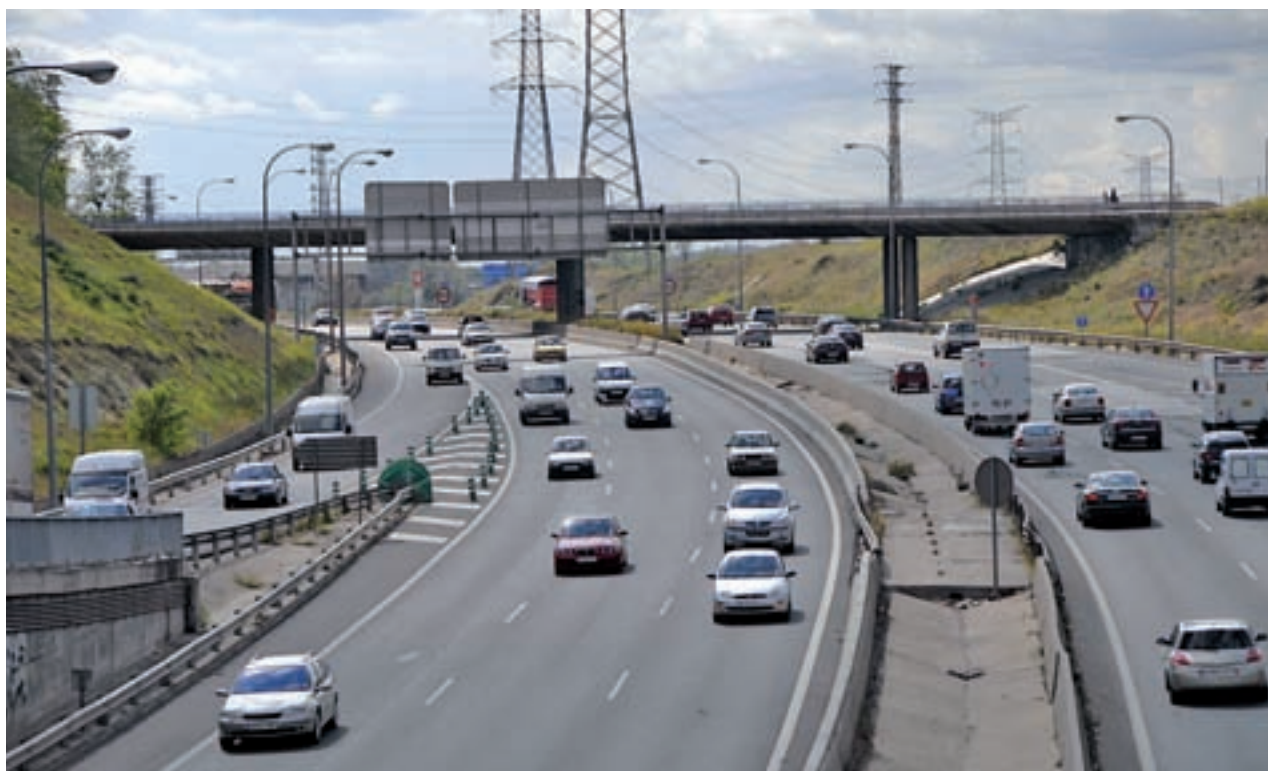
La M-40 es una de las carreteras en las que se llevarán a cabo restricciones GENTE

El protocolo también recoge la realización de una campaña para informar a los madrileños de la existencia de 23.000 plazas en los aparcamientos disuasorios de la región. También se promocionará el transporte público, pero no se contempla su gratuidad en esos días.