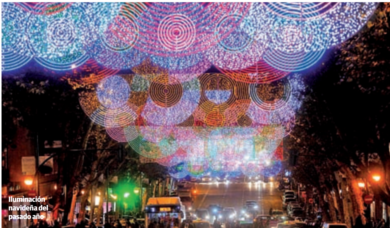
Iluminación navideña del pasado año