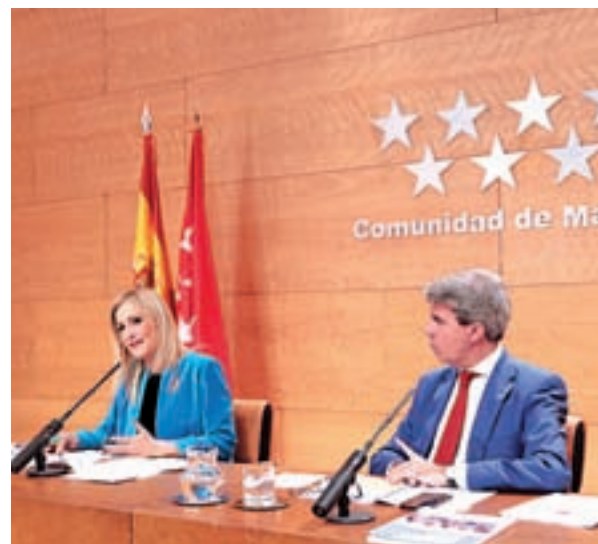
Cifuentes y Garrido, durante el Consejo de Gobierno

que decidan sus políticas de limitación del tráfico, el Ejecutivo de Cristina Cifuentes recomienda que las restricciones se hagan en función de las emisiones de NO 2 de los vehículos, y no en base a su matrícula es par o impar, como hace el Consis-