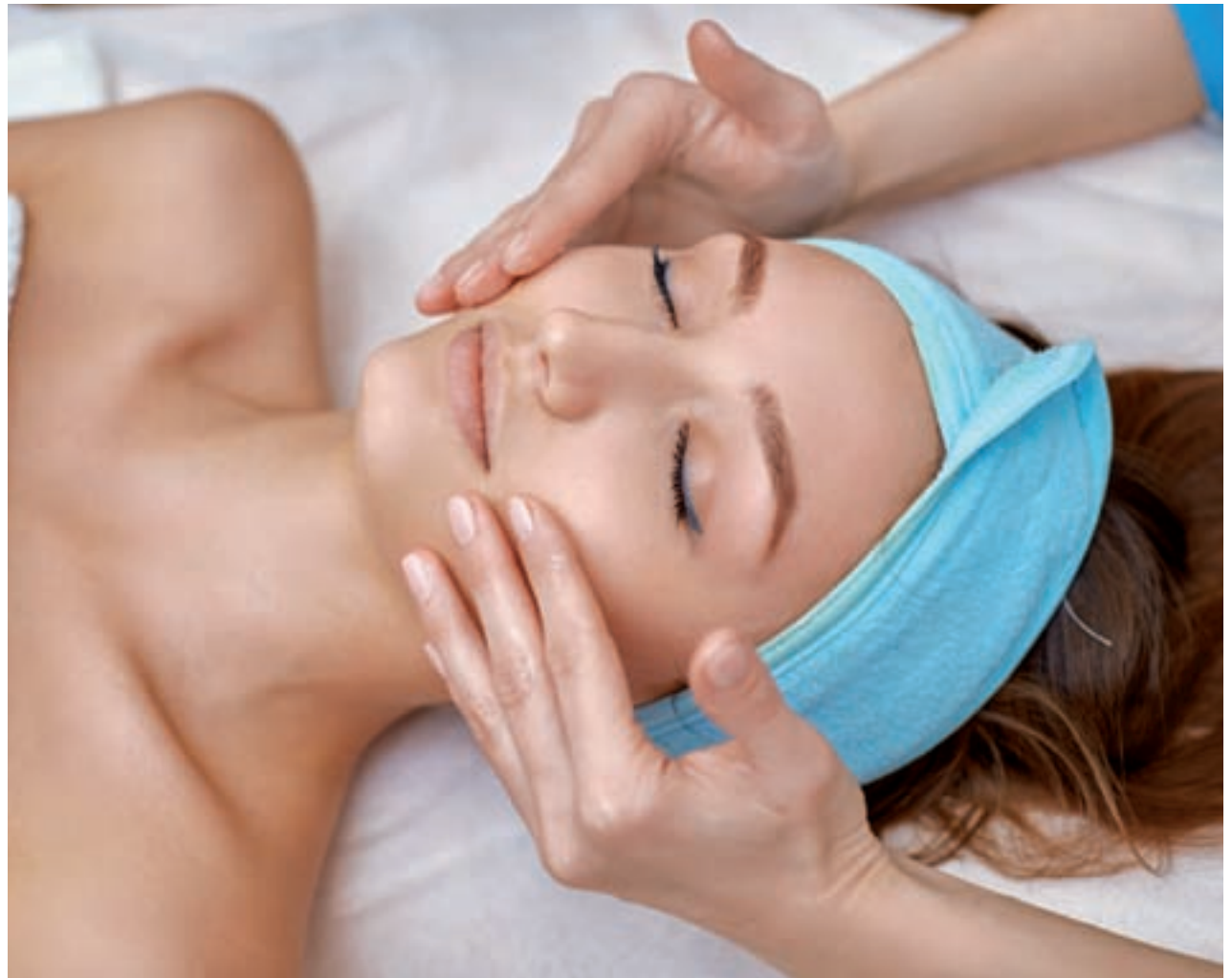
Es importante que la piel no sufra en los meses más fríos del año