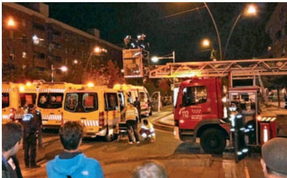
Un momento del suceso

Una mujer de 85 años salvó la vida el pasado 19 de noviembre gracias a la rápida actuación policial. Dos agentes la sacaron en volandas en el mismo momento en el que se producía una explosión que provocó el desprendimiento de varios fragmentos del techo que hirieron a uno de ellos en la cabeza, además de provocarle fuertes golpes y quemaduras, según señalaron fuentes municipales. Se trata de una "valiente actua-