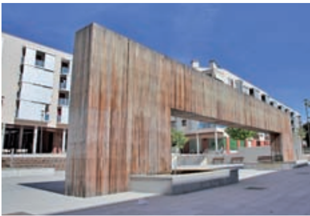
La conocida como 'plaza de las maderas'