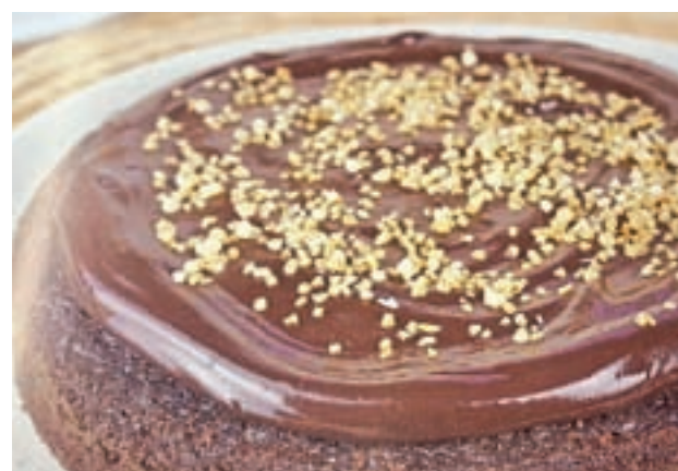
Tarta de chocolate: Para 18 porciones aproximadamente. 50 gramos de cacao, 2 cucharaditas de levadura química, 60 gramos de avena integral, 6 huevos, 250 gramos de puré de manzana y 120 ml de sirope de agave.

En cuanto a la receta preferida de todas las que aparecen en el libro, aunque es cierto que le cuesta elegir, se queda con las tortinas con mantequilla de cacahuete y la mousse de chocolate con aguacate. Combinaciones a las que, quizá, no estamos acostumbrados, pero cuyo resultado, al menos en imágenes, no puede ser mejor. En su mano queda disfrutarlas. ●