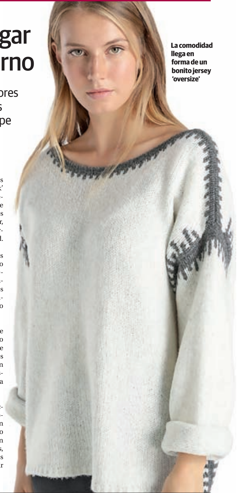
La comodidad llega en forma de un bonito jersey 'oversize'

8: En cuanto a joyas y accesorios, esta temporada brillaremos con unos pendientes de tamaño XXL, que podremos llevar en las ocasiones más especiales, ahora que llegan las fiestas de Navidad, o incluso para ir a trabajar.