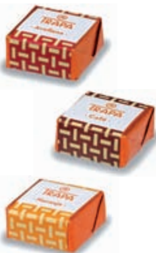
Pequeña tentación: Avelana, café o naranja son sólo algunos de los diferentes sabores de los Cortados.

Con aromas frutales o pineladas de frutos secos, estas pequeñas tentaciones fusionan diferentes texturas en todo un mundo de sensaciones que logra convertir en especial cualquier ocasión, tanto para los amantes de lo clásico como a quienes desean