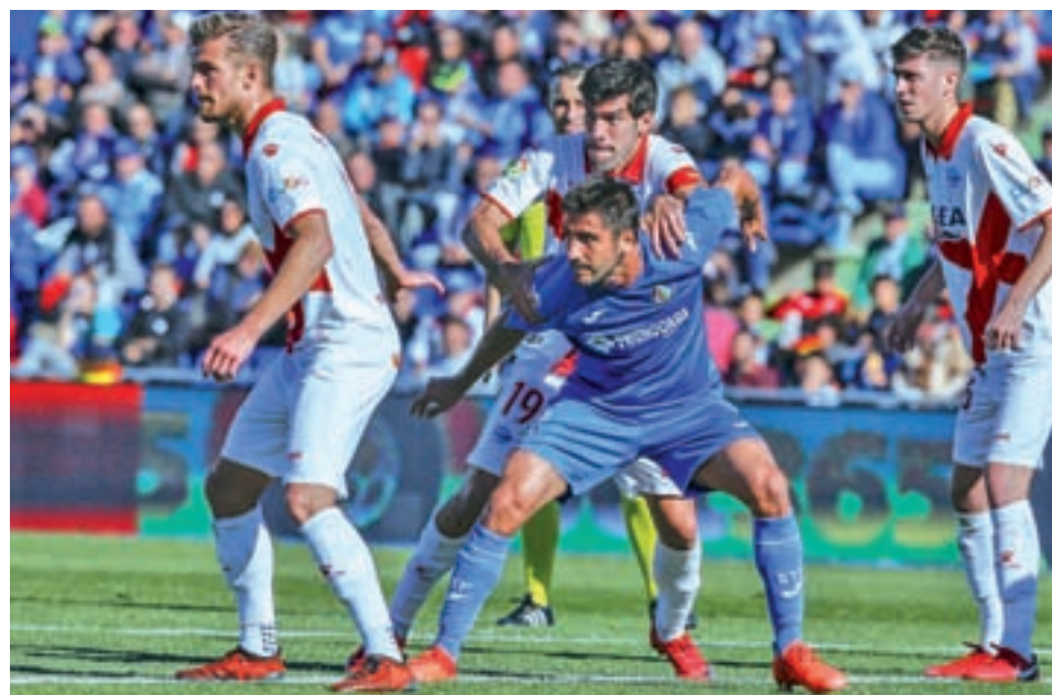
El Getafe, en su cruce con el Alavés

Caso contrario es el del conjunto madrileño que tras la victoria de la pasada semana ha conseguido alejarse de la zona roja y va camino de los puestos europeos que abre el Villarreal. Sin embargo, el camino no será fácil y el técnico azulón se ha mostrado cauto ante esta posibilidad. “Agradecemos la confianza de la afición, pero acabamos de aterrizar en Primera, es el año más duro. Tenemos que ir paso a paso”, señaló Bordalás en rueda de prensa.