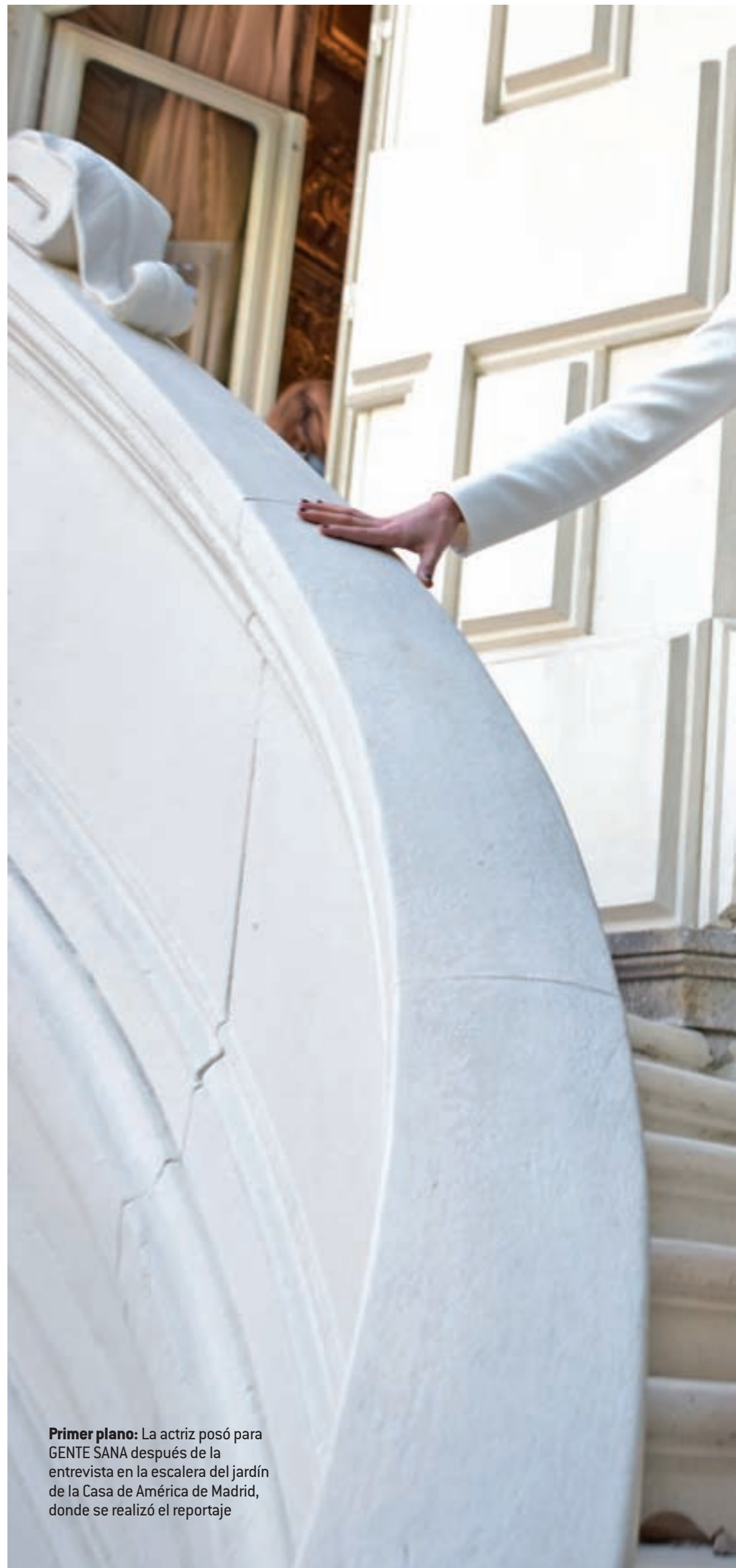
Primer plano: La actriz posó para GENTE SANA después de la entrevista en la escalera del jardín de la Casa de América de Madrid, donde se realizó el reportaje

"HAY PLACERES QUE YO LLAMO DE GASOLINERA, COMO LOS DONETTES, PERO NO ME LOS PERMITO"