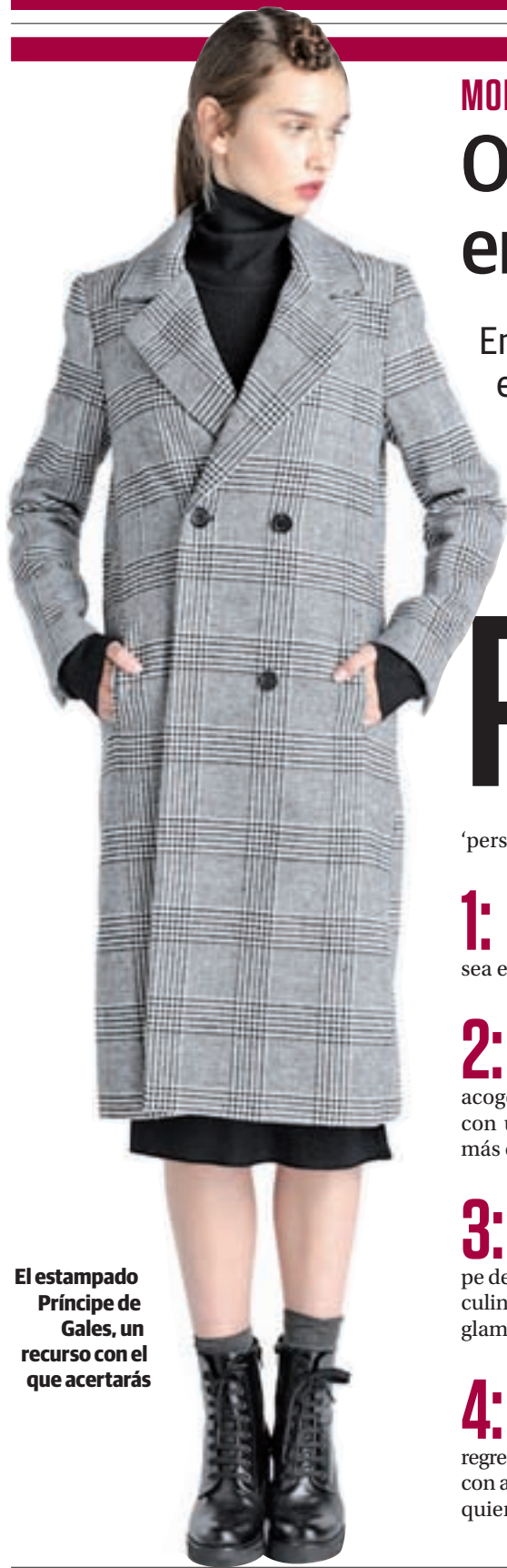
El estampado Príncipe de Gales, un recurso con el que acertarás