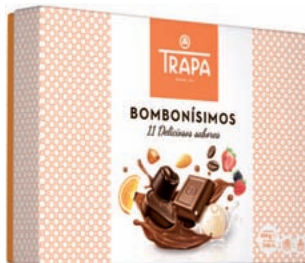
El placer más intenso: Los Bombonísimos son una nueva selección de grandes bombones, cubiertos de chocolate negro, con leche extrafino y blanco, y rellenos de exquisitos pralinés, elaborados a partir de ingredientes y semillas de cacao de alta calidad y sin grasa de palma.

También puedes servirlos acompañados con un cava a la hora del postre, como broche de oro a una cena excep-