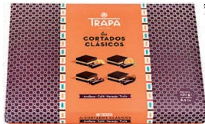
Amplia variedad de un bombón icónico: Los Cortados fueron los primeros bombones que se elaboraron en España en 1969. Hoy hay una amplia variedad: Clásicos, Originales, Creación, Noir o Stevia.

PUEDEN SERVIRSE PARA RECIBIR A LOS INVITADOS O PARA ALARGAR LA SOBREMESA