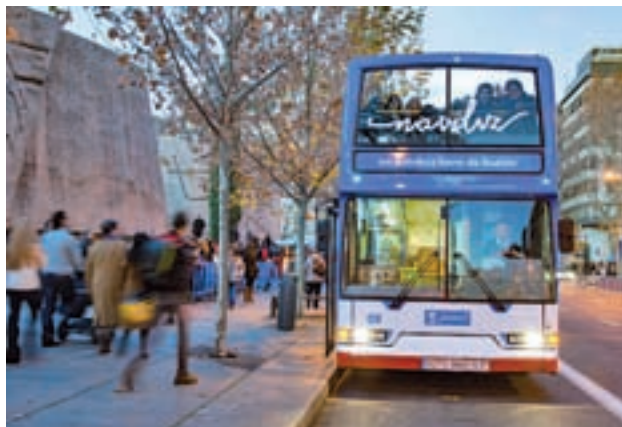
El autobús de la ilusión: El Naviluz se ha convertido en uno de los grandes atractivos de la Navidad madrileña. Las salidas se efectuarán en las inmediaciones de la plaza de Colón.

A pesar de que aún queda un mes para la llegada de la Nochebuena, Madrid empieza este fin de semana a sentir la magia de la Navidad. Este viernes 24 a las 18 horas se enciende la iluminación del centro de la capital que este año estrena ornamentación. En la calle de Alcalá, en el tramo que transcurre desde Cibeles hasta la Puerta de Alcalá, las luces evocarán un cielo lleno de estrellas. En Serra-