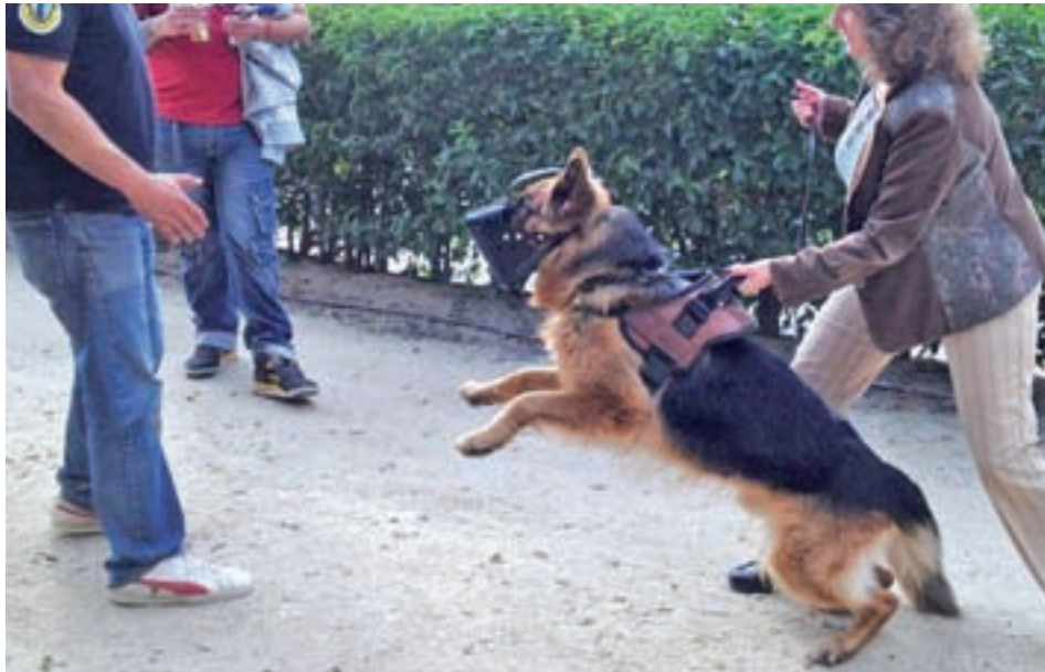
Cada 25 de noviembre se celebra el Día Contra la Violencia de Género SECURITY DOGS

Un proyecto adiestra a perros para la protección de las víctimas • Casi 40 mujeres reciben ya esta ayuda • Las razas más comunes son los pastores alemanes o belgas