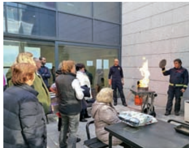
Una demostración para los asistentes

En la edición de este año se ha puesto un énfasis especial en la importancia de instalar detectores de humos, también en los hogares. La presentación tuvo lugar en Collado Villalba, localidad donde se