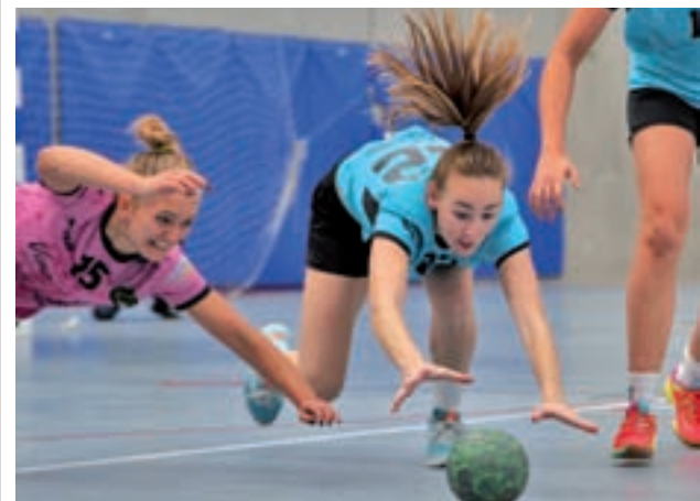
El Getasur, la pasada jornada GENTE

Las chicas de la AD Alhóndiga visitarán este fin de semana al EMF Fuensalida tras caer ante el CD Tacón. El choque se disputará este domingo 26 de noviembre.