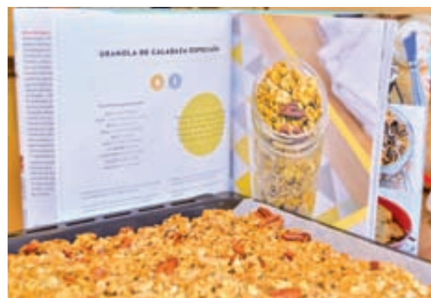
Granola de calabaza: 30 raciones aprox. 90 g de puré de calabaza, 60 ml de aceite, 80 ml de sirope de arce, 450 g de avena, 150 g de pecanas, 100 g de almendras, 1 cucharada de canela y una media de jengibre, una pizca de clavo molido y nuez moscada.