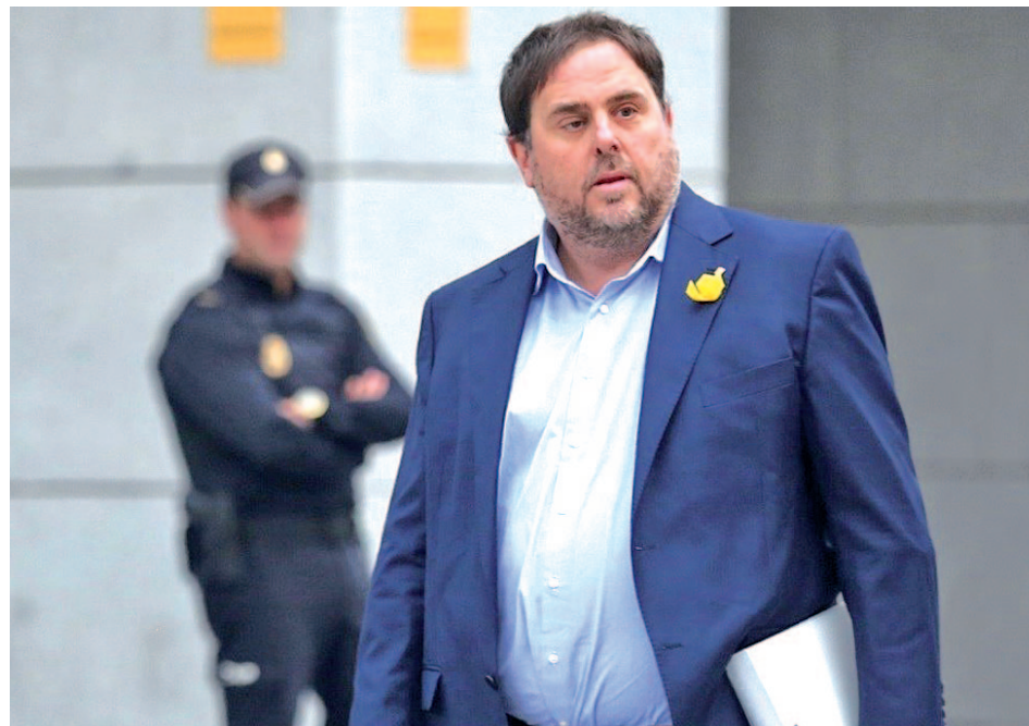
Oriol Junqueras, líder de ERC en prisión

La decisión podría conllevar la salida de la cárcel de los exmiembros del Gobierno catalán • Los políticos comparecerán este viernes y aseguran acatar el artículo 155 de la Constitución