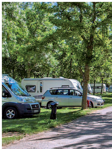
El camping Fuentes Blancas

El de Fuentes Blancas compartió podium de ganadores en su categoría con los campings Picos de Europa (Asturias) y Ordesa (Huesca). Situado a tres kilómetros del centro histórico de Burgos, el