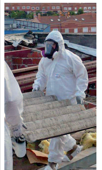
Manipulación de amianto