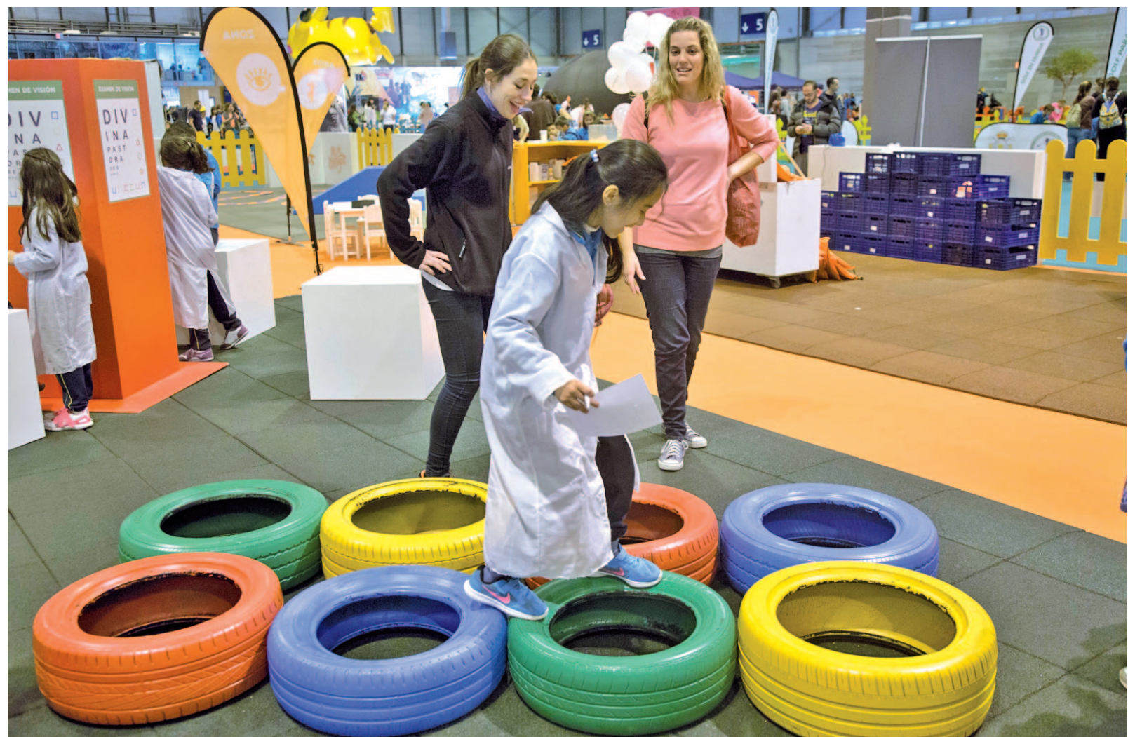
Actividad destinada a la Salud del 2016

La marca tendrá diferentes zonas con talleres, videojuegos y muestras para los más aficionados a Lego