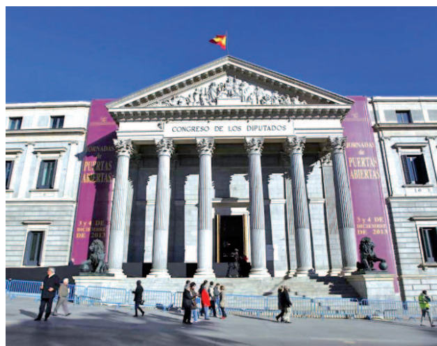
El Congreso abre sus puertas el día 6

Gobierno y PSOE pactaron abordar este debate como condición para apoyar la aplicación del artículo 155 • El primer paso será la discusión en la comisión territorial, que comenzará en enero