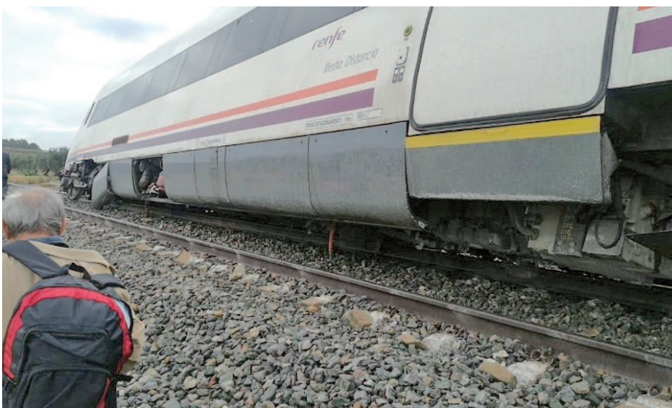
El incidente se produjo en la línea Málaga-Sevilla