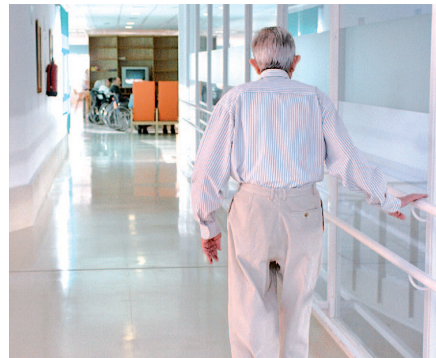
Residencia de Mayores GENTE

Igualmente les preguntan por los requisitos y estándares sobre recursos humanos exigidos para atender a personas en situación de dependencia, y las diferencias entre lo que necesitan las residencias públicas y privadas.