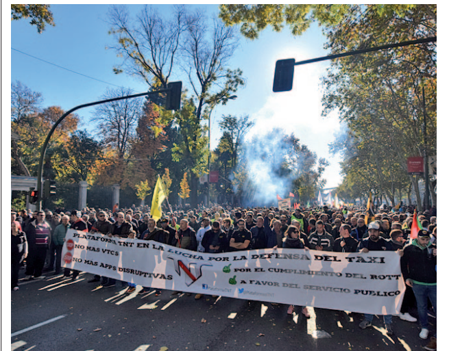
Huelga de taxistas en Madrid

El secretario de Estado mostró así su convencimiento de que contribuirá a "ordenar y a mejorar la convivencia" de los dos servicios de transporte, que mantienen un conflicto desde hace tiempo.