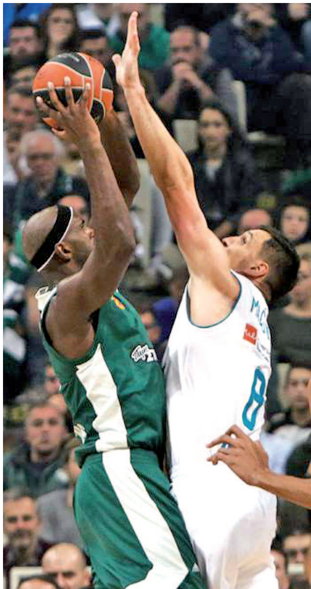
El Real Madrid volverá a jugar ante su afición