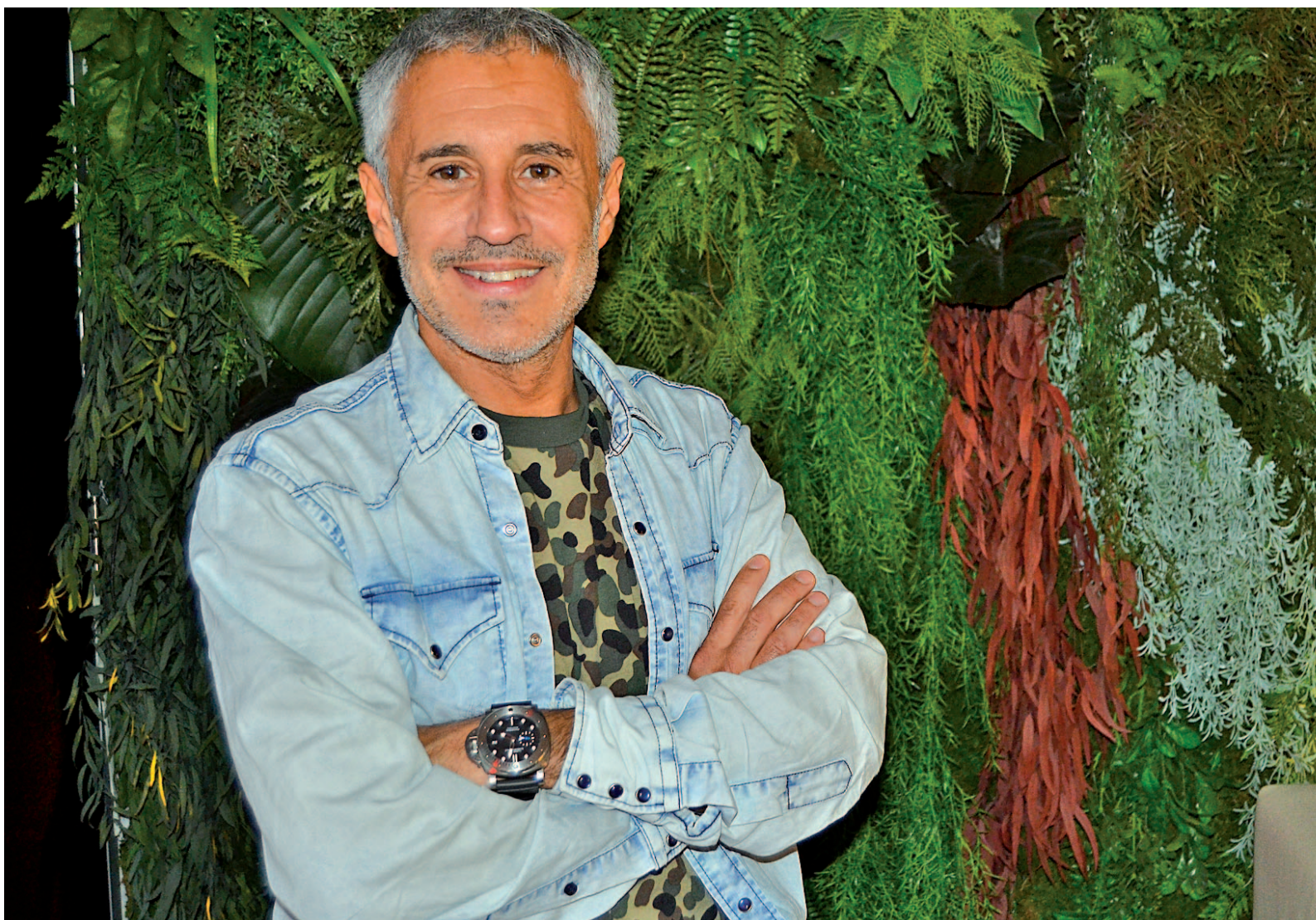
Llega el último trabajo del cantante ALBA RODRÍGUEZ / GENTE