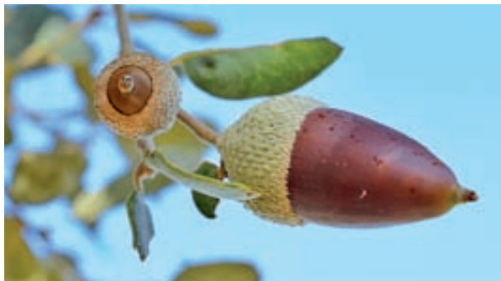
Bellotas en la encina

Esta finca forma parte del Parque Regional de la Cuenca Alta del Manzanares, Re-