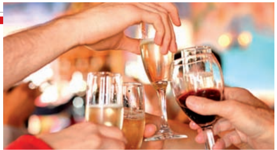
Los brindis son una costumbre de este tipo de cenas

La importancia de estos días es tan grande que un estudio de UniversalPay revela que la facturación de los restaurantes en ese periodo supone el 25% del total de estas festividades, que en el caso de Madrid asciende a más de 23.000 euros de media.