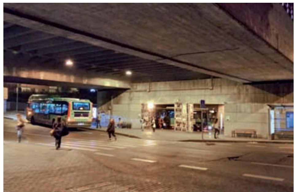
Intercambiador de Aluche

"Los municipios de Fuenlabrada y Leganés no son ciudades de segunda, Por eso, la ruta natural por proximidad y comodidad para nuestros vecinos y vecinas es que la cabecera parta desde el centro de la capital, desde Cibeles o Atocha", señaló el secretario