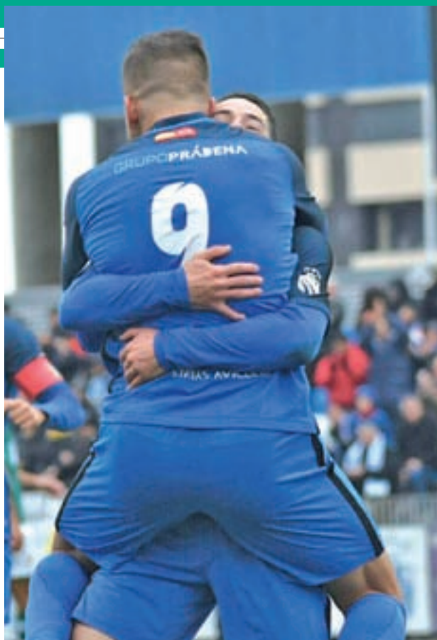
Dos jugadores del Fuenlabrada celebran un gol

Los de Calderón llegan al encuentro como líderes del grupo tras haber firmado una primera vuelta prácticamente impecable. Hasta la fecha acumulan 12 victorias, 5 empates y una sola derrota en lo que va de temporada, lo que la convierte en la mejor del equipo en su historia. En estas 18 jornadas, el equipo ha sido capaz de plantarle cara a un grande de Primera