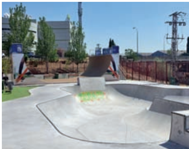
Pista de patinaje: Desde este viernes 15 hasta el próximo 7 de enero se instalará una gran pista de patinaje sobre hielo de 525 metros cuadrados en el Centro Deportivo de la calle Creta. Además, estará disponible un monitor en la zona de skate y patinaje.

Una de las más llamativas de la programación navideña será la representación de los belenes vivientes que llevarán a cabo la Casa Regional Andaluza, este sábado 16 de di-