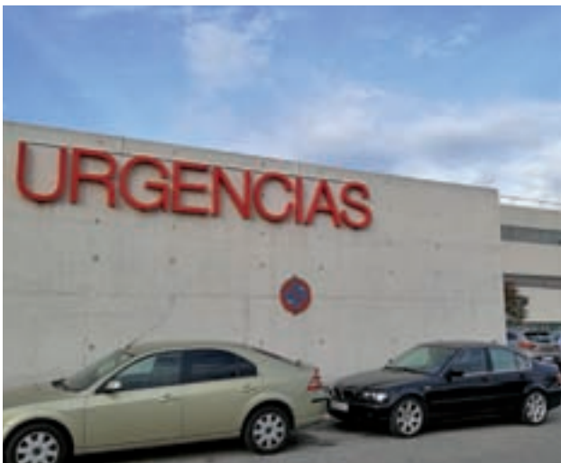
Hospital de Fuenlabrada

Según la Consejería de Sanidad también son esperanzadores los resultados obtenidos con el cáncer de ovario. Tras más de 100 intervenciones realizadas en el Hospital a más de 90 mujeres con cáncer de ovario en fase avanzada, la supervivencia alcanzada llega a los seis años