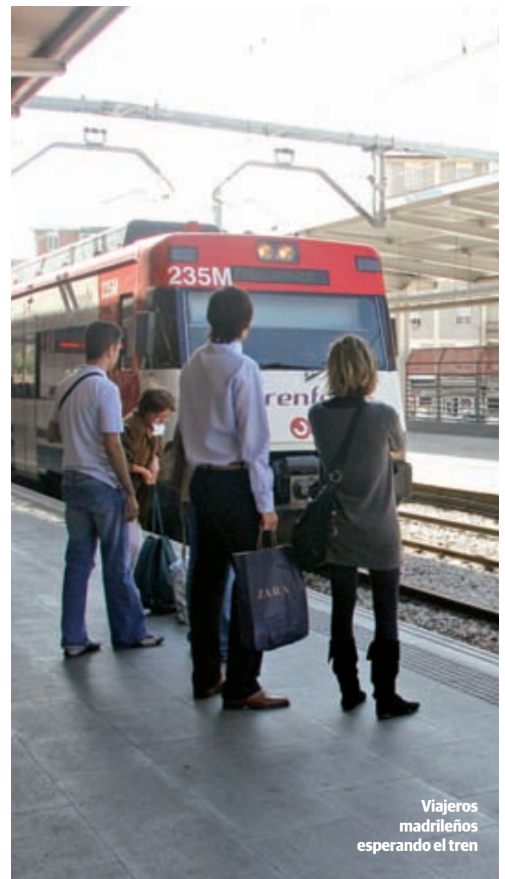
Viajeros madrileños esperando el tren

prejubilar y "no se hicieron contrataciones a tiempo y se eliminaron trenes." "El PP no apuesta por el transporte público y es la raíz de los males. Lo que han hecho es limitar trenes en horas punta y esto es muy grave. Dice mucho del poco interés del Ministerio de Fomento", concluyó.