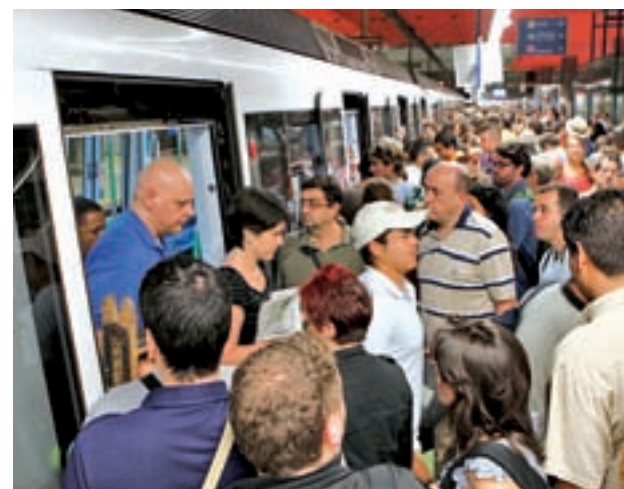
El Metro tendrá nuevos paros en 2018

Los maquinistas aseguran en un comunicado que han hecho "todo lo que ha estado en su mano" para poner fin al "conflicto" antes de que estos días puedan perjudicar a todos los viajeros en este mes caracterizado por un aumento de turistas en la capital derivados de los días festivos y navidades.