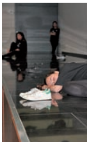
Representación de teatro

Los seis vídeos seleccionados entre un total de 57 cortos realizados por los escolares del municipio se han