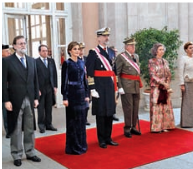
Tradicional ceremonia: El presidente del Gobierno, Mariano Rajoy, acompañó a los Reyes Felipe y Letizia y a los eméritos Don Juan Carlos y Doña Sofía. Asimismo, estuvieron presentes en el acto los ministros María Dolores de Cospedal y Juan Ignacio Zoido.

Constitución Española (6 de diciembre) y los 50 años del Rey Felipe VI (30 de enero). Fue precisamente al día siguiente cuando se inauguraba la agenda oficial de la Casa Real con la tradicional Pascua Militar en el Palacio Real, presidida por los Reyes Felipe y Letizia y a la que acudían Don Juan Carlos y su esposa Doña Sofía por primera vez desde la abdicación del ex