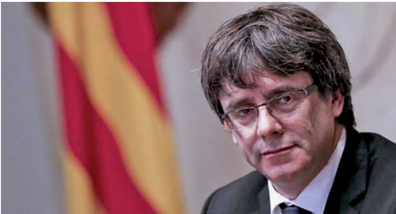
Puigdemont mantiene su apuesta para presidir la Generalitat