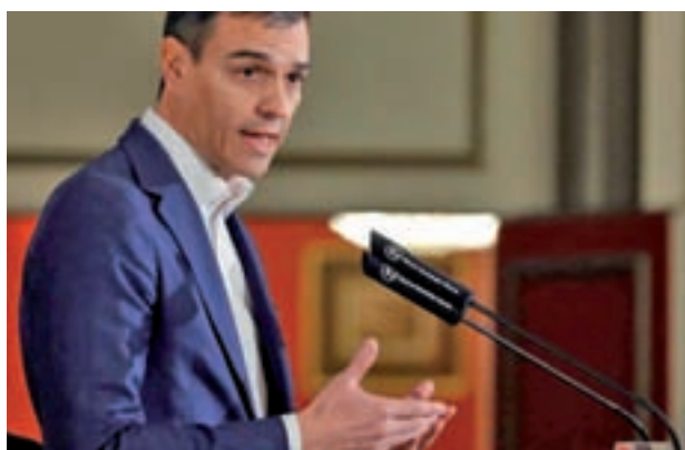
Los socialistas estiman recaudaciones de 2.745 euros al año

Así lo anunció el pasado martes el secretario general del partido, Pedro Sánchez, en un desayuno informativo organizado por el foro de la Nueva Economía. El líder socialista considera "justo" que la banca ayude a financiar las