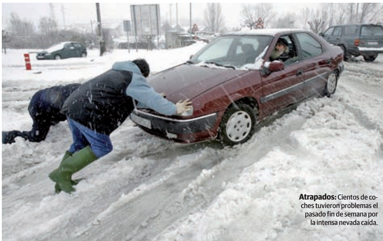
Atrapados: Cientos de coches tuvieron problemas el pasado fin de semana por la intensa nevada caída.

Es conveniente ser consciente de las especificaciones técnicas del vehículo y estar preparados para atender una situación de riesgo. Si el desplazamiento es inevitable, y el neumático no es de invierno, es importante viajar con cadenas.