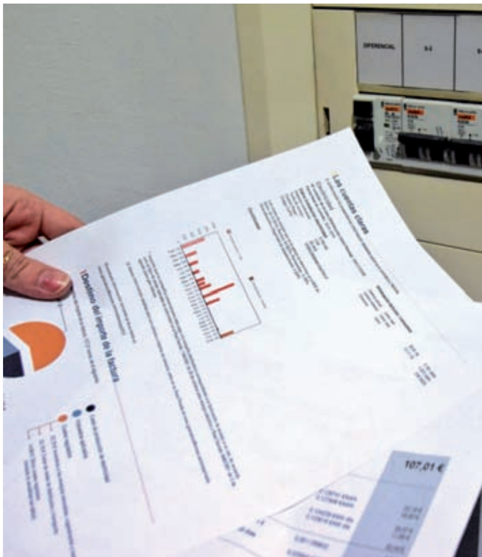
El precio del recibo de la luz es una de las grandes preocupaciones

Los combustibles subirán sus precios de forma generalizada por las materias primas ● El tren de Cercanías se congela, mientras que la electricidad dependerá del mercado