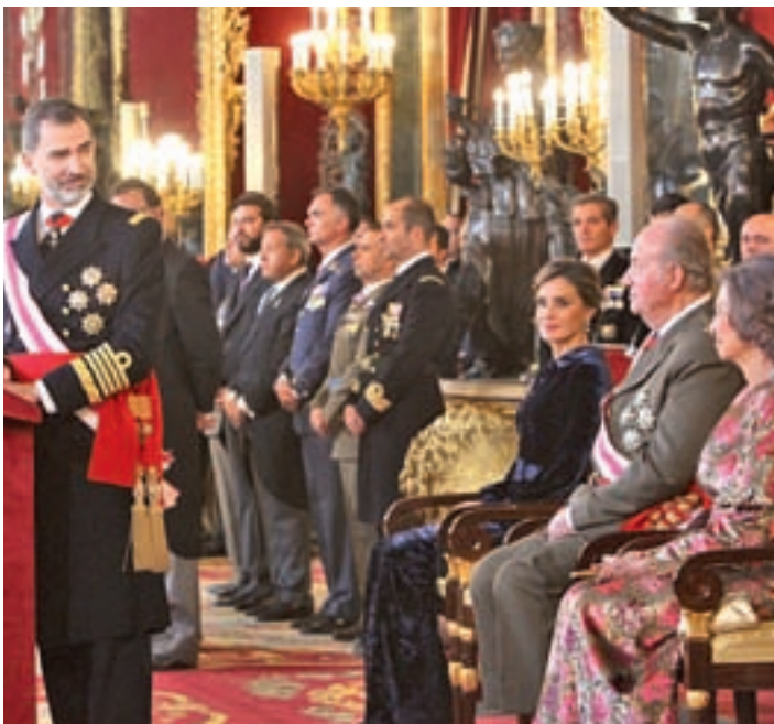
Felipe VI agradeció a Don Juan Carlos su ejemplo de reinado