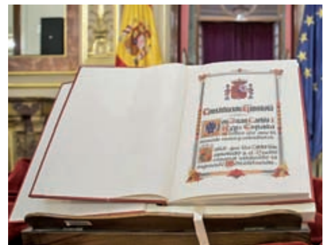
El 6 de diciembre se cumplen 40 años de la Constitución

Además, el Consejo Asesor informó de la intención de organizar un Congreso Académico Internacional en el Senado sobre constitucionalismo, al que acudirían figuras nacionales e internacionales, así como un Congreso sobre la Transición española, que contaría con dirigentes políticos "de prestigio".