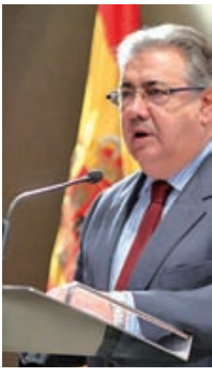
Juan Ignacio Zoido