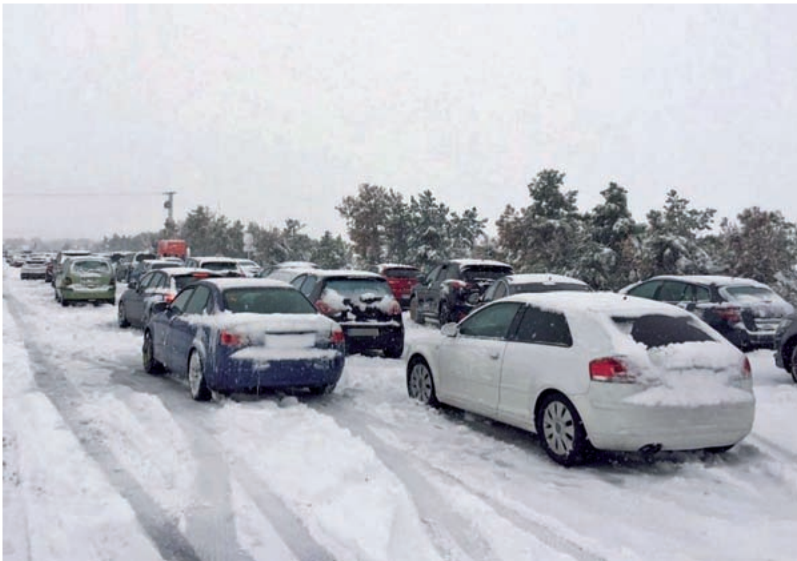
Situación de la AP-6 el pasado fin de semana

Ante las previsiones de nuevas nevadas para este fin de semana, GENTE facilita algunos consejos imprescindibles para que ponerse al volante no sea una odisea • Fomento estudiará pedir a la concesionaria de la AP-6 que se haga cargo de los gastos ocasionados en la vía