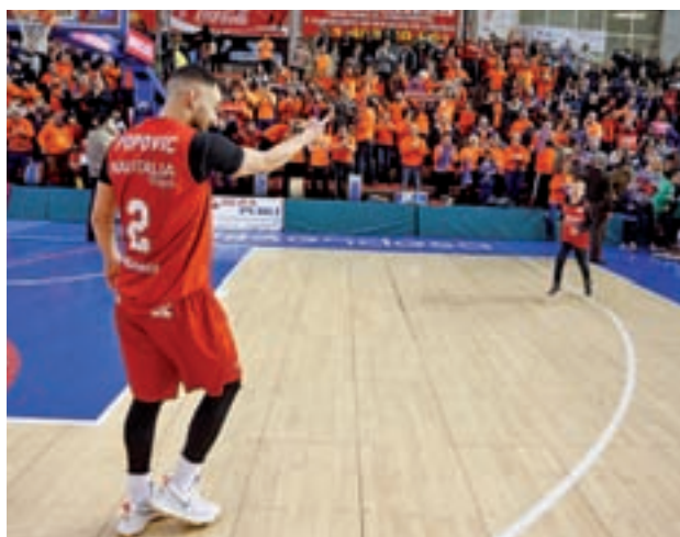
El Montakit Fuenlabrada, la gran revelación

Madrid, el FC Barcelona Lassa y el Montakit Fuenlabrada han asegurado su presencia, mientras que para las otras cinco plazas hay hasta ocho aspirantes. Este fin de semana hay varios duelos directos: Iberostar-Baskonia, Estudiantes-Andorra y Obradoiro-Delteco GBC.