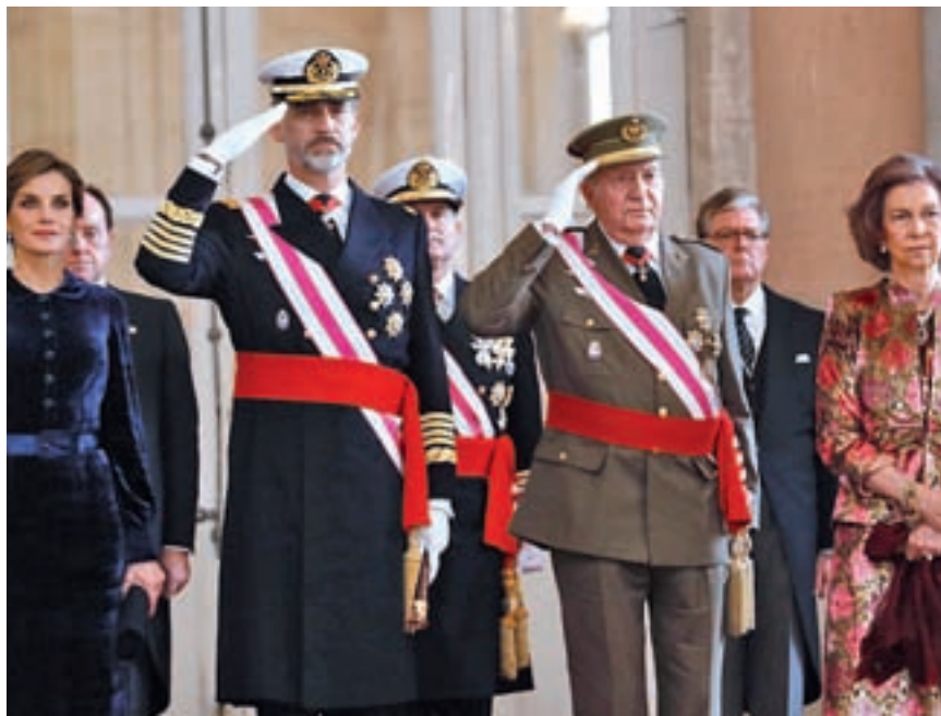
Los Reyes y los eméritos presidieron la Pascua Militar

EL ANIVERSARIO DEL REY EMÉRITO SE CONVIERTE EN CLAVE PARA LOS ACTOS DEL 2018