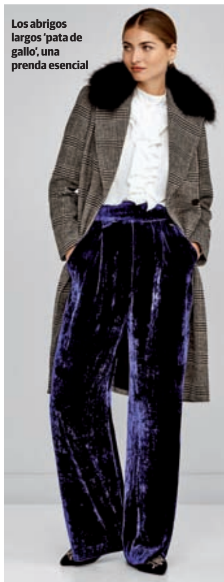
Los abrigos largos 'pata de gallo', una prenda esencial