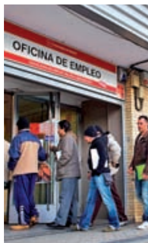
El paro, primer problema

bre, según el barómetro del Centro de Investigaciones Sociológicas (CIS) correspondiente a ese mes. La encuesta también refleja un incremento de la preocupación por la clase política, que vuelve a figurar en la tercera pla-