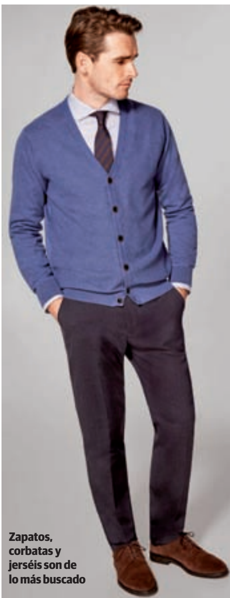
Zapatos, corbatas y jerséis son de lo más buscado