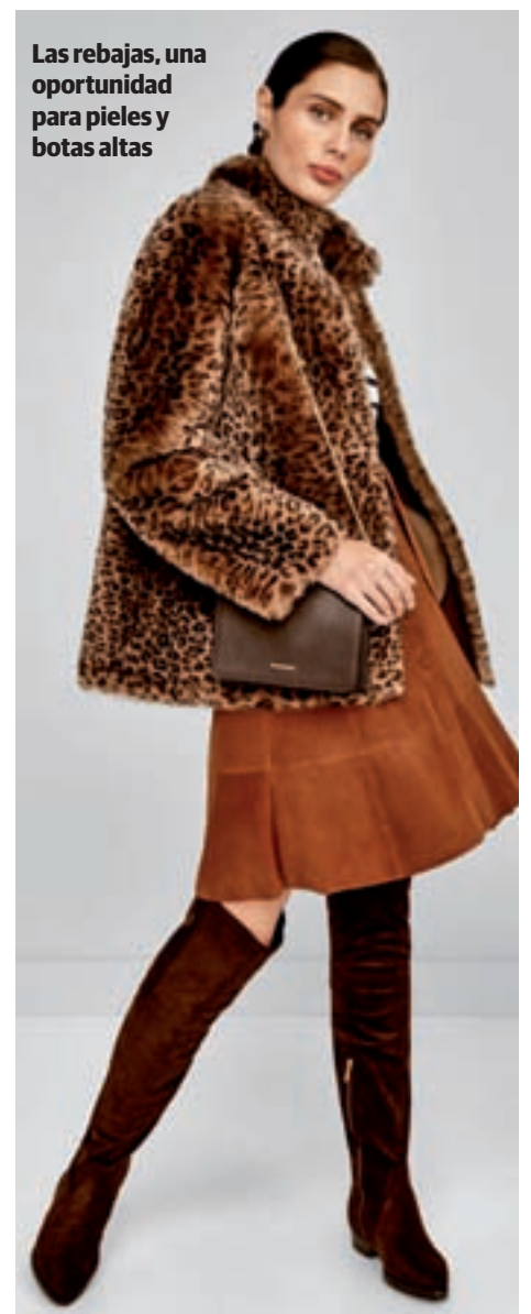
Las rebajas, una oportunidad para pieles y botas altas