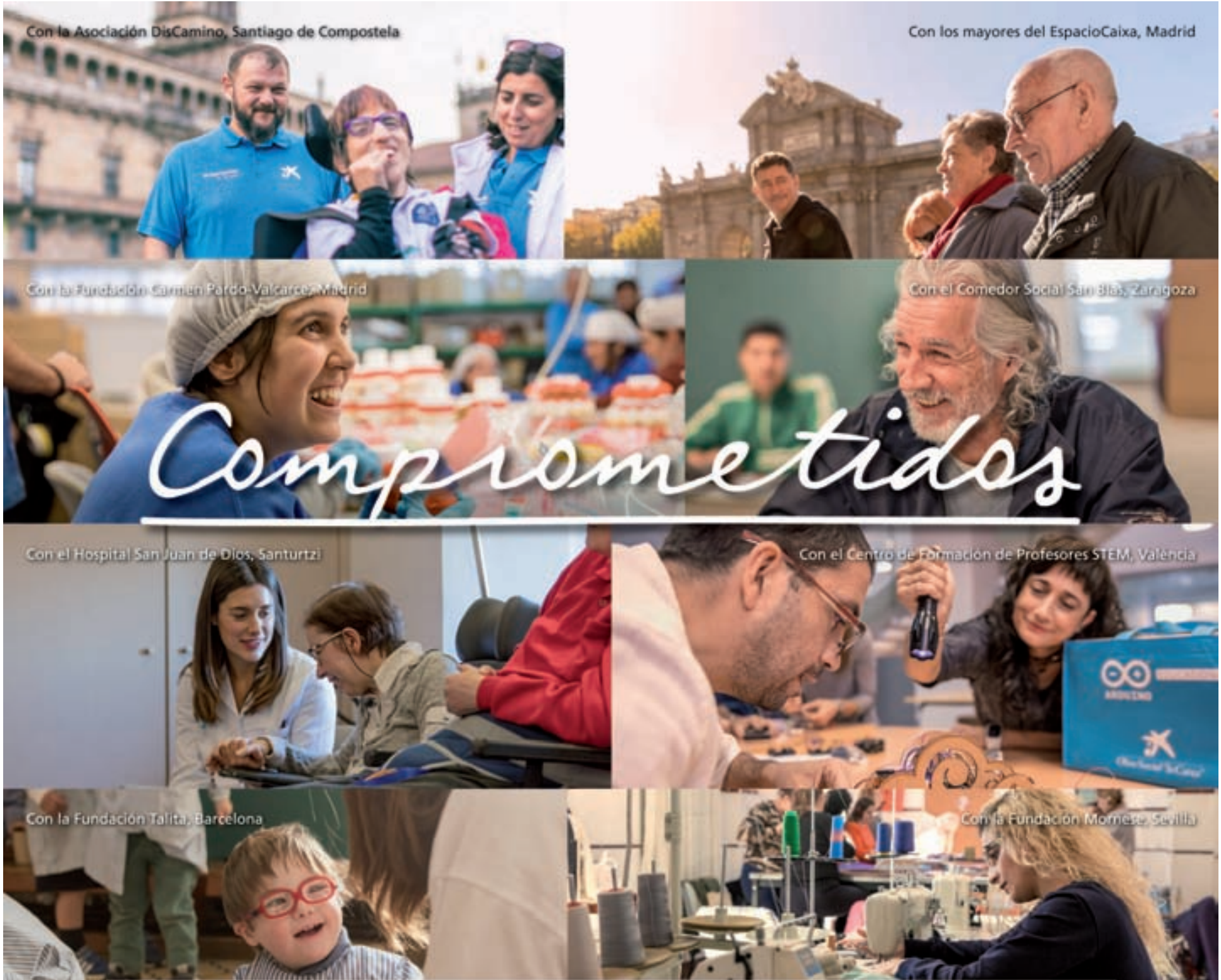
Con la Asociación DisCamino, Santiago de Compostela