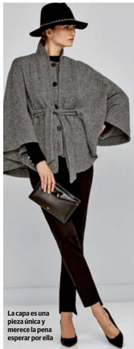
La capa es una pieza única y merece la pena esperar por ella