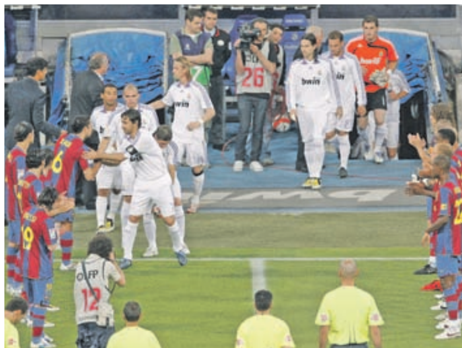
Los azulgranas lo hicieron en el Bernabéu en la temporada 2007-2008