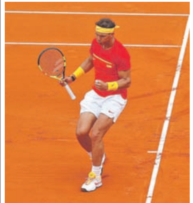
Nadal se reencontró con la tierra batida en Valencia

Algunos de los principales rivales que tendrán en el cuadro son otros miembros del 'Top-10', como Marin Cilic, Grigor Dimitrov y Alexander Zverev; así como el serbio Novak Djokovic o el japonés Kei Nishikori.