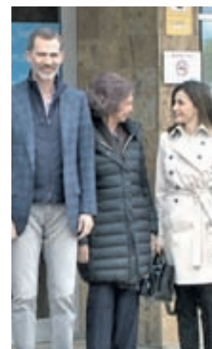
Los Reyes, a su llegada

lo que pasó a planta al día siguiente tras permanecer unas 24 horas en la UCI. Los reyes Felipe y Letizia acudieron dos veces al Hospital Sanitas de La Moraleja para visitar al monarca. En la segunda ocasión, fueron acompañados