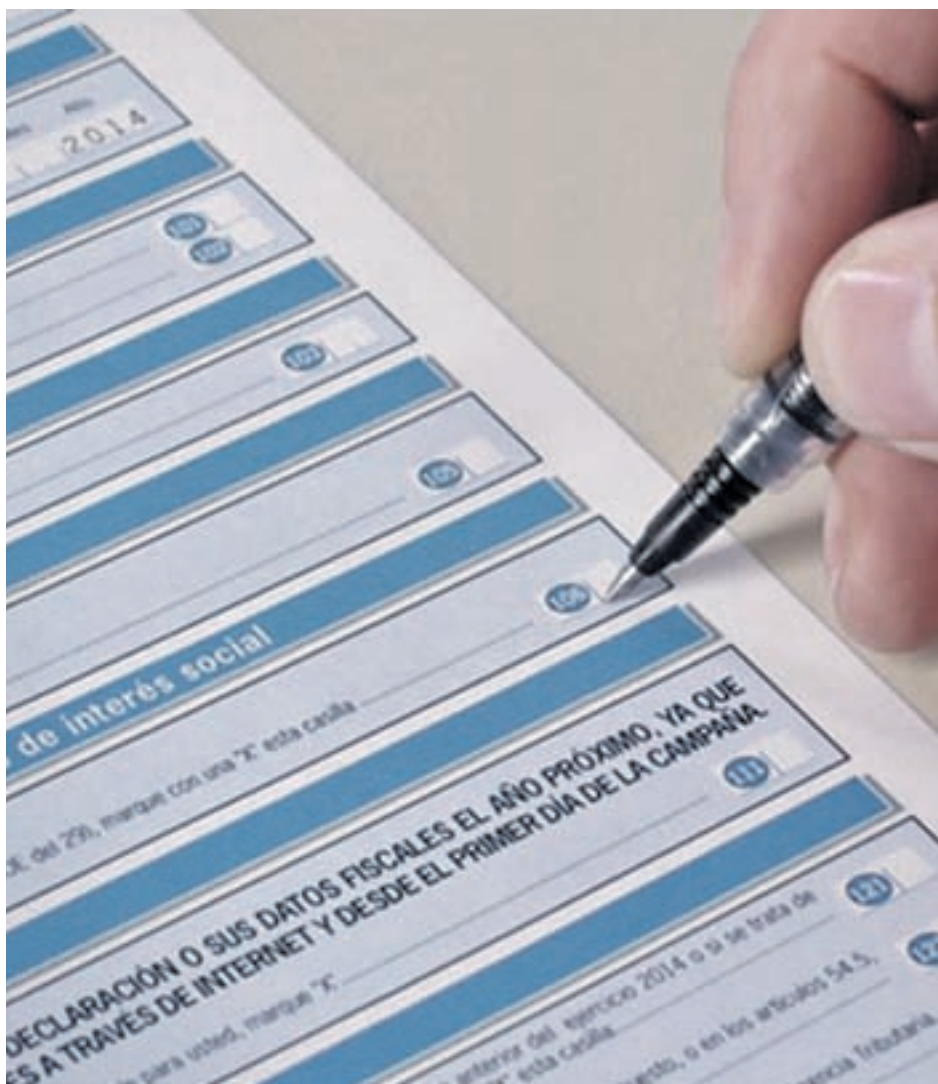
Los contribuyentes pueden optar por la 'X Solidaria' o la Iglesia

En 2016, el 77'72% de lo recaudado se destinó a Acción