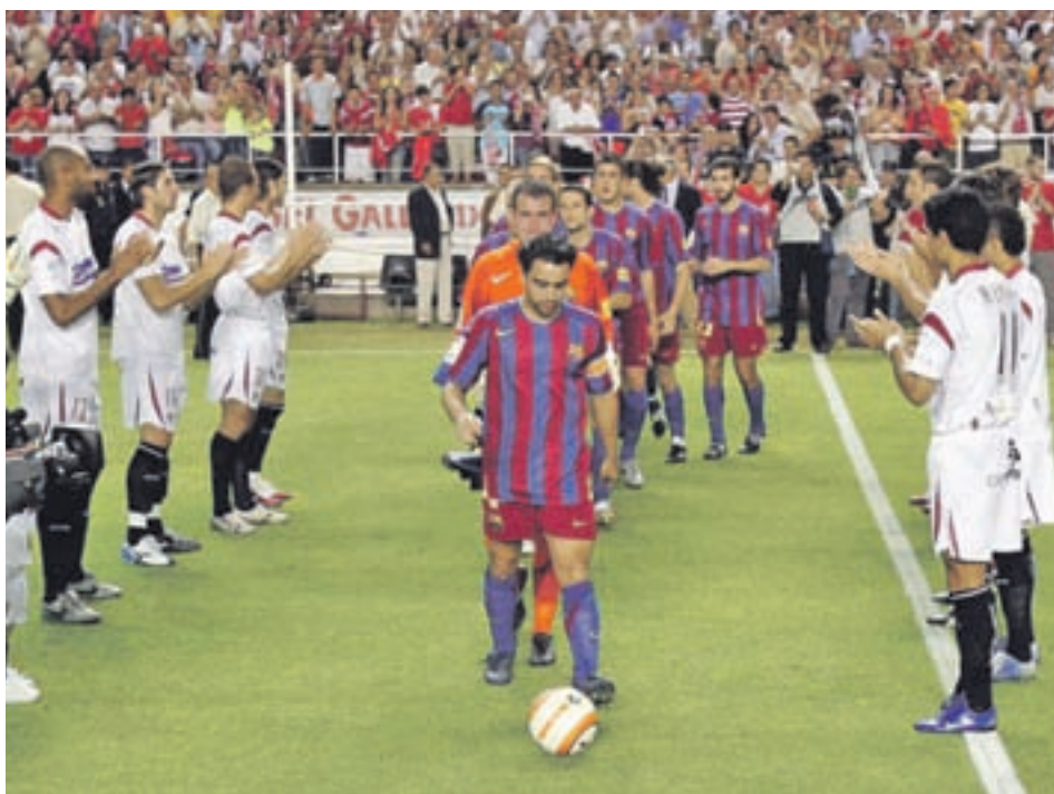
El Sevilla, recibiendo al Barcelona en 2006 como campeón de Liga