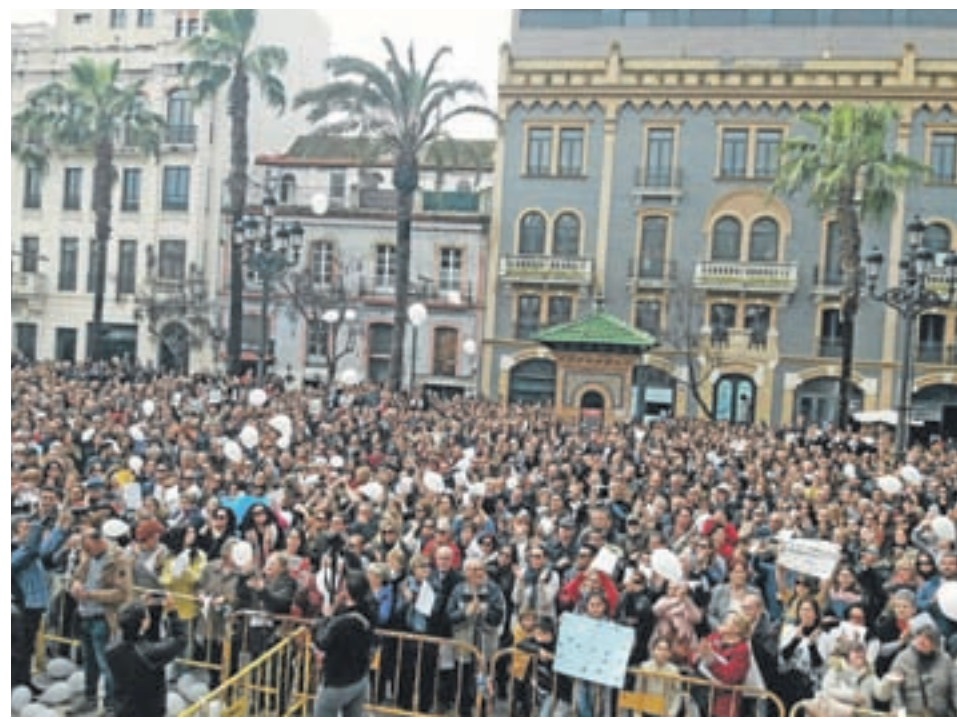
Manifestación del pasado 18 de marzo en Huelva