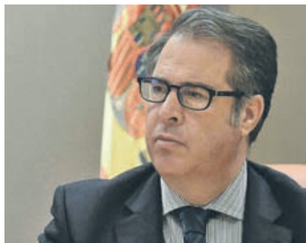
Gregorio Serrano, director general de la DGT

Serrano indicó que una de las normas de tráfico que los conductores incumplen más es precisamente el respeto al límite de velocidad porque "muchas veces no hay coherencia entre la velocidad y el