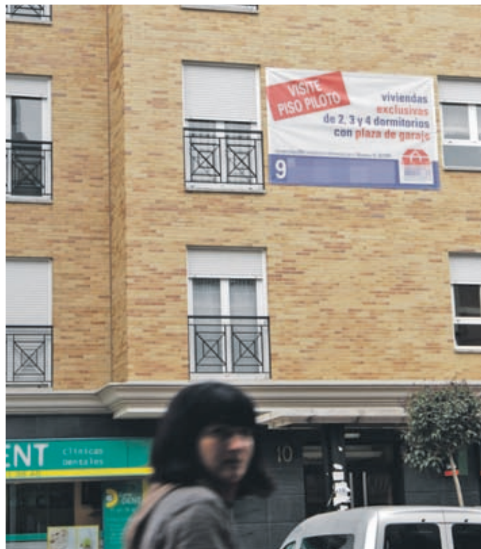
Pisos en venta en Madrid GENTE

Barcelona ha retomado la senda de crecimiento de precios en el primer trimestre, tras la caída registrada en la recta final de 2017 por la situación política, aunque no ha recuperado todavía el nivel que alcanzó dos trimestres atrás. "En estas circunstancias, la principal amenaza sobre el mercado de vivienda en Barcelona reside en el potencial deterioro económico