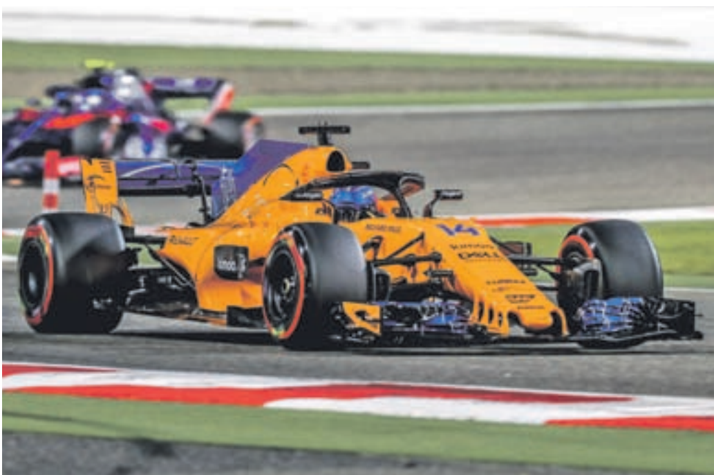
Alonso volvió a sumar puntos en Bahrein