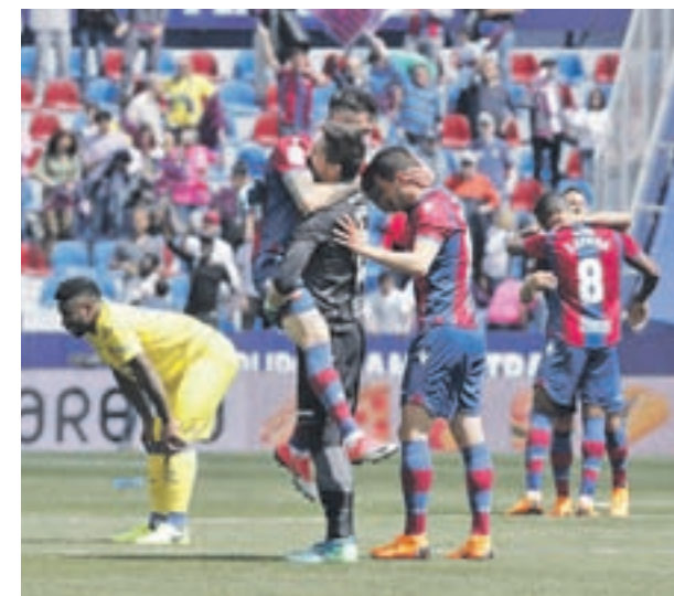
Levante y Las Palmas, cara y cruz LALIGA.ES

séptima posición otorgue el interesante premio de disputar el próximo curso la Europa League. Por su condición de finalista de la Copa del Rey, si el equipo que dirige Vincenzo Montella acaba la Liga en quinta o sexta plaza activaría de forma automática un nuevo billete para el segundo torneo continental, alimentando las esperanzas de clubes más modestos como el Girona, el Celta e incluso el Eibar (que está ahora mismo a seis puntos de la séptima posición).