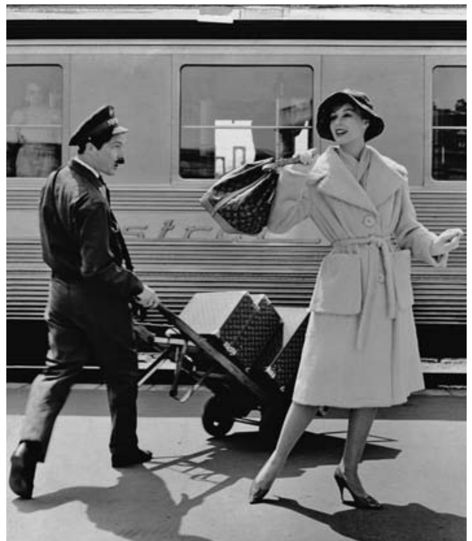
Los baúles y los bolsos, piezas icónicas de la firma francesa

Historia de una firma Desde los comienzos de su historia, Louis Vuitton se ha definido siempre por un espíritu pionero, con lejanos horizontes como destino favorito. Así, para celebrar la presencia de Louis Vuitton en España desde hace más de 30 años, se ha elegido Madrid para albergar dicha exposición. Al igual que Louis Vuitton, la ciudad de Madrid representa los valores de tradición e historia, mientras continúa mirando al futuro. Por eso, 'Time Capsule' es el escenario ideal para reunir esos grandes principios de viaje e innovación de Louis Vuitton.