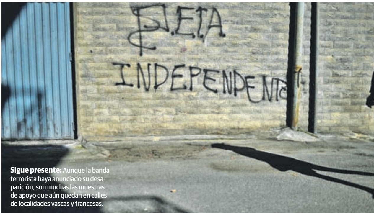
Sigue presente: Aunque la banda terrorista haya anunciado su desaparición, son muchas las muestras de apoyo que aún quedan en calles de localidades vascas y francesas.