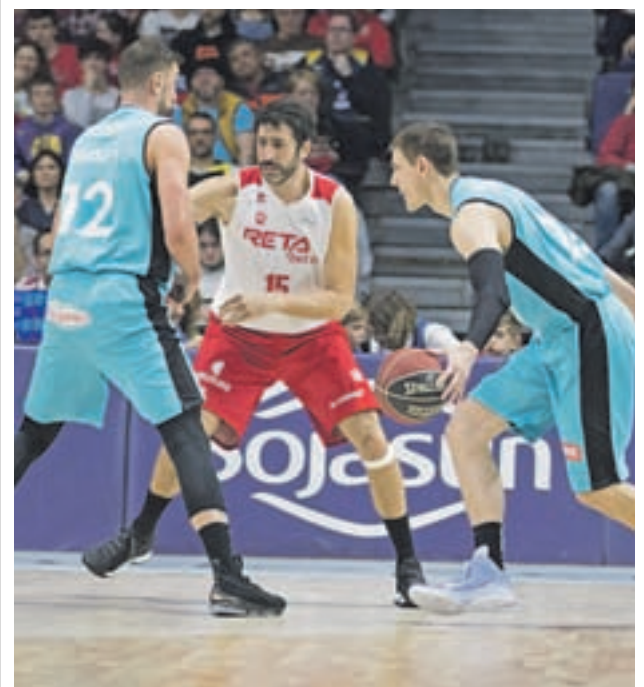
Situación crucial para Mumburú y el Bilbao Basket ESTUDIANTES

Haciendo mucho menos ruido, pero con unos grandes resultados, el otro español que está en la parrilla, Carlos Sainz, llega a Barcelona con expectativas de estar de nuevo en la zona de puntos, aunque, al menos en su caso particular y en el de Renault en general, el gran talón de Aquiles parece estar en la clasificación del sábado.