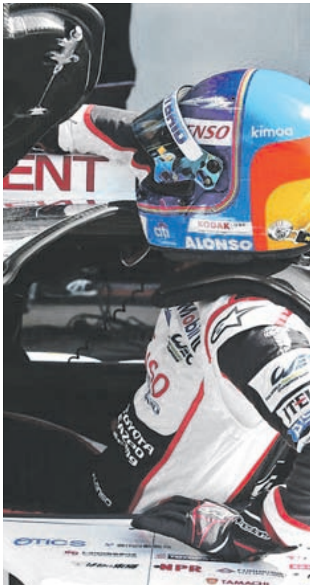
Alonso volvió a saborear la victoria en Spa

Casualidades del destino, el asturiano regresa al 'Gran Circo' este fin de semana en el mismo circuito, el de Montmeló, sin la vitola de favorito pero con la moral reforzada y el apoyo asegurado desde las gradas, todo con vistas a una carrera (domingo, 15:10 horas) en la que el rendimiento de su McLaren es un tanto incierto. "Todas las escuderías van a mejorar y hay que ser un poco más listos que los demás para que nuestro paquete sea un poco mejor", vaticinaba el propio Alonso semanas atrás tras el GP de Bakú, toda una declaración de intenciones que se confirmó con el hecho de que estuviese en Woking, la fábrica de McLaren, el pasado domingo, pocas horas después