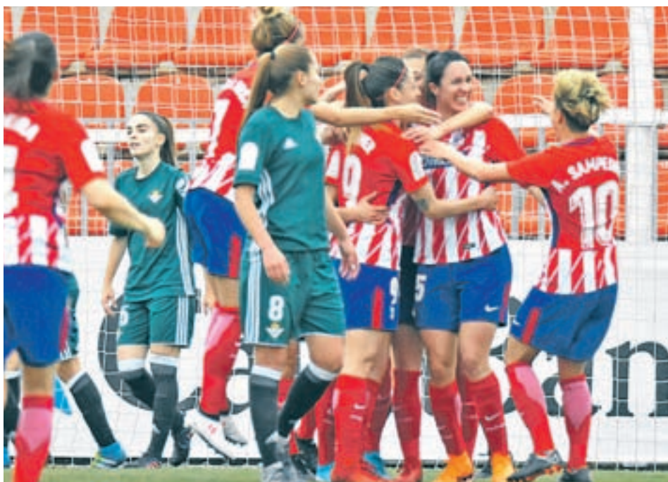
El Atlético depende de sí mismo: un triunfo le convertiría en campeón