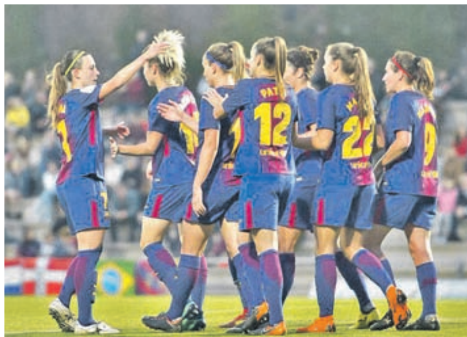
El Barça necesita ganar al Levante y esperar acontecimientos

FRANCISCO QUIRÓS SORIANO @franciscoquiros