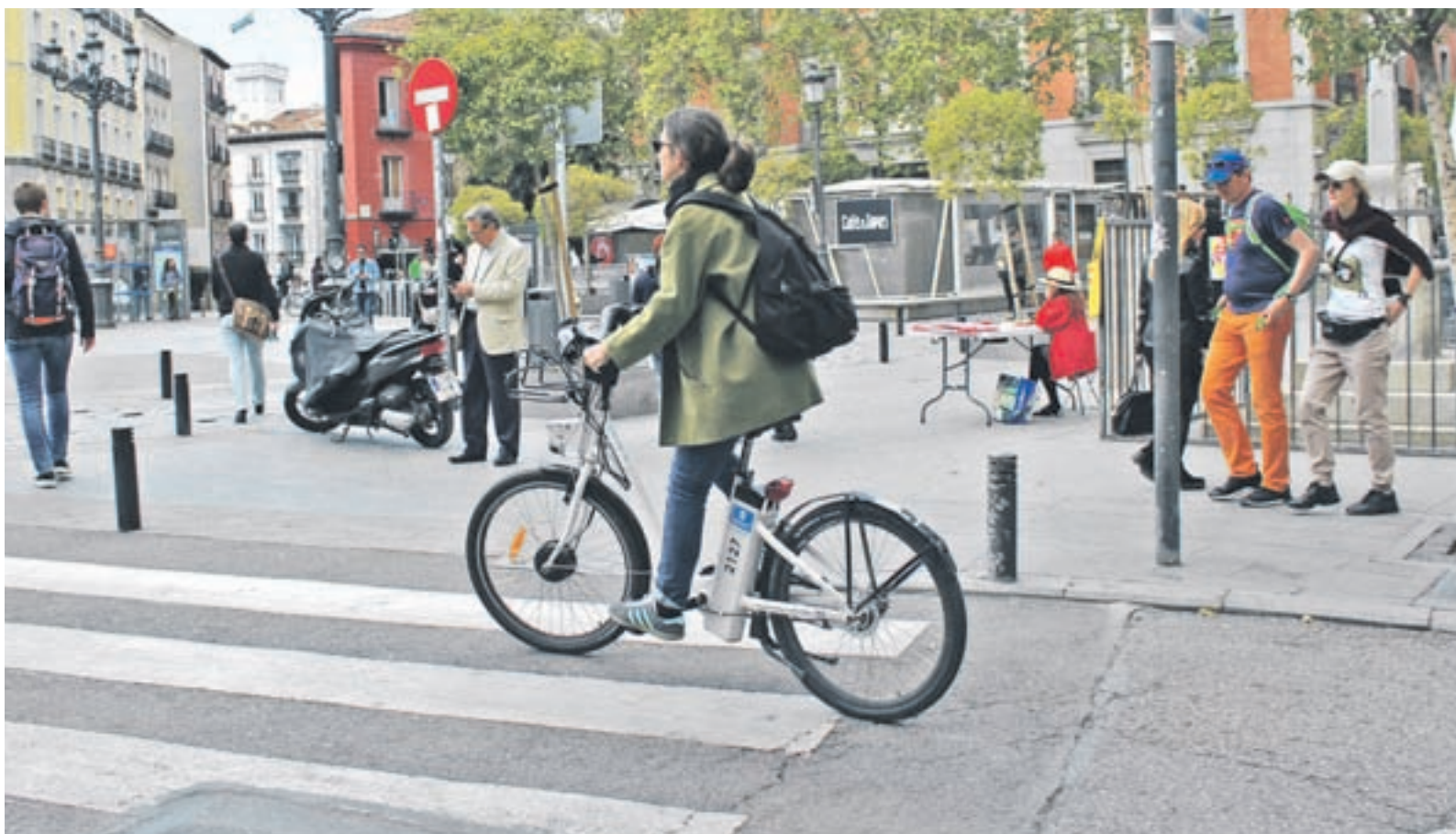
Ciclistas por las calles de Madrid