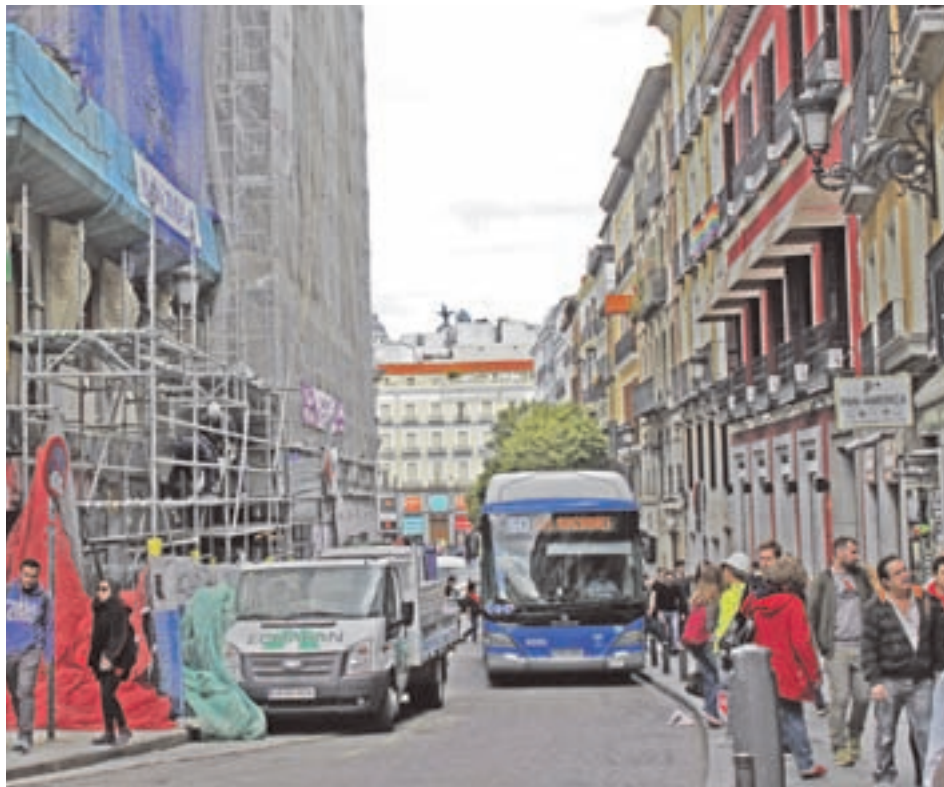
La calle se convierte en una de las mayores fuentes de ruido

Por su parte, la Organización Mundial de la Salud (OMS), revela que una exposición continuada a elevados niveles sonoros puede perjudicar la salud. De hecho, señala que los niveles de ruido ambiental recomendables