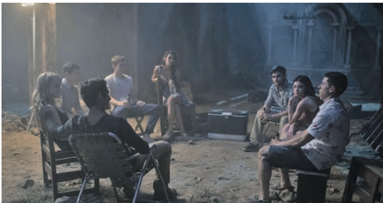
Fotograma de 'Verdad o reto'

El uso de los primeros planos o una fotografía sublime son algunos de los aciertos de una película que le debe buena parte de su éxito a las interpretaciones y caracterización de Shia LaBeouf y Sverrir Gudnason, quienes encarnan a McEnroe y Borg, respectivamente. Ellos son los encargados de personificar los conflictos y vicisitudes que tiene una estrella del deporte, sobre todo fuera de las pistas.