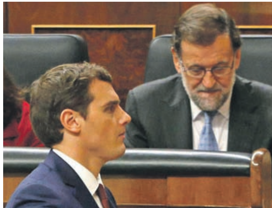
Albert Rivera pasa frente a Mariano Rajoy en el Congreso de los Diputados

El PP mantiene el primer puesto en intención de voto con el 24%, seguido muy de cerca por el partido de Albert Rivera, con 22,4% • El PSOE pasa al tercer lugar con un 22% de apoyos