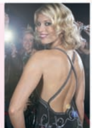
(La imagen representa a una afectada)

con el paso de los años: en los depósitos de colágeno de nuestra piel. Signasol los rellena y así consigue que la piel sea más elástica y se sienta claramente más tersa y tonificada. Aparte de los péptidos de colágeno, Signasol contiene BioPerine*. Este biocatalizador se encarga de que el cuerpo pueda absorber todos los valiosos ingredientes de la mejor manera.