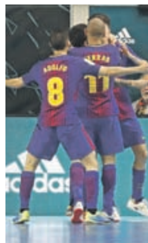
El Barça ganó la Copa del Rey

Precisamente el equipo madrileño llega en la misma situación, aunque en esta ocasión su rival será otro conjunto navarro, el Aspil Vidal Ribera. Completan el cuadro de cuartos los emparejamientos Palma Futsal-ElPozo Murcia, Osasuna-Jaén y Ríos Renovables-Barcelona.