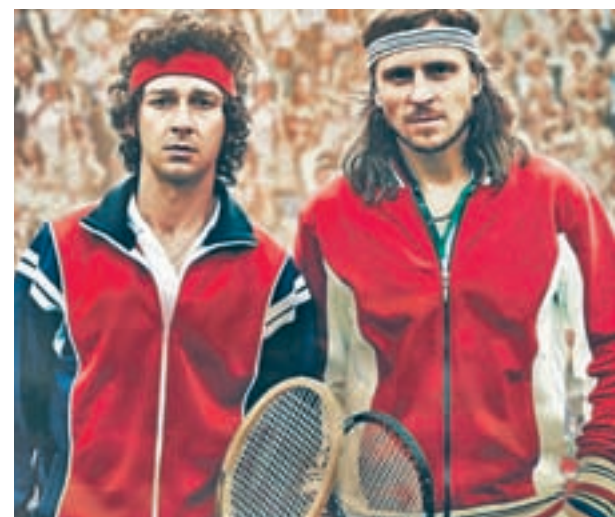
Shia LaBeouf y Sverrir Gudnason, los protagonistas

'Media hora y un epílogo' es el primer largometraje de Epigmenio Rodríguez, un director y novelista leonés que narra en menos de 90 minutos cómo en muy poco tiempo se puede construir un mundo, pero también acabar con él. El salto temporal es solo uno de los recursos que sumergen al espectador en esta gran historia.