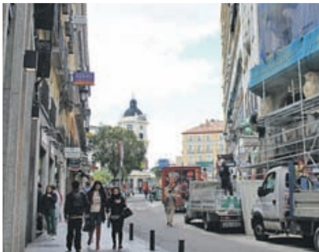
Las grandes ciudades se exponen al ruido IRENE CASANOVA / GENTE

Un informe desvela que los sonidos de los vecinos y el tráfico es lo que más molesta en nuestro país • La exposición a un alto nivel de decibelios podría llegar a afectar a la salud, según la OMS