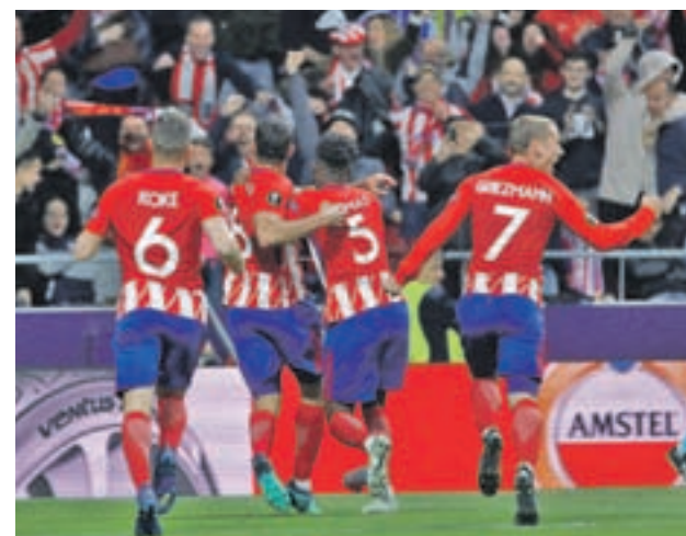
El Atlético llegó a la final tras eliminar al Arsenal

Lyon no es una ciudad que dejase un buen recuerdo en el cuadro colchonero, ya que en 1986 perdía la final de la Recopa con el Dinamo de Kiev por un contundente 3-0. Eso sí, aquel partido se disputó en el vetusto Gerland y no en el Parc OL donde tendrá lugar un encuentro que arrancará en horario Champions: a las 20:45.