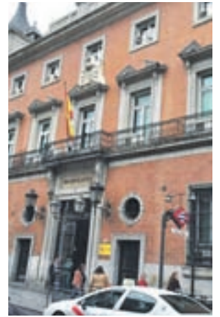
Ministerio de Justicia

En 2017 fueron condenadas 32.814 personas por ejercer alguno de estos dos tipos de violencia, lo que supone un 3,9% más que en 2016. De ellas, 30.460 fueron hombres y 2.354 mujeres. Por su parte, hubo 7.433 absueltas, un 2,9%