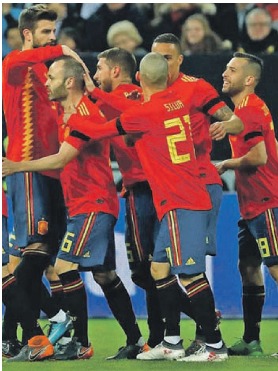
Nuevo amistoso para la selección de Julen Lopetegui

Corría el minuto 37 de la final de la Champions, cuando Dani Carvajal abandonaba el campo entre lágrimas. Las pruebas médicas confirmaron una lesión en su pierna derecha. El pasado lunes llegó a la concentración de la selección para iniciar el proceso de recuperación.