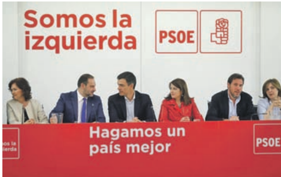
Pedro Sánchez, junto a la cúpula socialista

Como posición de partida, el PSOE cuenta con el res-