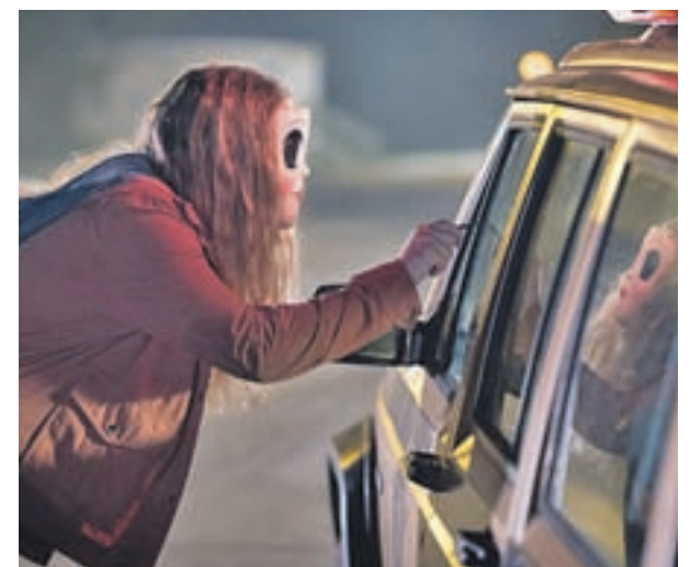
La angustia está presente en toda la película

El éxito en taquilla desbordó a las expectativas iniciales, pero lejos de poner