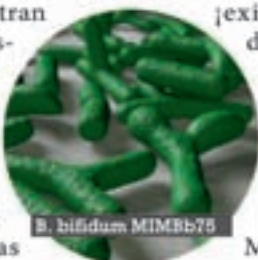
B. bifidum MIMBb75

ron. Aún más: los investigadores consiguieron demostrar que la calidad de vida de los pacientes mejoró sustancialmente.