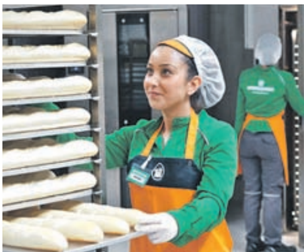
Hornera del almacén online 'Colmena' de Valencia