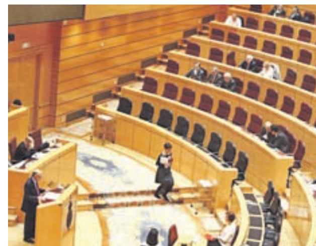
Las cuentas ya están en la Cámara Alta EUROPA PRESS

se desconoce si el PP aprovechará el trámite en el Senado para introducir algún cambio. Si no es así, y las cuentas no tienen que volver al Congreso, la Comisión de Presupuestos dedicará la semana siguiente, la del 11 al 15 de junio, a debatir las enmiendas parciales y a aprobar un dictamen para su debate y aprobación en el Pleno del 19 al 21. De ser así, entrarían en vigor a finales de ese mismo mes.