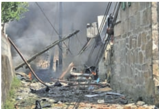
La explosión dejó dos muertos

En el sector femenino, las 33.394 que se inscribieron como víctimas de algún tipo de maltrato, 29.008 constan concretamente como víctimas de violencia de género con orden de protección o medidas cautelares.