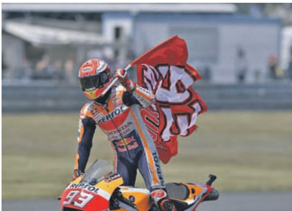
Márquez, celebrando su triunfo reciente en Le Mans