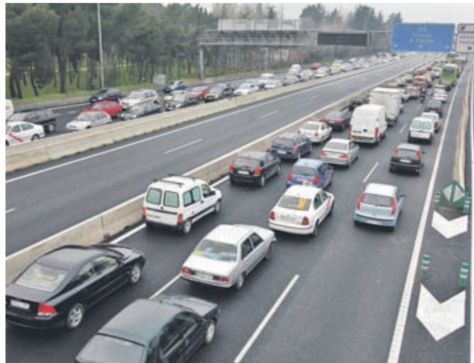
Los coches siguen estando muy presentes en la ciudades

Una encuesta de la OCU revela que el 70% de los conductores preferiría el transporte público si funcionara mejor • Más del 80% cree que hay que limitar los vehículos contaminantes