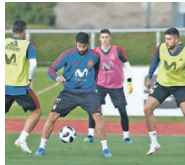
Sesión de entrenamiento de este lunes

Este viernes 1 habrá entrenamiento en sesión vespertina, antes de que el sábado Lopetegui y los suyos viajen hasta Villarreal, donde permanecerán hasta el domingo 3. El lunes 4 habrá un suave entrenamiento (12:30 horas), antes de dejar paso, ya el martes 5, a dos sesiones, una de ellas a puerta cerrada. El miércoles los internacionales tendrán día libre para desconectar antes del viaje a Rusia.