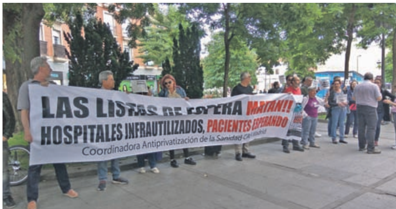
Una protesta por las listas de espera el pasado jueves en Madrid

Asimismo, vuelve a aumentar el porcentaje de pacientes que esperan más de 60 días, pasando de junio a diciembre del 40% al 44,3%