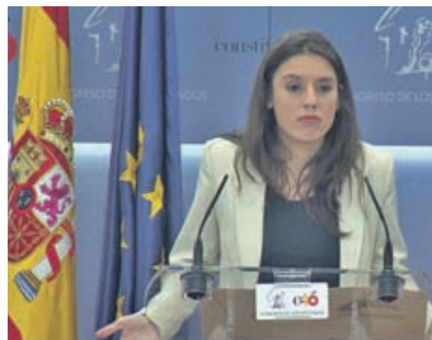
Irene Montero, en rueda de prensa

"La participación ha sido histórica, y el respaldo es el mayor que hemos obtenido", aseguró Montero el pasado lunes. Según la portavoz, los apoyos superan los que cosechó el equipo 'Podemos para todas' con el que Iglesias y ella compitieron en la Asamblea de Vistalegre II de febrero de 2017 para renovar la dirección estatal, cuando recibieron el 50,78% de los votos. En cuanto a los que sacó Iglesias para revalidar la Secretaría General, aseguró que son "iguales". Sin embargo, entonces Iglesias logró el 89%.