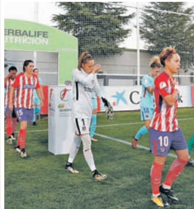
Las rojiblancas ganaron la Liga

En las dos temporadas precedentes ya se dio la misma final, con resultados dispares. Si en 2016 el Atlético levantaba el trofeo en la Ciudad del Fútbol de Las Rozas gracias a un triunfo por 3-2, el Barcelona se tomaba el año pasado a la revancha con un 4-1 inapelable en el mismo escenario.