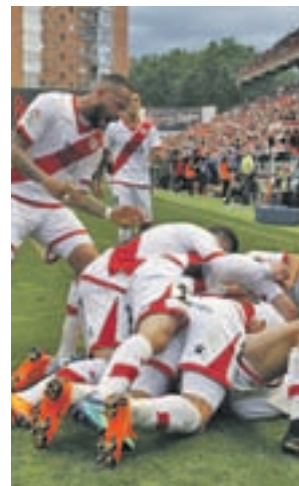
El Rayo ya es de Primera

En el primero de esos frentes destaca el choque Valladolid-Osasuna, del que saldrá, casi con toda probabilidad el acompañante de Sporting y Zaragoza en unas eliminatorias de ascenso que puede completar el Cádiz si gana en el campo del Granada.