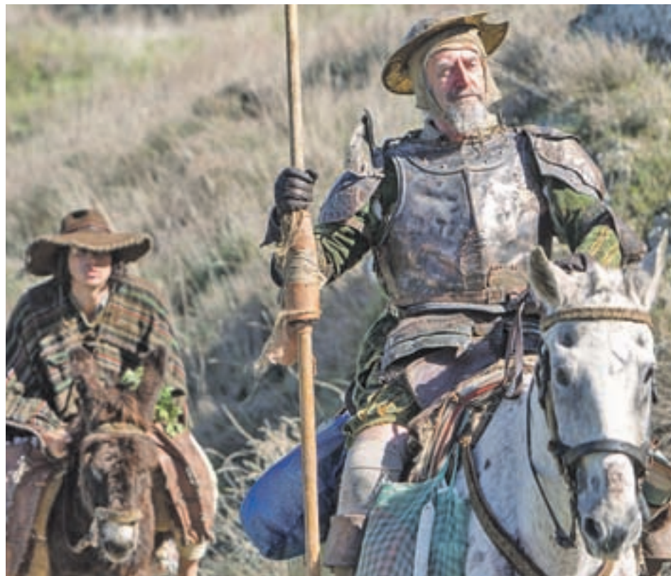
Jonathan Pryce da vida a un anciano convencido de ser Don Quijote

Todas estas vicisitudes hicieron que la expectación rodeara a la proyección de 'El hombre que mató a Don Quijote' en la última edición del Festival de Cannes, aunque las críticas no fueron nada benévolas con la obra de Gilliam. "Una espiral de locura que no logra arrastrar al espectador" o "es la obra de un artista en su momento más bajo" son algunos de los comentarios que generó.