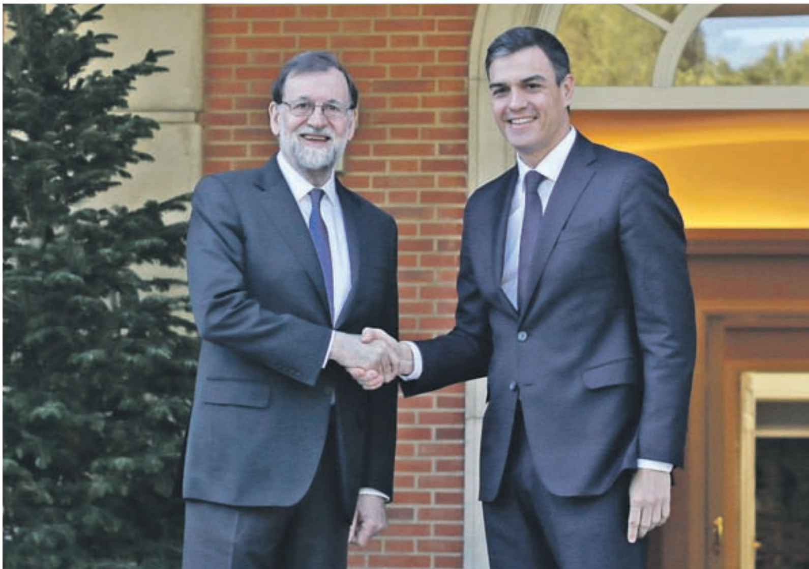
Mariano Rajoy durante su última reunión con Pedro Sánchez en La Moncloa

El presidente del Gobierno se enfrenta este viernes a la segunda moción de censura de la legislatura, a causa de la sentencia del caso Gürtel ● Con Pedro Sánchez como candidato, la fragmentación del Congreso complica su aprobación ● C's insiste en un adelanto electoral