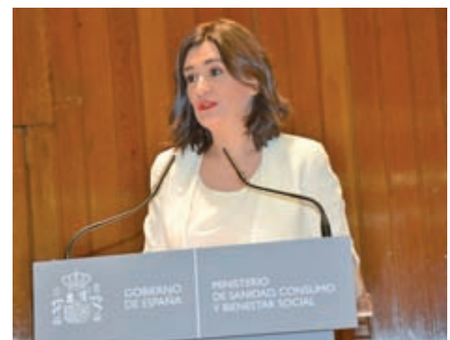
Carmen Montón, ministra de Sanidad

La decisión se produjo después de la reunión que la presidenta de la FELGTB, Uge Sangil, mantuvo con la ministra Carmen Montón.