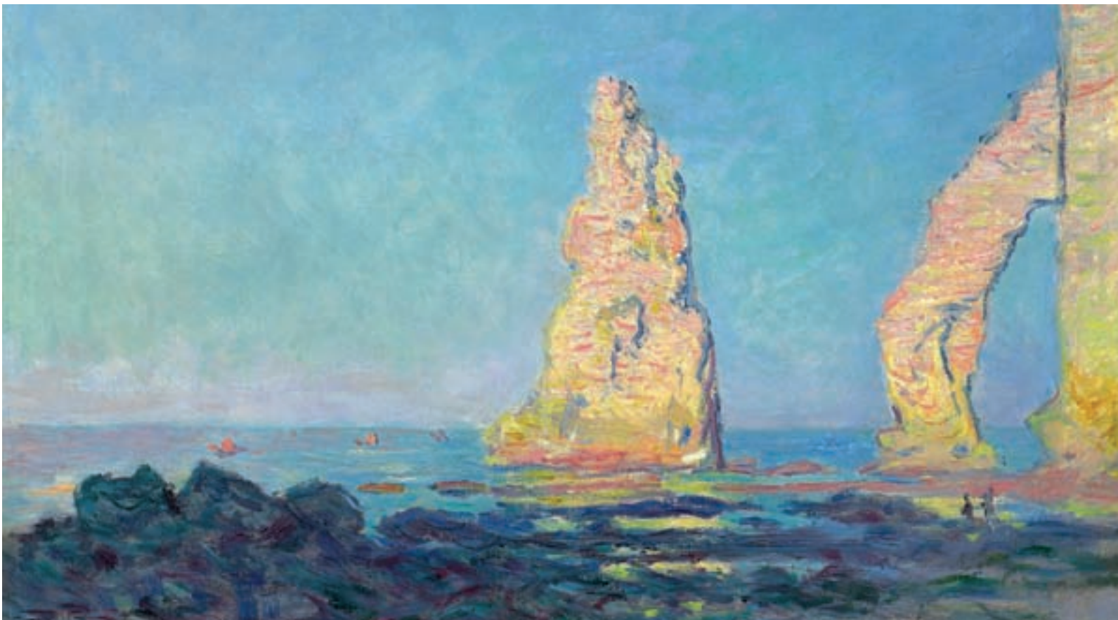
Las 'escenas de playa' fueron uno de los temas más recurrentes en sus pinturas MUSEO NACIONAL THYSSEN-BORNEMISZA