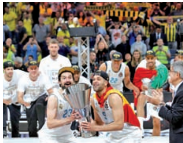
El Real Madrid parte entre los favoritos

Además del conjunto blanco, la Liga Endesa contará con otros tres representantes. Un habitual, el FC Barcelona Lassa, tendrá un debut complicado en la cancha del