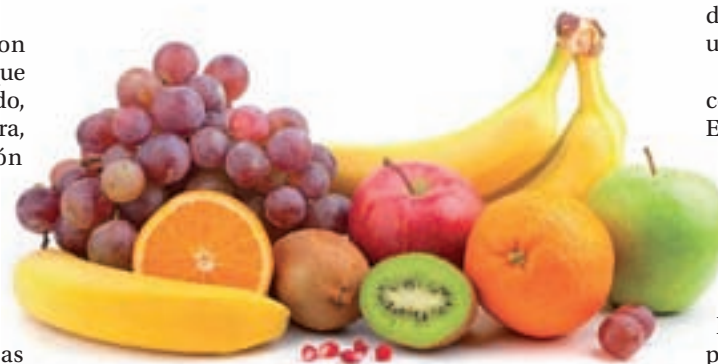
96,4 kilos de frutas: Es la cantidad consumida per cápita en cada uno de nuestros hogares durante al año pasado. La naranja es la favorita, seguida del plátano y la manzana.

españoles, solo superado por las categorías de alimentos preparados (18,6%), leche y lácteos (17,2%).