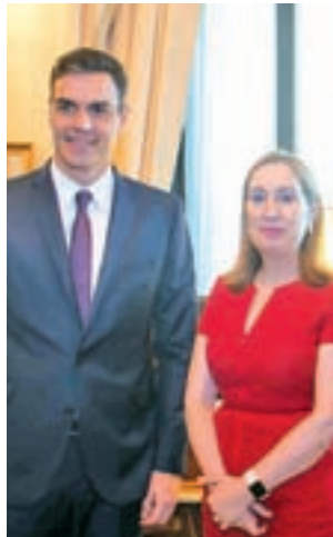
Encuentro entre ambos

En la programación destaca la celebración de un acto de carácter institucional en el Teatro Real el 26 de septiembre para conmemorar que durante casi una década las Cortes tuvieron allí su sede; la exposición conjunta 'El Poder del Arte', que