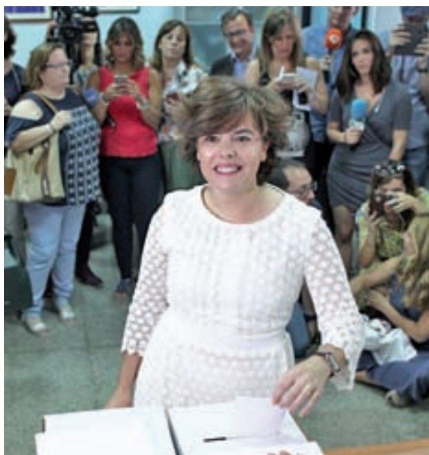
Soraya Sáenz de Santamaría

Además, la vicepresidenta socialista criticó que el anterior Gobierno de Mariano Rajoy "no dejó determinados" dónde estaban los 120 millones de euros "que faltaban" en los Presupuestos Generales del Estado para cumplir el Plazo contra la Violencia de Género.