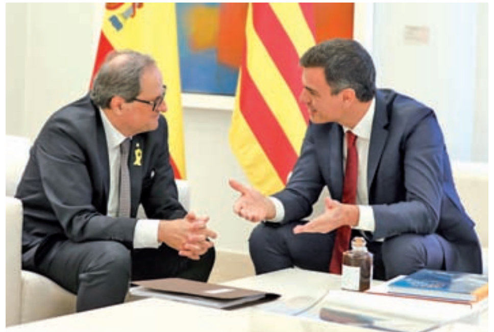
Pedro Sánchez y Quim Torra, durante su encuentro el pasado lunes en Moncloa

El primero de los acuerdos tiene que ver precisamente con la reactivación de las comisiones bilaterales, la Generalitat-Estado; la Mixta de Asuntos Económicos y Fiscales Estado-Generalitat; la Bilateral de Infraestructuras, y la