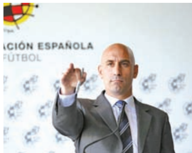
Rubiales, durante su comparecencia del lunes

La propuesta parece no contentar al Sevilla. El subcampeón de Copa, a través de su presidente, José Castro, valo-