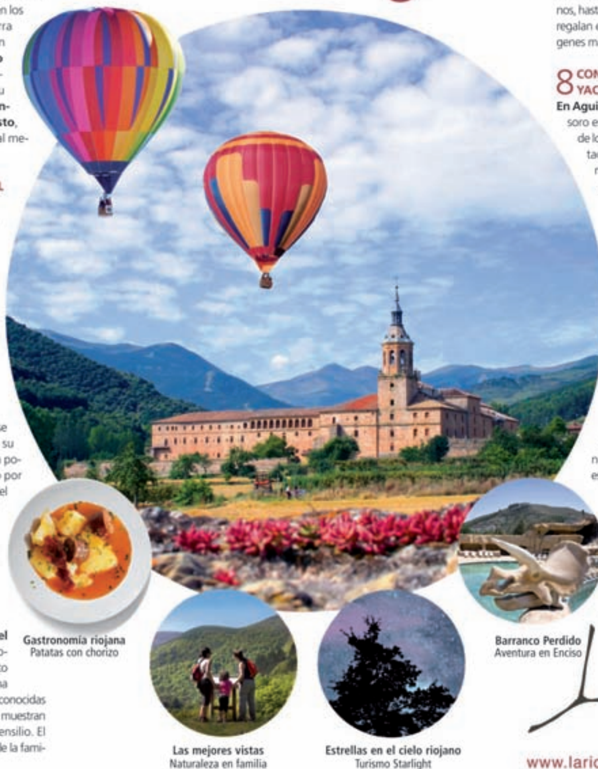
Gastronomía riojana Patatas con chorizo

En los Cameros, la villa de Ortigosa nos permite asomarnos a un enclave espectacular, el macizo del Encineto desde el que se divisa un monte poblado de encinas formadas en el período jurásico . En sus entrañas guarda un maravilloso espectáculo obra de la naturaleza: una cantera que dejó de explotarse hace casi cincuenta años. En su interior, y gracias al efecto del agua, se ha formado un conjunto de columnas y estalactitas que las han convertido en unas cuevas de visita obligada.