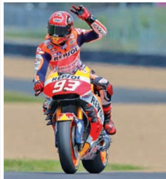
Marc Márquez lidera el Mundial