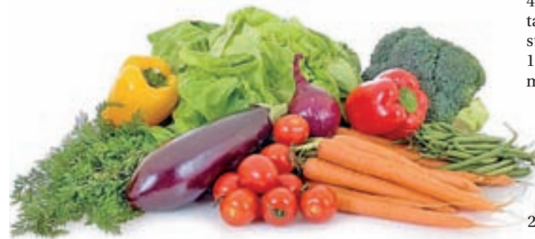
101,2 kilos de hortalizas: Es la cantidad consumida por persona dentro del hogar durante el año 2017. El aumento medio del precio fue de 4,9%.

los españoles y cómo son nuestros hábitos cada vez que acudimos al supermercado, el Ministerio de Agricultura, Pesca y Alimentación (MAPA) ha publicado el Informe del Consumo de Alimentación en España 2017, donde el primer dato que salta a la vista es que las frutas (14,6%) y verduras frescas (12,1%) pierden importancia en nuestra dieta, aunque su consumo sigue siendo muy importante en los hogares