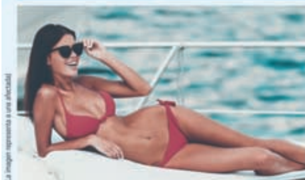
La imagen representa a una afectada

Su piel es tersa y las arrugas no son motivo de preocupación para ellas, pero... ¿Cómo lo hacen las estrellas en realidad? ¡Con colágeno para beber! La nueva tendencia de belleza ha llegado también aquí desde EE. UU. con Signasol (disponible en farmacias).