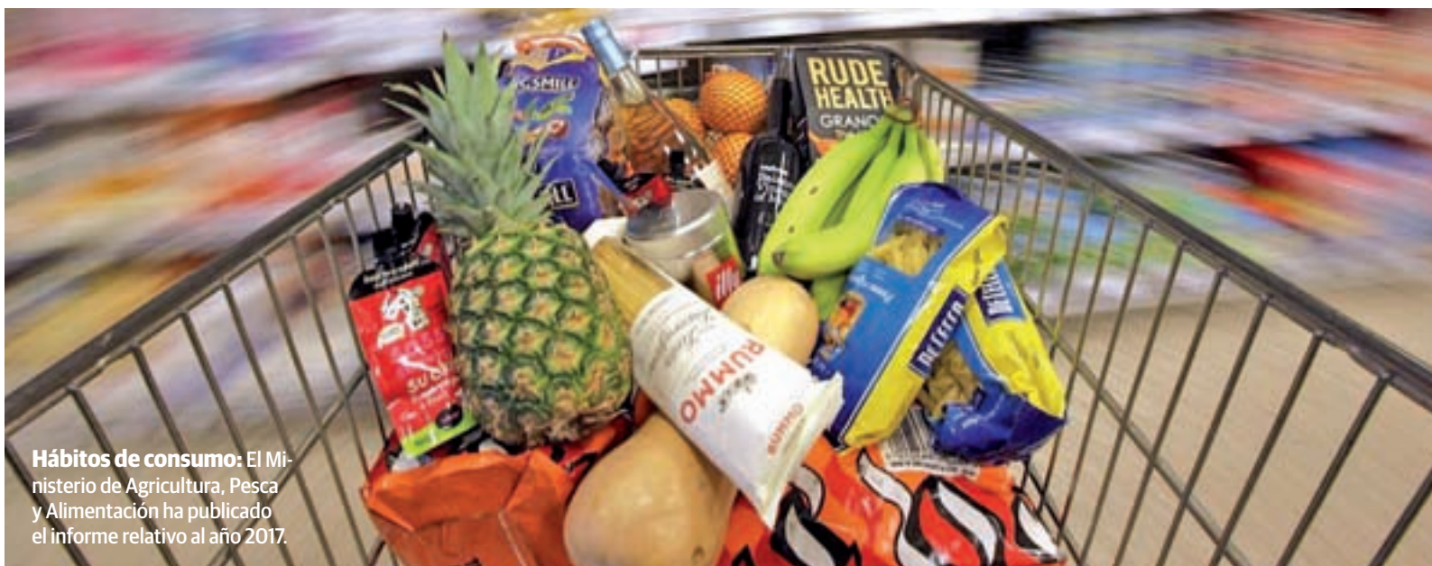
Hábitos de consumo: El Ministerio de Agricultura, Pesca y Alimentación ha publicado el informe relativo al año 2017.