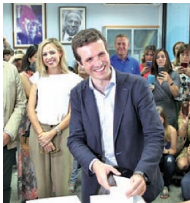
Pablo Casado