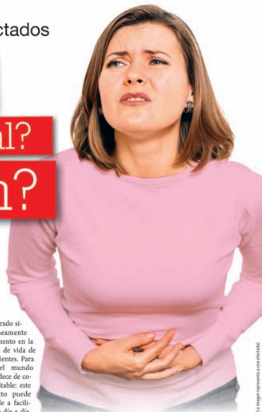
La imagen representa a una afectada