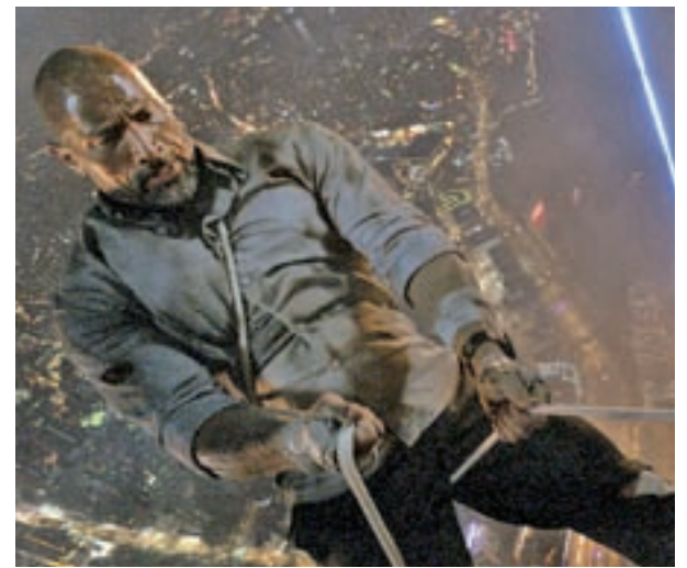
Dwayne Johnson, el protagonista