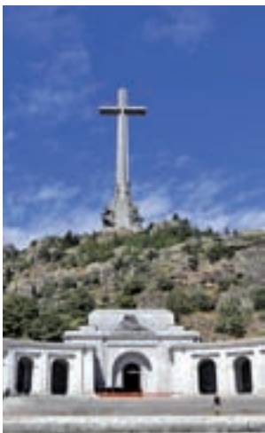
Valle de los Caídos