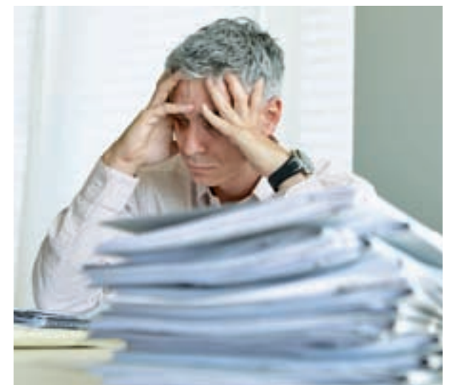
El estrés impacta sobre la salud

Por ello, es recomendable tomar medidas para atajar las situaciones de estrés, así como identificar ante que tipo nos encontramos. La Asociación Americana de Psicología clasifica esta patología en aguda, cuando aparece fruto de presiones puntuales y es sencilla de manejar; el agudo episódico, cuando se sufre con frecuencia y se necesita ayuda profesional; y el crónico, cuando el paciente no encuentra solución a una situación deprimente y no identifica que padece estrés.