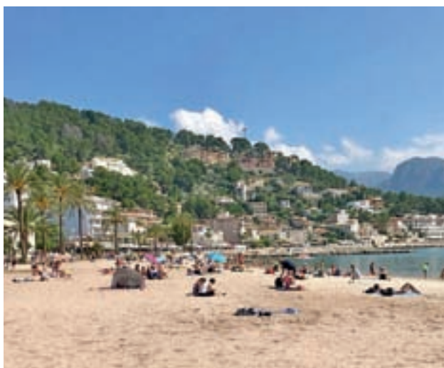
Las playas españolas son las protagonistas del verano