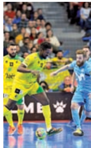
Última final de Copa