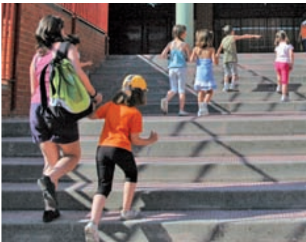
El curso ha comenzado en algunas comunidades esta semana