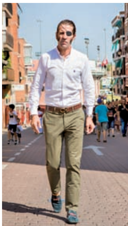
Por las calles de 'Sanse': Padilla presenció el encierro de San Sebastián de los Reyes el sábado 1 de septiembre. Al acabar, recibió a GENTE en las calles de esta ciudad taurina.

Aunque teniéndole delante y viendo sus últimas faenas se responde uno solo, la pregunta es obligada para comenzar la entrevista. ¿Cómo se encuentra después de la aparatosa cornada que sufrió