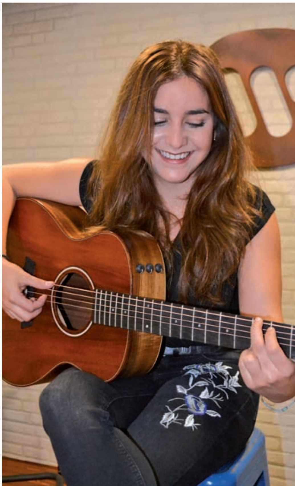
Esta joven onubense compone sus propias canciones