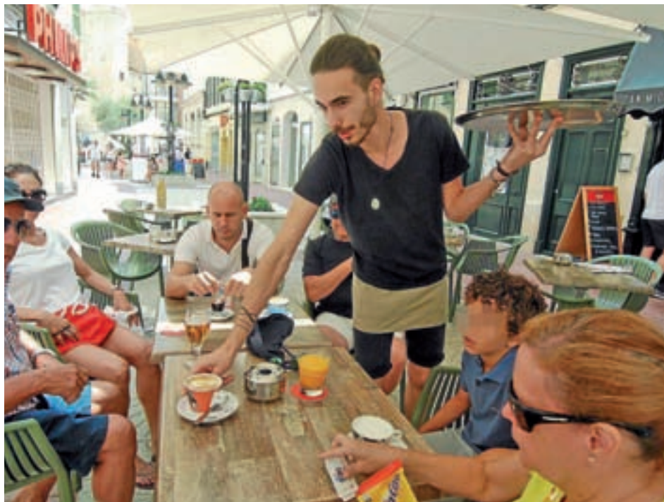
El fin de la temporada estival es especialmente negativo para el sector servicios

Si bien los datos no son muy halagüeños, lo positivo, respecto a la contratación, es que se han registrado un to-