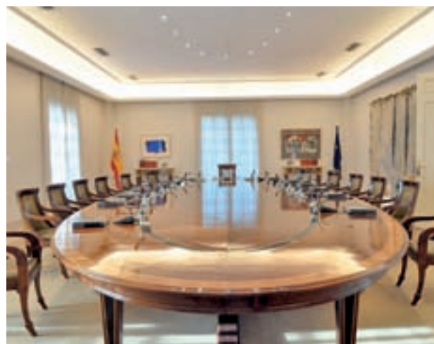
El programa se llama Moncloa Abierta

El programa bautizado como Moncloa Abierta contempla visitas semanales, con