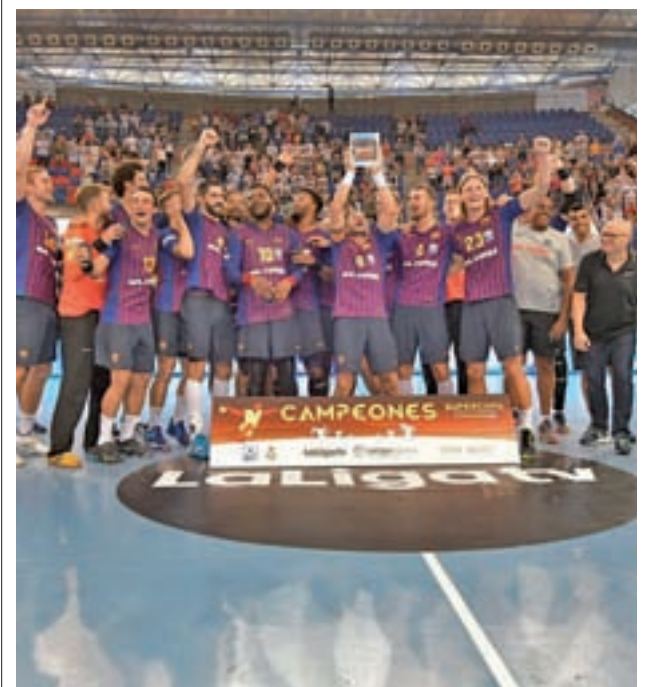
Nuevo título para los de Xavi Pascual

Lo que sí se conoce es la lista definitiva de 16 convocadas, una citación con la continuidad como nota predominante, ya que repiten presencia mundialista 8 de las 12 jugadoras que estuvieron en Turquía cuatro años atrás.