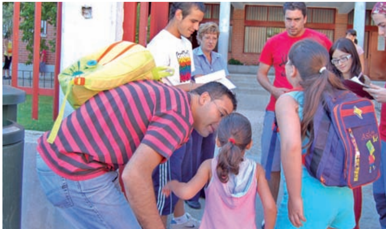
El curso escolar ha comenzado esta semana en varias comunidades autónomas

Entre aquellos con apoyo educativo, 217.416 lo recibieron por necesidades asociadas a discapacidad o trastorno grave; 16.025 por integración tardía en el sistema educativo; y 306.765 por otros motivos, entre ellos, los trastornos del aprendizaje, los del lenguaje y la comunicación, y la desventaja socioeducativa.