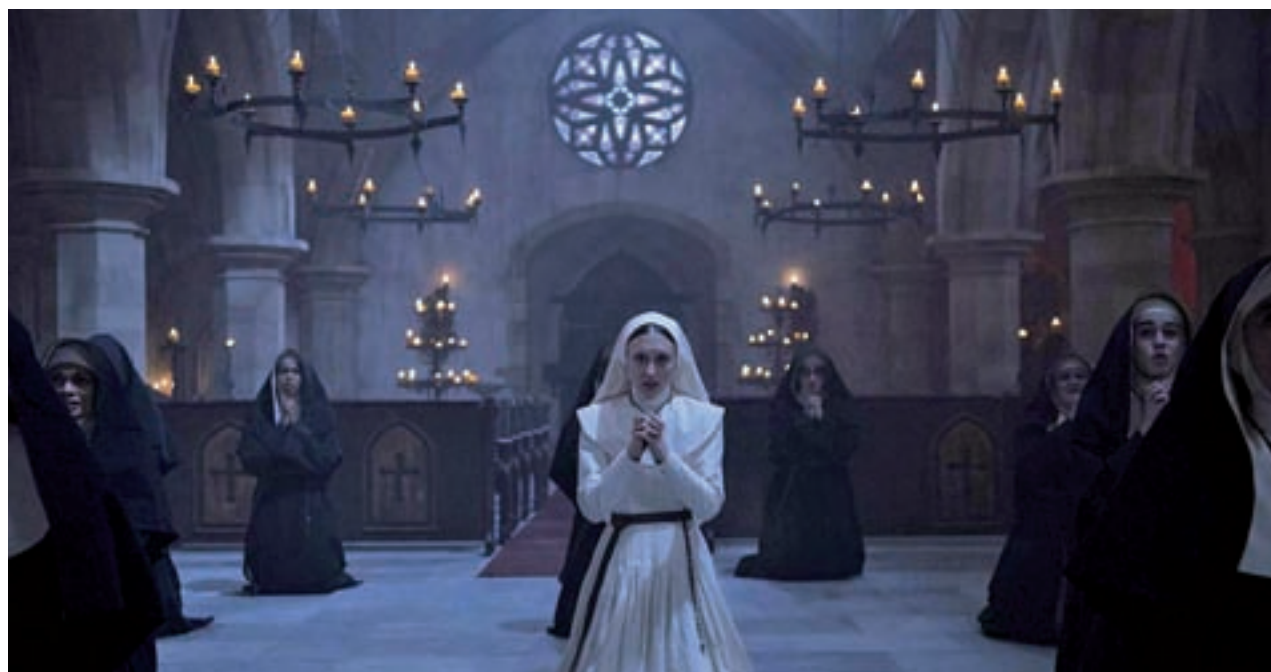
La monja es un personaje diabólico que ya aparecía en 'El caso Enfield'