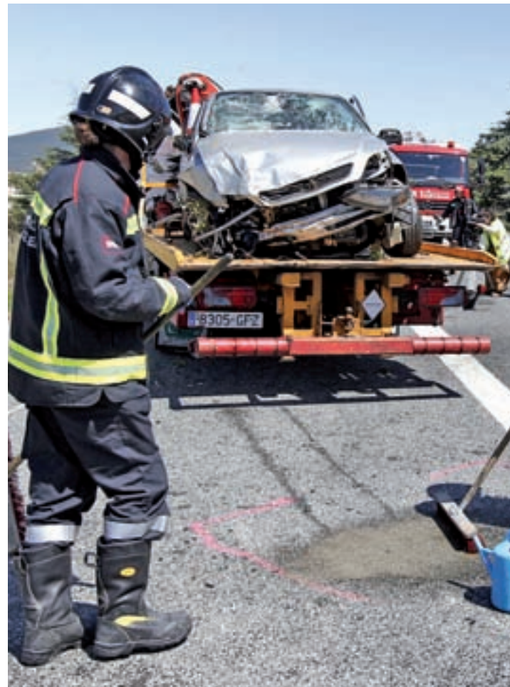
Un accidente de este verano

Según las cifras presentadas por Pere Navarro, el 76%