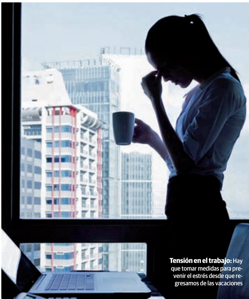
Tensión en el trabajo: Hay que tomar medidas para prevenir el estrés desde que regresamos de las vacaciones

Una buena alimentación, realizar ejercicio físico y mantener una rutina de sueño son claves para mantenerlo a raya • GENTE ofrece diez recomendaciones para que el trabajo y las obligaciones no afecten a nuestro ánimo