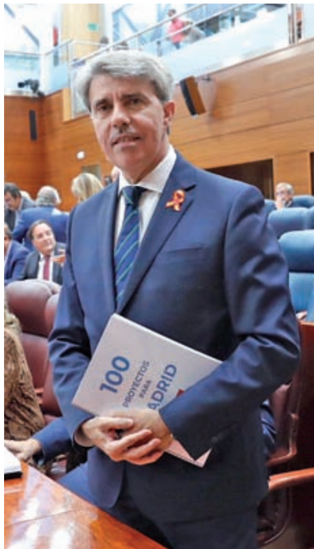
Ángel Garrido, durante su discurso en la Asamblea

El jefe del Ejecutivo regional se comprometió a dotar de nuevos equipamientos sani-