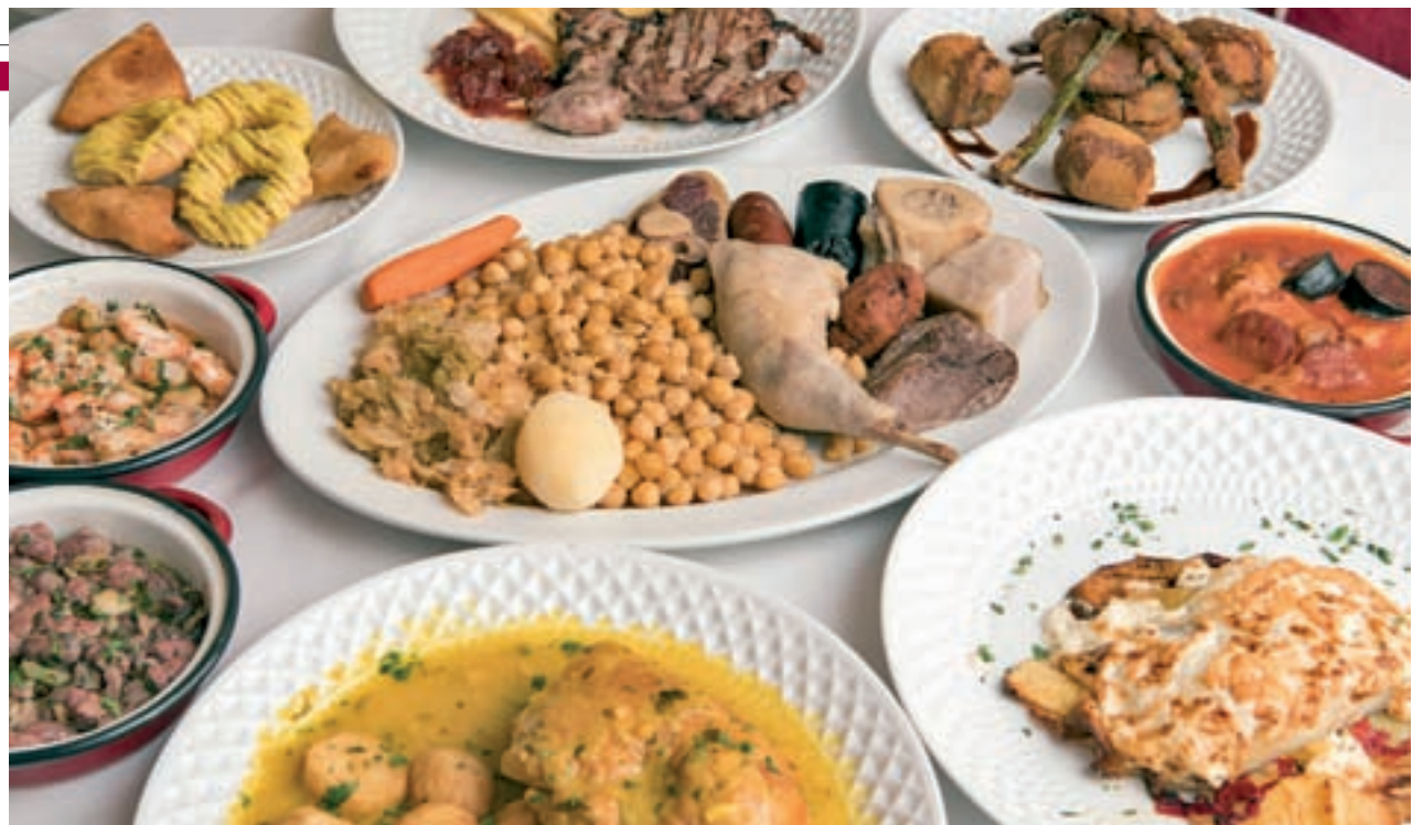
Selección de algunos de los platos creados para la ocasión

E l restaurante La Clave vuelve a presentar la II Semana de la Cocina Madrileña con once platos castizos firmados por el chef Pepe Filloa. Hasta el 30 de septiembre, el establecimiento recupera para deleite de todos los comensales viejas recetas olvidadas: desde el jarrete de lechal a la parrilla pasando por clásicos de siempre en plena forma como el cocido. También habrá otros guisos antaño imprescindibles como las gambas al ajillo, junto a creaciones propias como la pirámide de verduras de la vega de Aranjuez. De postre han elaborado bartolillos de crema, ponche madrileño y rosquillas de Alcalá.