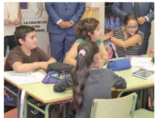
Los padres ponen un notable alto a la educación madrileña