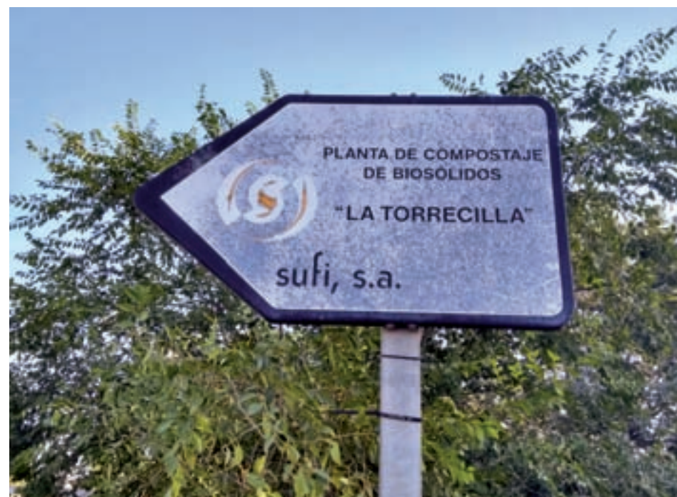
El cartel que conduce a la planta de biocompostaje de La Torrejilla AV PAU ENSANCHE DE VALLECAS

Al cierre de esta edición estaba convocado un acto informativo sobre la situación y el futuro del complejo de Valdemingómez, este jueves 13 de septiembre.