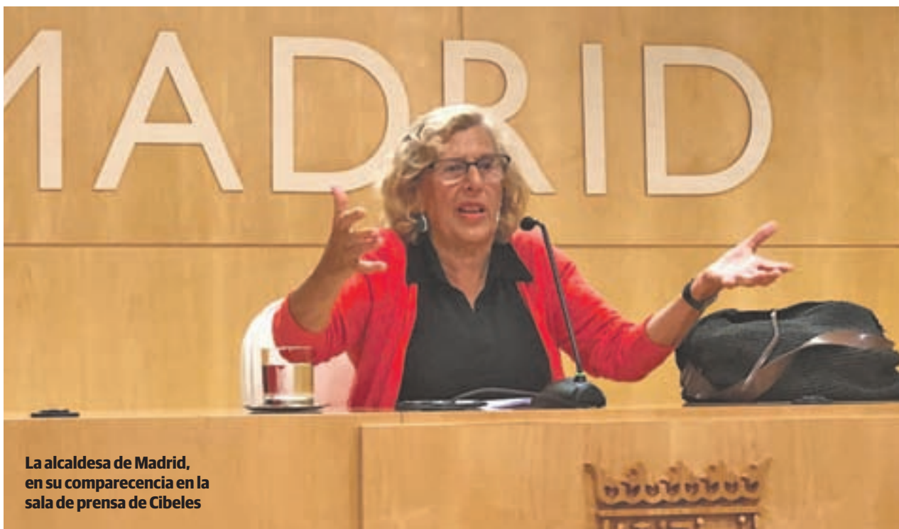
La alcaldesa de Madrid, en su comparecencia en la sala de prensa de Cibeles