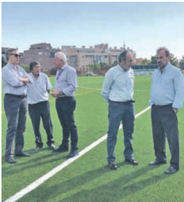
El Municipal de Vicálvaro estrenó su nuevo césped

Este tramo tan complicado del calendario tiene continuidad este domingo 16 (11:30 horas), con motivo de la visita al campo del quinto clasificado, un CD San Fernando que la pasada jornada sumaba una nueva victoria a costa del Villaverde San Andrés (0-1). Por tanto, el del Santiago del Pino será otro duro examen para el CD Vicálvaro.