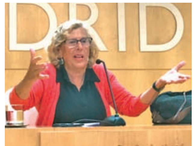
La alcaldesa, en rueda de prensa

Este anuncio ha sido acogido con entusiasmo por parte de sus concejales más afines, pero ha desatado las críticas abiertas de parte de su actual equipo de Gobierno de Ahora Madrid, en concreto de IU y Ganemos. "Nuestro proyecto se define por primarias abiertas y proporcionales, programa participativo y respeto a la diversidad. Así no, Manuela", critica en twitter la concejala de Ahora Madrid, Montserrat Galcerán.