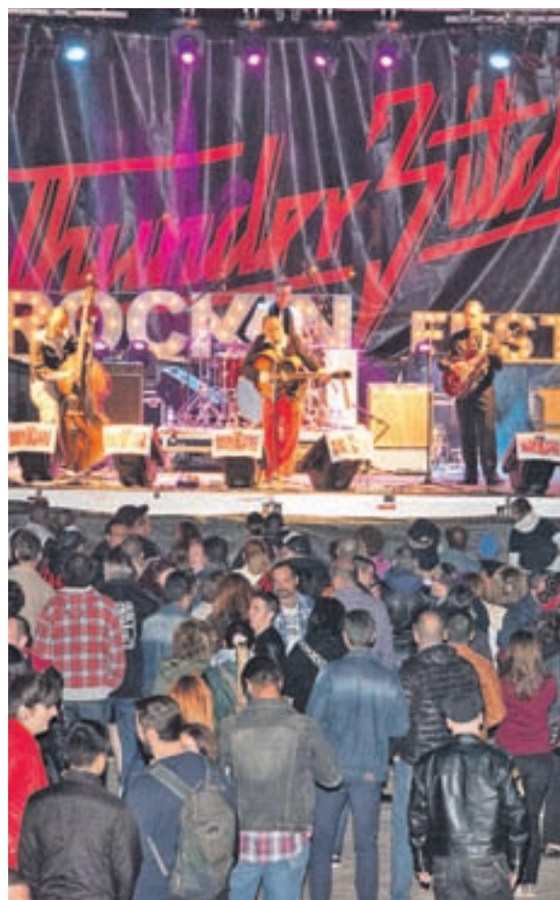
Más de 15 bandas se subirán a los escenarios

Habrán exposiciones de Harley Davidson y coches americanos, un show country (domingo 16, a las 12 horas), una gran ruta motera (sábado 15 a las 12 horas) un mercado con distintos puestos y puestos gastronómicos con diferentes 'food trucks'. Entre los actos destacados está el desfile pin-up que arrancará el mismo sábado a las 18:45 horas.