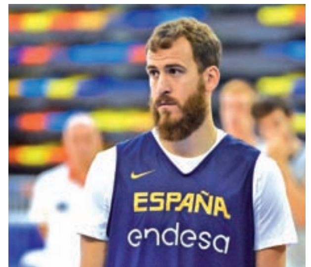
Sergio Rodríguez, novedad en la lista de Scariolo

Tras ese viaje, España regresa a casa para jugar en Madrid con Letonia, actualmente tercera de grupo (balance 4-2) y que en esta ocasión no contará con su mejor jugador, el pívot Kristaps Porzingis, de los New York Knicks, convaleciente de una grave lesión de rodilla.