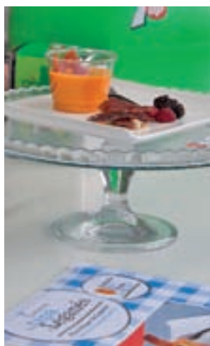
Tapa ganadora en 2017

Fuentes municipales prevén superar las 65.000 tapas que se sirvieron en la pasada