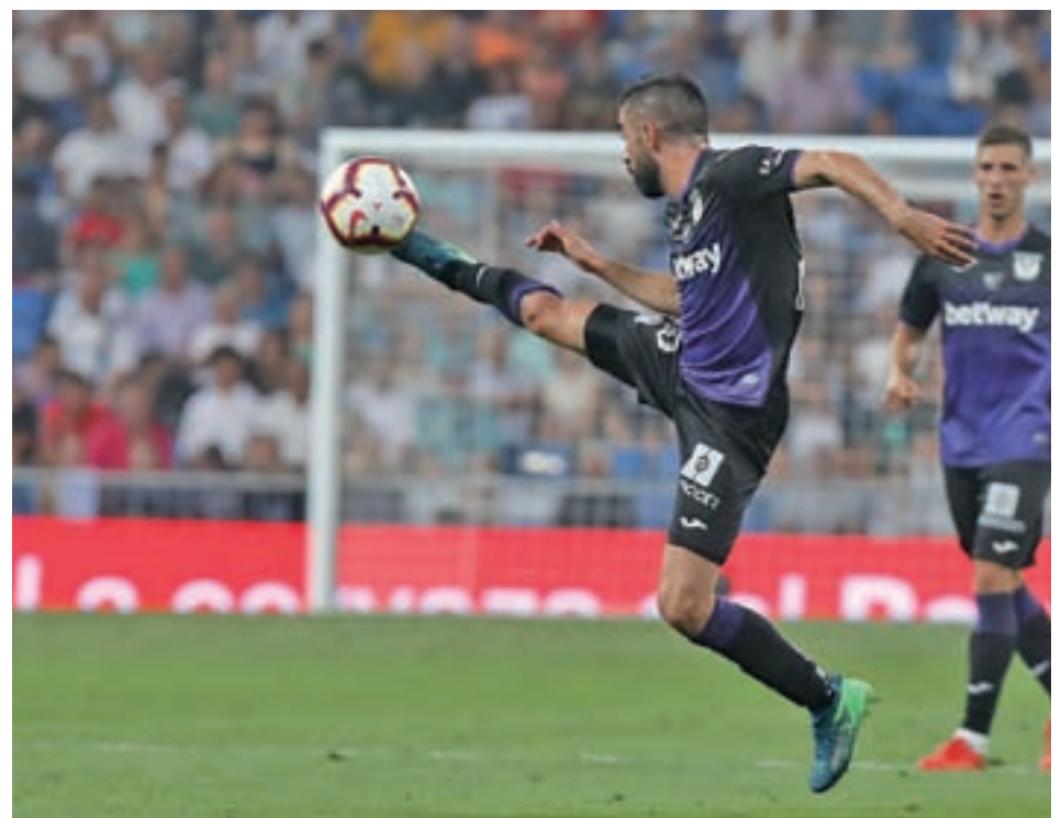
El CD Leganés, la pasada jornada

Si el inicio del 'Lega' no está siendo bueno, el del Villarreal no es mucho mejor. Al igual que los pepineros, hasta la fecha, ha firmado dos derrotas y un empate. Únicamente la diferencia de goles les hace estar un puesto por encima. Sin embargo, eso no es suficiente para escapar de la zona roja. Este domingo en Butarque se prevé que sea