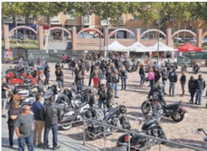
Será la concentración anual de HDC