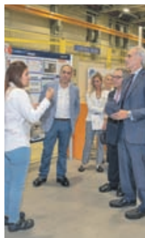
Ruiz Escudero en la visita

pués del análisis conjunto realizado en el área quirúrgica, se han hecho cambios en circuitos y en la ubicación de material y equipos, logrando una mejor sistematización y eliminando tiempos muertos, y aumentando la calidad y seguridad para los pacientes. Según el consejero, hasta el momento, aunque aún no han terminado, las mejoras llevadas se han traducido en una reducción del 13,8% en la suspensión de operaciones y en un aumento del 2,5% en la ocupación de los quirófanos respecto al 2017.