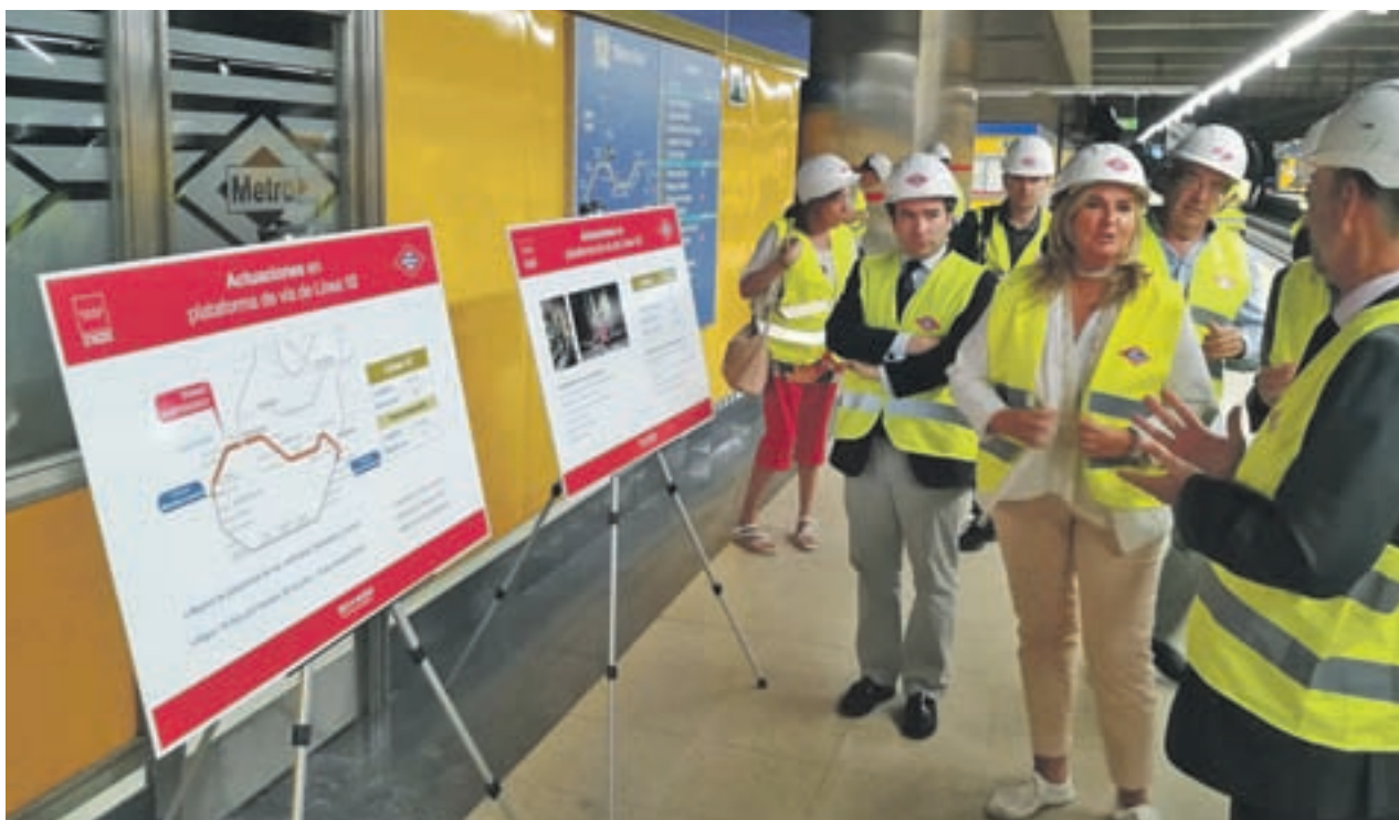
La consejera visitó las obras en la estación de El Carrascal