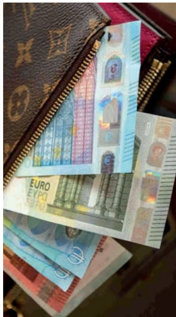
El sueldo medio nacional es de 1.646 euros

En cuanto a las variaciones sobre el poder adquisitivo, desde 'Monitor Adecco' se comprueba que el salario medio del conjunto de España, que en junio de 2016 ganaba el 1,4% de su poder de compra, en la actualidad ha perdido un 2,3%. Esto significa que al cabo de un año el asalariado medio tiene 469 euros