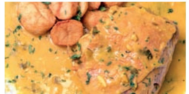
GALLINA EN PEPITORIA: Antaño protagonista de días festivos y celebraciones en casa, esta carne se sazona con una salsa típicamente madrileña con almendra machacada, huevo, azafrán...