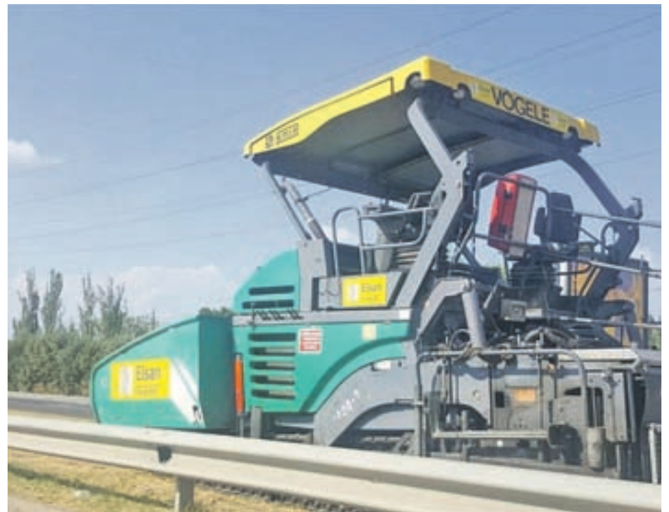
Obreros trabajando en la carretera

Las mejoras que se han llevado a cabo forman parte de la estrategia de conservación de carreteras que presentó el presidente de la Comunidad de Madrid, Ángel Garrido, antes de verano y que suponen un desembolso de 250.000 euros para el Gobierno regional. Concretamente, en la M-406 se la mejora del firme afecta al tramo situado en el entorno de la glorieta que limita con Leganés y a la conexión con la A-42, de modo que se benefician los usuarios del centro de salud y aquellos vehículos que usen