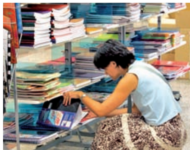
El fin es garantizar el apoyo socioeducativo de los menores

yen una mochila, un estuche, ceras de colores, una agenda escolar, un juego de reglas, un compás y una calculadora científica. Una de las principales líneas de trabajo de CaixaProinfancia es garantizar la promoción socioeducativa de los menores. Por ello, a lo largo de todo el curso el programa ofrece diferentes ayudas, como refuerzo escolar o apoyo psicomotor.