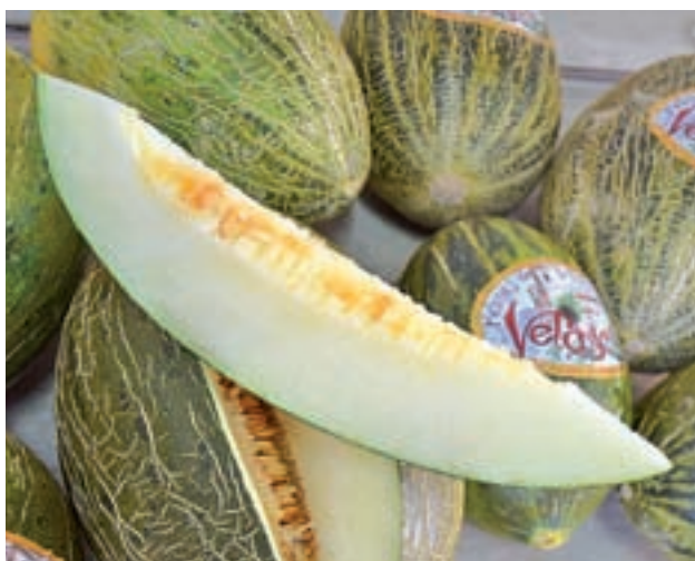
El aspecto del melón una vez recogido

Y es que en Villaconejos no se la juegan. Saben que el sabor es lo que ha hecho que a lo largo de décadas su melón sea tan demandado. De ahí que lo vendan en grandes superficies como Carrefour y Alcampo, que están apostando por los productos de la Comunidad de Madrid en sus establecimientos de la región, y en los distintos mercados de productores, entre los que destaca el de la Cámara Agraria, que se celebra el primer sábado de cada mes en la Casa de Campo.