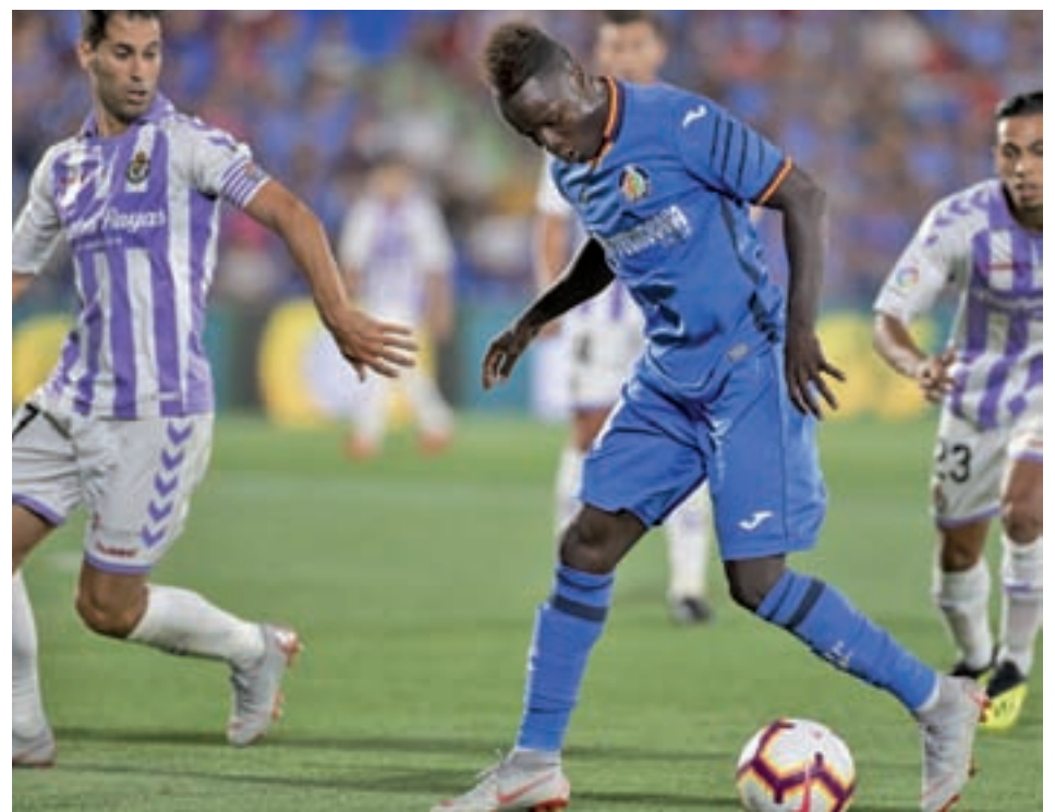
El Getafe, en su cruce con el Valladolid LALIGA.ES

En cuanto a la preparación del encuentro, Bordalás ha