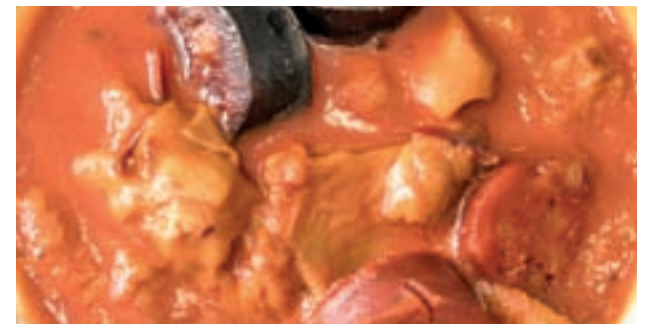
CALLOS: Es otra de las recetas esenciales de la casquería castiza. En su elaboración es necesario respetar la tradicional proporción entre morro, pata y toallita y no olvidar el Pimentón de La Vera.