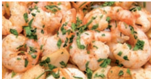
GAMBAS AL AJILLO: Aunque es una receta originaria del sur, en la actualidad se ha convertido en un plato imprescindible en muchos bares. El ajo, la guindilla y el perejil son claves.