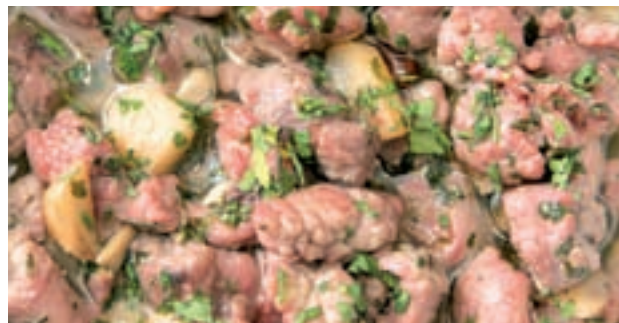
MOLLEJAS: Se trata de un despojo blanco de ternera o cordero. Desde 1900 es un plato de casquería bastante conocido en las tascas madrileñas que lo cocinan a la parrilla o a la sartén.

'La Clave' Restaurante C/ Velázquez, 22 91 053 20 31 Hasta el 30 de septiembre