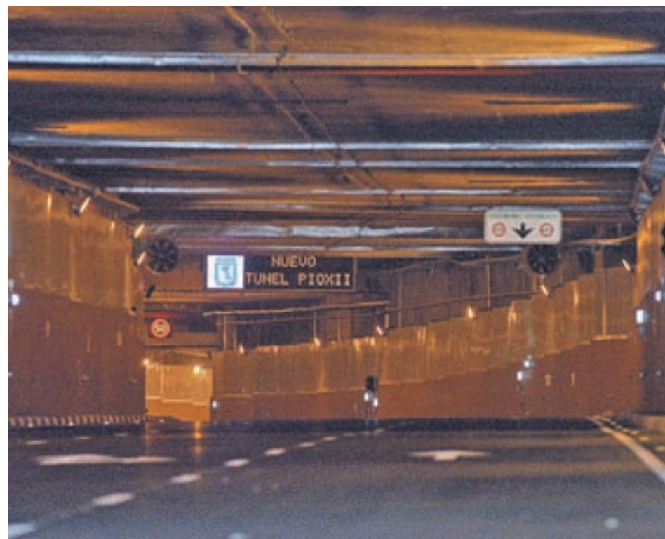
El paso que conecta las calles de Pío XII y Sinesio Delgado

Hasta al menos la próxima semana habrá que esperar para que sea transitable el túnel de Pío XII, el único que permanecerá clausurado.