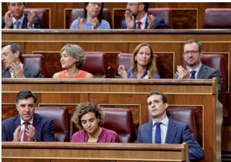
Pablo Casado, en el Congreso de los Diputados

"Lo único que voy a decir es que la verdad siempre se abre paso, y que este partido siempre respeta a las instituciones, sean universidades o administraciones judiciales, a diferencia de otros," valoró el