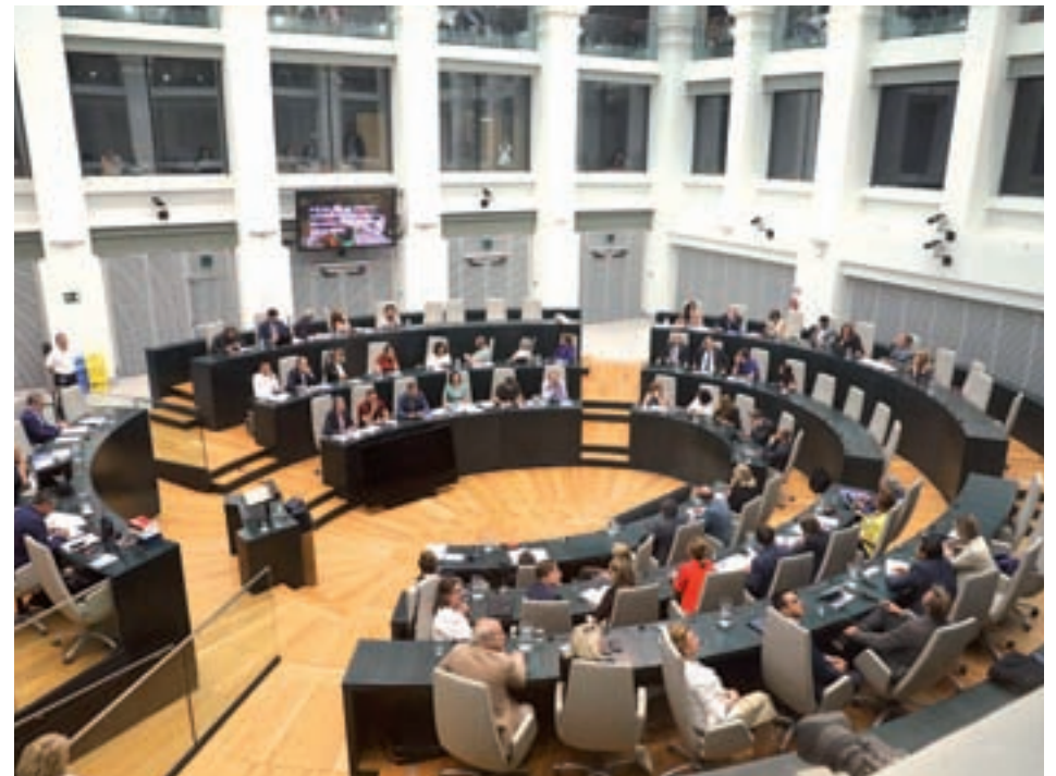
Un momento del debate de este martes 25 de septiembre

Carmena anunció que es una de sus prioridades en el Debate del Estado de la Ciudad • Otro de sus planes de futuro será solicitar una moratoria para evitar la subida de los alquileres