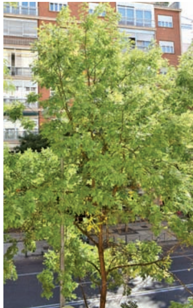
El otoño aún no ha llegado a las calles

En cuanto al verano que acaba de terminar, la Aemet hizo un balance en el que destacó que se ha tratado de una estación más cálida y seca de lo habitual. Todas las estaciones de la región presentaron valores superiores a la media de los últimos años, con mención especial para los 25,3 grados de Retiro (uno más de lo normal), los 25,5 de Getafe (un incremento de 0,9) y los 16,7 de Navacerrada (un aumento de 0,7). Más en sintonía con los valores medios estuvieron los 24,9 de Cuatro