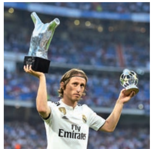
Aplausos para 'The Best': La salida de Cristiano Ronaldo no ha dejado huérfano al Real Madrid de premios individuales. Luka Modrić recogía el pasado lunes el 'The Best', un galardón que previsiblemente ofrecerá al público blanco este sábado.

Con la lección aprendida, este curso tocaba hacer borrón y cuenta nueva para buscar una nota en el torneo doméstico más acorde al potencial de las plantillas madrile-