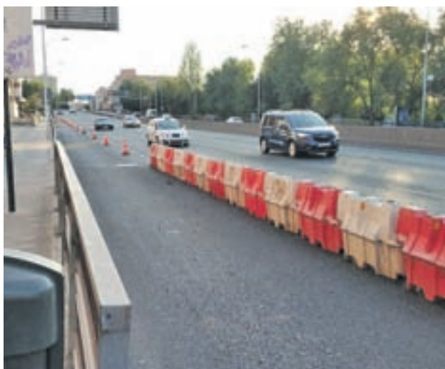
La autovía, a su entrada a la capital