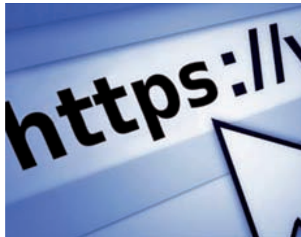
El cierre de páginas estaría en manos de la Comisión SINDE

Esta medida supondría dejar en manos de la Sección