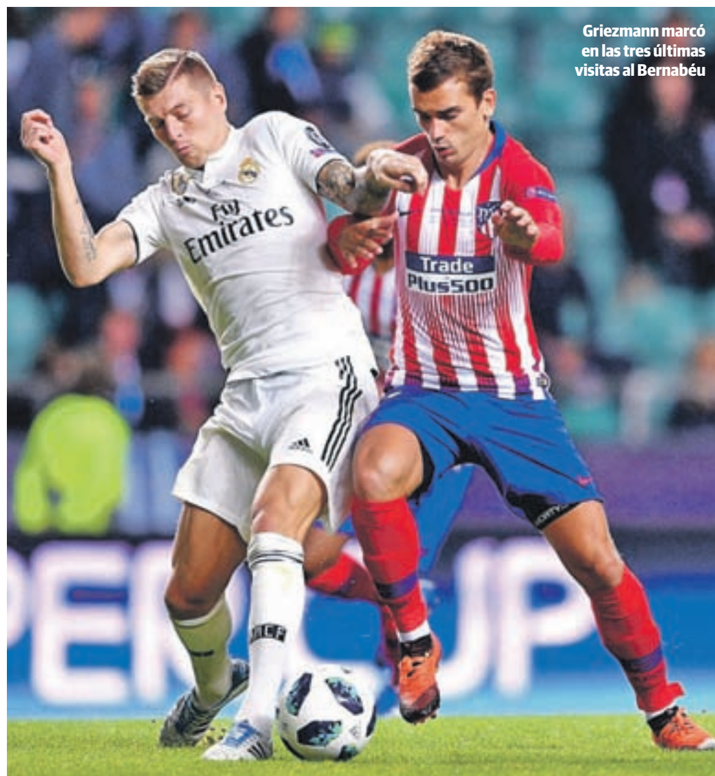
Griezmann marcó en las tres últimas visitas al Bernabéu

Los caminos del Real Madrid y el Atlético vuelven a cruzarse este sábado (20:45 horas), apenas un mes después de la final de la Supercopa de Europa • Los rojiblancos pondrán de nuevo a prueba el proyecto de Lopetegui, tras la contundente derrota sufrida por los blancos el miércoles en el Sánchez Pizjuán