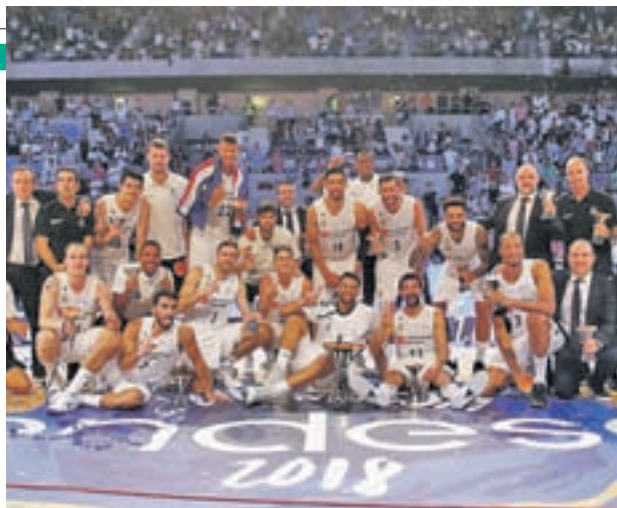
El Madrid se alzó con la Supercopa en Santiago

pas habituales en el Madrid en el inicio del siglo XXI. Ni siquiera la apuesta por entrenadores de tanto prestigio como Ettore Messina llevaban a los merengues a las cotas deseadas, quedándose a la sombra de clubes como el Barcelona, el Baskonia e incluso el Unicaja. Pero hubo un momento en el que todo cambió. La llegada de Pablo Laso Biurruín al banquillo blanco no despertó demasiada ilusión en una afición que, desde aquel verano de 2011, no se ha cansado de celebrar títulos. El último de ellos llegó el pasado sábado 22 con la consecución de la Supercopa.