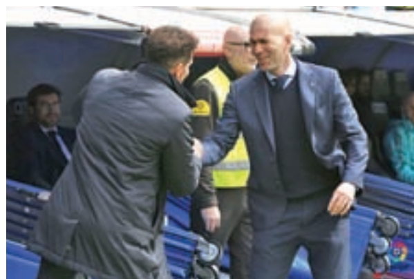
Los dos últimos años se ha repetido resultado: 1-1

ban con sus huesos en Segunda, mientras que el Real Madrid festejaba la consecución de su octava Copa de Europa. Cara y cruz, el paradigma de que en este ámbito futbolístico la alegría de unos casi siempre va ligada a la tristeza del rival.