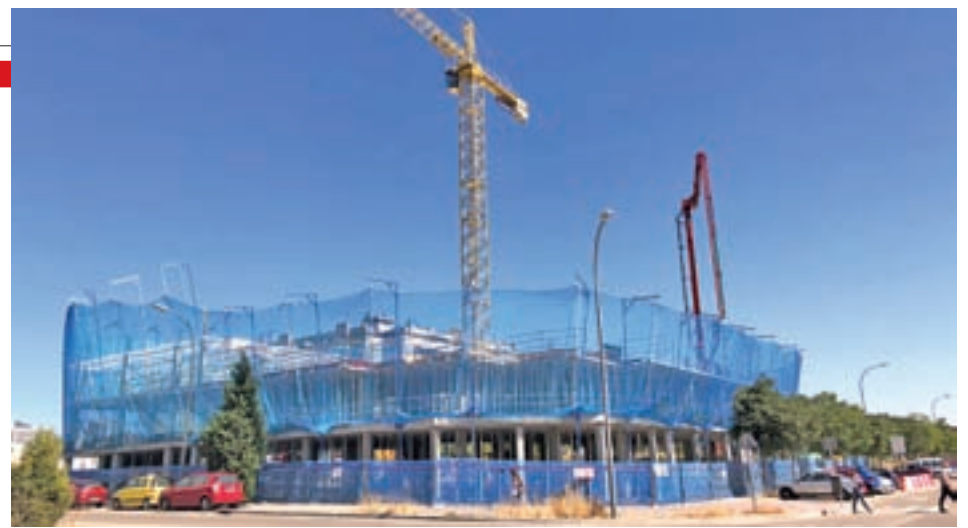
Una de las promociones en construcción en el Ensanche de Vallecas

za en el distrito Centro. En cuanto al sector retail (las grandes cadenas de locales comerciales) destaca la Puerta del Sol, y la quinta Torre (Caleido) o el Edificio Axis, en Colón, al combinar el uso dotacional y el espacio comercial.