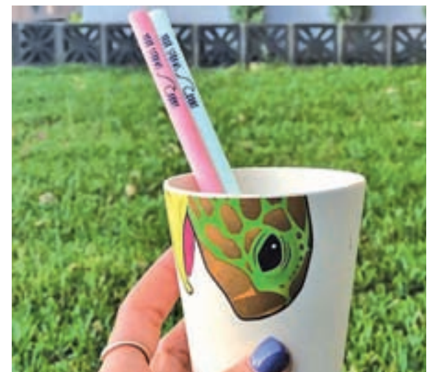
Primera pajita comestible

Toda la información relativa a los establecimientos participantes en la iniciativa, recetas, cócteles, horarios y precios, para que puedas hacer tu propio itinerario, está disponible en la web Hoteltapatour.com .