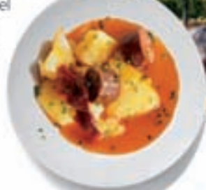
Gastronomía riojana Patatas con chorizo