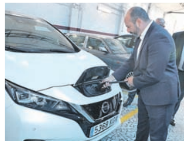
El vicepresidente regional, Pedro Rollán, recarga un coche

En cualquier caso, el consejero aseguró que la Comunidad de Madrid es "realista" en este asunto, ya que la penetración actual de este tipo de coches y motocicletas en la región es "de apenas el 2%". En este sentido, apuntó que es clave "tener visión de futuro" e "ir de la mano" de la tecnología a la hora de reducir las emisiones de CO 2 .