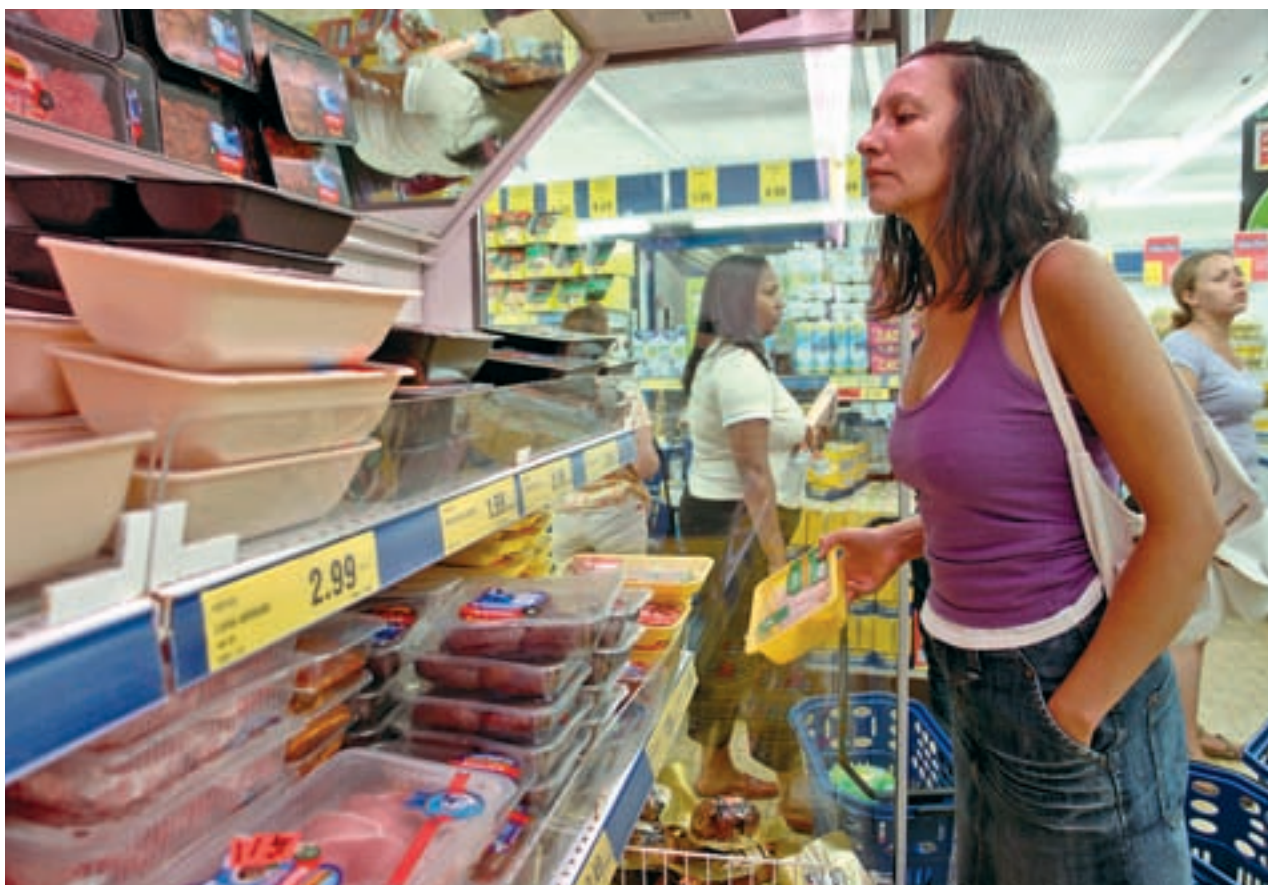
El estudio de la OCU demuestra las diferencias entre los supermercados GENTE