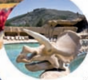
Barranco Perdido Aventura en Enciso