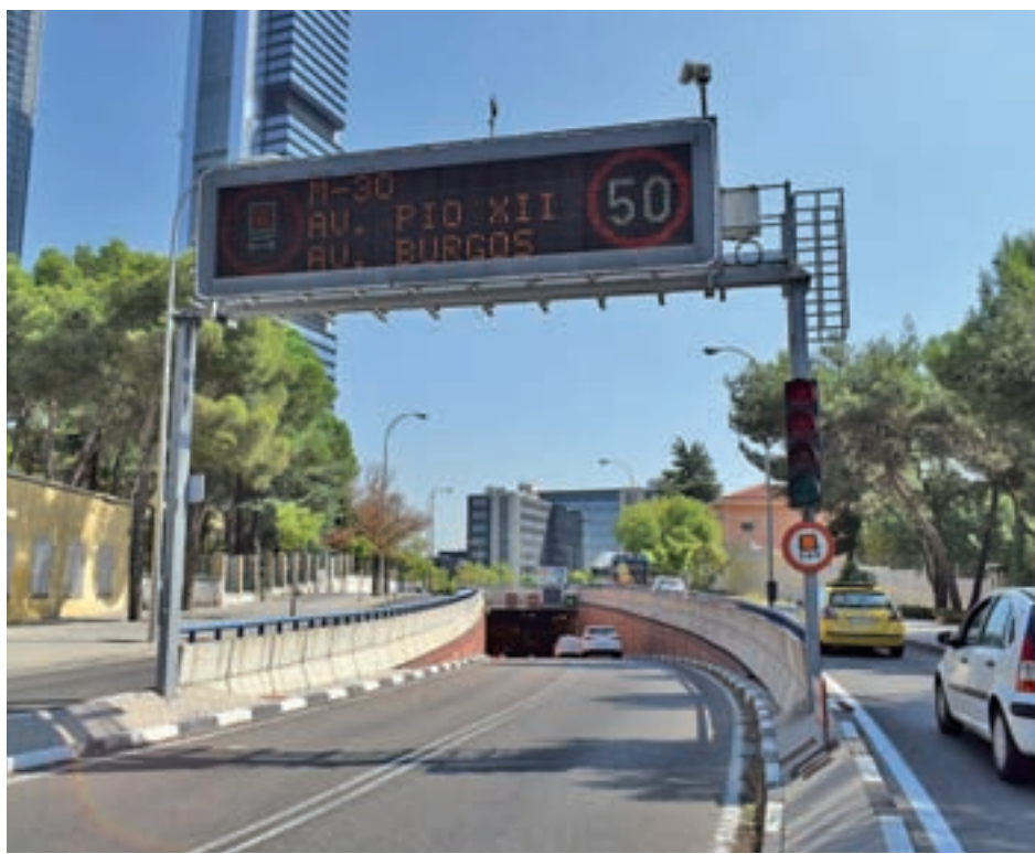
Túnel de Pío XII