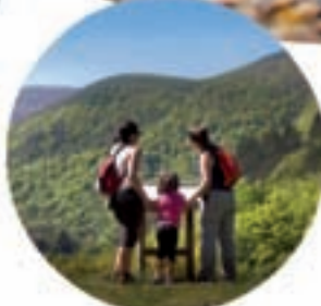
Las mejores vistas Naturaleza en familia