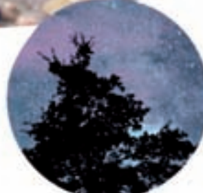
Estrellas en el cielo riojano Turismo Starlight