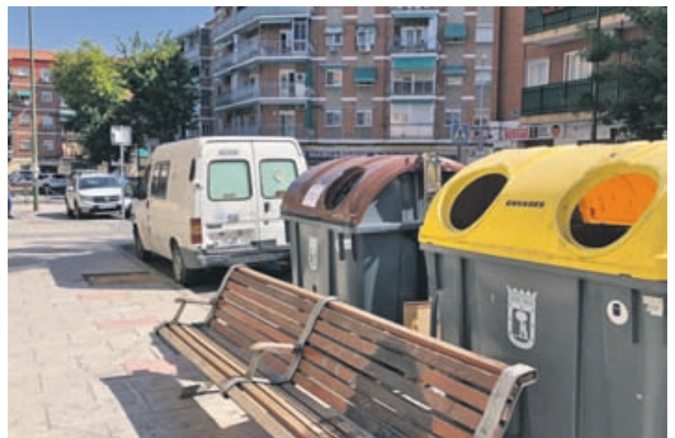
Un contenedor marrón en la calle

En noviembre será el turno de Ciudad Lineal, Moncloa-Aravaca, Puente de Vallecas, Tetuán y Villa de Vallecas;