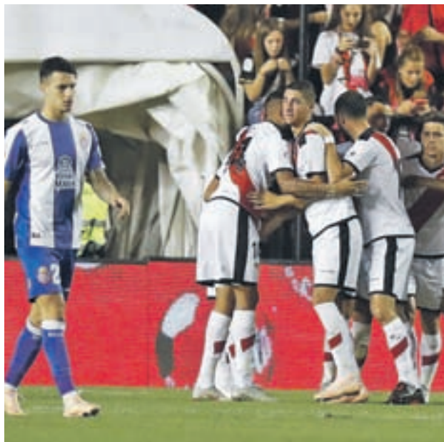
El Rayo no pasó del empate con el Espanyol LALIGA.ES

Eso sí, lo que no cambia es la importancia de los tres puntos en juego. El Leganés cierra la clasificación tras ha-