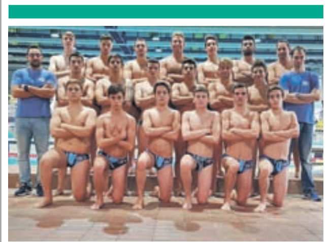
Plantilla de la AR Concepción-Ciudad Lineal