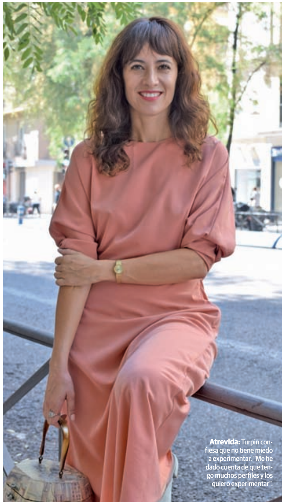
Atrevida: Turpin confiesa que no tiene miedo a experimentar. “Me he dado cuenta de que tengo muchos perfiles y los quiero experimentar”.

Si bien es una temática diferente, al tratar una asunto de plena actualidad como es la privacidad de las personas en Internet, ha despertado