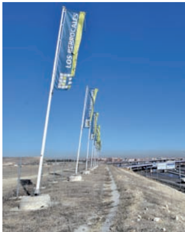
El desarrollo de Los Berrocales

En el texto, los magistrados rechazan la impugnación de Cibeles contra su fallo del pasado verano. Y señalan que procede la condena en costas de la recurrida que ha visto "rechazada sus pretensiones, sin que concurra motivo para su imposición, fijándose las mismas en cuantía total de 100 euros". Además, en su resolución concluyen que "la medida cautelar adoptada se