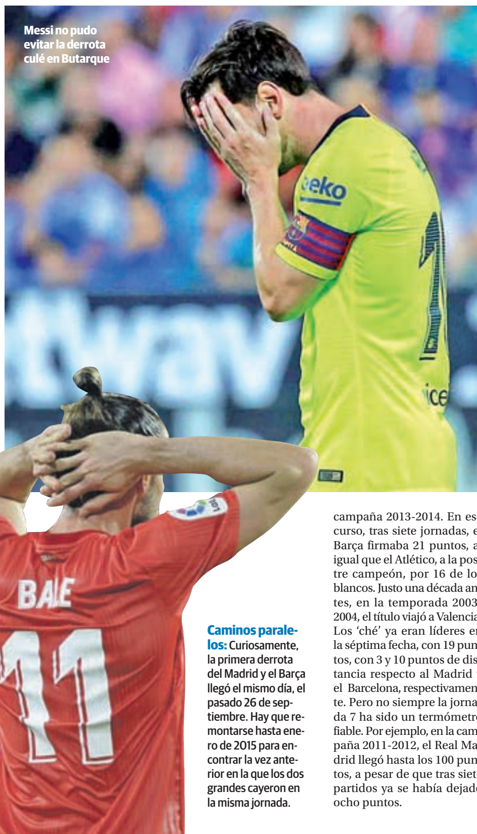
Messi no pudo evitar la derrota culé en Butarque

Yendo un poco más allá en el tiempo, la última vez que la Liga no acabó en las vitrinas del Bernabéu o el Camp Nou fue en la