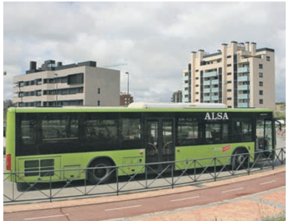
Cambios en los autobuses

La línea con más variaciones es la 4, que modifica su cabecera y aumentará el número de expediciones, hasta un total de 23 cada día ● También se han alterado las interurbanas 713 y 712