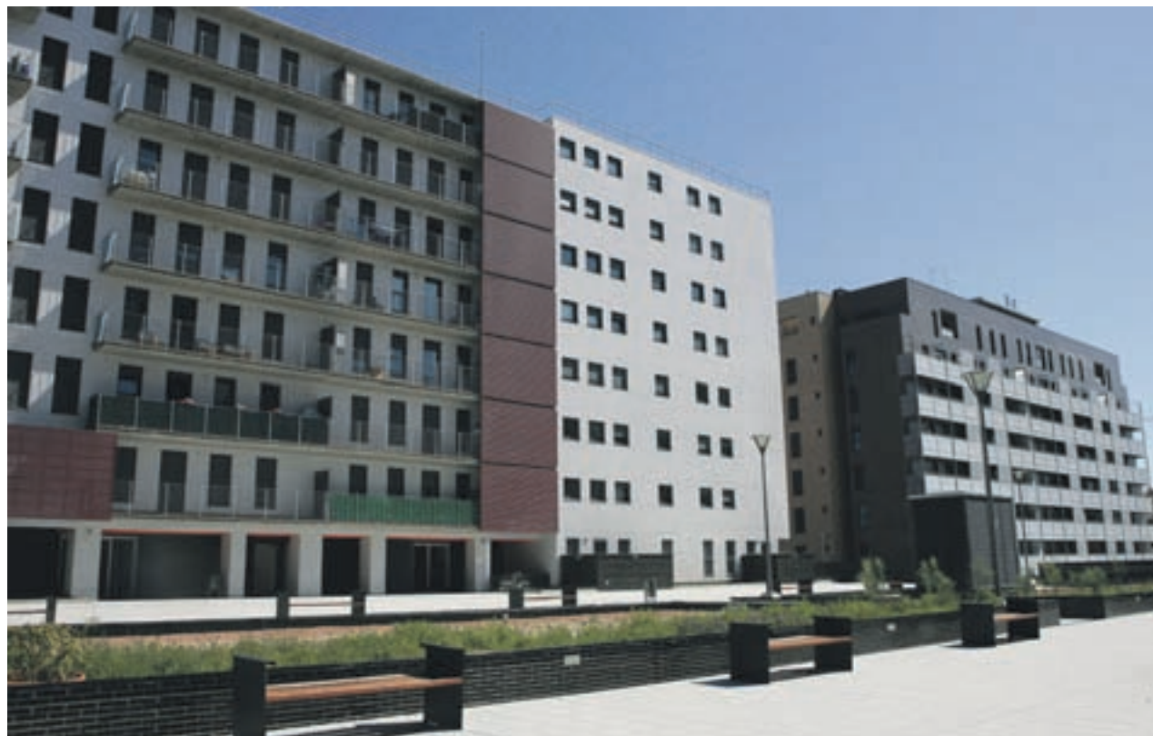
Las mil viviendas

EN SU RUTA POR MADRID PASARÁN POR SOL Y CONCLUIRÁN EN LAS VISTILLAS