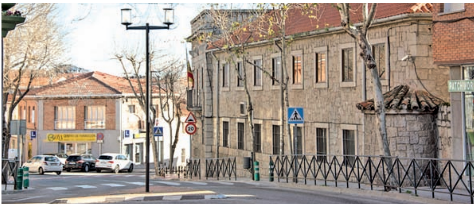
Un tramo de la avenida