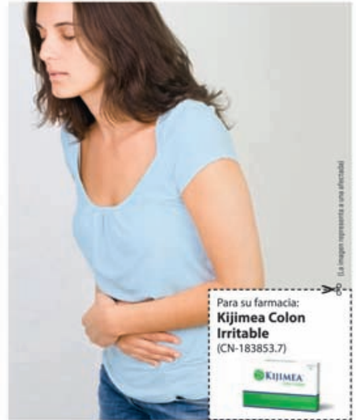
La imagen representa a una afectada

bifidobacterias contenida en Kijimea Colon Irritable se pudieron aliviar significativamente las típicas molestias que sufren los afectados del colon irritable. En algunos casos, estas molestias incluso desaparecieron. Aún más: La calidad de vida de los afectados mejoró significativamente. Kijimea Colon Irritable no necesita receta médica y puede adquirirse en farmacias. Además, no se conocen efectos secundarios.