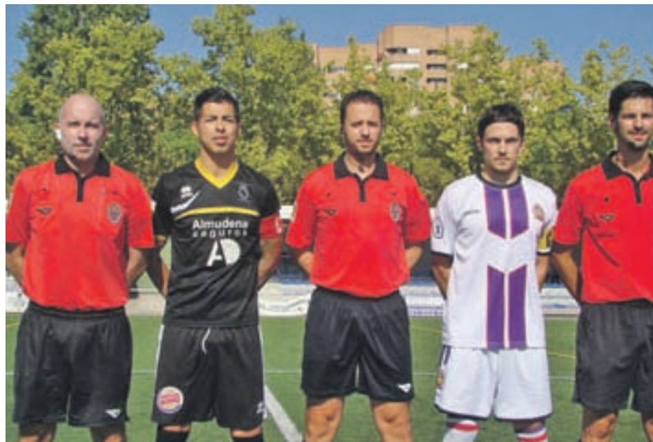
Árbitros y capitanes al inicio del partido

EL COLMENAR VIEJO VIENE DE GANAR POR LA MÍNIMA AL MORATALAZ