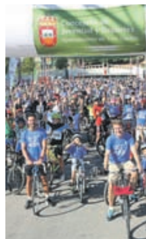
Fiesta de la bicicleta

Desde la organización han destacado que esta iniciativa se ha consolidado como "una fiesta del deporte y la diversión", en la que también hubo sorteos con premios de material deportivo y clases multitudinarias para todos los vecinos, independientemente de su físico.