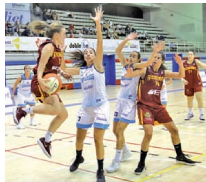
Toma de contacto: El pabellón Europa de Leganés acogió recientemente el Torneo de Liga Femenina 2 de la FBM, desde este año Memorial Juan Martín Caño. El título se lo llevó el equipo local, Laboratorios Ynsadiet.