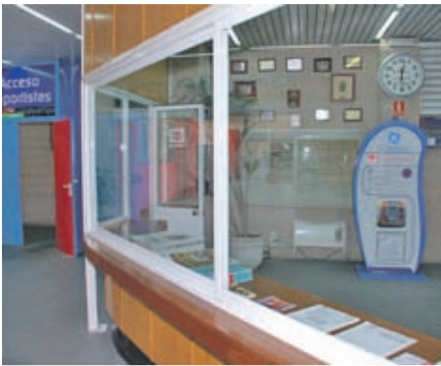
Uno de los aparatos