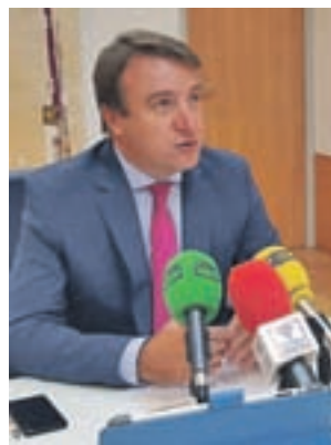
Presentación de los datos

grama electoral. Sin embargo, entre los planes de futuro, Moreno explicó que en 2019 se completará el soterramiento de todos los contenedores de la ciudad, que en los próximos meses se pondrá en marcha una nueva zona canina y que se mantendrán los programas integrales para las