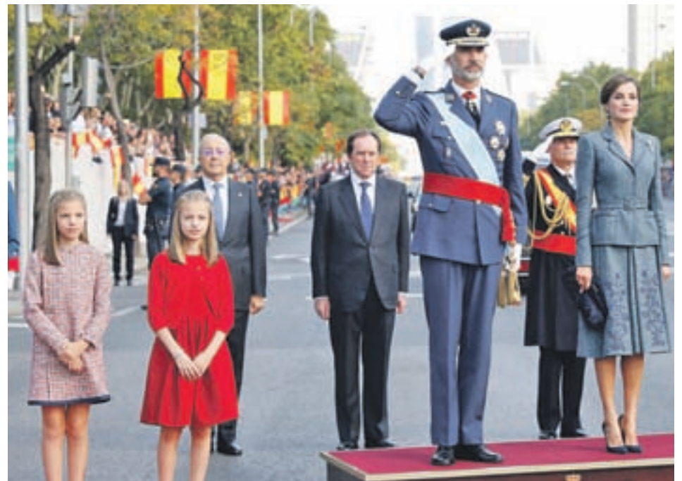
Los Reyes y sus hijas, durante la celebración del 12 de octubre de 2017

A la espera de saber si los balcones de los edificios estarán tan adornados con banderas nacionales como hace un año (varias formaciones, como el PP, están haciendo llamamientos a la población para que así sea), el desfile militar y la posterior recepción en el