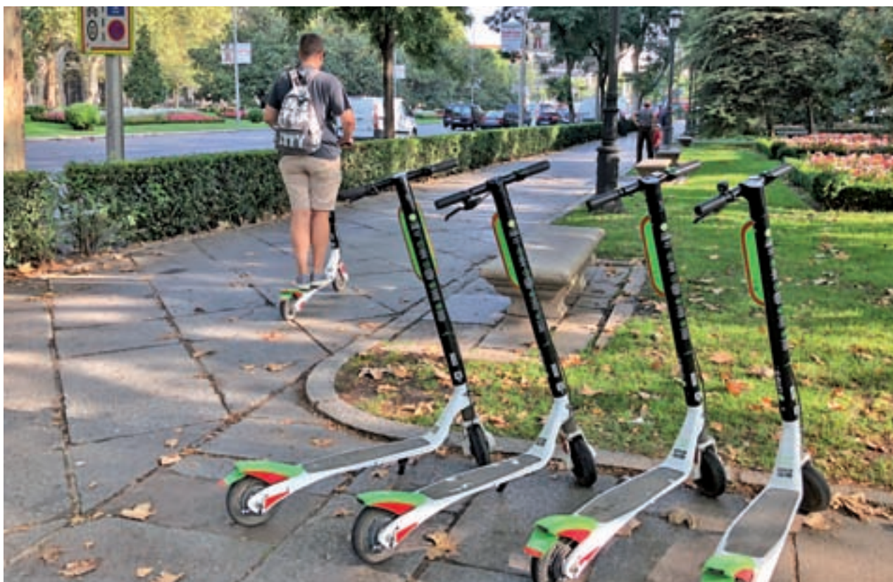
La norma regula el uso de patinetes eléctricos en la capital LUCA JIMÉNEZ / GENTE