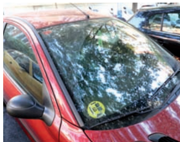
La recomendación es colocarlo en el ángulo inferior derecho

Las personas que carezcan de etiqueta pueden adquirirlas en las oficinas de Correos, presentando el permiso de circulación y el pago de cinco euros como tasa.