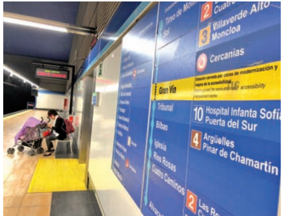
Uno de los carteles que informa sobre el cierre de la estación

“El Ayuntamiento va a intentar enredarme a mí por su operación de Gran Vía, pero yo lo tengo claro. Mi obra, si