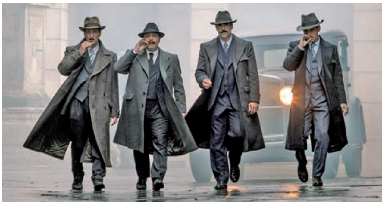
Ernesto Alterio, Vicente Romero, Luis Tosar y Jaime Lorente forman parte del cuerpo policial en esta película

La configuración de los personajes, la banda sonora, la fotografía, las interpretaciones de Joanna Kulig y Tomasz Kot... Todos y cada uno de los elementos brillan en esta obra maestra que, además, tiene un metraje nada pesado: menos de hora y media. Si usted ya ha ido a verla, enhorabuena. Si aún no lo ha hecho, busque una sala donde se proyecta; no se arrepentirá.