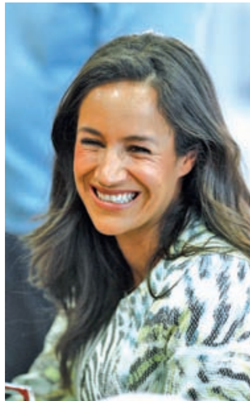
Begoña Villacís, portavoz de Ciudadanos

Por su parte, Villacís es la apuesta de Ciudadanos, a pesar de que todavía tiene que pasar por el trámite de las primarias a principios del