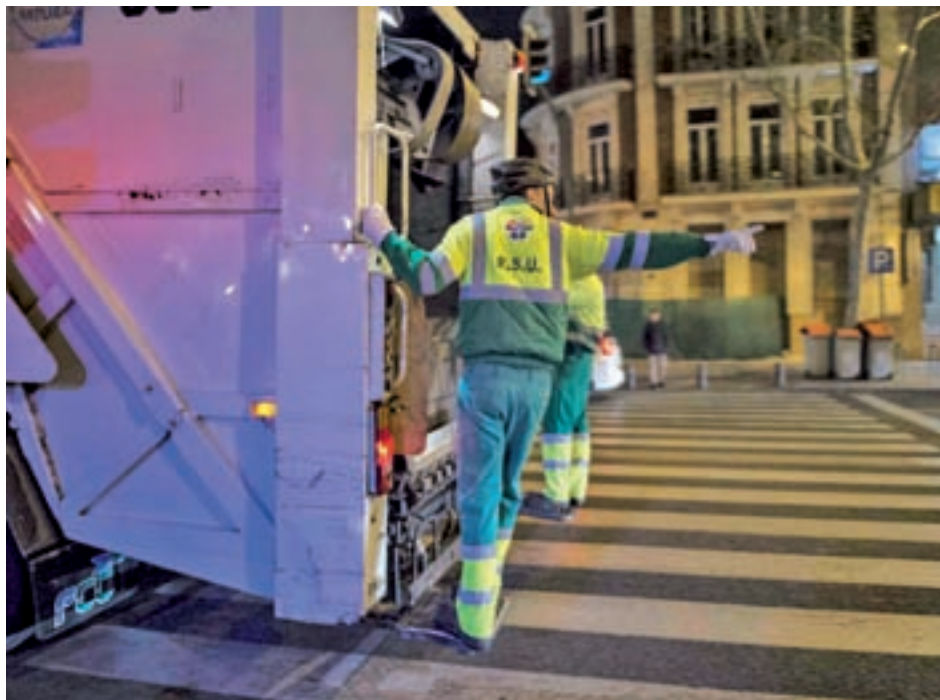
Los vecinos cuentan que la recogida es entre las 3 y las 4 de la madrugada

Según relata este colectivo, su 'fiesta' nocturna comienza a las 2 de la madrugada en días laborables (2:30 en fin de semana) con el cierre de los locales y continúa media hora más con la salida de los clientes y la recogida de los bares. Poco después de 3 a 4, el ruido reaparece con la recogida de residuos orgánicos, para proseguir de 4 a 5 con la limpieza de las calles; y continuar, finalmente, con la rea-