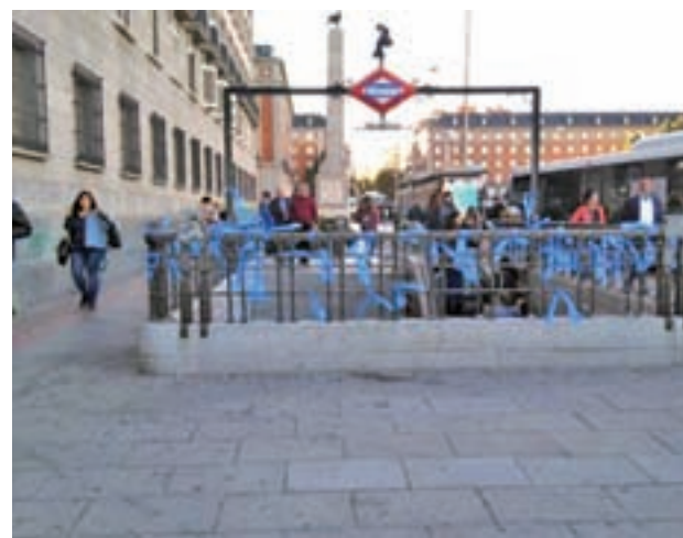
Lazos azules en la estación de Metro Moncloa

Los lazos azules en la capital comenzaron a proliferar a raíz del 'conflicto' entre Policía Municipal y Consistorio en la negociación del nuevo convenio colectivo. Los sindicatos CPPM y CSIT Unión Profesional apoyaron y participaron en esta iniciativa, al igual que la Asociación de la Policía Municipal Unificada (APMU), con la que pedían "respeto" al Ayuntamiento.