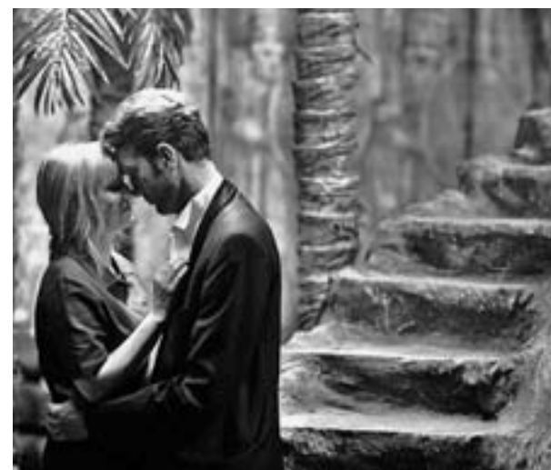
La película está filmada en blanco y negro

A pesar de todo, el film es otro interesante y sugerente paso en la carrera como director de Dani de la Torre.