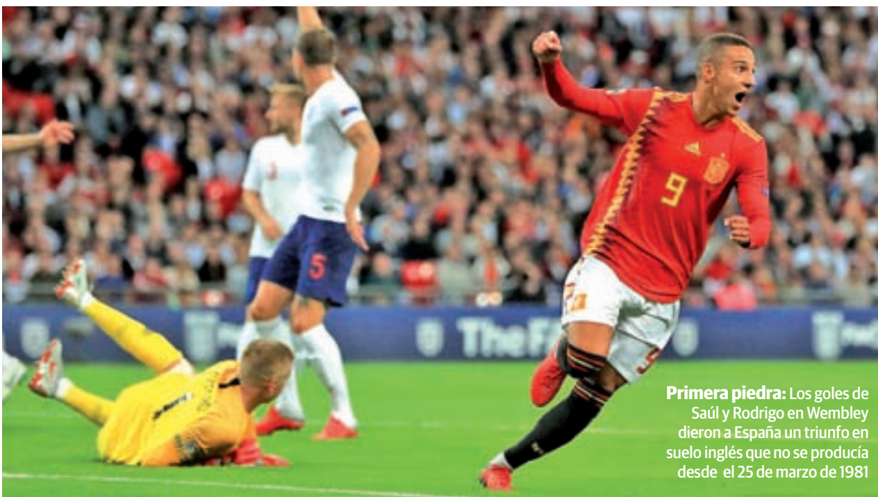
Primera piedra: Los goles de Saúl y Rodrigo en Wembley dieron a España un triunfo en suelo inglés que no se producía desde el 25 de marzo de 1981

FÚTBOL | LIGA DE LAS NACIONES DE LA UEFA