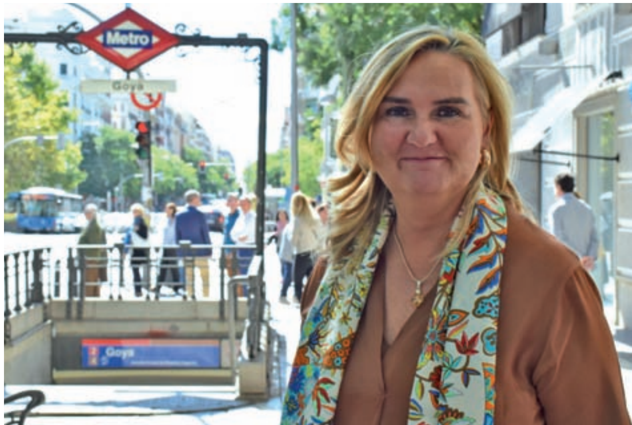
Rosalía Gonzalo, consejera de Transportes de la Comunidad de Madrid

Por otro lado, la consejera confirmó a GENTE que la ampliación de la Línea 11 se contempla para la próxima legislatura y que la estación de Arroyofresno, que se está construyendo en la Línea 7, se inaugurará en plazo antes de que acabe la legislatura, en mayo del próximo año.