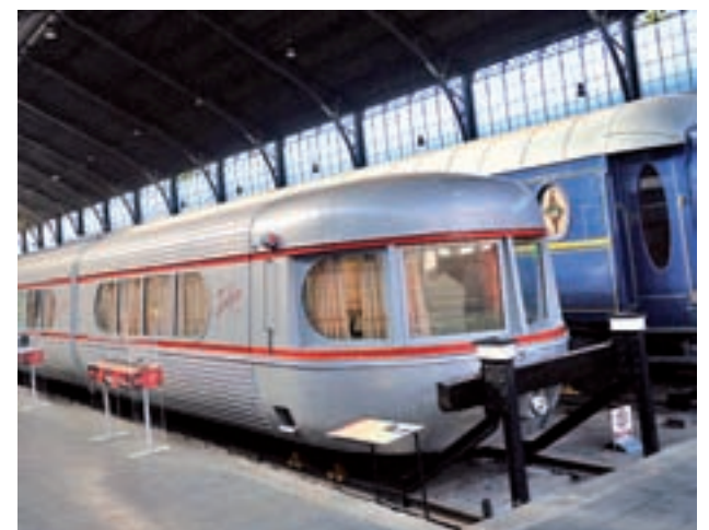
Museo del Ferrocarril, junto a los terrenos

Así, se desmantelaron un total de 55 estructuras provisionales y fueron desalojadas unas 70 personas, en su mayoría de nacionalidad rumana y etnia gitana. Durante la intervención, en el que no se produjeron incidentes, el Samur Social ofreció alternativa habitacional de emergencia a todas las personas desalojadas.