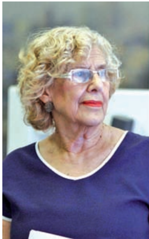
Manuela Carmena, alcaldesa de Madrid

Por el momento, sólo hay dos opciones seguras: Manuela Carmena y Begoña Villacís. La regidora ya ha anunciado que se volverá a presentar, sin embargo, las dudas son bajo qué siglas. Las dificultades que ha atravesado estos años como alcaldesa, con un equipo de concejales poco cohesionados y un ala 'dís-