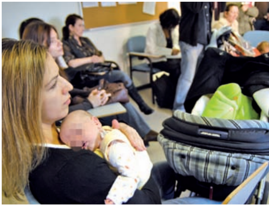
Las prestaciones anteriores a 2014 han prescrito GENTE

El procedimiento para solicitarla pasa por presentar en la Administración de Hacienda un escrito de solicitud de rectificación de auto-