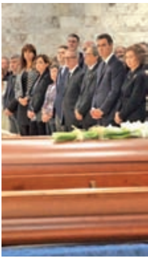
Un momento del funeral