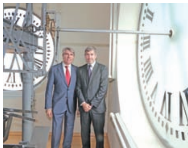
Garrido y Clavijo, en el reloj de la Puerta del Sol

“No queremos desvelar los eventos y sorpresas que vamos a tener”, agregó Clavijo, que señaló que los detalles se irán desgranando a lo largo del próximo mes y medio.