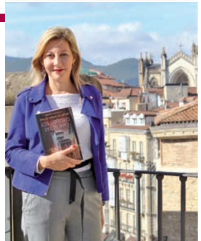
VITORIA, ESCENARIO LITERARIO: Catedral de Santa María, Portal de la Soledad de las Carniceras, plaza de la Virgen Blanca o el Palacio de Villa Suso son algunos de los escenarios protagonistas de la novela.

Aquí no queda todo. Una de las mejores noticias que han podido recibir todos estos fanáticos de la trilogía es que ya ha terminado el rodaje de la adaptación al cine y será el próximo año cuando vea la luz. "Hasta que no vea el montaje final en la sala es complicado opinar, pero es