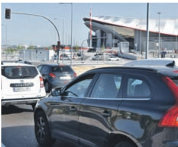
El entorno del feudo rojiblanco