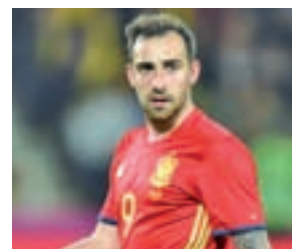
ALCÁCER · B. DORTMUND

Un regreso: reconoció que su ausencia en el Mundial fue un palo. Pocos meses después, Álvaro Morata volverá a vestirse la 'Roja'.