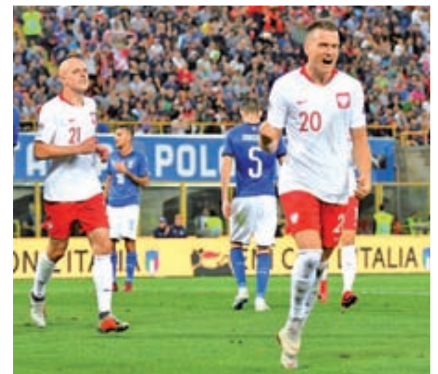
El Polonia-Italia del domingo será clave

El hecho de que la Liga A se reduzca a una selecta lista de 12 equipos y de que los grupos