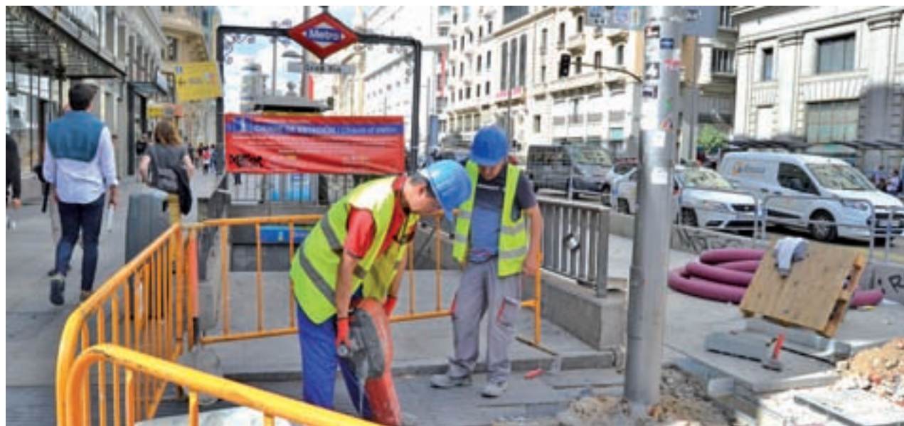
Varios obreros trabajan junto a una de las 'bocas' de la parada del suburbano

Sol confirma a GENTE que la previsión inicial de finalización, abril de 2019, se demorará alrededor de tres meses por el hallazgo de patrimonio en la ejecución del proyecto de mejora de la accesibilidad ● Será necesario bajar 12 metros más