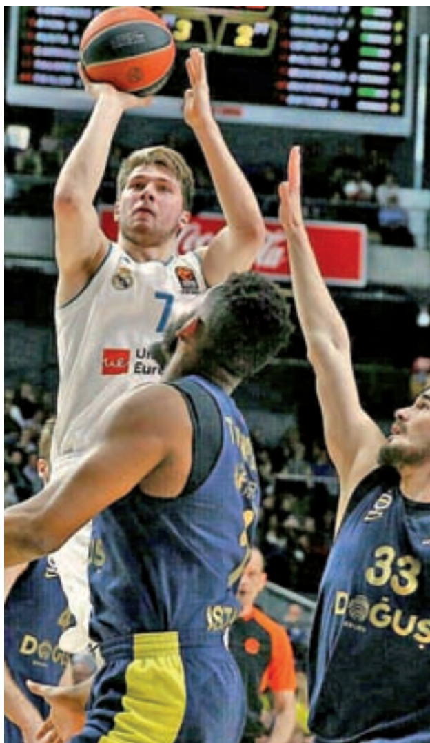
Doncic fue el MVP del año pasado

Para empezar, el Real Madrid defiende su corona con un proyecto basado en la continuidad, donde la principal incógnita es conocer cómo suplirá el equipo de Pablo Laso la sensible baja de Luka Doncic. Con el talento del esloveno al servicio de Dallas Mavericks, el Madrid ha optado por reforzarse con un tirador (el esloveno Prepelic), un alero polivalente (Gabriel Deck) y el regreso en el juego interior de un Kuzmic que se pasó prácticamente toda la temporada anterior en el di-