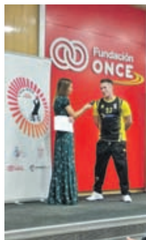
Presentación de la Liga

Su primer partido tendrá lugar este sábado 13 (19 horas) en la pista del Fundación Grupo Norte.