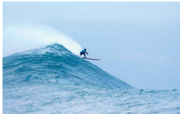
Surfero en las costas de Cantabria.

Organizada por el Ayuntamiento, la Mancomunidad de Municipios Sostenibles, la Consejería de Economía, Europe Direct Cantabria, el Punto de Información Europeo MMS, el Servicio Cántabro de Empleo y, el Fondo Social Europeo, Iniciativa Empleo Juvenil.