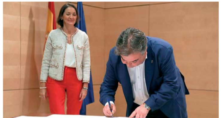
El alcalde de Noja, junto a la ministra de Industria, Comercio y Turismo.