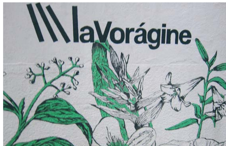
La campaña utiliza la plataforma de crowdfunding de innovación social Goteo.