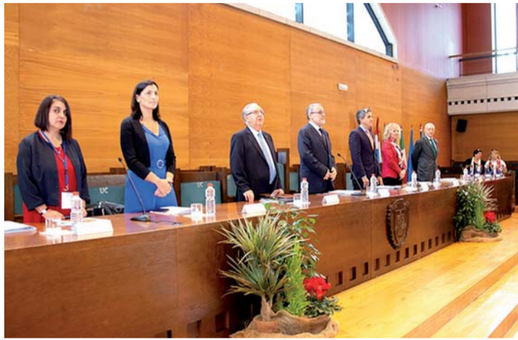
Momento de la jornada inaugural del curso académico de UNATE.