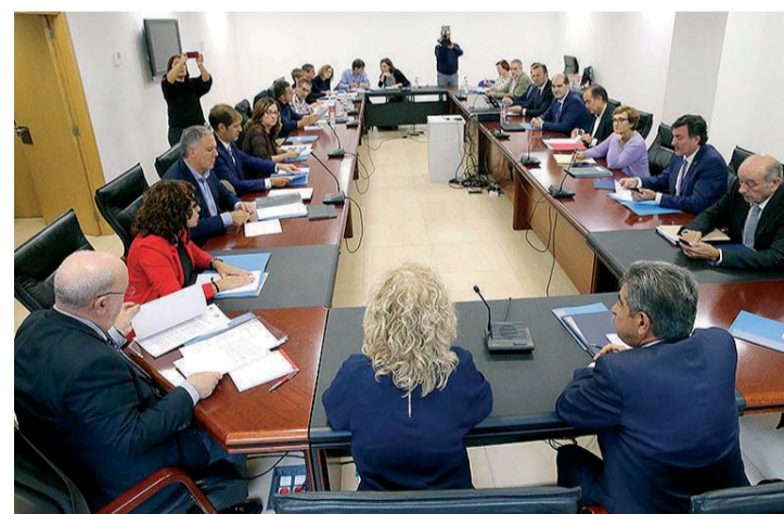
Mesa de Diálogo Social presidida por Revilla y Díaz Tezanos.