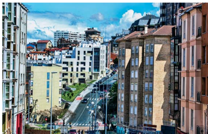
La rebaja del IBI en 2019 será de alrededor del 6%.

año destaca la reducción del IBI, tanto en la parte que fija la administración municipal (el tipo impositivo) como en la que viene dada por el Estado (el valor catastral). Así, en 2019 se reducirán los valores catastrales, una rebaja que se situará en torno al 3% y que repercutirá también en el cálculo del impuesto de la Plusvalía. Además, el Ayuntamiento aplicará para el próximo año una rebaja también del 3% en el tipo impositivo, de manera que se situará en el 0,445. Por lo tanto, con ambas medidas, la bajada real del IBI en Santander será de alrededor del 6% y, si a esta cifra se añade que no se aplica la subida del IPC correspondiente, que es el 2,2%, la bajada será del 8% por el efecto de los tres conceptos. Otro de los recibos que bajará el próximo año en la ciudad será el correspondiente a la tasa de basuras, que se reducirá un 3% y tampoco verá repercutida la subida del IPC. Junto a estas rebajas fiscales, en 2019 seguirán congelados el resto de impuestos, tasas y precios públicos. Asimismo, se mantendrán todas las bonificaciones y exenciones que