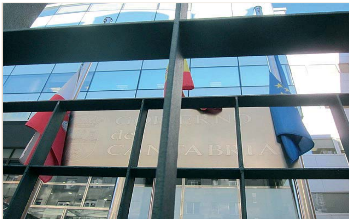
A unos meses de las elecciones autonómicas, las formaciones políticas dan sus primeros pasos en la carrera electoral.