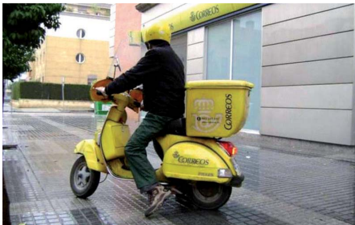
Las movilizaciones se iniciarán con un paro de tres horas el 14 de noviembre.

Según explicó, Cantabria tiene un peso del gasto por parte de las empresas muy reducido y un gasto en I+D+i en términos de PIB claramente inferior al conjunto del país y de la UE (0,8% frente al 1,19% y 2,03%, respectivamente), a pesar de que la participación de la educación superior y la inversión de las administraciones públicas en la región sea claramente superior en Cantabria.