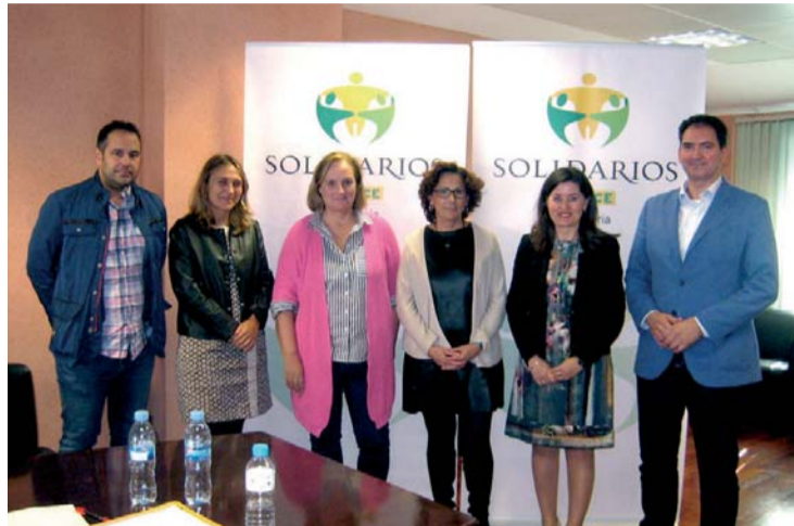
El jurado de los Premios Solidarios ONCE Cantabria 2018.

En la categoría de Institución, Organización, Entidad, ONG, el premio es para el Centro Hospitalario Padre Menni, hospital privado sin ánimo de lucro, perteneciente a la Congregación de las Hermanas Hospitalarias,