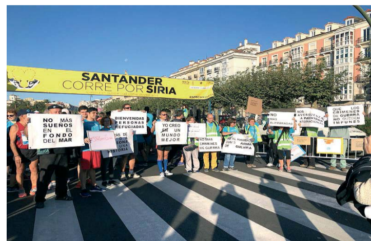
Imagen de la salida de la carrera el pasado año.