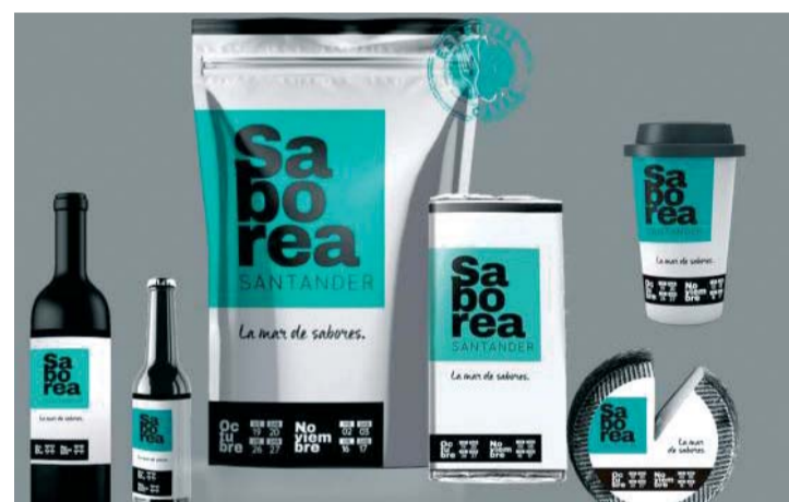
La iniciativa pretende poner el valor de la calidad en el comercio y la hostelería.