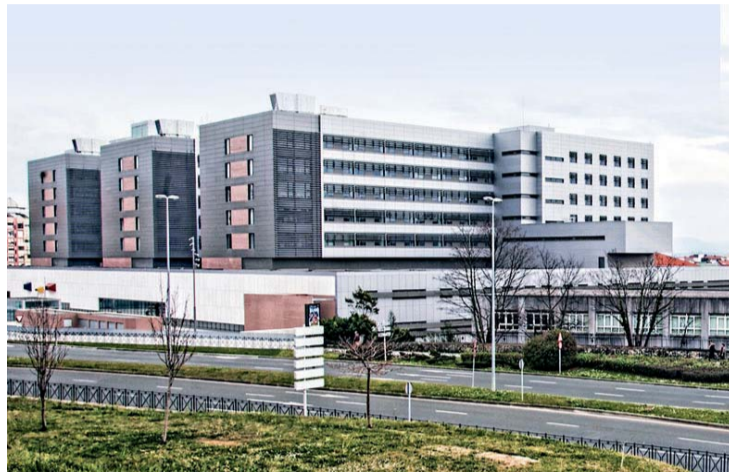
Los servicios no asistenciales cedidos ocupan a unos 1.400 trabajadores.

FeSP-UGT insta al "riguroso cumplimiento" de esta cláusula y pro-