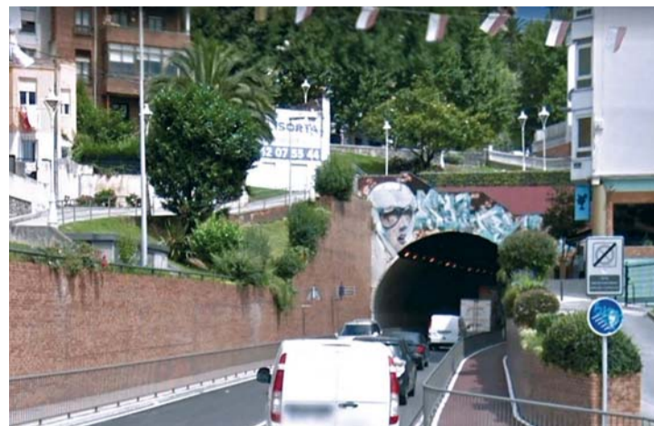
Las obras de reparación se estima que duren un mes y medio.