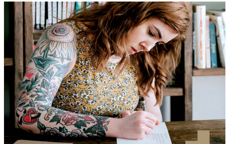
Imagen que ilustra el cartel de la convocatoria.