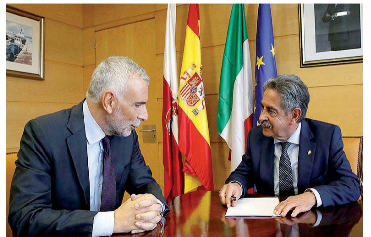
Stefano Sannino y Miguel Ángel Revilla, en un momento de la reunión.

va línea de colaboración que puede iniciarse entre Italia y Cantabria y que permitiría fortalecer la cooperación entre ambos territorios. El embajador italiano destacó la receptividad del presidente Revilla, así como la perfecta integración de la colonia de italianos residentes en Cantabria, que componen actualmente cerca de 800 personas.