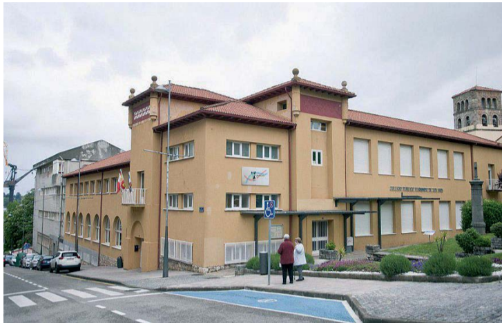
La concesionaria tiene diez días para acreditar el cumplimiento del contrato.

Entre las cuestiones que Integra debe justificar está la entrega a sus trabajadores de uniformes, calzado de seguridad y los medios ne-