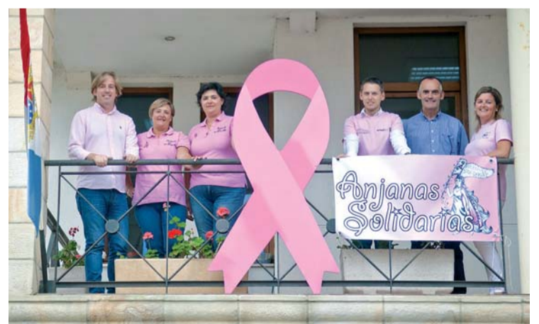
La jornada solidaria está organizada por Anjanas Solidarias.

horas en el Auditorio con el reparto gratuito de pañuelos rosas como símbolo de la lucha contra el cáncer de mama. La recaudación de fondos se hará a través de la venta de papeletas para el sorteo de regalos donados por comerciantes y empresas de la zona.