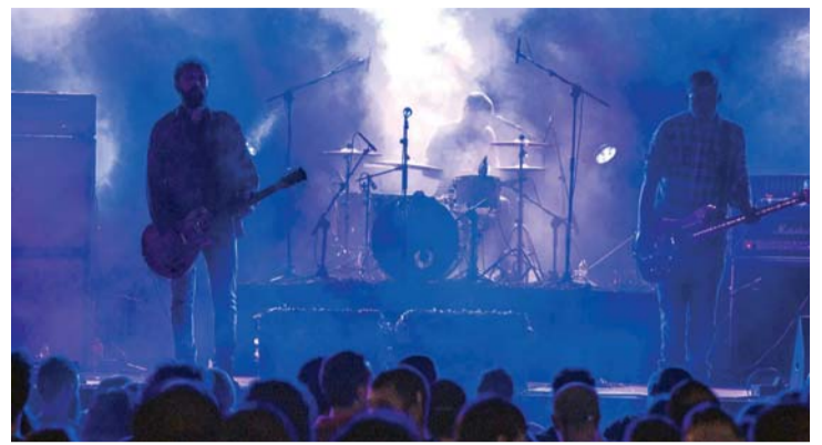
Se destinan 13.000 euros para las ayudas.