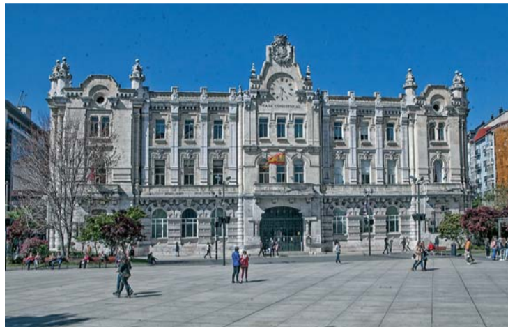
Ayuntamiento y sindicatos han consensuado la oferta pública de empleo.

Tal como informaba el Consistorio esta semana, la oferta es fruto de la negociación y el consenso con las secciones sindicales.