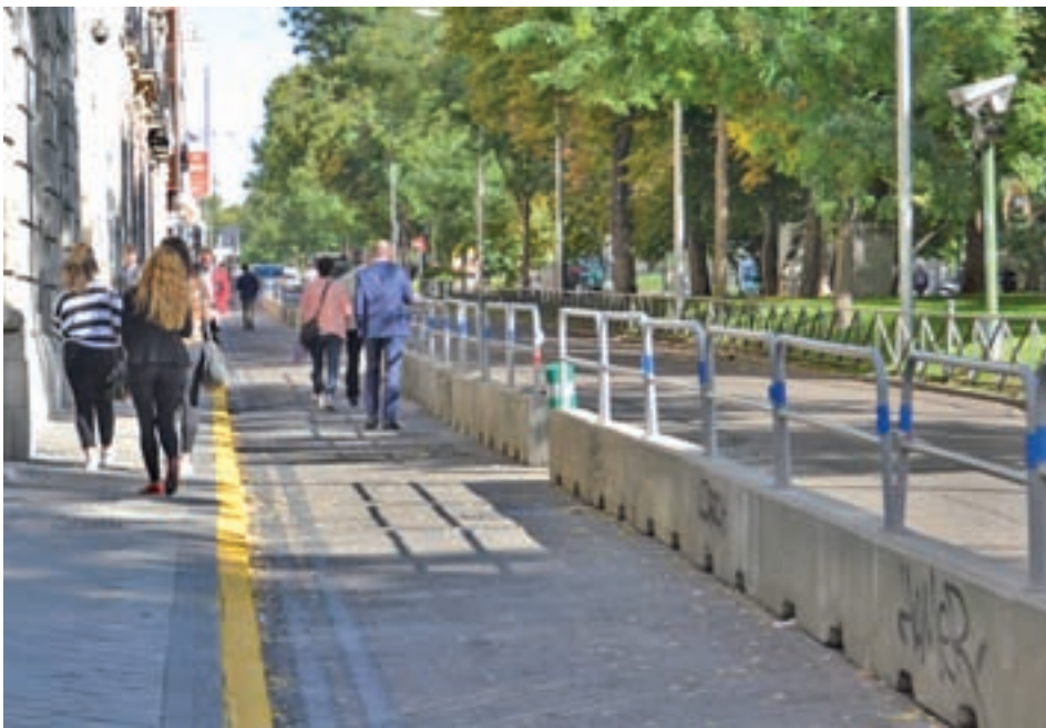
Ampliación de la zona peatonal en Recoletos