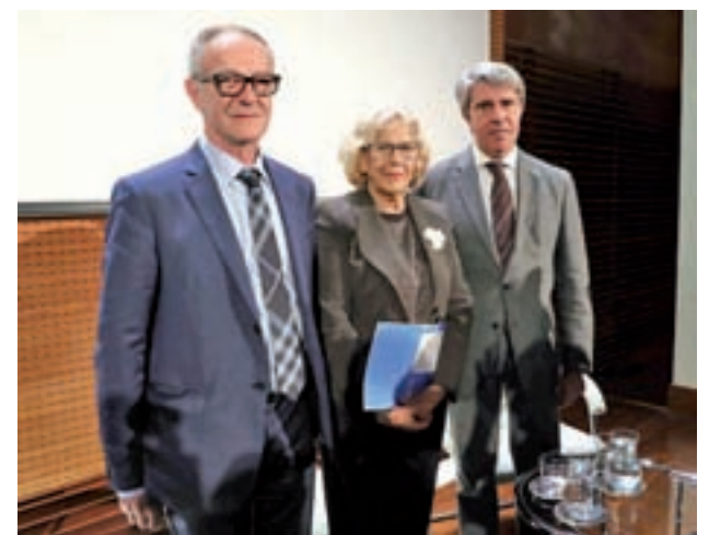
Carmena, Garrido y Guirao, en la presentación del Consejo

Para ello, se centrará en la vigilancia y el control de estacionamientos en pasos de peatones y aceras, de los límites de velocidad establecidos y de los semáforos, entre otros aspectos.