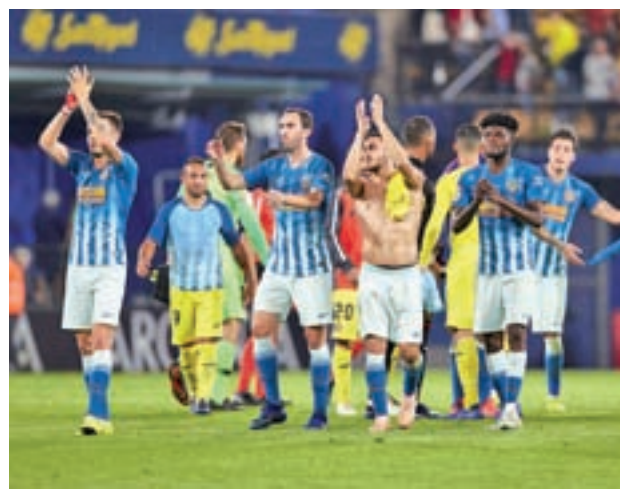
El gol de Filipe no fue suficiente para ganar en Villarreal

En medio de estas pequeñas dudas, el Atlético regresa este sábado 27 (20:45 horas) al Wanda Metropolitano para recibir a la Real Sociedad, en un partido de reencuentros, ya que no hay que viajar demasiado en el tiempo para