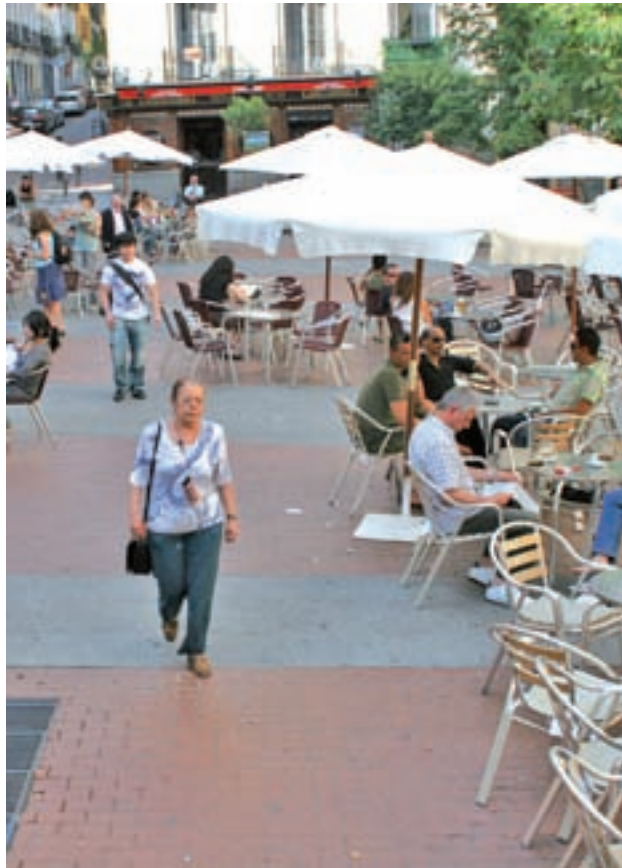
Los vecinos de Chueca presentaron una denuncia

Fuentes del área de Desarrollo Urbano Sostenible explicaron que la concesión de licencias es “un acto reglado”,