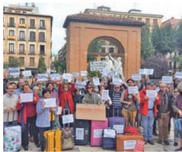
Los vecinos se concentraron el pasado sábado día 20

y que “no hay nada de discrecionalidad en ello”. “Todos estos locales tienen que cumplir las mismas normas de seguridad, insonorización... todas iguales”, indicaron. Además, recordaron que el Consistorio presentó alegaciones a la modificación del Catálogo de Espectáculos Públicos de la Comunidad.