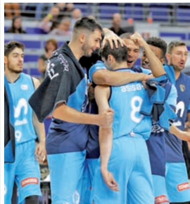
Los colegiales regresan al WiZink Center

También pasará por el escenario la boxeadora Joana Pastrana Galindo, doble campeona de Europa en peso mínimo en los años 2016 y 2017, quien recibirá su premio de manos de otra campeona como Gema Hassen-Bey, triple medallista paralímpica en esgrima en los Juegos de Barcelona '92 y Atlanta '96. Y hablando del pasado, habrá una mención especial para Aurora Pérez Gutiérrez, pionera en el atletismo con multitud de récords a nivel nacional y mundial.