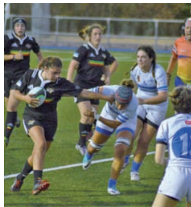
Primera victoria de las 'dragonas'