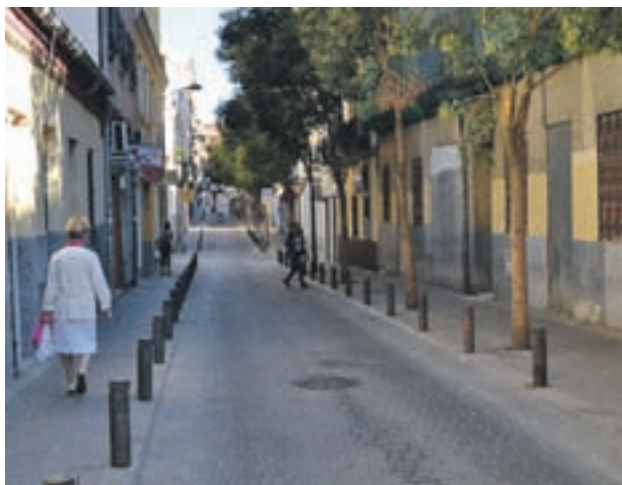
La calle de Topete, en el barrio de Bellas Vistas

Las llamas se originaron en el interior de uno de los tres pisos de un bloque de cinco alturas. Los bomberos del Ayuntamiento accedieron al interior de la vivienda, que contaba con una puerta blindada, mediante un butrón realizado desde el piso contiguo. Al lugar se trasladaron 10 dotaciones para la extinción de incendios, así como agentes de la Policía Municipal, que se encargaron de regular el tráfico para facilitar las labores de los bomberos.