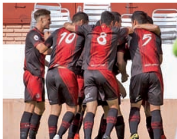
El Adarve ya está en la zona templada de la tabla

Una categoría por debajo se encuentran otros dos representantes de la zona Norte de la capital, aunque, eso sí, el momento de forma que atra-