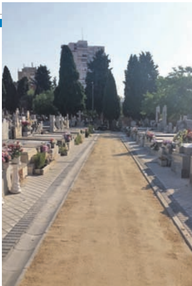
Uno de los espacios del recinto funerario hortalezino

“El 22 de mayo de 2018 se aprobó una inversión de 130.093 euros para el cementerio de Canillas y sin embar-