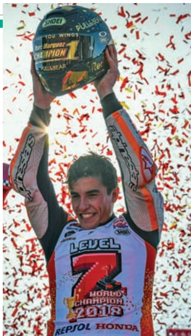
Marc Márquez celebró por todo lo alto su título

Por el momento, ya ha igualado a los británicos John Surtees y Phil Read, aunque ninguno de ellos, tampoco Valentino Rossi, había llegado al pentacampeonato en la