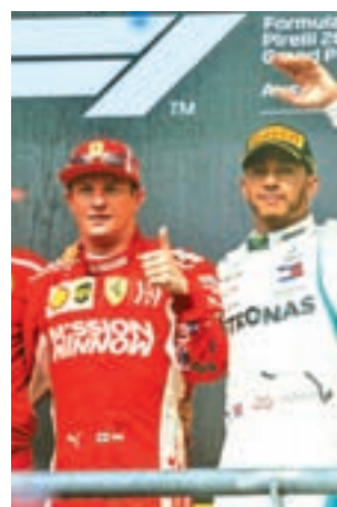
Raikkonen fue el vencedor

Eso sí, la ambición de Márquez aún descubre nuevos alicientes en la presente temporada. Este domingo (5 horas) llega a Phillip Island (Australia) con la posibilidad de batir su propio récord de puntos en una sola campaña. Por el momento, su tope en MotoGP está en las 362 unidades sumadas en 2014, una cifra de la que actualmente le separan 66 puntos, una distancia importante que rebasará con dos triunfos y un segundo puesto. En esa comparación no superará las 13 victorias logradas entonces.