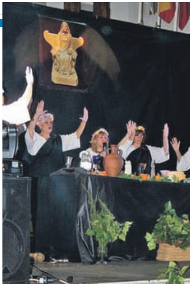
Samhain del año pasado en Pinto

Con el objetivo de recuperar y explicar el origen de estas tradiciones, la Wicca de Tradición Celtíbera, en colaboración con el Ayuntamiento de Pinto, organiza un acto religioso y festivo el próximo miércoles 31 de octubre por la