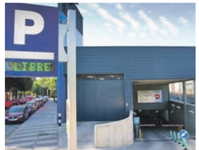
Aparcamiento de la calle Buenos Aires

La instalación, construida a finales de 2009, contemplaba 122 plazas de uso municipal que no han llegado a ser utilizadas nunca por diversos desacuerdos y litigios entre el Consistorio y la empresa. Estos problemas terminaron en noviembre de 2016, cuando ambas partes llegaron a un entendimiento.