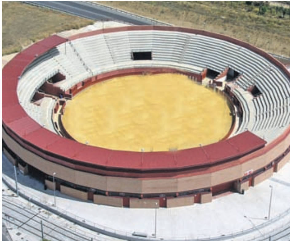
Plaza de toros de Parla

La magistrada, en un auto fechado a 25 de julio de 2018, considera que, tras sucesivos requerimientos, esa sentencia no se ha ejecutado y responsabiliza de ello al alcalde, al que impone esa multa mensual de 300 euros "hasta el completo cumplimiento del fallo". En el auto se critica la "actitud pasiva" del Consistorio a la hora de presentar alegaciones para no pagar,