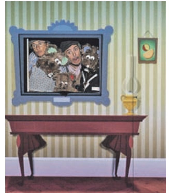
'EL RATONCITO NO NACE, SE HACE': Un espectáculo de títeres basado en el cuento que el Padre Coloma escribió el rey Alfonso XIII a principios del siglo XX, que habla de que cuando nacemos y vamos creciendo afrontamos muchas decisiones que nos convierten en lo que somos.

>> 27 de octubre | 20 horas | Teatro de El Bosque | Precio: 15 euros