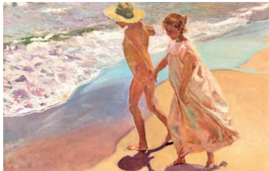
La sencillez de un paseo en la playa se refleja en los trabajos de los creadores españoles

La muestra, 'Redescubriendo el Mediterráneo', forma parte del proyecto internacional 'Picasso- Mediterráneo'. Se trata de una iniciativa del Musée National Picasso de París y que incluye exposiciones, actividades e intercambios científicos entre más de setenta instituciones de todo el mundo.