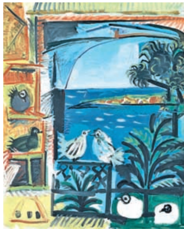
En Francia, el paisaje era lo más importante

ADOPTARON ESTE MAR COMO UNO DE LOS MOTIVOS PRINCIPALES DE SU COMPOSICIÓN