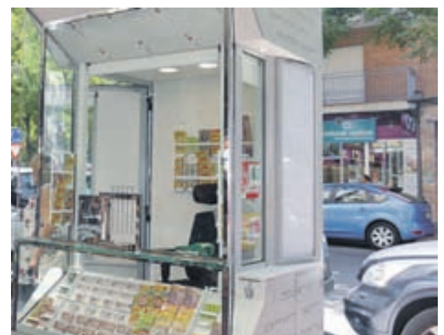
Nuevo modelo de quiosco

En este sentido, la ONCE quiere fortalecer el contacto con el cliente, "que tiene máxima importancia", así como con el vendedor, "puesto que se van a eliminar las barreras visuales entre éste y el espacio de su alrededor".