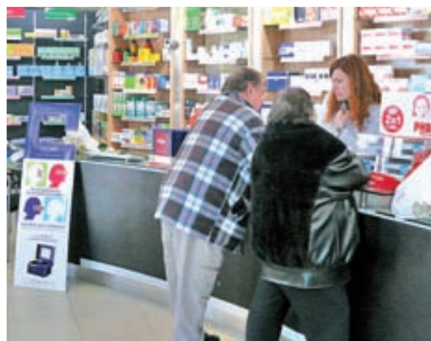
La receta electrónica será válida en cualquier farmacia

Por otro lado, también señaló que el modelo único de prescripción de medicamentos podría estar implantado en un mes, lo que permitirá