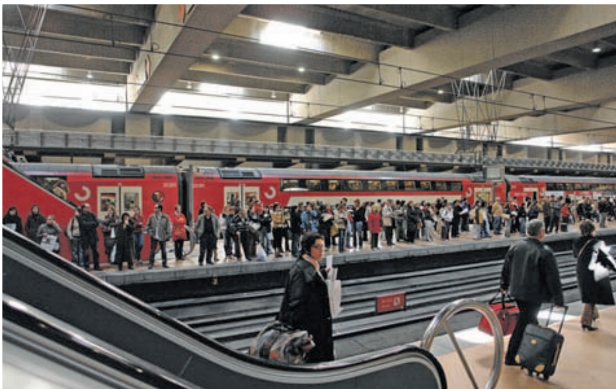
Estación de Cercanías de Atocha GENTE