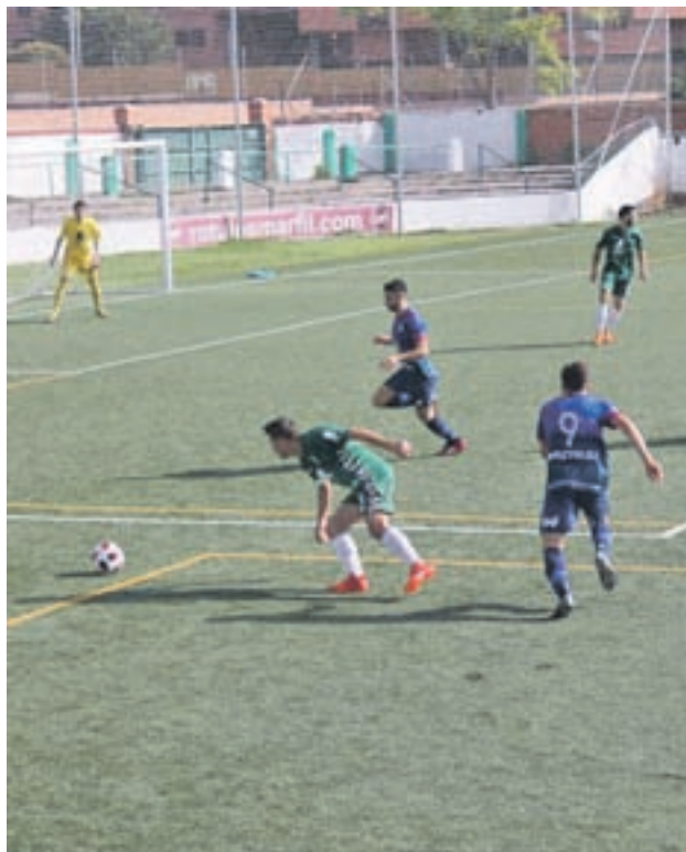
El Móstoles, en uno de sus partidos

Tampoco hay que pasar por alto que tres de las derrotas fueron dentro de las cuatro