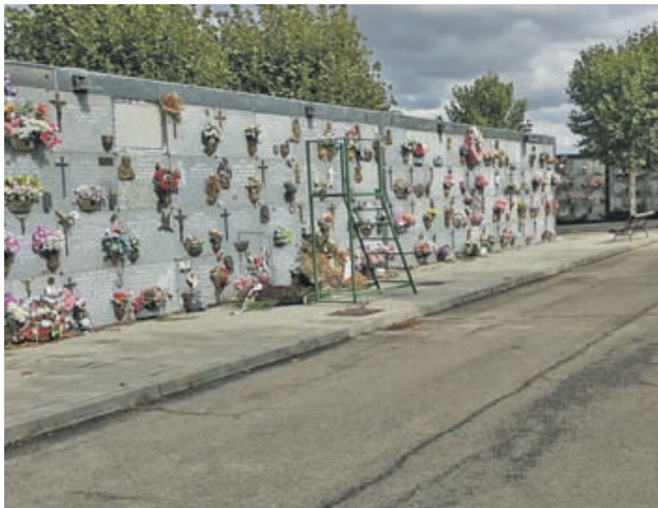
Una de las vistas del cementerio

EL HORARIO DE APERTURA SERÁ EL HABITUAL, DESDE LAS 9 A LAS 18 HORAS