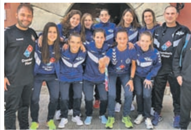
Las jugadoras, antes de uno de sus encuentros PRENSA CLUB

El Ciudad de Móstoles FS se enfrentará a domicilio al Club Inter Movistar F.S.B. este sábado 27 de octubre, en la que será la séptima jornada del Grupo IV de Segunda División B. Los mostoleños ostentan una tercera posición, al acumular 13 puntos, los tres últimos conseguidos tras una importante victoria (8-2) ante el equipo murciano del Zambú CFS Pinatar. Los primeros 20 minutos de la contienda fueron muy igualados, y la primera parte finalizó con una mínima ventaja local en el marcador de 2-1. Fue tras la reanudación del encuentro cuando los mostoleños mostraron su juego sumando otros seis tantos. Su próximo rival, el Inter B, ocupa la decimotercera posición, después de perder ante el Nueva Elda F.S. por 2-1.