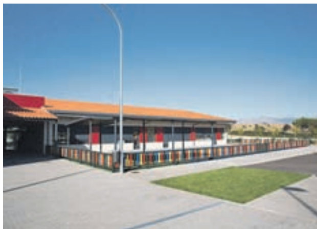
Colegio Héroes del 2 de Mayo

Además, el Consistorio ha indicado que ya han empezado los trámites para la tercera y última fase de la renovación. Con todo, la Comunidad ha trasladado a Colmenar su firme compromiso de "reanudar cuanto antes" las obras