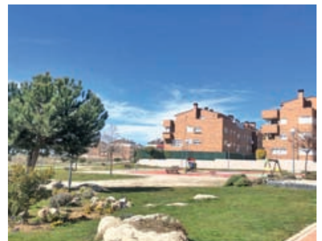
Estado actual del parque

Blázquez ha añadido que, para poder acometer el proyecto, serán trasplantadas a una zona verde aledaña los dos pies arbóreos existentes actualmente en el lugar que ocupará la futura pista deportiva.