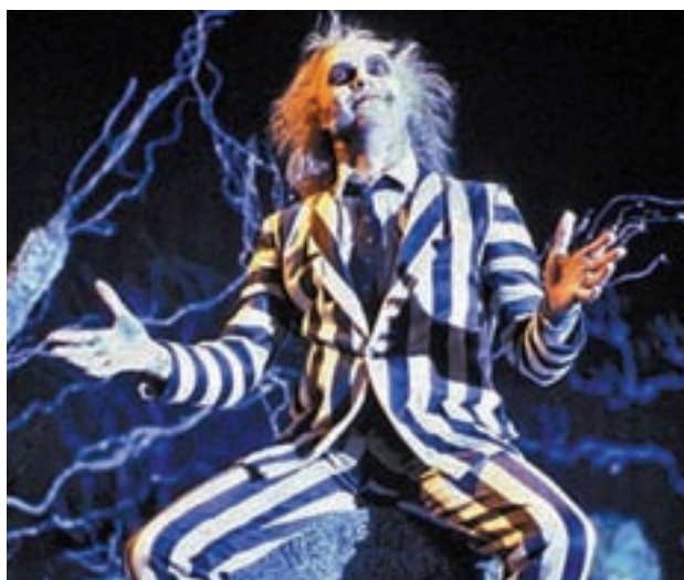
'BEETLEJUICE': El Palacio de la Prensa va a ofrecer un pase único de la película de culto 'Beetlejuice' de Tim Burton con motivo de su 30 aniversario. La cinta, que se ha remasterizado para la ocasión, narra las peripecias de un excéntrico exorcista. >> Palacio de la Prensa | 31 de octubre | 6 euros