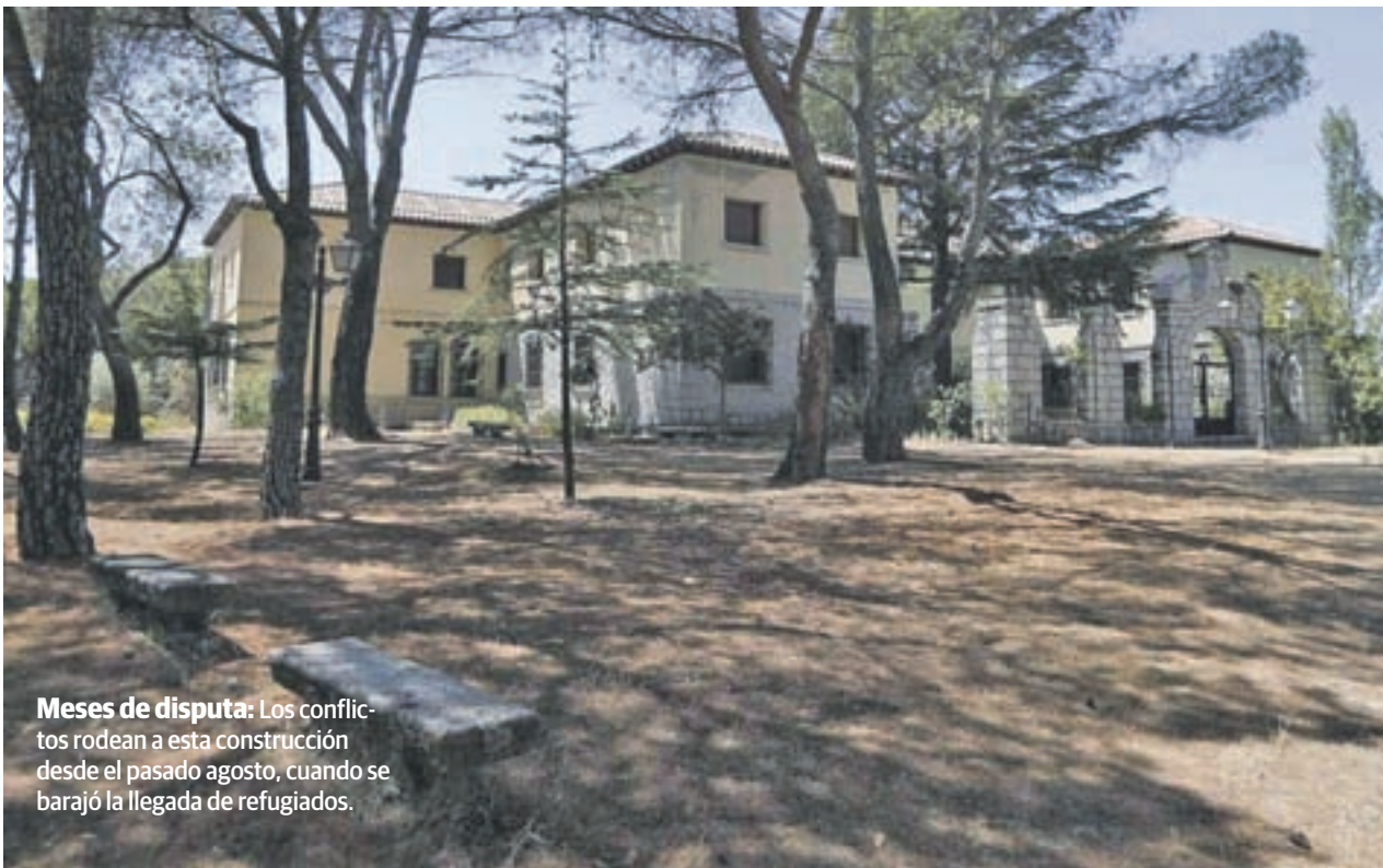
Meses de disputa: Los conflictos rodean a esta construcción desde el pasado agosto, cuando se barajó la llegada de refugiados.