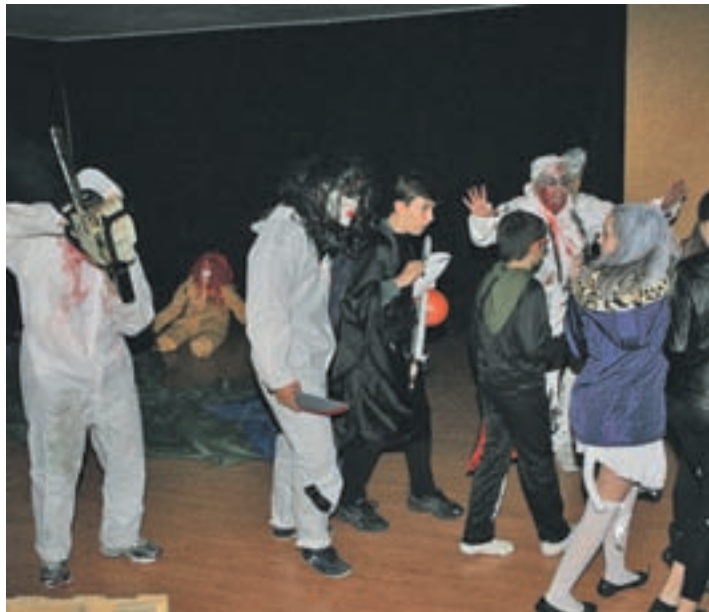
Pasaje del terror de Tres Cantos

Por ejemplo, en Colmenar se va a celebrar el viernes 26 y el sábado 27 un juego interactivo en el que un grupo de personas entrará en un cementerio para fingir ser enterrados vivos. Después tendrán 60 minutos para, a través