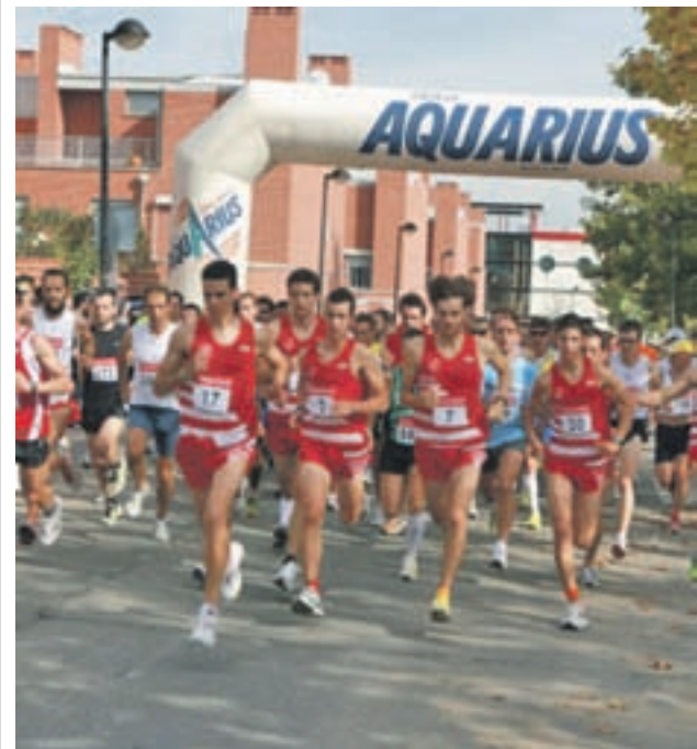
La anterior convocatoria

El objetivo de que haya diferentes categorías, han explicado, es que todos los deportistas de Madrid puedan sumarse al evento, independientemente de su condición física.