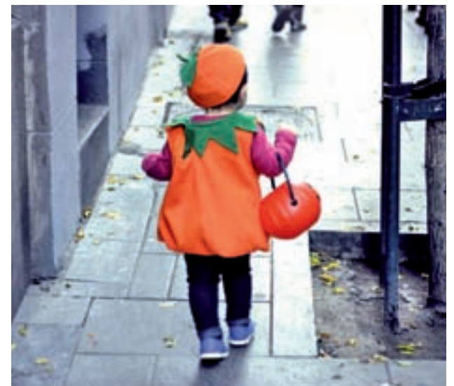
TRUCO O TRATO: La asociación de comerciantes Vive Malasaña en colaboración con los diferentes AMPAS de los colegios de la zona ha organizado un desfile en el que los más pequeños recorrerán los diferentes establecimientos para conseguir caramelos. >> Barrio de Malasaña | De 17 a 20 horas | Gratuita