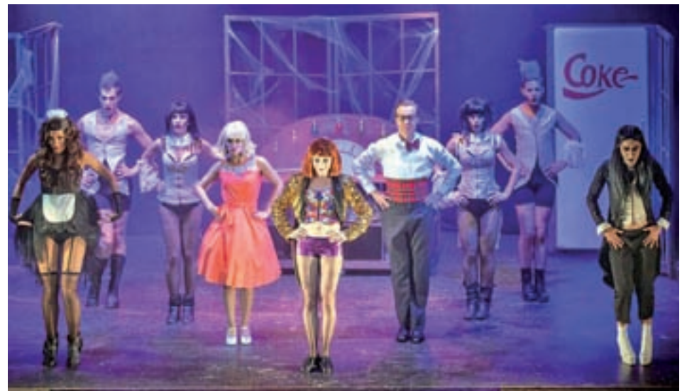
'ROCKY HORROR SHOW': El musical de Richard O'Brien, 'Rocky Horror Show', regresa a los escenarios madrileños. Desde su estreno en junio de 1973 en el Royal Court Theatre la obra se ha convertido en el musical de rock 'n' roll más reconocido en todo el mundo. La historia, llena de misterios y risas, cuenta las vivencias de una pareja de prometidos en el castillo de Fran 'N' Futer. >> Gran Teatro Bankia Príncipe Pío | 31 de octubre, 8 de noviembre y 5 de diciembre | Desde 25 euros