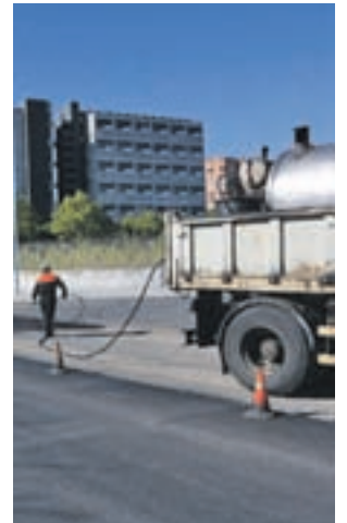
Trabajos de asfaltado

Desde el Consistorio han indicado que el objetivo de este proyecto es mejorar el pavimento que se encuentra "más deteriorado", así como reforzar la accesibilidad, para lo que se van a eliminar las ba-