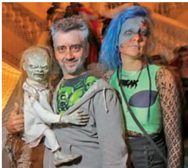
VERBENA EN UN ENTORNO ÚNICO: La empresa de eventos, Cocorico Madrid, vuelve a presentar, un año más, su tradicional fiesta de Halloween en el emblemático Círculo de Bellas Artes acompañada de la mejor música y animación. >> Círculo de Bellas Artes | 31 de octubre | Desde 20 euros

Esta fiesta tiene su origen en los festejos de Samhain que conmemoraban el fin del verano y la llegada del 'Año Nuevo Celta'. De acuerdo con sus creencias en esta época se estrechaba la línea entre los dos mundos, el de los vivos y los muertos, con lo que permitía a los espíritus dejarse ver.