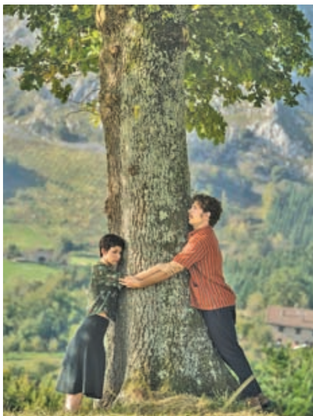
Una muestra del lenguaje conceptual de Julio Medem

Otro de los reclamos para que el público se decante por esta película está en un reparto estelar, mezcla de jóvenes