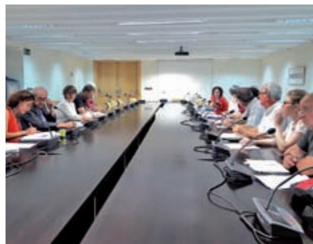
La constitución de la comisión de La China, en julio de 2017

"Durante este verano hemos sufrido olores como nunca y mosquitos y mosca negra cada vez más agresivos. El olor ha sido de tal intensidad y persistencia que ha llegado a un grado de podredumbre que ha superado lo conocido", describen desde el colectivo vecinal. Los residentes exigen la implicación de la Comunidad y del Ayun-