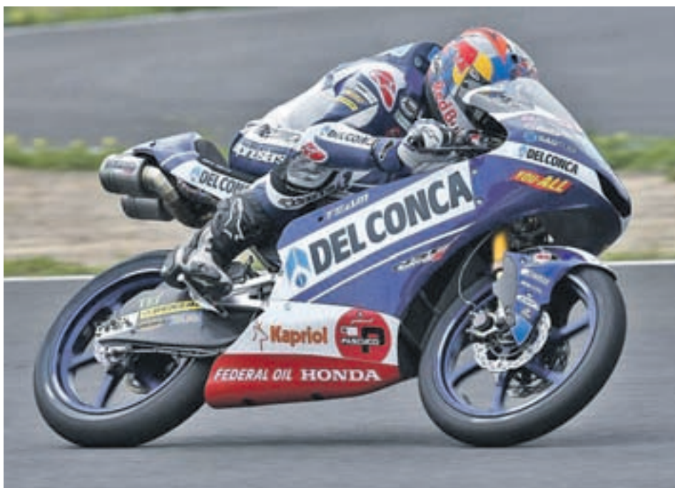
Martín sólo pudo ser quinto en el Gran Premio de Australia