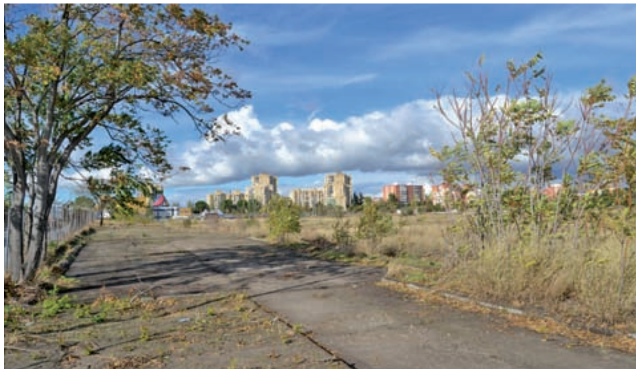
ANA CID / GENTE

Cibeles aprueba el decreto que confirma la entrada en vigor del área de prioridad residencial el 30 de noviembre • El PP presenta un recurso para paralizarla