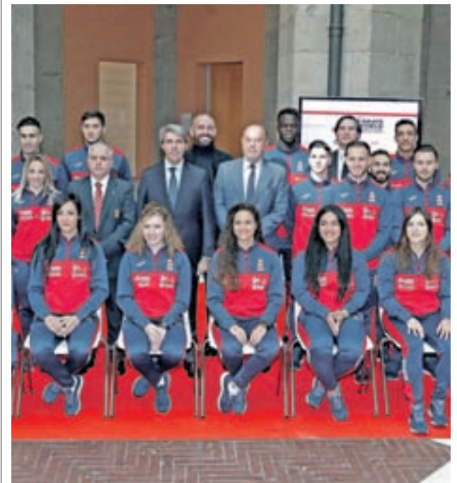
Foto de familia en la presentación

Respecto a las opciones españolas a la hora de conseguir medallas, las miradas estarán puestas en Sandra Sánchez y Damián Quintero, número uno y dos del mundo, respectivamente, en la modalidad de katas.