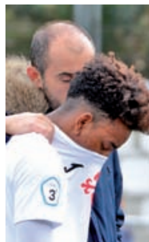
Dudas en el 'Cara'

Un puesto por encima del cuadro de Fuencarral se encuentra el Villaverde San Andrés. El conjunto entrenado por David Galán continúa con su buena dinámica tras arañar un empate de su visita al Atlético de Pinto (0-0), antes de recibir este domingo (11:30 horas) al Rayo Vallecano B.