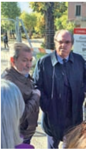
Un momento de la visita