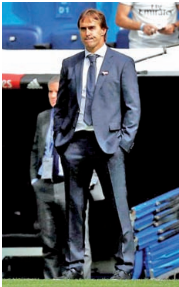
Lopetegui, en su último partido en el Bernabéu

El cese de Lopetegui era cuestión de horas, por lo que