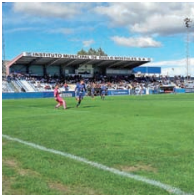
El Móstoles URJC, en uno de sus partidos

Los azulones llegan recuperados ya de su tropiezo de hace dos semanas, tras ganar por la mínima al C.D. Vicálva-