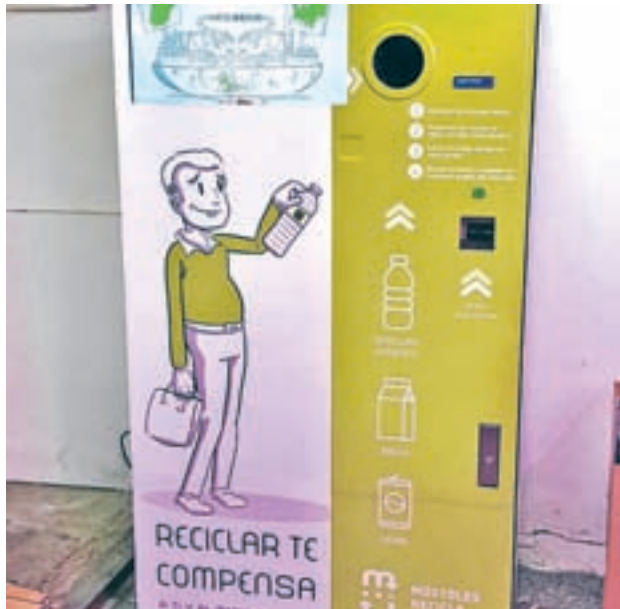
Máquina de 'vending'

¿Quién no ha escuchado nunca aquello de “que reciclen otros, que a mí no me pagan por hacerlo”? Acabar con esta forma de pensar es lo que pretenden conseguir desde el Ayuntamiento de Móstoles, que ha inaugurado el primer Sistema de Devolución de envases por Recompensa (SDR) en el Mercado de la Constitución. El objetivo es fomentar el reciclaje y sensibilizar a la población sobre la necesidad de gestionar los residuos. El dispositivo fun-