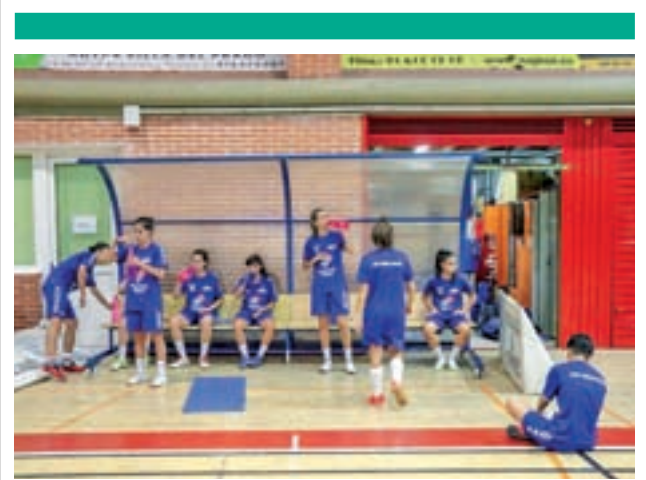
Las jugadoras, durante uno de sus entrenamientos

Si no cambia la racha, el Tres Cantos será un rival sencillo para los azulones, ya que no ha ganado ninguno de los once encuentros disputados hasta la fecha, sumando tan sólo tres empates y quedando en última posición.