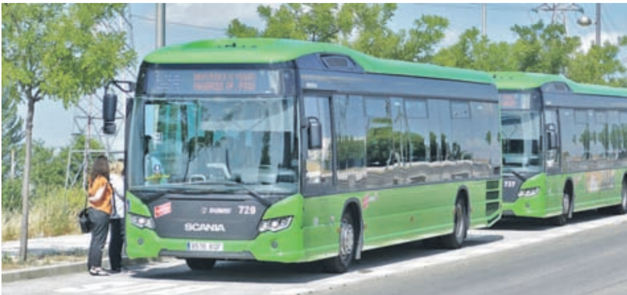
Línea 524, a su paso por el Pau-4