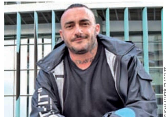
CHEMA MARTINEZ / GENTE

El artista madrileño disfruta del éxito de su disco ‘Corazón & X’, mientras prepara uno de sus retos más ambiciosos: el festival ‘Popland’ • En él actuará con la Fura dels Baus en el WiZink Center el 9 de marzo en un ambicioso montaje