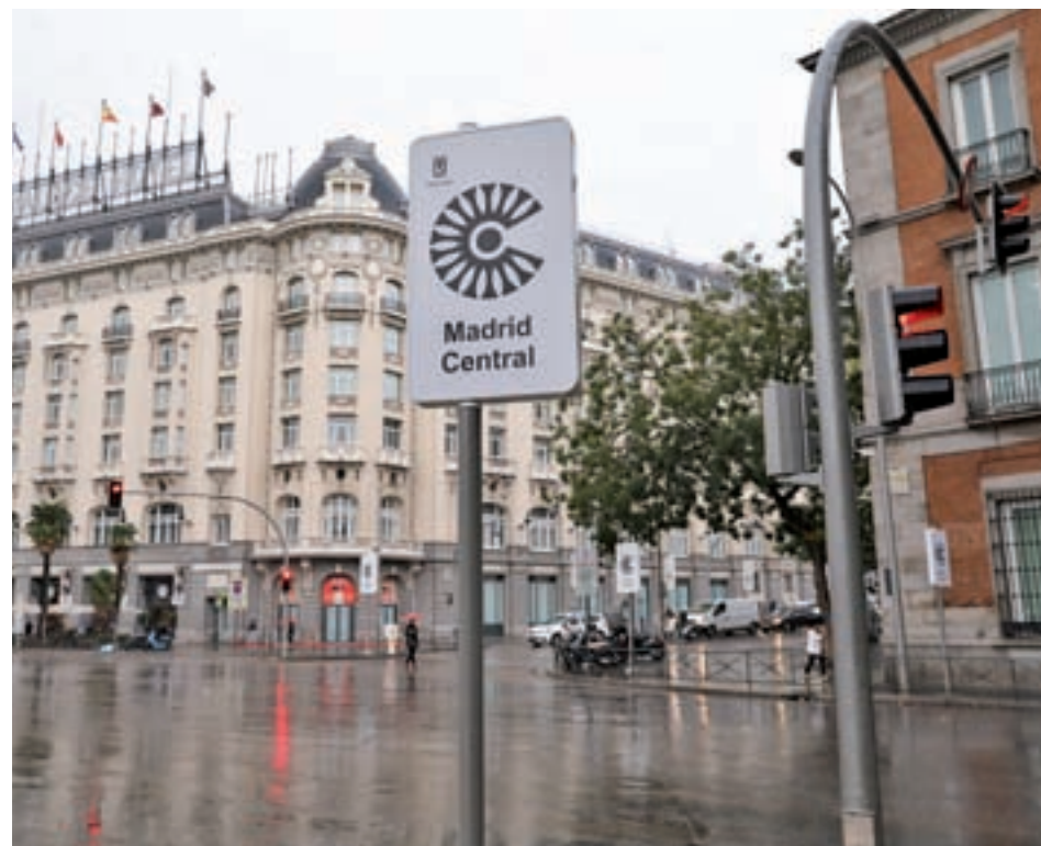
Una de las señales que delimitan el área de prioridad residencial