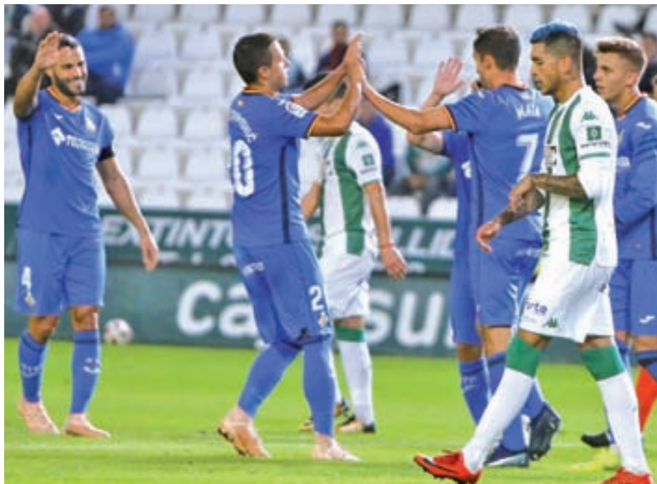
El Getafe, en su duelo ante el Córdoba