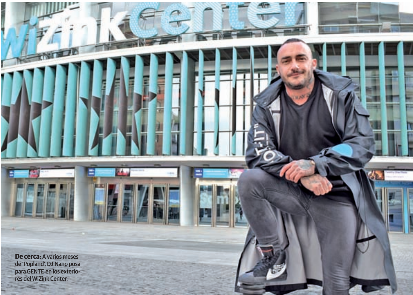
De cerca: A varios meses de 'Popland', DJ Nano posa para GENTE en los exteriores del WiZink Center.

"SI DEFINIERA 'POPLAND' DIRÍA QUE ES UN CONCIERTO DE BAILE"