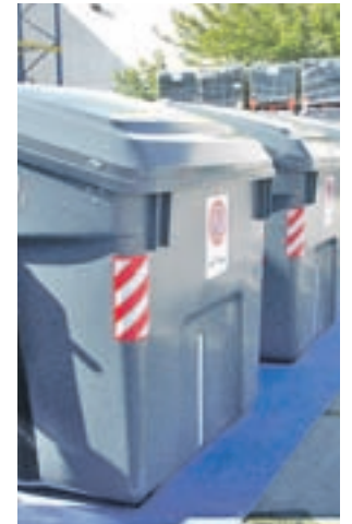
Contenedores de Getafe

La empresa municipal de limpieza de Getafe (LYMA) ha adjudicado el mantenimiento y sustitución de los 2.260 contenedores de basura, envases, papel-cartón y textil que hay en la ciudad durante dos años por cerca de 150.000 euros a la empresa Contener. El objetivo del contrato es reparar o sustituir los que estén deteriorados en el plazo máximo de 24 horas desde que sea comunicada la contingencia por parte de LYMA. También se incluirá la eliminación de pintura y grafitis, así como el repintado cuando sea necesario, junto