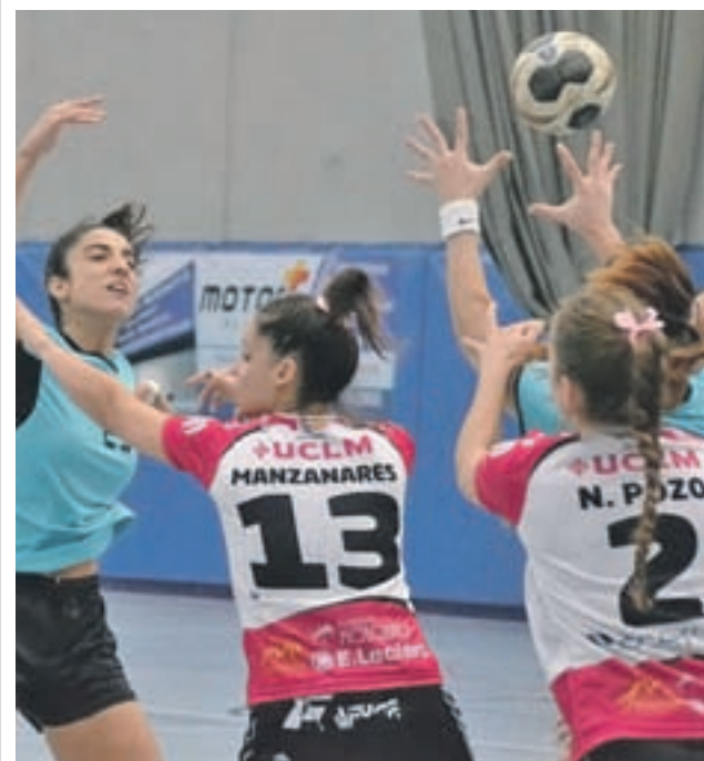
El Getasur, en un encuentro