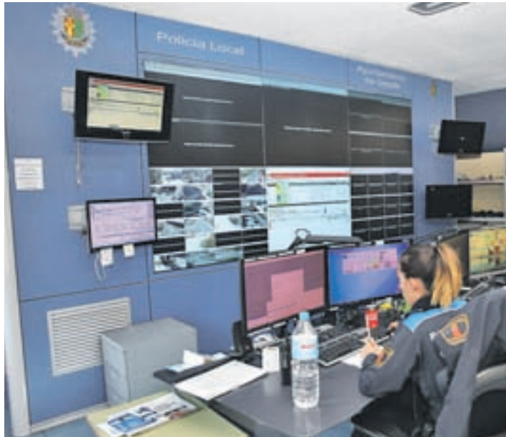
Centro de pantallas de la Policía Municipal

El pasado 1 de noviembre arrancaba la nueva unidad para la protección de víctimas de violencia de género y sus hijos, que está formada por 41 agentes de la Policía local de Getafe. Se trata de incremento de 27 policías con el que buscan ofrecer mayor cobertura, llegando a estar disponibles las 24 horas, los 365 días del año, en coordinación con la Policía Nacional. Según han explicado fuentes municipales, un punto importante es la hiperespecialización