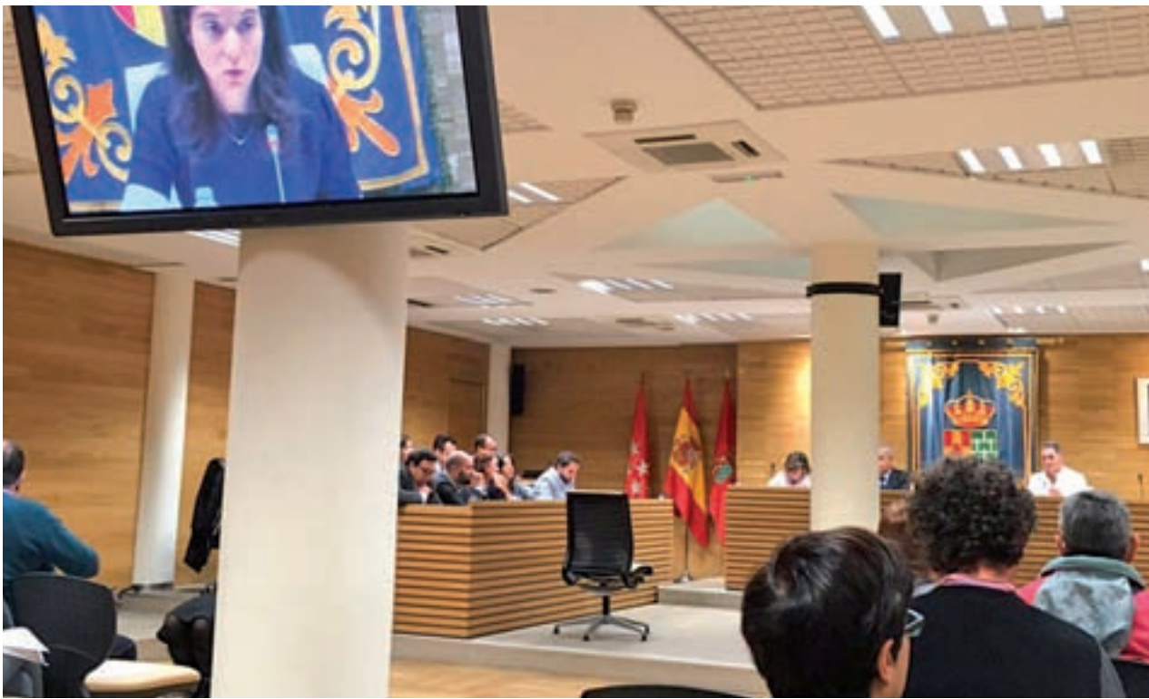
Un momento del Debate de Estado de la Ciudad