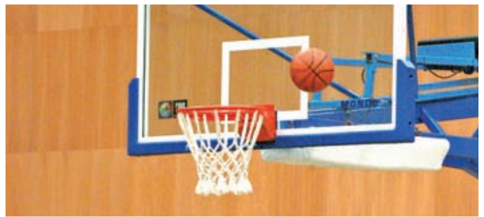
Permitirá también la práctica del baloncesto

No en vano, en quince años esta cifra casi se ha triplicado y la localidad no cuenta aún con un gran pabellón, tal y como define el Consejo Superior de Deportes a aquellos que pueden albergar, al menos, eventos con 2.000 espectadores.