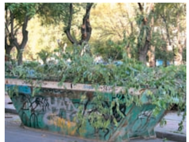
Restos de poda en un contenedor

Los restos de poda se presentarán troceados, con el fin de que ocupen el menor volumen posible. Deberán depositarse exclusivamente de 8 a 15 horas y sólo serán restos de poda y residuos vegetales, no mezclados con otros tipos de objetos domésticos o industriales.