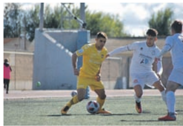
El San Fernando empató con el Alcobendas Sport

Por otro lado, el sorteo de los octavos de final de la Copa del Rey ha emparejado al Movistar Inter con el Naturpelle Segovia.