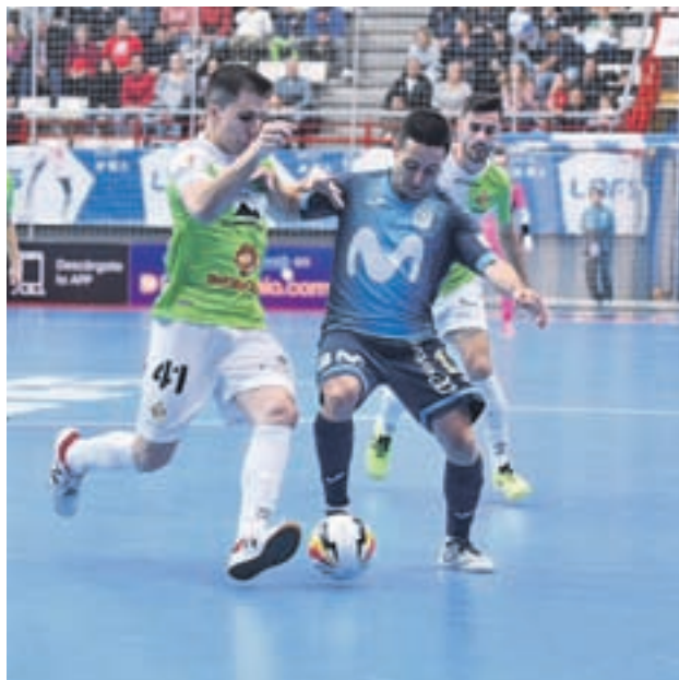
El Palma asaltó el Jorge Garbajosa (4-5) LNFS

La 2018-2019 no está siendo una temporada fácil para el Movistar Inter. La dureza del calendario inicial ha coincidido con una plaga de lesiones en el conjunto de Torrejón de Ardoz, una combinación que ha dado como producto una serie de resultados negativos para los hombres de Jesús Velasco. El último de ellos se produjo el pasado sá-