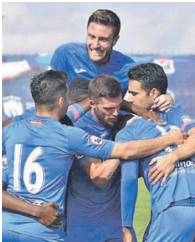
El CF Fuenlabrada, la pasada jornada CF FUENLABRADA

El cuadro azulón ha tomado velocidad en un mes en el que le ha tocado enfrentarse a filiales de equipos de ligas superiores (Las Palmas Atlético, Atlético de Madrid B y Real Madrid Castilla). Tres victorias que han hecho que llegue hasta la tercera plaza y opten al liderato del campeonato. Depende de los resultados de la Ponferradina y el Sanse, dos equipos que empataron la pasada jornada. Además, el filial blanco se encuentra a la espera para volver a la zona de 'play-off' por