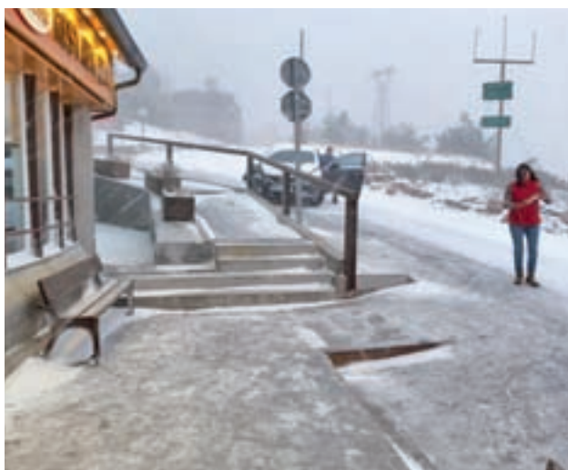
Nevada en el puerto de Navacerrada