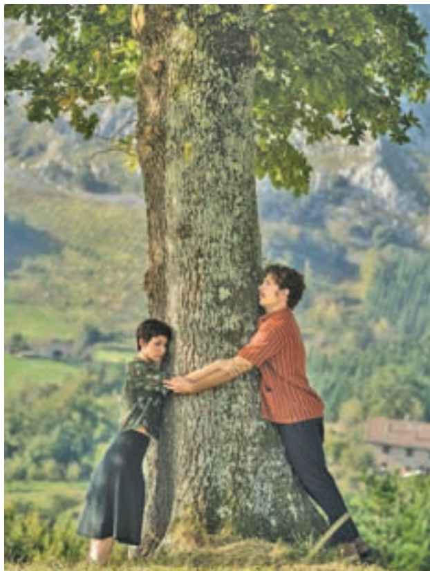
Una muestra del lenguaje conceptual de Julio Medem

Otro de los reclamos para que el público se decante por esta película está en un reparto estelar, mezcla de jóvenes