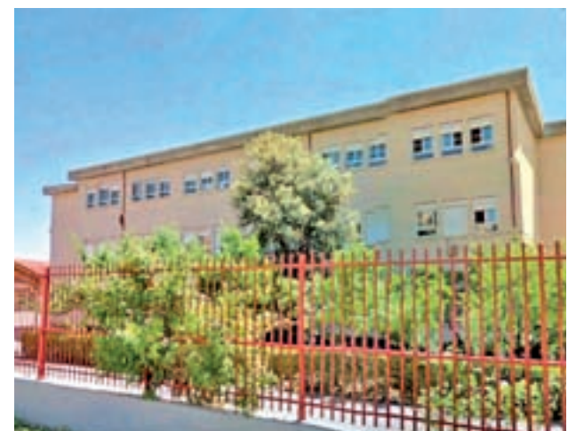
Colegio Público Velázquez

“El Ayuntamiento tiene la obligación de asegurar públicamente que el problema se ha erradicado”, precisó.