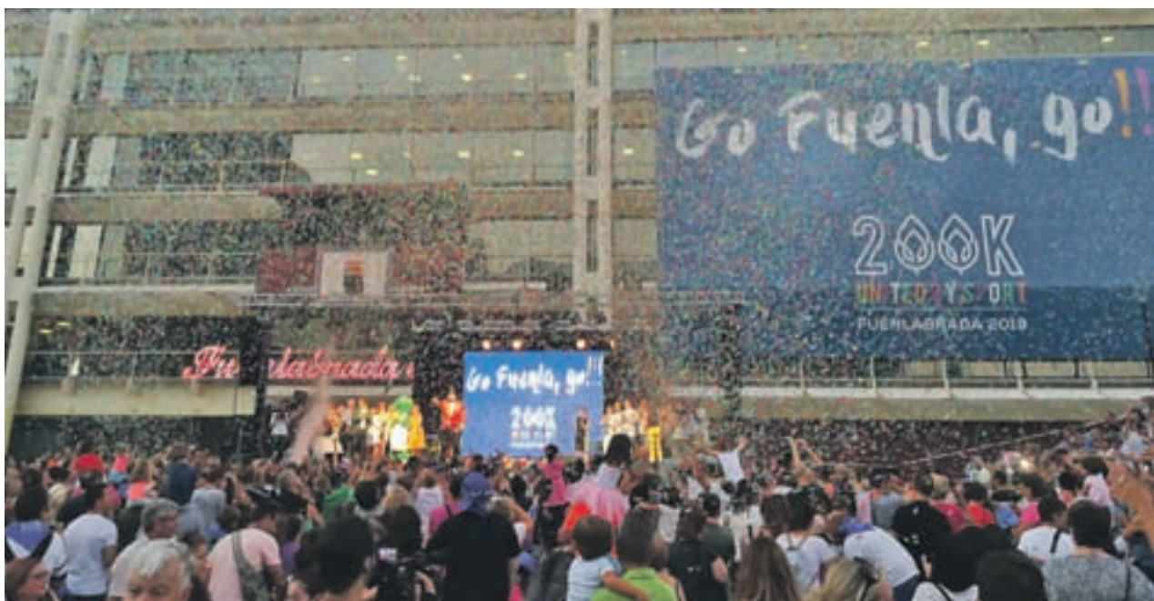
Presentación de la candidatura en las Fiestas de Fuenlabrada