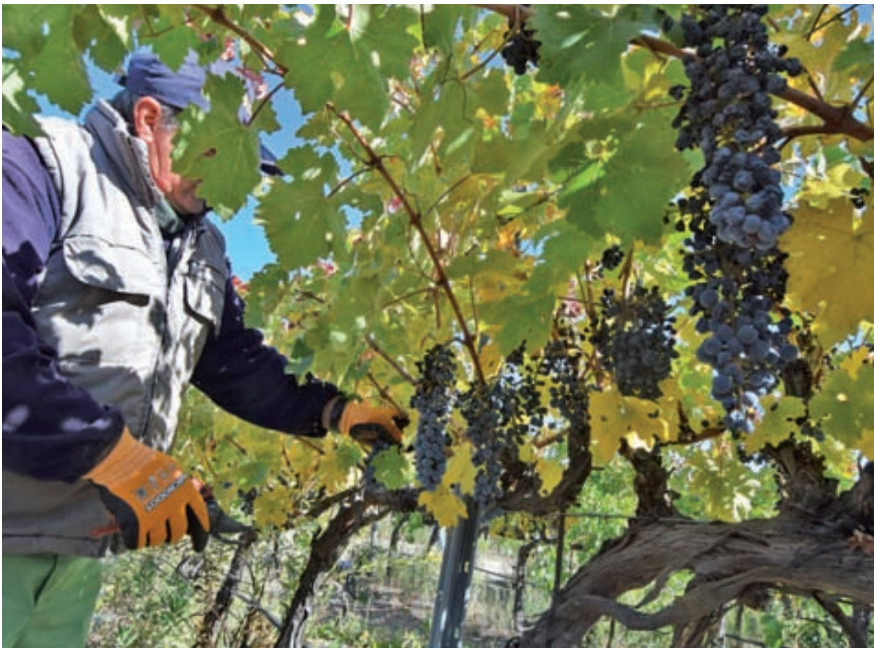
En Bodegas Licinia, la uva se recoge de forma manual