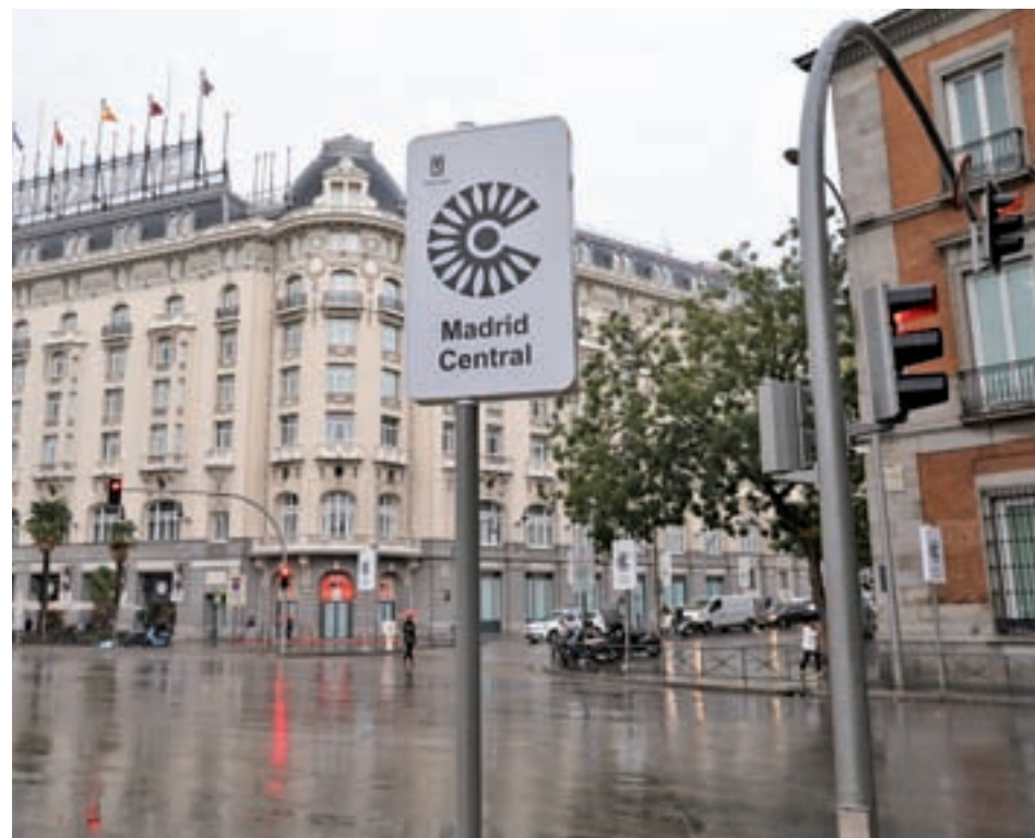
Una de las señales que delimitan el área de prioridad residencial