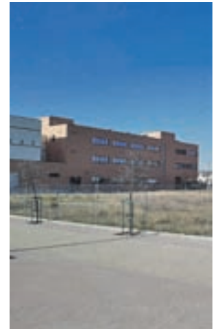
Explanada en El Vivero

“Entendemos perfectamente que las cuestiones administrativas llevan su tiempo, pero casi dos años de retraso nos parece demasiado”, ha explicado.