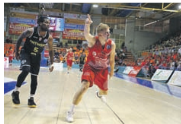
El Montakit, en un encuentro BALONCESTO FUENLABRADA

Los primeros partidos se celebrarán desde el próximo 8 de noviembre, mientras que la fase final tendrá lugar entre el 8 y el 23 de junio. Los polideportivos El Trigal, Fermín Cacho, La Cueva y Loranca acogerán los encuentros.