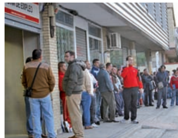
El número de parados subió en más de 52.000 personas

Por sectores, sólo se redujo en la construcción (-3.695 desempleados, -1,3%), y subió en el resto de sectores, principalmente en los servicios, donde el desempleo se incrementó en 43.219 personas (+1,9%). Le siguieron la agricultura (+9.301 parados, +6,6%), la industria (+2.821, +1%) y el colectivo sin empleo anterior (+548, +0,2%).