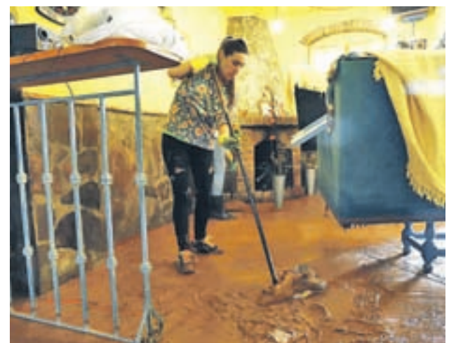
Los estragos causados por las lluvias han sido numerosos

Además, Carmen Calvo aprovechó su intervención para recordar a las 13 víctimas mortales, entre ellas un bombero que perdió la vida en Andalucía.