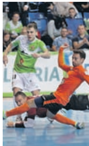
El Palma goleó al Aspil (5-0)

Para saber si está en condiciones de plantar cara a los grandes de la competición, el cuadro balear que dirige Antonio Vadillo deberá dar la cara en partidos tan exigentes como el de este sábado 10 (13:15 horas) en el Palau, una cancha donde se verá las caras con el segundo clasificado, el Barcelona Lassa.