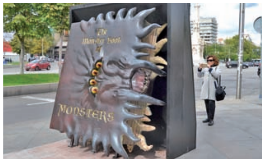
El Monstruoso libro de los Monstruos, ubicado en Colón