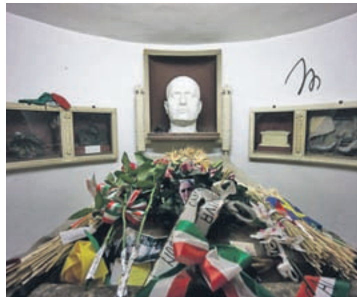
Lugar de peregrinación: La tumba del dictador rumano Nicolae Ceausescu (en el cementerio de Bucarest), y el panteón del italiano Benito Mussolini en San Cassiano (Italia) reciben la visita de numerosos nostálgicos aunque también de muchos curiosos.

Panteón familiar Los dictadores Benito Mussolini (Italia), Antonio de Oliveira Salazar (Portugal) y Augusto Pinochet (Chile), están ente-