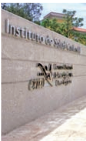
Instituto de Salud