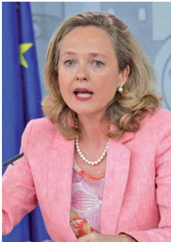
Nadia Calviño, ministra de Economía y Empresa

A pesar de este planteamiento, el Ejecutivo insiste en que la aprobación de los