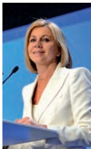
María Dolores de Cospedal

vo Nacional, pero no hace ninguna referencia a su escaño en el Congreso de los Diputados. Esta decisión se produce tras publicarse diversos audios de sus conversaciones con el excomisario José Manuel Villarejo.