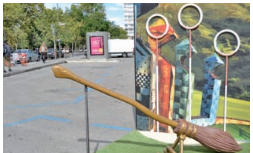
La escoba Nimbus 2000 está junto al Santiago Bernabéu