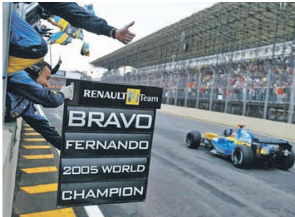
Alonso celebró su primer título mundial en Brasil

EL PILOTO ASTURIANO ACUMULA YA SEIS ABANDONOS EN ESTE MUNDIAL