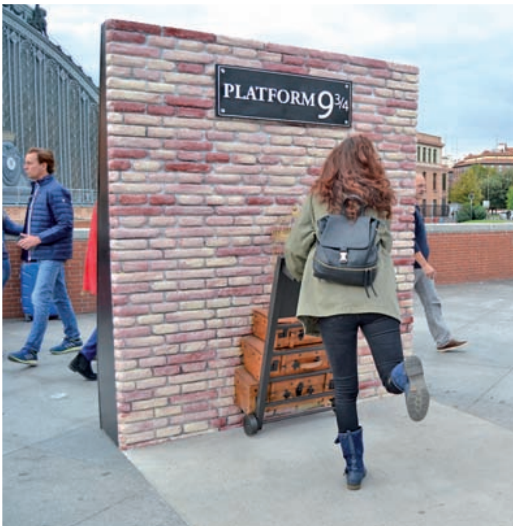
Andén 9 y 3/4 en Atocha