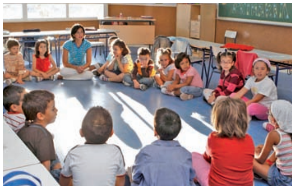
El Gobierno estudia una nueva reforma educativa