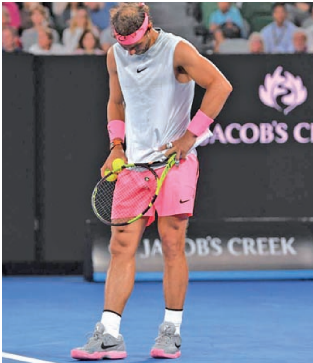
Nadal ha ganado cinco títulos en esta temporada

en los últimos días. El regreso del manacorí en el Masters 1000 de París servía para poner el punto y final a más de un mes de inactividad, pero la alegría duró poco, ya que unas molestias en la zona abdominal le obligaban a retirarse del torneo galo sin haber llegado a pisar la pista de París-Bercy. Esa dolencia se ha prolongado durante un