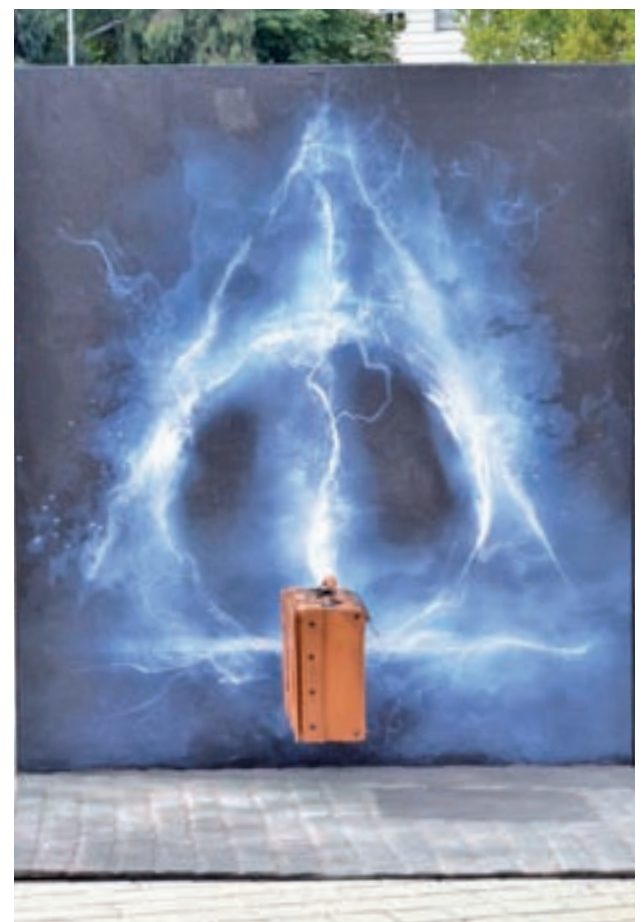
RELIQUIAS DE LA MUERTE: Esta imagen tendrá un especial protagonismo en la nueva película 'Animales fantásticos: Los crímenes de Grindelwald', que se estrena el próximo viernes 16 de noviembre en España.

Con el hashtag #MadridCiudadMágica, los vecinos y visitantes podrán subir a Instagram las fotos que se hagan con los escenarios, algunos de los cuales ya visitaron la ciudad hace alrededor de un año. "Asociar Madrid a la fantasía y a la imaginación es muy importante", aseguró durante la presentación de la actividad el coordinador de Alcaldía del Ayuntamiento de la capital.