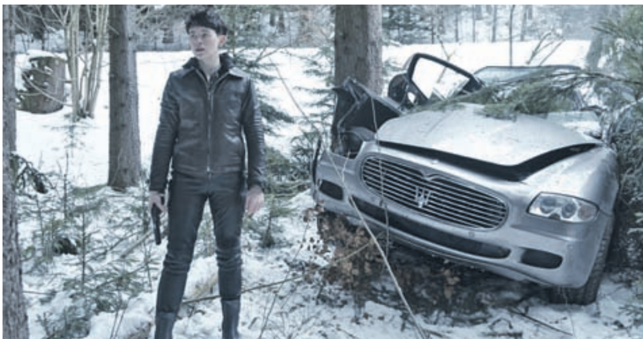
Claire Foy encarna en esta ocasión a Lisbeth Salander

da terrorista ETA cuando tenía 12 años. Su fórmula para no guardar rencor es simple, pero a la vez compleja: "Creo que el perdón es un salto cualitativo, una decisión. Tu decides que perdonas porque quieres ser libre y feliz, porque no quieres albergar en tu corazón odio o algo negativo". Y eso es precisamente lo que se va a encontrar el espectador en 'El mayor regalo', una oda al perdón, algo que como dice su director, "no es sólo asunto de asesinos y delincuentes".