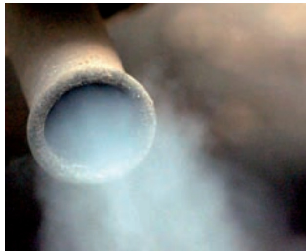
La calidad del aire es preocupante, según el informe

El estudio advierte de que la calidad del aire es un problema "preocupante", con Madrid y Barcelona como las ciudades con mayor población afectada y con "importantes efectos sobre la salud", junto a la carencia de políticas de aumento de la biodiversidad, de reducción de residuos, incluidos los biorresiduos y de políticas de reducción de emisiones de gases.