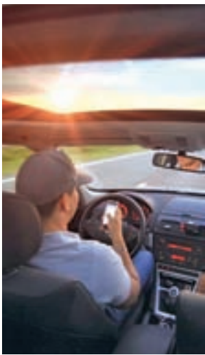
Una persona usando el móvil