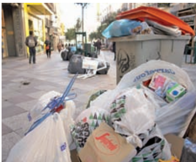
Anterior huelga de basura en Madrid GENTE