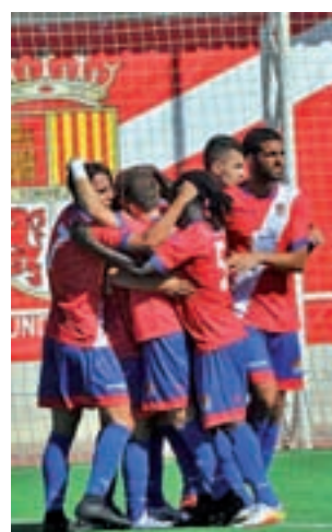
Cita a domicilio

igualada sin goles en su visita a La Mina de Carabanchel, aunque al menos el cuadro 'rojillo' lograba de este modo seguir con su escalada en la clasificación, tras un arranque de temporada un tanto dubitativo. Los complutenses son ahora decimoterceros, antes de verse las caras con otro de los históricos de la categoría, el Pozuelo, que tampoco está viviendo su mejor campaña, aunque cuenta con los mismos puntos que el Alcalá (13), tras su reciente triunfo ante el Santa Ana.