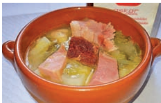
Guiso que se podrá degustar en la cafetería Askar

La VI Ruta de la Cuchara fue presentada este jueves en la cueva-bodega de la Casa del Rey, en un acto que sirvió además para celebrar el Día Mundial del Enoturismo, y donde los asistentes disfru-