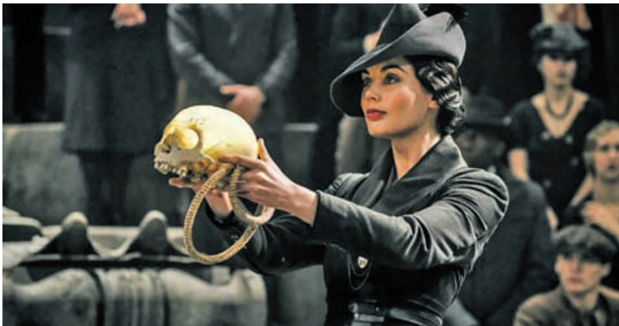
La lucha entre el bien y el mal cuenta con un nuevo arma: la magia

El otro punto fuerte de 'Los crímenes de Grindelwald' es el reparto, con Eddie Redmayne (ganador de un Oscar por 'La teoría del todo' y nominado en su día por 'La chica danesa'), Johnny Depp y Jude Law llevando la voz cantante. Especialmente destacable es la incorporación de Depp y Law, quienes a pesar de no aparecer en la primera entrega no desentonan en absoluto. Por lo demás, esta secuela tiene todos los ingredientes para hacer las delicias de los fans del género, con grandes dosis de fantasía, una ambientación extraordinaria y una trama que hace que el metraje (más de dos horas) no se haga pesado. En definitiva, una nueva e interesante lectura sobre la lucha del bien y el mal.