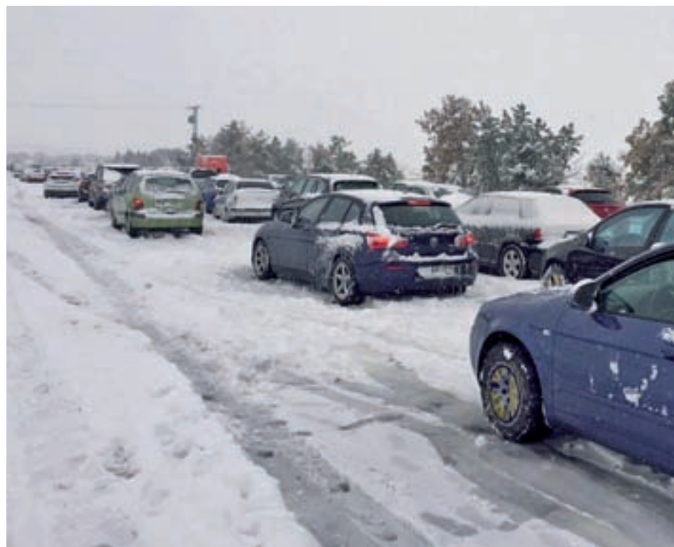
Nevada en la autopista AP-6 del pasado 6 de enero

El delegado del Gobierno en Madrid, José Manuel Rodríguez Uribe, señaló en la presentación del plan que la región contará con 169 máquinas quitanieves ubicadas en 12 municipios, entre ellos Madrid capital, y que se repartirán casi 16.800 toneladas de sal y 1,2 millones de litros de salmuera. También habrá 32.054 plazas para aparcamiento obligatorio de camiones en las áreas de estaciona-