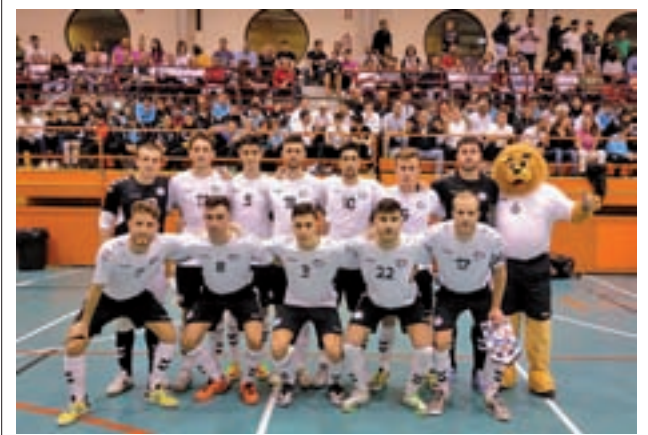
Los ripenses sumaron una nueva derrota

Mucho mejor le van las cosas al CD Iplacea. Las alcaínas son segundas en la clasificación, igualadas con el Ikasa BM Madrid, a expensas de lo que suceda en su choque de este sábado en El Val con el BM Móstoles.