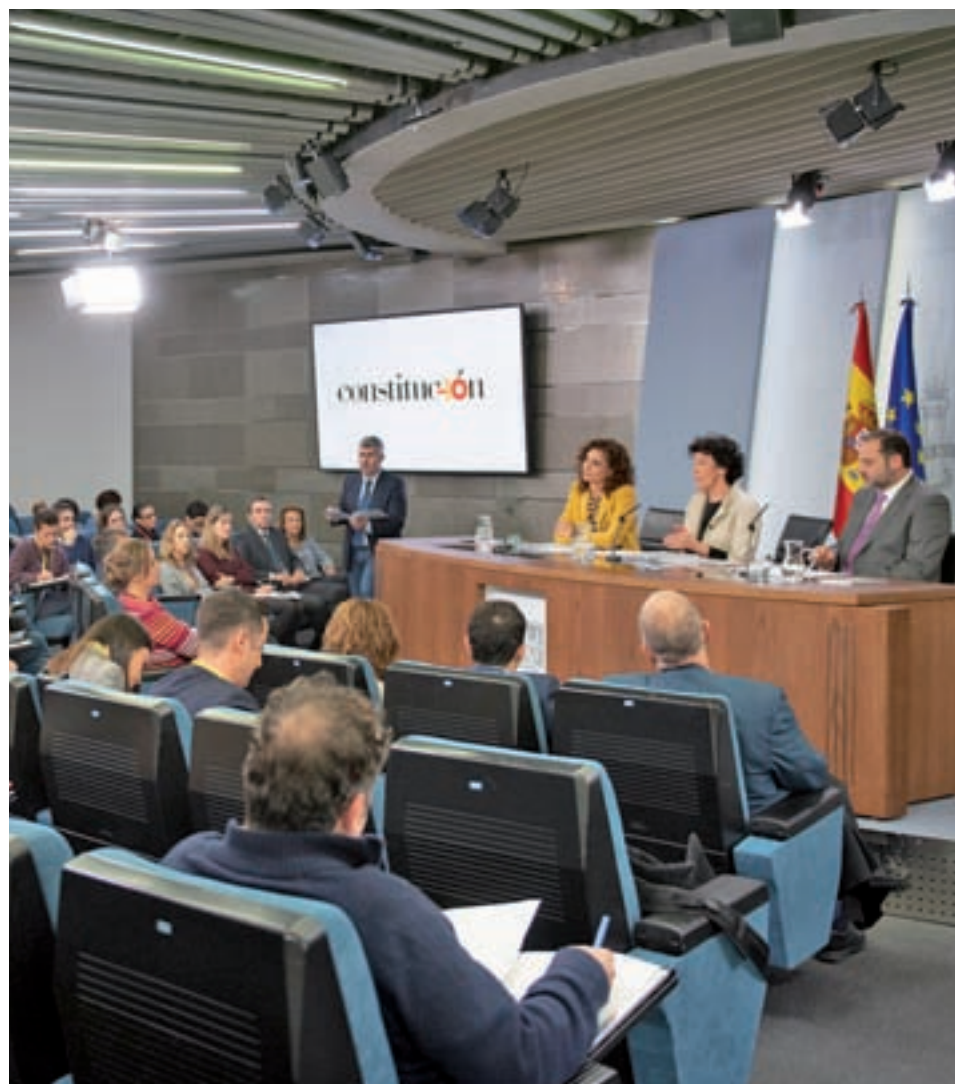
Rueda de prensa tras el Consejo de Ministros

La decisión del Consejo de Ministros ha sido recibida con dos críticas principales: si