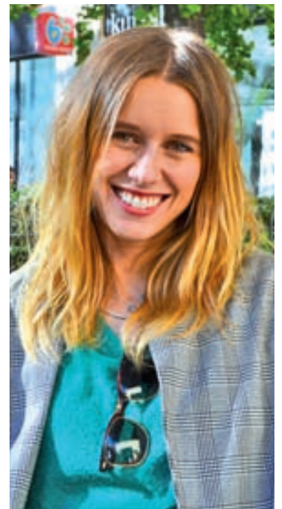
S. C. / GENTE

Son canciones en español, escritas por mí. Son muy variadas: reggae, rumba... Lo