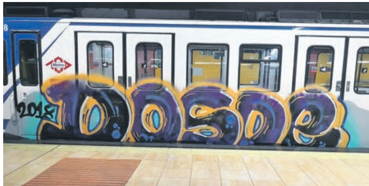
Grafiti en un vagón de Metro de Madrid

LA DELEGACIÓN NO CONCRETÓ EL NÚMERO DE AGENTES QUE SE SUMARÁN