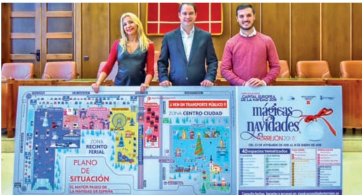
La cantante oficial de películas Disney Gema Castaño se suma este año a la programación navideña