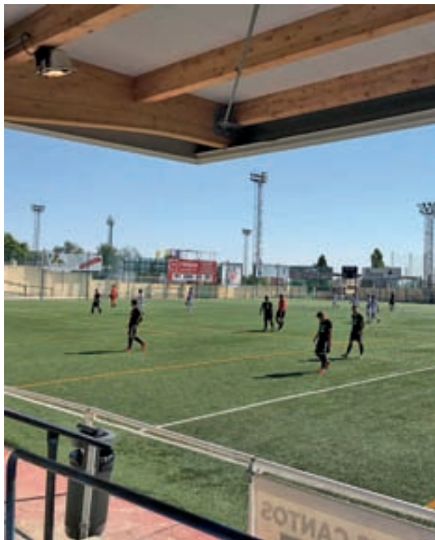
El San Fernando es segundo en la tabla

Para acabar de igualar el encuentro, ambos equipos cerraron la pasada jornada con el refuerzo moral que siempre supone una victoria. El San Fernando se imponía por un ajustado 2-1 al San Agustín del Guadalix, mientras que el Trival daba un gol-