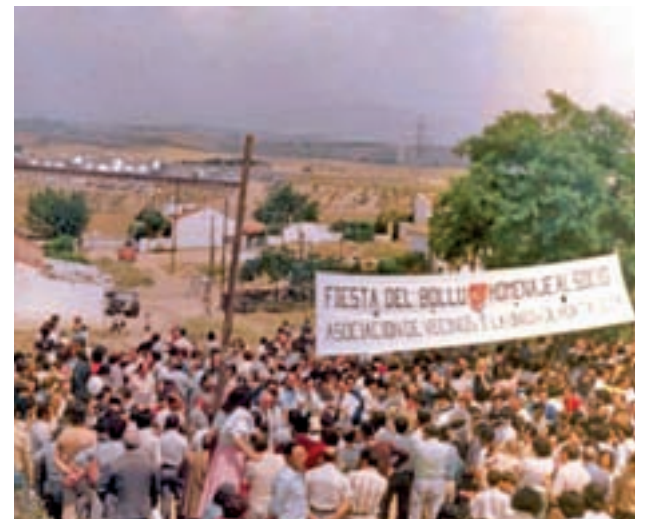
HORTALEZA EN IMÁGENES: El rehabilitado Silo de Hortaleza ofrece, en su primera exposición, un recorrido en 84 imágenes para mostrar al público cómo eran en el siglo pasado barrios como Canillas, Villa Rosa o Las Cárcavas-San Antonio. También aborda los nuevos desarrollos urbanísticos de Sanchinarro y Valdebebas.

MADRID >> Tabacalera. La Principal | A partir del 23 de noviembre | Gratuita