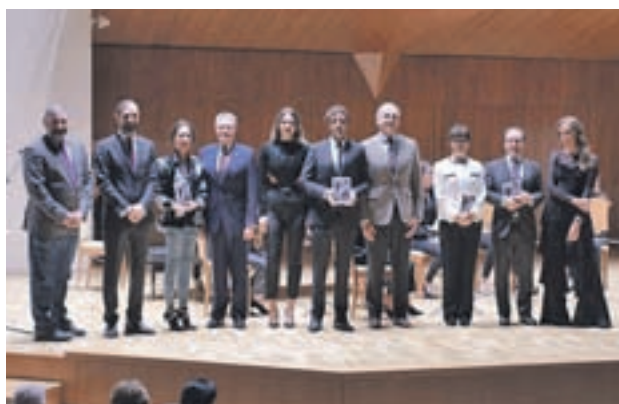
Los premiados por Movimiento sin Piedad

La empresa pública cedió la Nave de Motores a la exposición itinerante que Movimiento sin Piedad, del que GENTE es periódico oficial, organizó el pasado mes de marzo con retratos de 22 mu-