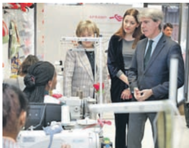
Ángel Garrido visitó a víctimas de la trata

Se trata de una iniciativa a la que se va a destinar un presupuesto inicial de 800.000 euros, que contará con una plantilla de 11 trabajadores y empezará a funcionar en el primer cuatrimestre de 2019, según anunció el presidente regional, Ángel Garrido.