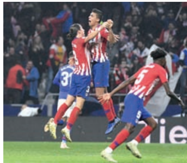
El Atleti recibirá al Barça el día 24, con un punto de desventaja

En la eterna rivalidad que mantienen el Real Madrid y el Barcelona se suele decir que los vasos comunicantes entre el 'puente aéreo' hace que cuando a uno de los grandes le van las cosas bien en el otro club la situación sea prácticamente opuesta. Los números en la Liga suelen dar la razón a esta teoría, aunque también se dan temporadas en las que las sonrisas quedan mucho más repartidas por toda la geografía de la España futbolística.