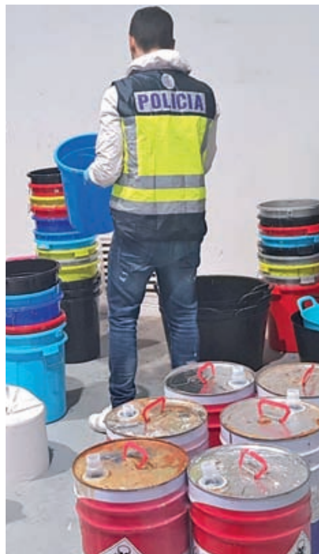
Operación antidroga de la Policía Nacional

El mayor incremento se dio en un delito poco habitual, como es el del secuestro, donde se ha pasado de 3 casos en 2017 a 8 en lo que llevamos de año, lo que se traduce en una subida del 166%.