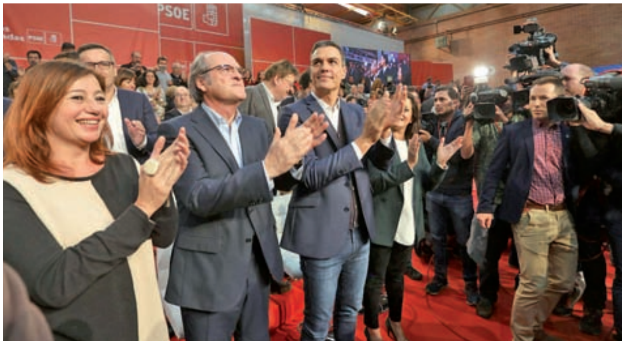
Pedro Sánchez y Ángel Gabilondo durante el acto de Fuenlabrada

Ángel Gabilondo, candidato del PSOE a la Presidencia de la Comunidad de Madrid, garantizó, durante su discurso, un "proyecto transformador" para Madrid, con el fin de "erradicar" las "desigualdades" sociales de la región. Por su parte, el alcalde de Fuenlabrada, Javier Ayala, aseguró que "el PP gobierna de espaldas a la ciudadanía".