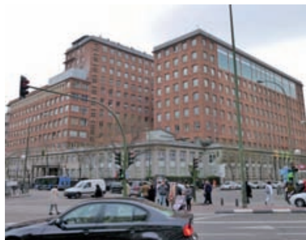
Hospital de La Princesa

En concreto, La Princesa se llevó el galardón al Mejor Hospital Público, mientras que el General de Villalba se impuso como el Mejor Hospital Público con Gestión Privada