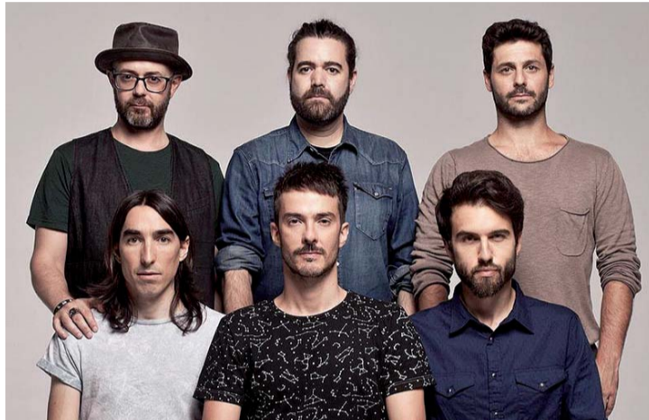
La banda Vetusta Morla vuelve al festival Actual de Logroño.

El 'Café Cantante' tomará el Círculo Logroñés con cinco sesiones que permitirán escuchar a Flori-