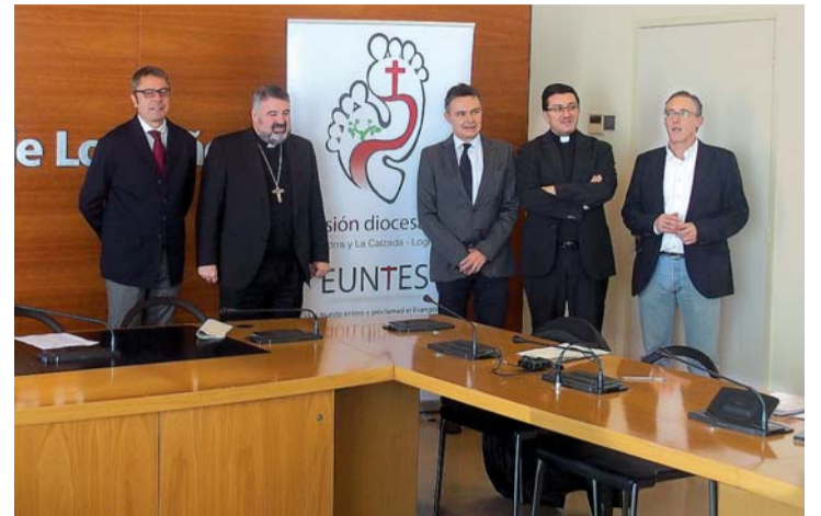
Presentación del evento con autoridades regionales, locales y eclesiales.