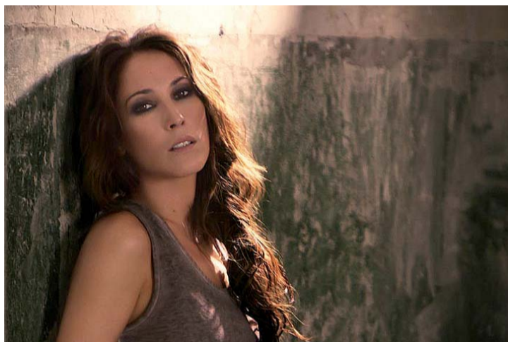
Malú actuará en el Palacio de los Deportes el 4 de enero.