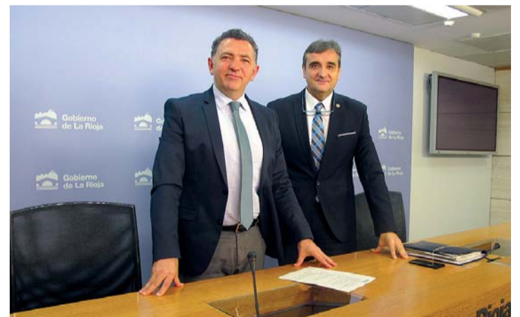
Cuevas y el director general de Vivienda en la presentación de las ayudas.

Las ayudas se conceden por dos años, con efectos desde 1 de enero de 2019, y los beneficiarios deberán acreditar unos ingresos mínimos para afrontar el pago del al-