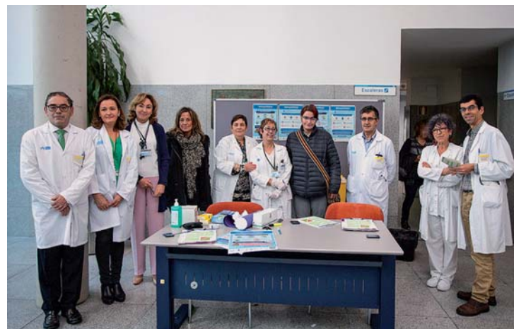
Las autoridades sanitarias insistieron en la necesidad de autocuidarse.