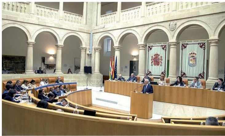
La reforma del Estatuto, uno de los principales asuntos pendientes de la Cámara.

Desde que saltara la noticia, los socialistas han defendido que en sus enmiendas hablan del euskera "no como referencia lingüística si-