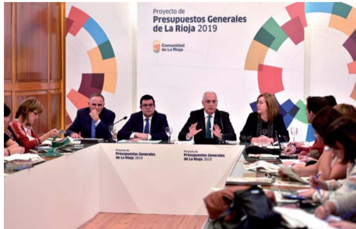
Ceniceros en la presentación de los presupuestos de La Rioja para 2019.

En cuanto a las grandes cifras, el presidente destacó que dos de cada tres euros irán a parar a políticas sociales y se destinarán 57,03 millones al fomento de empleo, 120 millones de euros al reto demográfico, 26,5 al reto digital, 80 a innovación y 27,6 a la internacionalización.