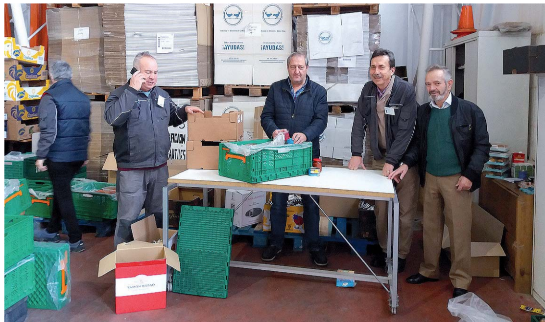
El presidente del Banco de Alimentos de La Rioja, junto a varios voluntarios, preparan la nueva gran recogida.

Si hay algo en lo que insiste el responsable regional del Banco de Alimentos es en que los riojanos "son muy generosos y, de hecho, La Rioja está en las primeras posiciones en el índice de kilos de alimentos donados por habitante, destacando que España es el país más generoso de la Unión Europea".