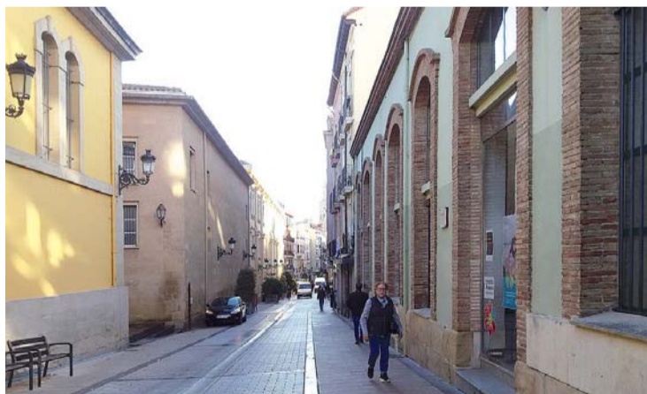
Calle Portales de Logroño.

Los recorridos se plasman en un pequeño plano y a través de códigos QR se facilita información al