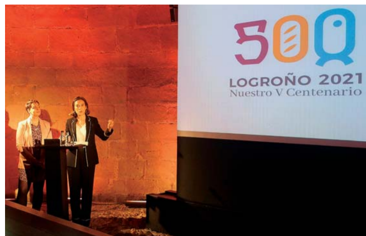
Villoslada y Gamarra durante la presentación de la nueva identidad gráfica.