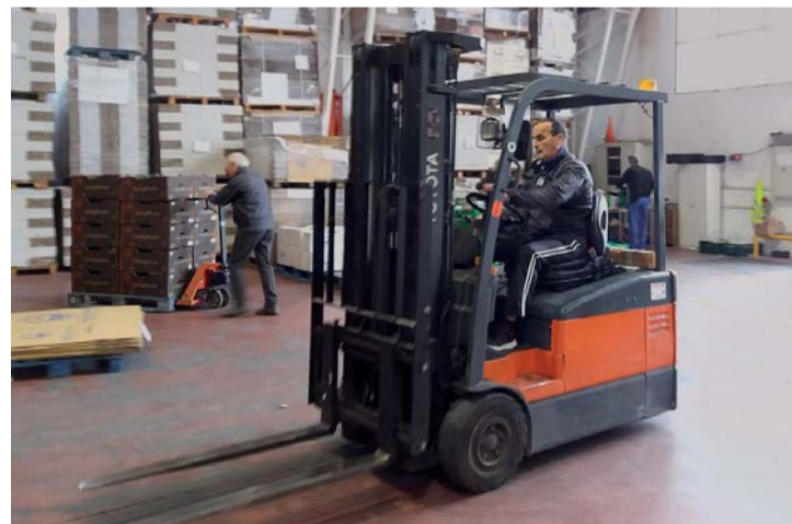
La labor de los voluntarios no para en las instalaciones de la entidad.

recogida es el cantautor Chema Purón, que toma el relevo de Francis Paniego, Taquío Uzqueda, Javier Cámara y Félix Revuelta. Purón, además de prestar su imagen, ofrecerá un concierto a principios de 2019 cuya recaudación irá a parar al Banco de Alimentos de La Rioja.