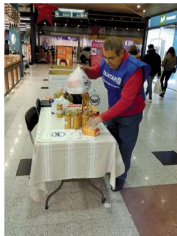
Un voluntario organiza los alimentos.

La campaña tendrá lugar los días 30 de noviembre y 1 de diciembre en 12 localidades y espera llegar a los más de 171.000 kilos de 2017