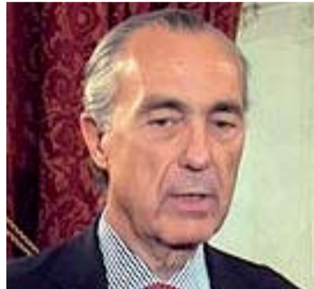
Luis Alberto de Cuenca.

Esta edición se han presentado un total de 167 novelas originales, de las cuales 2 tuvieron que ser descartadas al no cumplir con las