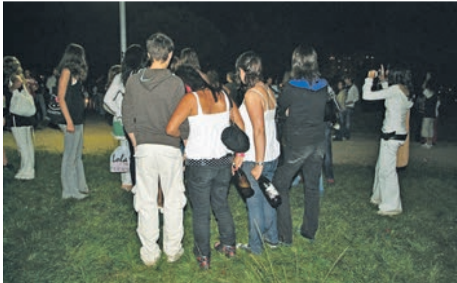
La campanya preté sensibilitzar a tot el conjunt de la societat.

El consum d'alcohol és un problema molt important de salut pública, que al món va causar la mort de 3 milions de persones el 2016.