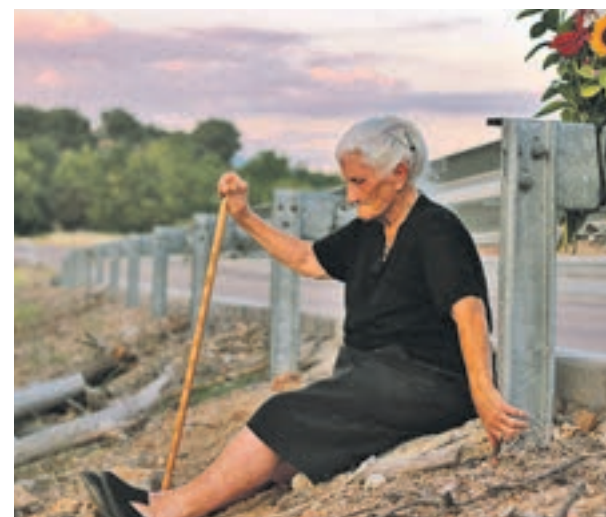
Las fosas comunes, uno de los temas a tratar

El otro punto fuerte de 'Los crímenes de Grindelwald' es el reparto, con Eddie Redmayne (ganador de un Oscar por 'La teoría del todo' y nominado en su día por 'La chica danesa'), Johnny Depp y Jude Law llevando la voz cantante. Especialmente destacable es la incorporación de Depp y Law, quienes a pesar de no aparecer en la primera entrega no desentonan en absoluto. Por lo demás, esta secuela tiene todos los ingredientes para hacer las delicias de los fans del género, con grandes dosis de fantasía, una ambientación extraordinaria y una trama que hace que el metraje (más de dos horas) no se haga pesado. En definitiva, una nueva e interesante lectura sobre la lucha del bien y el mal.