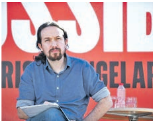
Pablo Iglesias, durante el acto en Barcelona

Refiriéndose a un escenario que contara con la mayoría de PP, Ciudadanos y Vox, el líder de Podemos dijo que la aprobación de las cuentas para el próximo año es necesaria “para mantener una dirección de Estado que siga siendo democrático”. Pidió también a Sánchez que negociara con el soberanismo.