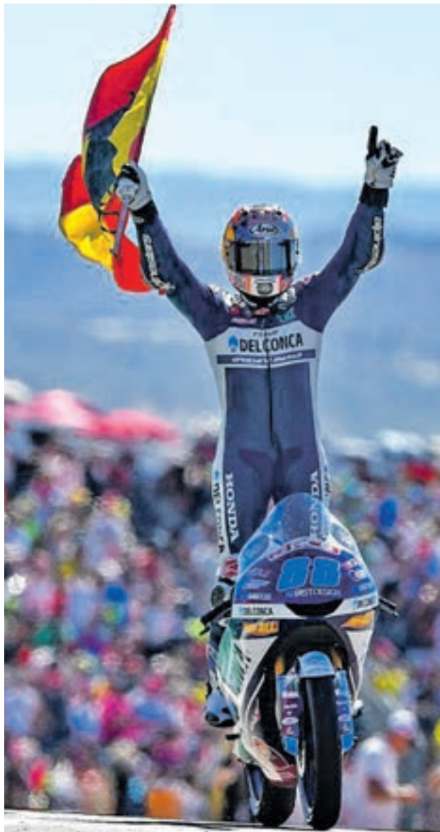
Jorge Martín llega a Cheste con el título asegurado

Lo de la categoría reina, MotoGP, comienza a ser prácticamente una dictadura de los pilotos nacionales. Desde el año 2010, sólo el australiano Casey Stoner logró hacer un paréntesis en el duopolio instaurado por Jorge Lorenzo y Marc Márquez, vencedores de tres y cinco ediciones, respectivamente. En este 2018, el confeti y el champán bañarán una vez más al de Cervera, a quien sólo el accidente sufrido en Australia le ha privado de firmar un repóker de victorias consecutivas. Con todo, su dominio queda reflejado