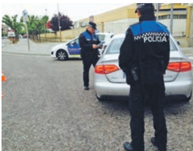
A les zones urbanes també s'intensificarà la vigilància.

Paral·lelament l'Ajuntament també aprofitarà aquesta suspensió temporal per aprovar un Pla Especial que posi noves condicions per aquest tipus d'activitats a la vila i d'aquesta manera limitar possibles construccions.