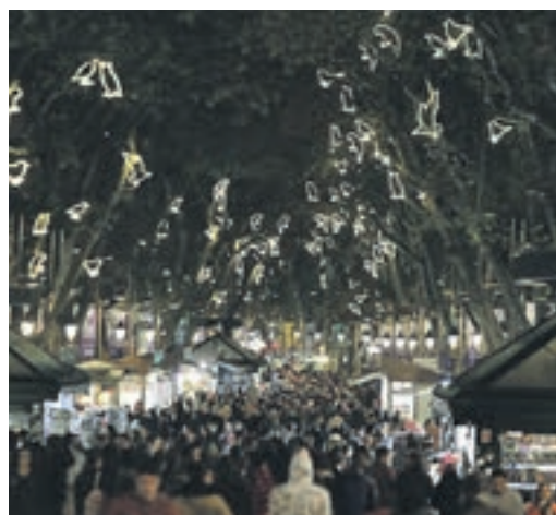
Les llums s'encendran el dia 22.

EL PERIÓDICO GENTE NO SE RESPONSABILIZA NI SE IDENTIFICA CON LAS OPINIONES QUE SUS LECTORES Y COLABORADORES EXPONGAN EN SUS CARTAS Y ARTÍCULOS