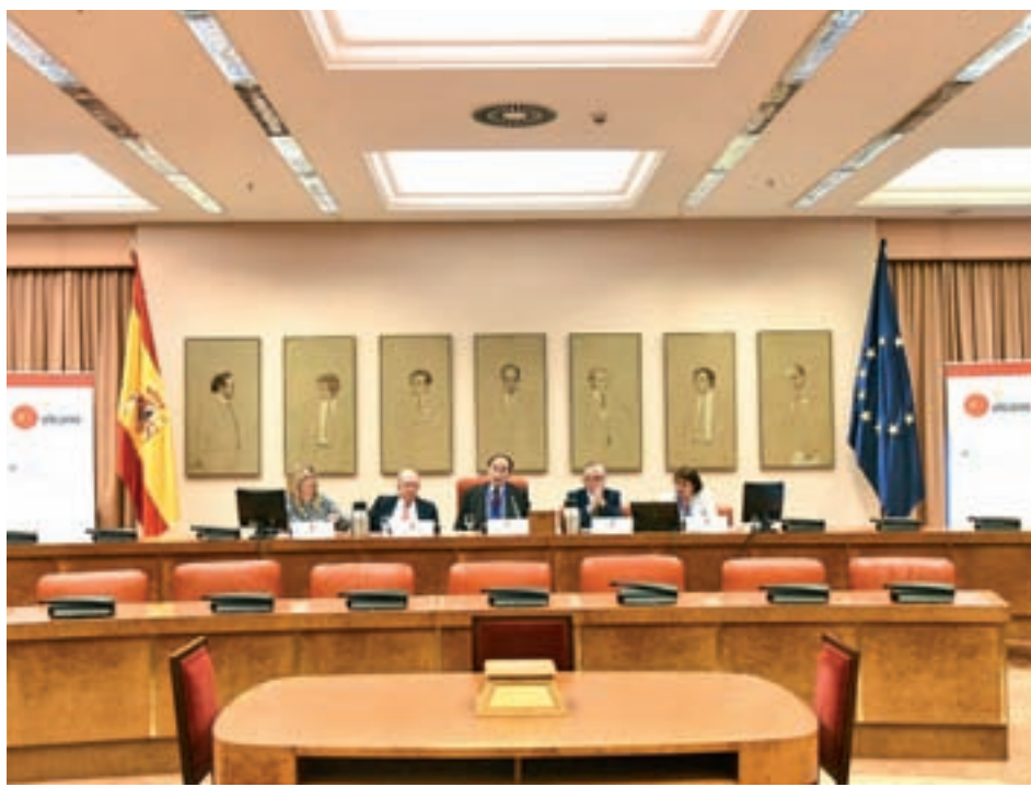
Presentación del estudio en el Congreso REAL INSTITUTO ELCAÑO

La lectura de octubre del índice compuesto de indicadores líderes para España vuelve a apuntar a una moderación del impulso de crecimiento. De hecho, la caída mensual del dato (-0,25%) es la más pronunciada entre las grandes economías de la OCDE, aunque en términos interanuales (-1,40%) es inferior a la registrada por Reino Unido (-1,48%), Francia (-1,50%) y a la media de las economías europeas.