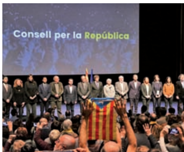
Presentación del Consell per la República