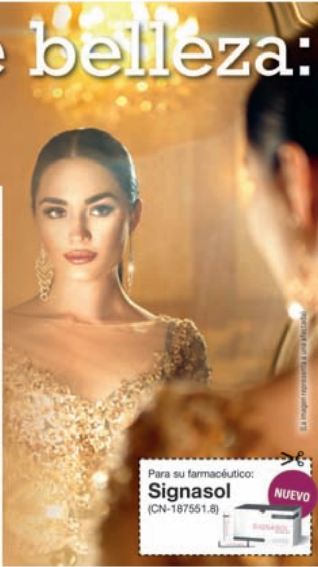
La imagen representa a una afectada