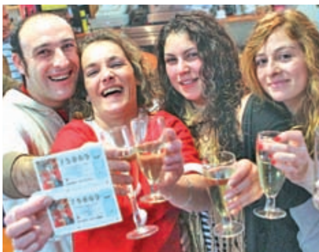
El del día 22 es uno de los sorteos más esperados

Fechas destacadas, la historia e incluso los sueños tienen un peso decisivo a la hora de elegir un número • Según datos oficiales, se estima que este 2018 aumentará el gasto medio por habitante