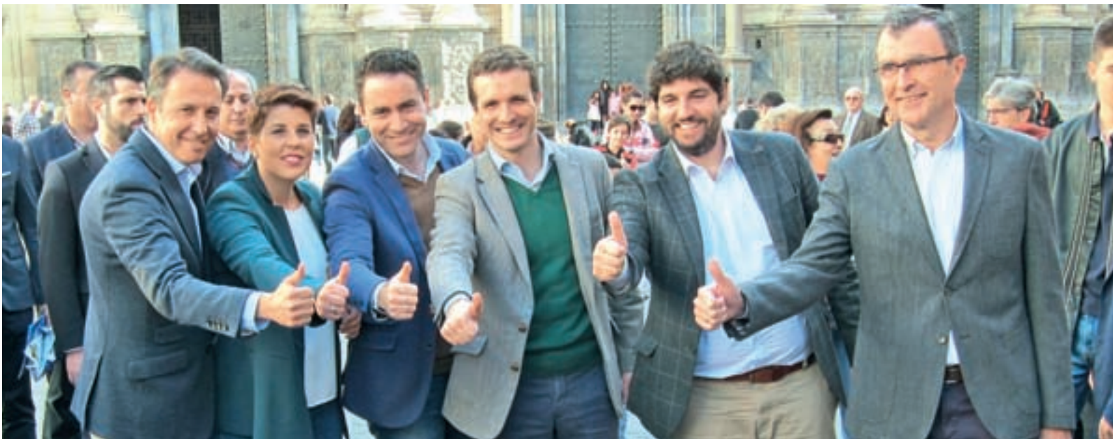
Casado junto a López Miras el pasado fin de semana en Murcia