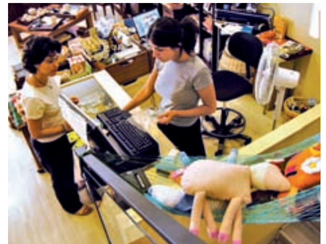
El comercio es uno de los sectores más demandantes GENTE

Por detrás están la Comunidad de Madrid, con 156.000 contratos, y la Comunidad Valenciana, con 136.000. En primer caso se producirá uno de los aumentos interanuales más altos, con un 6%, mientras que la segunda mejorará sus datos en un 5%. Entre las tres regiones aglutinan prácticamente la mitad de las contrataciones.