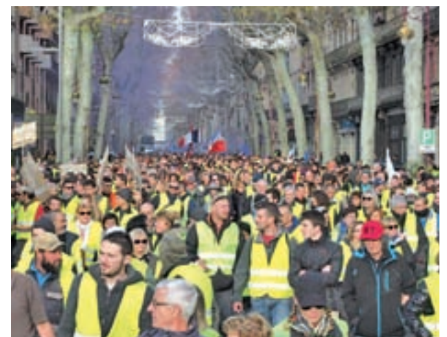
El Banco de Francia ha revisado a la baja su pronóstico

La factura de la crisis desatada en Francia ascenderá a una décima parte del crecimiento previsto para el PIB del país, según señaló el ministro galo de Finanzas, Bruno Le Maire.