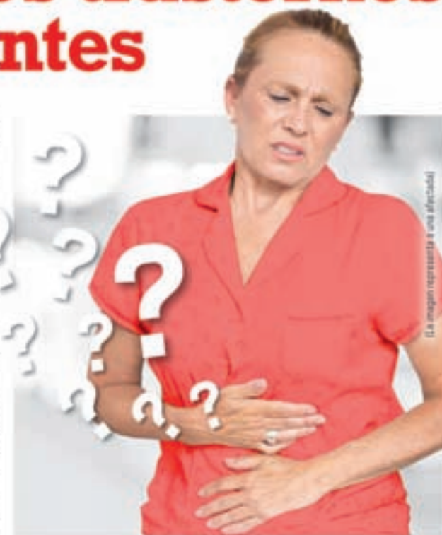
La imagen representa a una afectada

Kijimea Colon Irritable ( B. bifidum MIMBb75), exclusiva en el mundo, posee la capacidad de acumularse directamente sobre la pared intestinal. Kijimea Colon Irritable cubre la pared intestinal como si se tratase de un parche adhesivo. Nuestros expertos lo llaman el "efecto parche". Un estudio clínico realizado con afectados de colon irritable demostró que los síntomas mejoran notablemente. Durante el estudio, algunos pacientes incluso notificaron que estos desaparecieron. Además, los científicos demostraron que la calidad de vida de los afectados mejoró de forma significativa.