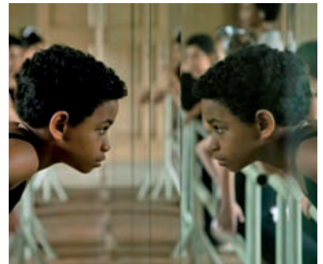
El Festival de San Sebastián premió al guion de este film

Esta es, a grandes rasgos, la trama de una comedia que, como decíamos en las primeras líneas, tenía fijado su estreno para el mes de agosto. Ese retraso puede jugar en su favor a nivel de taquilla, ya que las Navidades suelen ser un poco más propicias para títulos con temática amable y poco sesuda. Ni más ni menos.