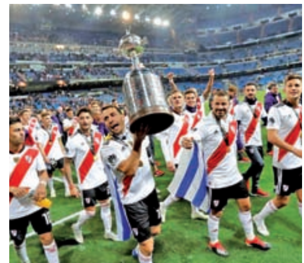
River Plate conquistó la Libertadores en el Bernabéu

El rival de los 'millonarios' en las semifinales podría ser el Esperance de Túnez, vencedor de la Champions africana, con el que se vería las caras el martes 18.