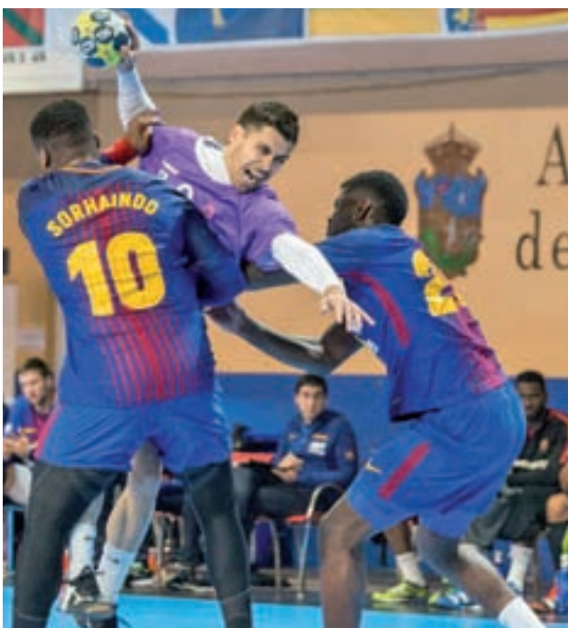
El Barça ha ganado 13 de las 28 ediciones