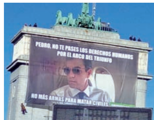
Pancarta en el Arco de Triunfo

Pocos días después, el lunes, varios activistas de Greenpeace colgaron en el Arco de Triunfo, en el distrito de Moncloa-Aravaca de Madrid, una pancarta gigante que pedía al Gobierno de Pedro Sánchez que detenga la venta de armas con motivo del Día Mundial de los Derechos Humanos.