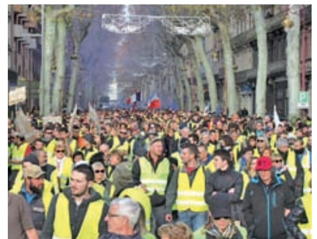
El Banco de Francia ha revisado a la baja su pronóstico

La factura de la crisis desatada en Francia ascenderá a una décima parte del crecimiento previsto para el PIB del país, según señaló el ministro galo de Finanzas, Bruno Le Maire.