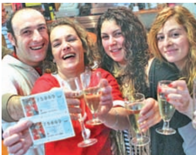
El del día 22 es uno de los sorteos más esperados

Fechas destacadas, la historia e incluso los sueños tienen un peso decisivo a la hora de elegir un número • Según datos oficiales, se estima que este 2018 aumentará el gasto medio por habitante