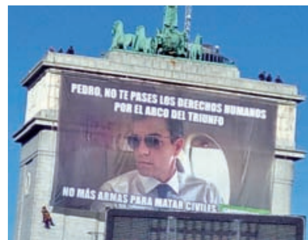
Pancarta en el Arco de Triunfo

Pocos días después, el lunes, varios activistas de Greenpeace colgaron en el Arco de Triunfo, en el distrito de Moncloa-Aravaca de Madrid, una pancarta gigante que pedía al Gobierno de Pedro Sánchez que detenga la venta de armas con motivo del Día Mundial de los Derechos Humanos.