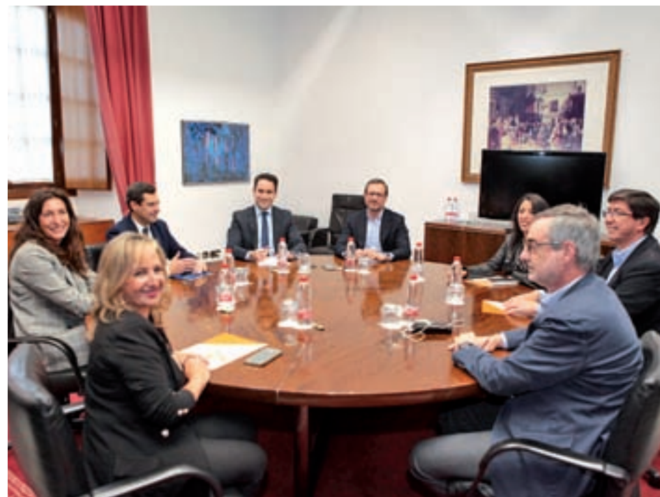
Representantes de PP y Ciudadanos, al inicio de la reunión

Por el momento, PP y Ciudadanos han acordado conformar un equipo de trabajo, una tarea que iniciaron el pasado miércoles, para buscar puntos de coincidencia. El próximo encuentro se producirá el lunes 17 de diciembre, que se centrará en el programa. A partir de ahí, abordarán la formación del Ejecutivo y la composición de la Mesa de la Cámara. "Hoy trabajamos exclusivamente sobre las líneas programáticas. Tenemos que llegar a tres