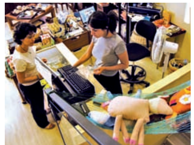
El comercio es uno de los sectores más demandantes GENTE

Por detrás están la Comunidad de Madrid, con 156.000 contratos, y la Comunidad Valenciana, con 136.000. En primer caso se producirá uno de los aumentos interanuales más altos, con un 6%, mientras que la segunda mejorará sus datos en un 5%. Entre las tres regiones aglutinan prácticamente la mitad de las contrataciones.