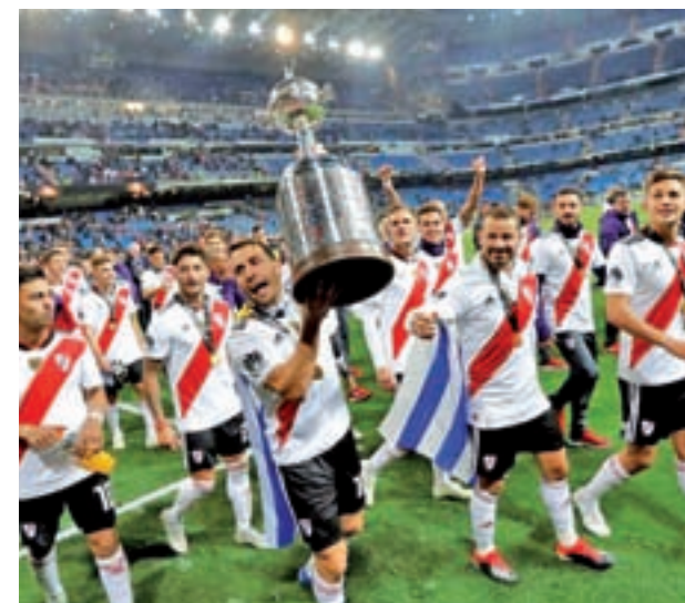
River Plate conquistó la Libertadores en el Bernabéu

El rival de los 'millonarios' en las semifinales podría ser el Esperance de Túnez, vencedor de la Champions africana, con el que se vería las caras el martes 18.