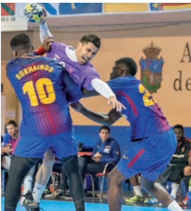
El Barça ha ganado 13 de las 28 ediciones