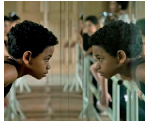
El Festival de San Sebastián premió al guion de este film

Esta es, a grandes rasgos, la trama de una comedia que, como decíamos en las primeras líneas, tenía fijado su estreno para el mes de agosto. Ese retraso puede jugar en su favor a nivel de taquilla, ya que las Navidades suelen ser un poco más propicias para títulos con temática amable y poco sesuda. Ni más ni menos.