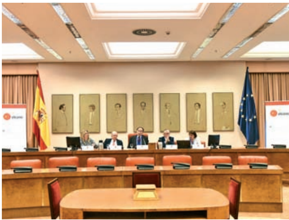
Presentación del estudio en el Congreso REAL INSTITUTO ELCANO

La lectura de octubre del índice compuesto de indicadores líderes para España vuelve a apuntar a una moderación del impulso de crecimiento. De hecho, la caída mensual del dato (-0,25%) es la más pronunciada entre las grandes economías de la OCDE, aunque en términos interanuales (-1,40%) es inferior a la registrada por Reino Unido (-1,48%), Francia (-1,50%) y a la media de las economías europeas.