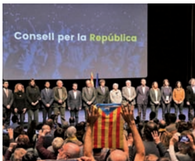
Presentación del Consell per la República