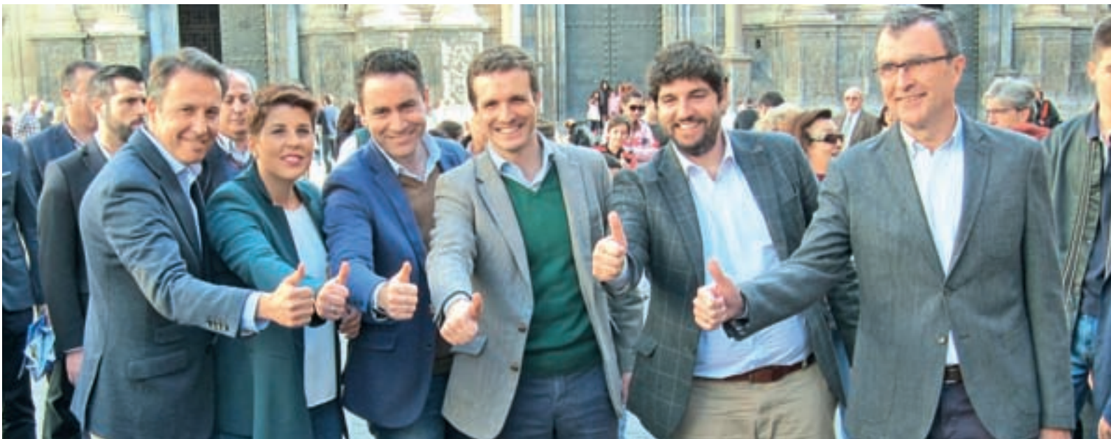
Casado junto a López Miras el pasado fin de semana en Murcia