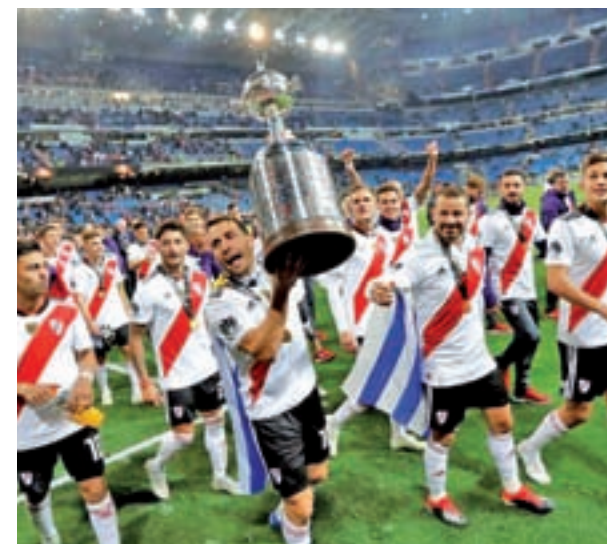
River Plate conquistó la Libertadores en el Bernabéu

El rival de los 'millonarios' en las semifinales podría ser el Esperance de Túnez, vencedor de la Champions africana, con el que se vería las caras el martes 18.