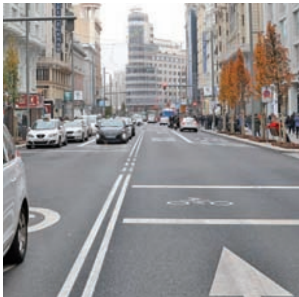
El tráfico es más fluido en las principales vías

En concreto, según la delegada de Movilidad y Medio Ambiente, Inés Sabanés, la zona de bajas emisiones no genera "efecto frontera", se han aumentado en más de 10.000 los viajes en los auto-