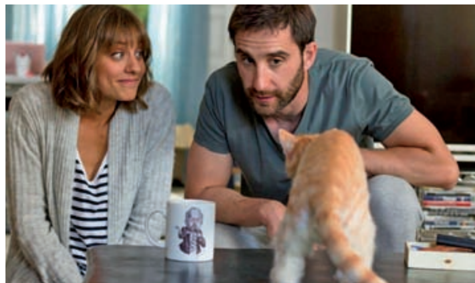
Michelle Jenner, Dani Rovira y su gato Miamor