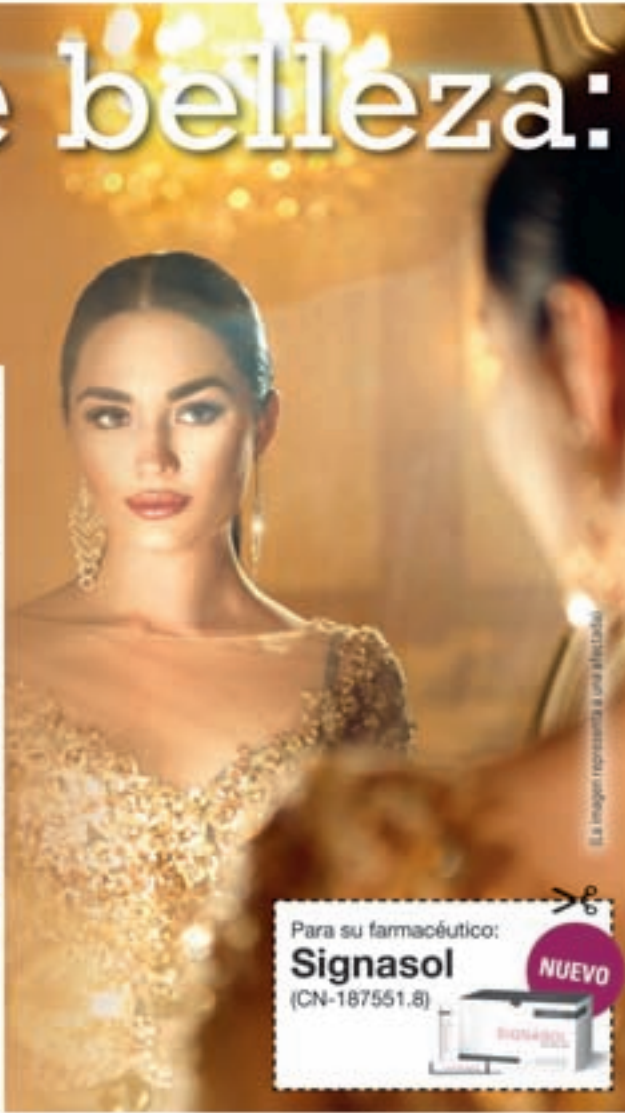
La imagen representa a una afectada