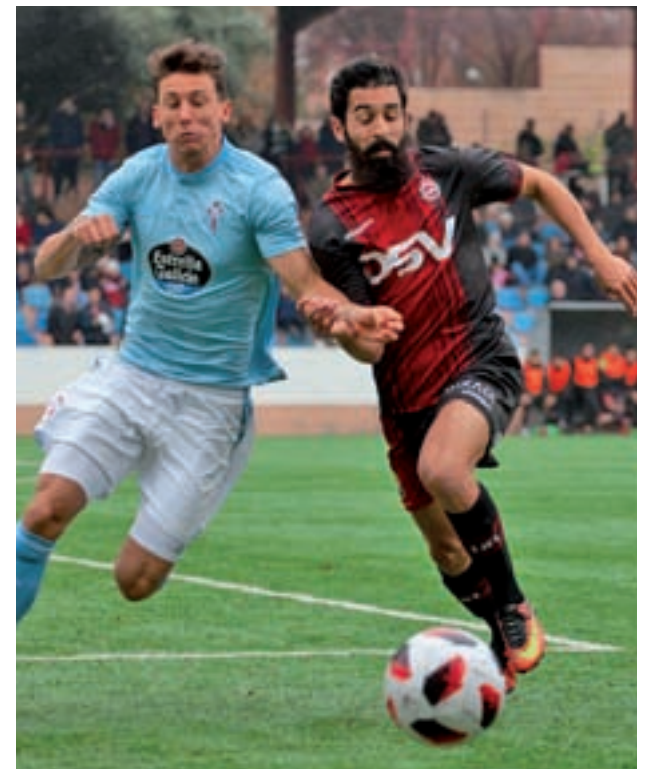
Bravo, una de las referencias en ataque del Adarve

Ante esta situación, y sin perder de vista que el cuarto por la cola, el Salmantino, tiene una desventaja de tres unidades, al Unión Adarve le urge reencontrarse con la victoria, especialmente en las dos jornadas que restan antes del parón navideño, ya que el calendario le depara sendos encuentros en el García de la Mata. El primero de ellos ten-