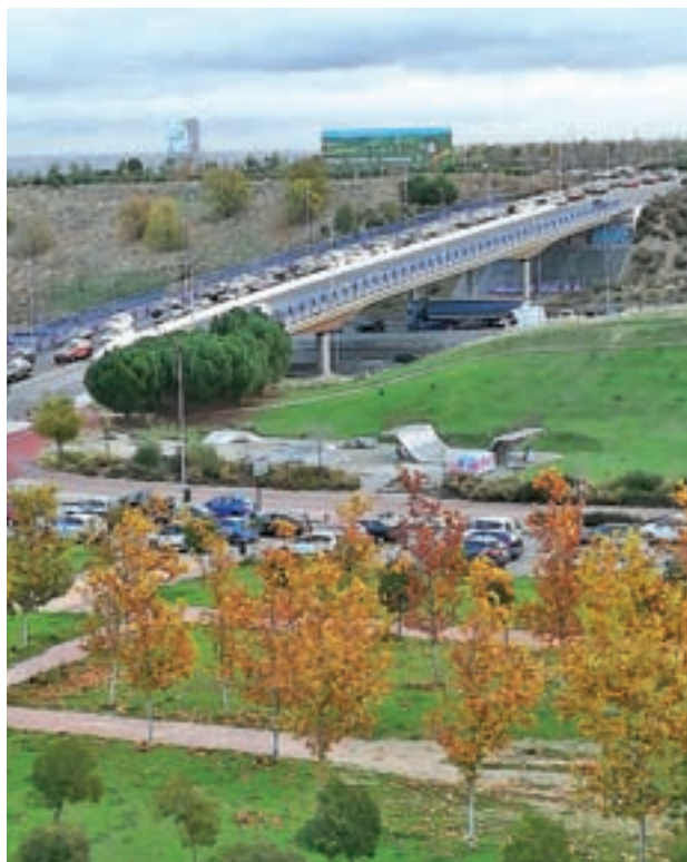
El puente de Niceto Alcalá Zamora, por encima de la M-40

Este colectivo asegura que el problema arranca del inadecuado diseño de los PAU colindantes (Las Tablas, Montecarmelo, Valdebebas) y de