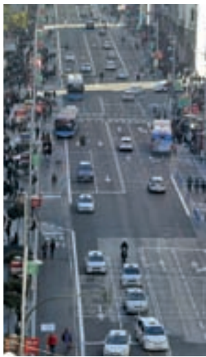
Gran Vía de Madrid