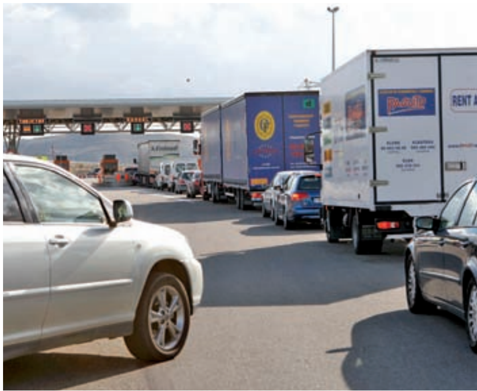
Autopista de peaje R-3 a la altura de Arganda del Rey

Las nueve vías quebradas, las de más reciente construcción, suman unos 510 kilómetros de longitud y suponen una quinta parte del total de 2.550 kilómetros de los que consta la red de carreteras de pago. A pesar de que han recuperado parte su tráfico en los últimos años, aún no han alcan-