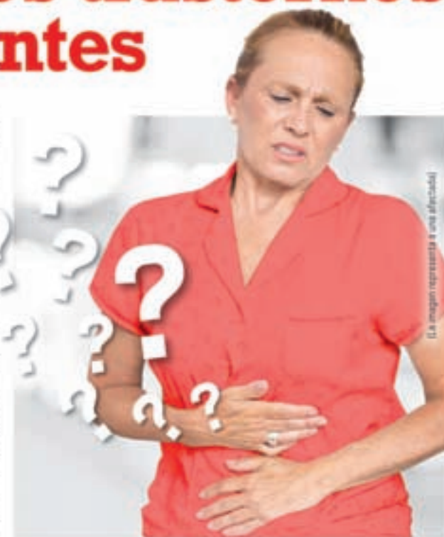
La imagen representa a una afectada

Kijimea Colon Irritable (B. bifidum MIMBb75), exclusiva en el mundo, posee la capacidad de acumularse directamente sobre la pared intestinal. Kijimea Colon Irritable cubre la pared intestinal como si se tratase de un parche adhesivo. Nuestros expertos lo llaman el "efecto parche". Un estudio clínico realizado con afectados de colon irritable demostró que los síntomas mejoran notablemente. Durante el estudio, algunos pacientes incluso notificaron que estos desaparecieron. Además, los científicos demostraron que la calidad de vida de los afectados mejoró de forma significativa.