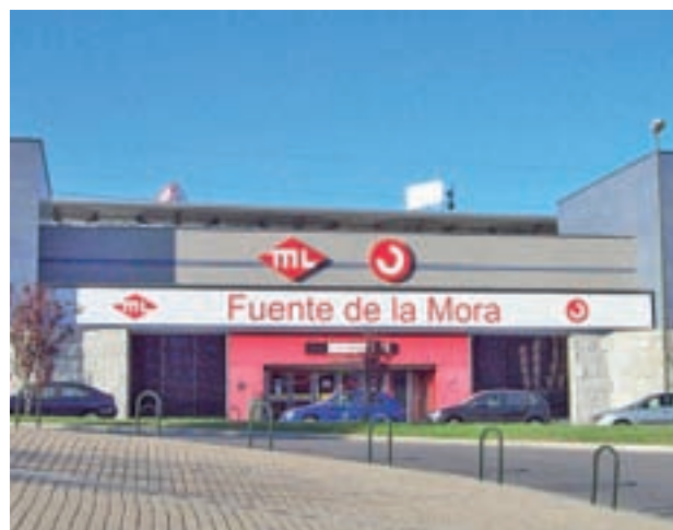
Uno de los aparcamientos estará en Fuente de la Mora

Estos aparcamientos se unirán a los tres ya existentes en las inmediaciones del Esta-