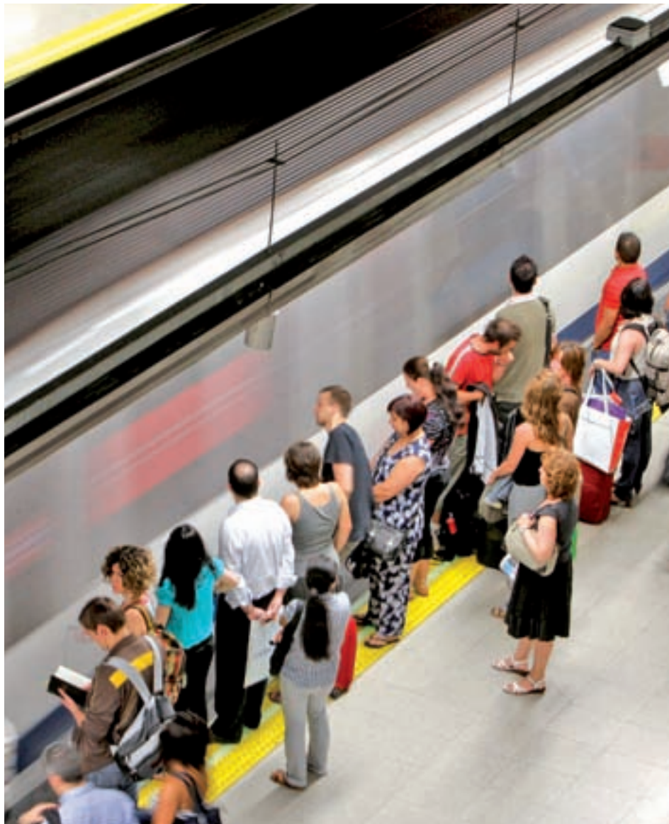
Metro aumentará el servicio durante los próximos días

demanda de viajeros en las zonas comerciales y de ocio con motivo de las fiestas navideñas. Este refuerzo alcanzará en algunas líneas hasta un 20% en días laborables y un 40% en fin de semana, siempre coincidiendo con los momentos de mayor afluencia prevista, como el 24 o el 31