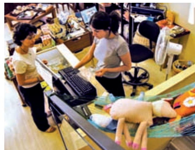
El comercio es uno de los sectores más demandantes GENTE

En el ámbito nacional, Adecco prevé que se firmen más de un millón de contratos entre el Black Friday y la campaña de rebajas, lo que supondría la cifra más alta de los últimos años