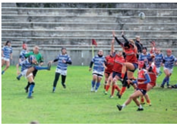
El Estadio Nacional espera a las 'dragonas'