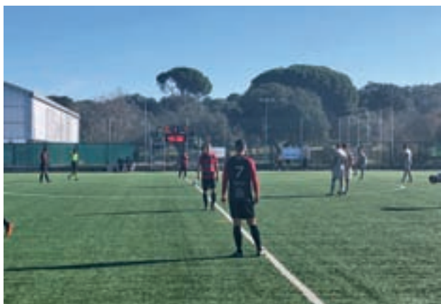
Partido del Inter