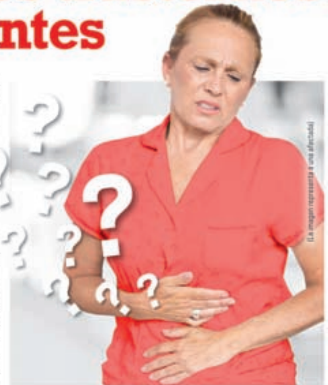
(La imagen representa a una afectada)

Kijimea Colon Irritable ( B. bifidum MIMBb75), exclusiva en el mundo, posee la capacidad de acumularse directamente sobre la pared intestinal. Kijimea Colon Irritable cubre la pared intestinal como si se tratase de un parche adhesivo. Nuestros expertos lo llaman el "efecto parche". Un estudio clínico realizado con afectados de colon irritable demostró que los síntomas mejoran notablemente. Durante el estudio, algunos pacientes incluso notificaron que estos desaparecieron. Además, los científicos demostraron que la calidad de vida de los afectados mejoró de forma significativa.