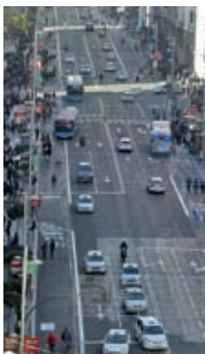
Gran Vía de Madrid