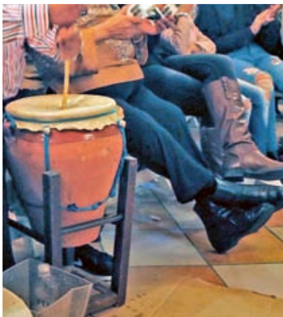
‘ZAMBOMBA DE JEREZ’