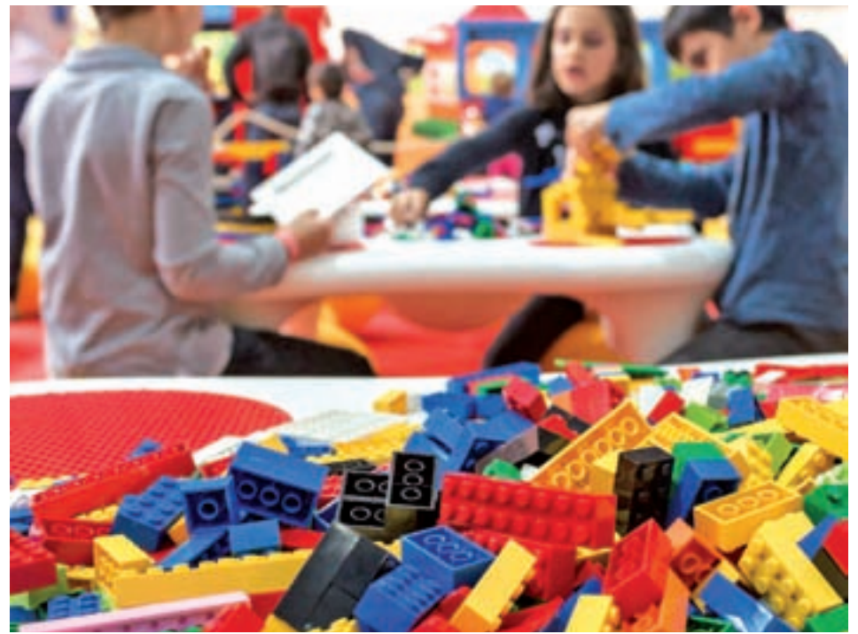
Los juegos tradicionales siguen en los primeros puestos

La tendencia de los últimos años muestra que los ayudantes de los Reyes Magos y Santa Claus se decantarán por plataformas online como Amazon, AliExpress o eBay para adquirir sus presentes.