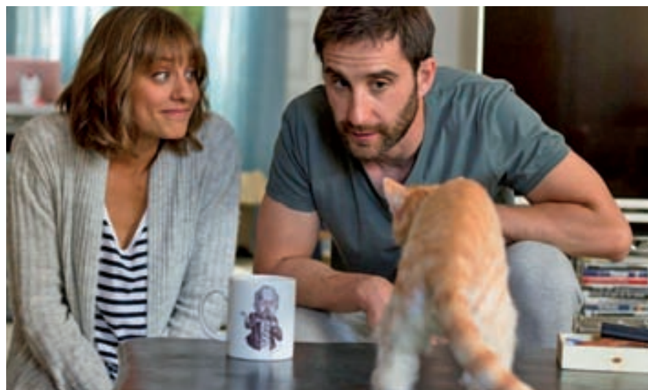
Michelle Jenner, Dani Rovira y su gato Miamor