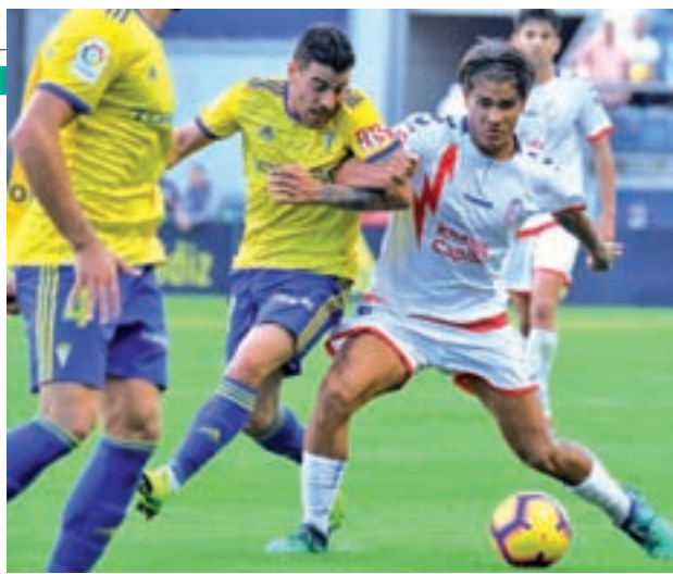
Derrota ante el Cádiz RAYO MAJADAHONDA

A pesar de la derrota, el Rayo se encuentra en la posición decimocuarta de la tabla con 20 puntos, gracias a sus seis victorias, dos empates y nueve derrotas. La igualdad en la zona media de la tabla, y en la categoría en general, han permitido al equipo de Iriondo no perder la estela de los equipos de arriba, aunque, poco a poco, se está acer-