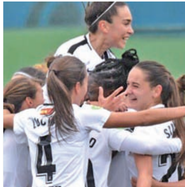
El Madrid CFF busca su tercera victoria del curso