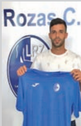
Goal, en su presentación

Las razones que explican el liderato de los azules son variadas, pero hay una que destaca por encima del resto: el acierto goleador. No en vano, Las Rozas cuenta con dos representantes en los