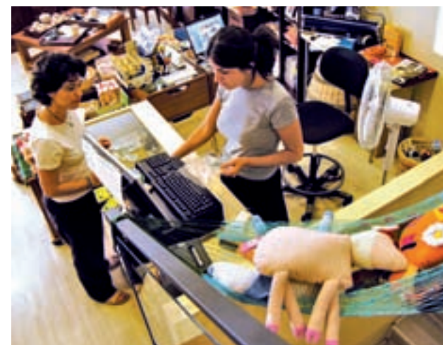
El comercio es uno de los sectores más demandantes GENTE

En el ámbito nacional, Adecco prevé que se firmen más de un millón de contratos entre el Black Friday y la campaña de rebajas, lo que supondría la cifra más alta de los últimos años