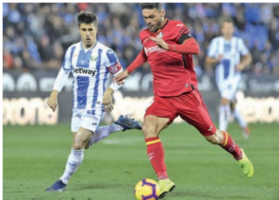
El Getafe, la pasada semana ante el Leganés | LALIGA.ES

Sin embargo, los de Bordalás no se pueden confiar de las cifras de los donostiarras. El Getafe se ha revelado como un conjunto al que se le da mejor el juego a domicilio. Tanto es así, que desde el duelo con el Real Madrid al inicio del campeonato, los azulones no han vuelto a perder