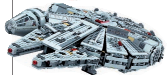
Halcón Milenario: La emblemática nave especial de la serie Stars Wars es uno de los juguetes estrella de Lego.