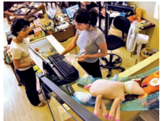
El comercio es uno de los sectores más demandantes GENTE

En el ámbito nacional, Adecco prevé que se firmen más de un millón de contratos entre el Black Friday y la campaña de rebajas, lo que supondría la cifra más alta de los últimos años