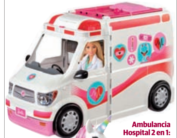
Ambulancia Hospital 2 en 1: La ambulancia de 'Barbie' se transforma en un clínica con más de 20 accesorios.

En la lista de los juguetes más pedidos por los niños y niñas, las muñecas son las reinas indiscutibles junto a juegos más tradicionales. Así, en estas Navidades, 'Barbie' y sus accesorios y las jóvenes 'L.O.L Surprise!'.