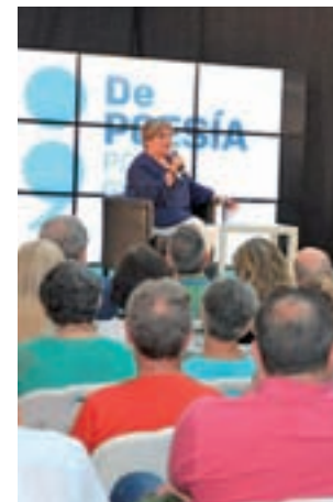
Primera edición del premio

El jurado ha destacado que se trata de un libro de poemas en prosa entre lo onírico y lo cinematográfico que consigue crear una atmósfera envolvente en la que los poemas "no sueltan de la mano,