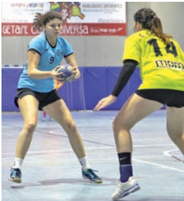
El Getasur, en un encuentro