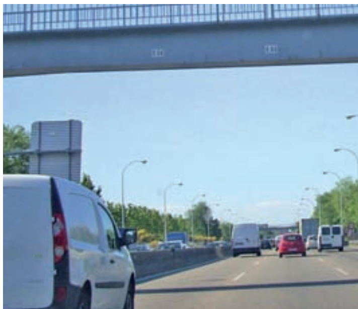
Un tramo de la autovía A-4