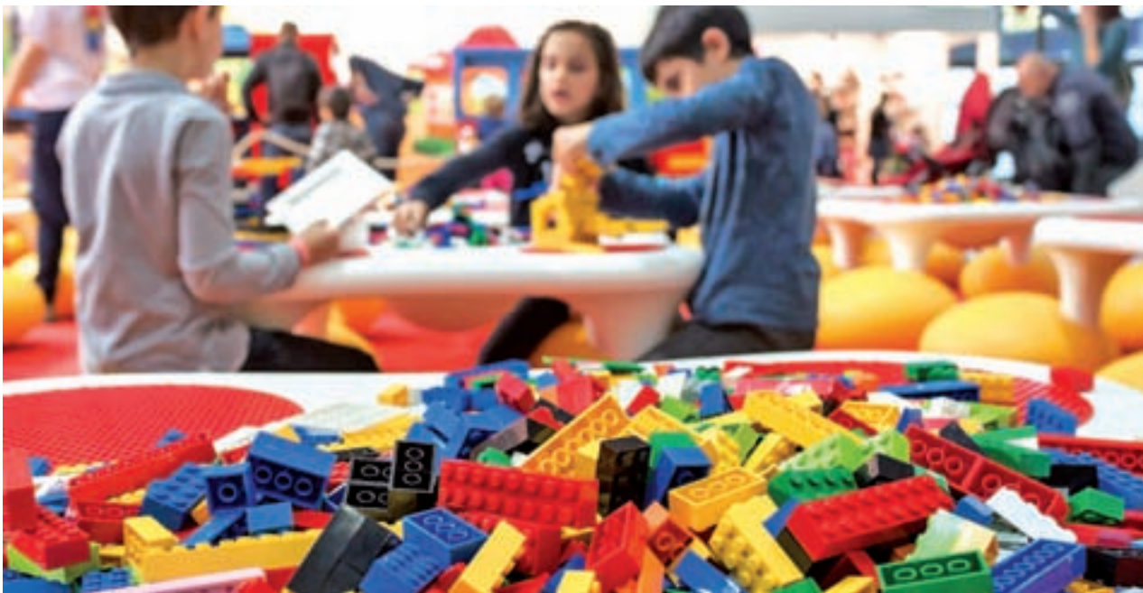
Los juegos tradicionales siguen en los primeros puestos