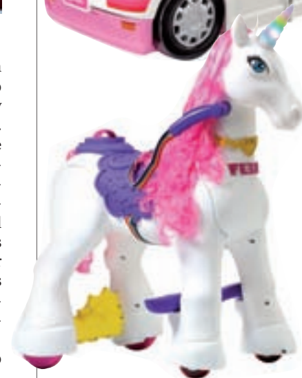
'My lovely Unicorn': Ideado por Feber se trata del primer unicornio que se puede conducir con una velocidad de 3 km/h.