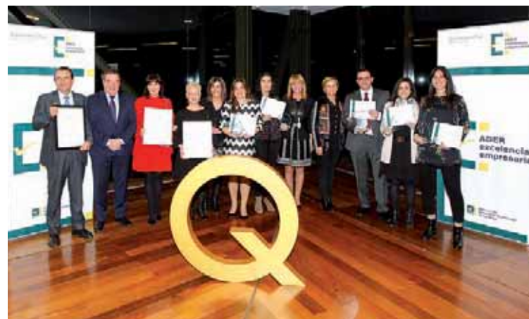
Premiados y autoridades tras la entrega de los premios.

El Gobierno regional destacó el compromiso de los organismos públicos para mejorar la calidad y el servicio a los ciudadanos, así como la apuesta por la excelencia de las empresas distinguidas.