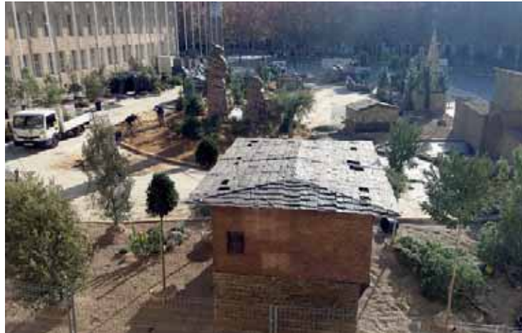
Varios operarios durante el montaje del belén monumental del Ayuntamiento.

Además, el sábado 15, a las 18 horas, se inaugurará la tradicional exposición de belenes en la Escuela Superior de Diseño con acceso por el paseo de Dax hasta el 7 de enero. Antes, el día 3, se dará a conocer al ganador del 34º Con-