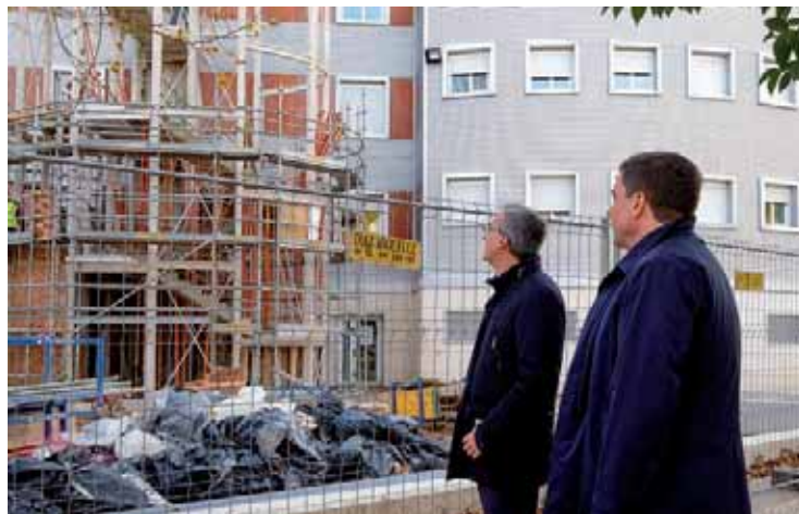
El rector y el consejero visitaron las obras del edificio Vives.

vas escaleras y ascensores y se mejorarán las condiciones térmicas y de habitabilidad con la instalación de un sistema autónomo de climatización y de una iluminación más eficiente energéticamente.