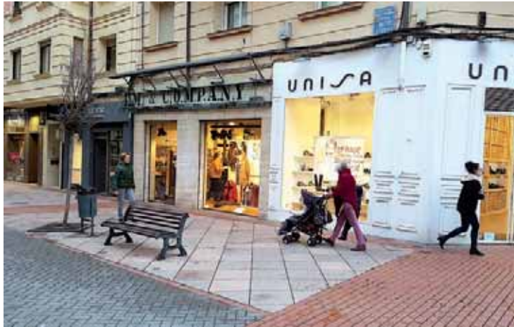
El comercio riojano experimentó un buen comportamiento en el tercer trimestre.

Domínguez subrayó los buenos datos del índice de confianza empresarial que aumentó un 1,1% respecto al trimestre anterior.