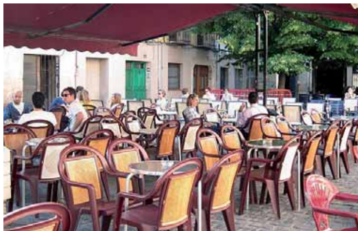
La restauración da empleo a 8.300 trabajadores en la región.

Según el Anuario de la Hostelería, en 2017 la región contabilizaba 1.917 locales de comidas y bebidas frente a los 1.895 de 2016, 143 menos de los 2.060 que te-