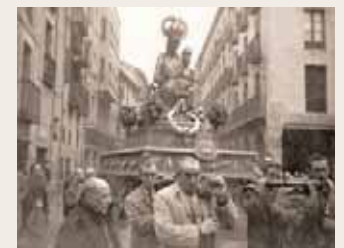
Virgen de la Esperanza, 1950.

por decisión del papa Pío XII, y el segundo desde el 18 de diciembre de 1976, otorgado en el Pleno municipal de la ciudad, siendo alcalde Narciso San Baldomero y Ruiz de Morales. Cada año sale en procesión dos veces: el 11 de junio, acompañando al patrón San Bernabé en sus fiestas, y el 18 de diciembre, durante las realizadas en su honor. La Cofradía de la Virgen de la Esperanza es la más antigua de Logroño -su fundación data del año 1612-, y se dedica a potenciar la veneración de la imagen. En la actualidad cuenta con 350 cofrades y en 2012 se cumplieron cuatro siglos de su fundación.