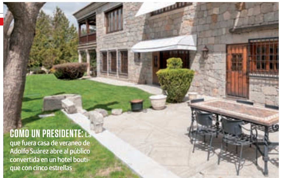
COMO UN PRESIDENTE: La que fuera casa de veraneo de Adolfo Suárez abre al público convertida en un hotel boutique con cinco estrellas

Fuera de nuestras fronteras la oferta es más amplia, comenzando por la Champaña francesa o la cuenca del Rin en Alemania, hasta otros más lejanos y exóticos, como el calos de las Maldivas o el encanto de Bali.