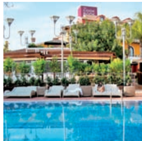
The CooBook, en Calpe