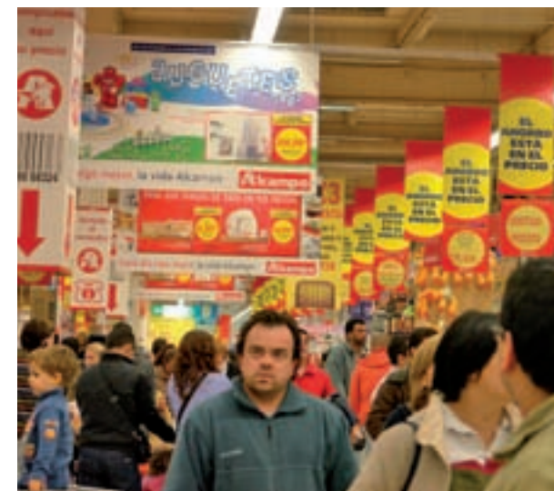
Los expertos apuestan por limitar los caprichos GENTE

Por vía online o en el comercio físico de toda la vida, la lista de preferencias en cuanto a regalos no difiere mucho de lo habitual. Ropa y calzado lideran este ranking, justo por delante de tecnología y perfumería.