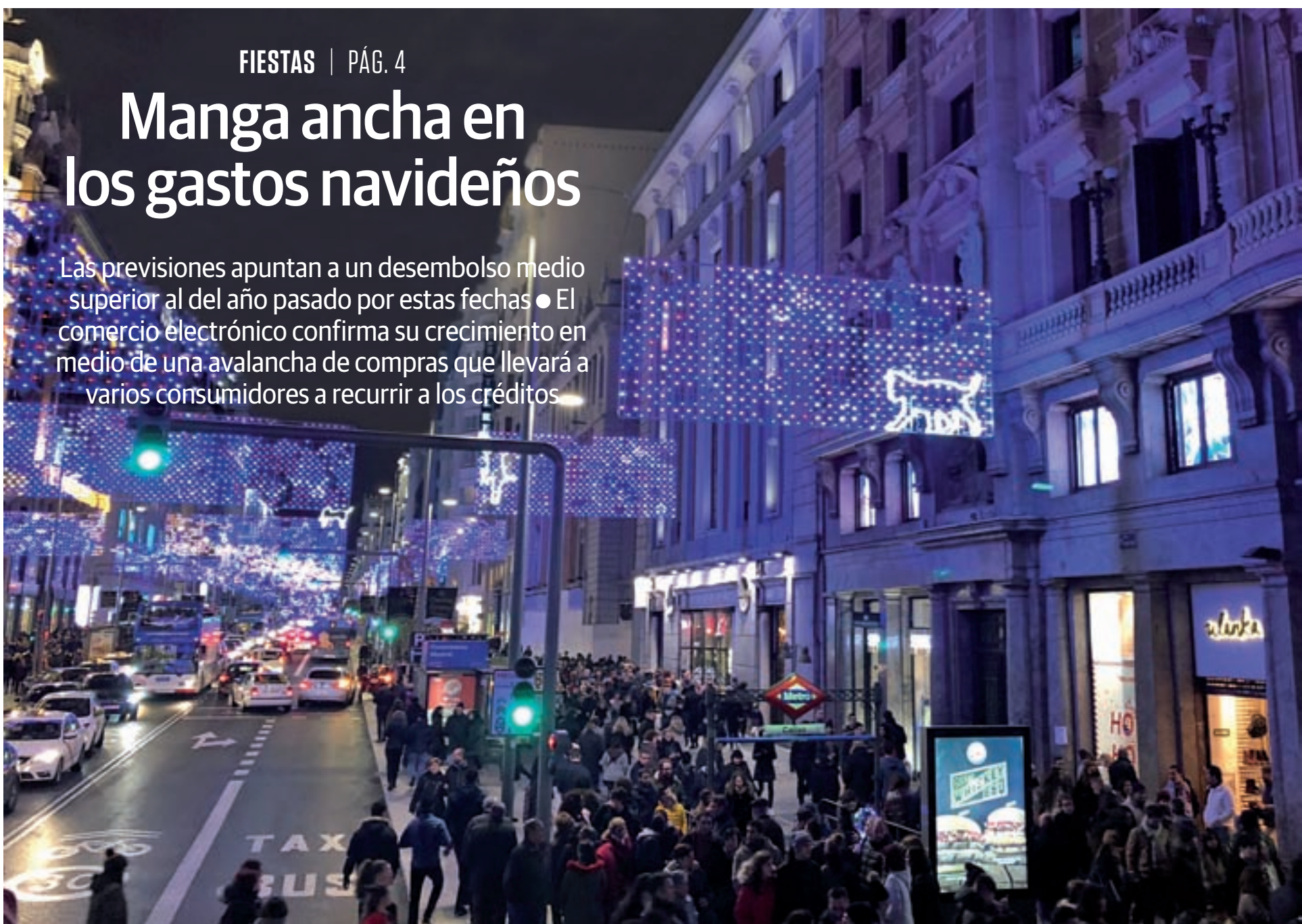
LUCA JIMÉNEZ / GENTE

Las previsiones apuntan a un desembolso medio superior al del año pasado por estas fechas ● El comercio electrónico confirma su crecimiento en medio de una avalancha de compras que llevará a varios consumidores a recurrir a los créditos