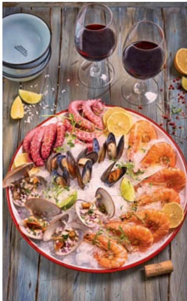
El marisco es una opción festiva poco calórica

● Entrantes Es preferible decantarnos por el marisco, que proporciona proteínas de alta calidad, vitaminas A y E y ácido fólico; mientras que es bajo en hidratos de carbono y grasas. Además, se puede optar por una ensalada de quinoa, una crema suave de calabaza o calabacín o un guacamole, a base de aguacate y zumo de limón.