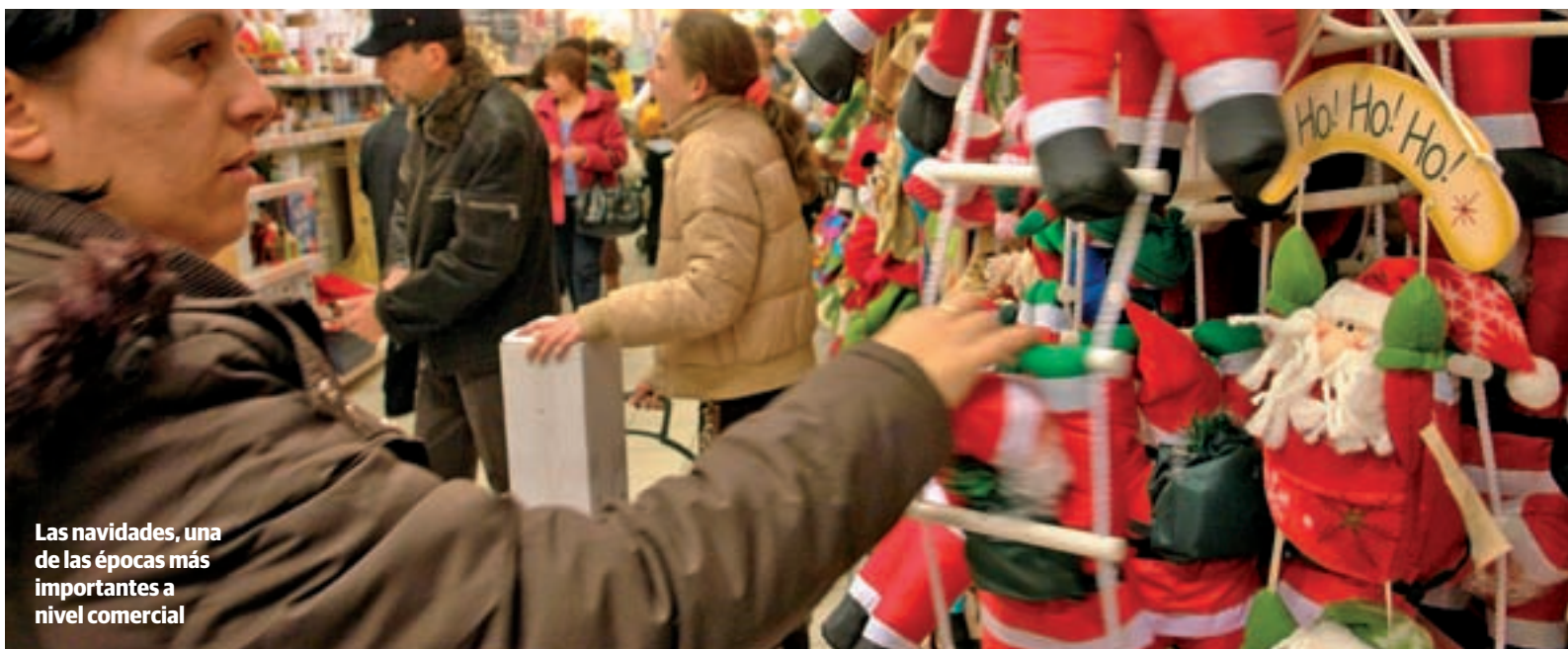
Las navidades, una de las épocas más importantes a nivel comercial