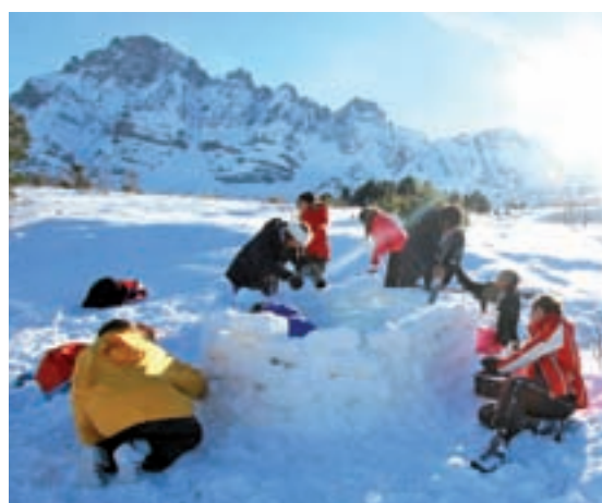
Dormir en un iglú es posible en el Valle del Tena

AL CALOR DE LA MESA: La cercanía del Mediterráneo hace de Calpe (Alicante), un lugar ideal para estas fechas, sobre todo cuando se puede visitar el restaurante The Cookbook, un hotel boutique que ha sido reconocido con una estrella Michelin y que tiene carta de temporada.