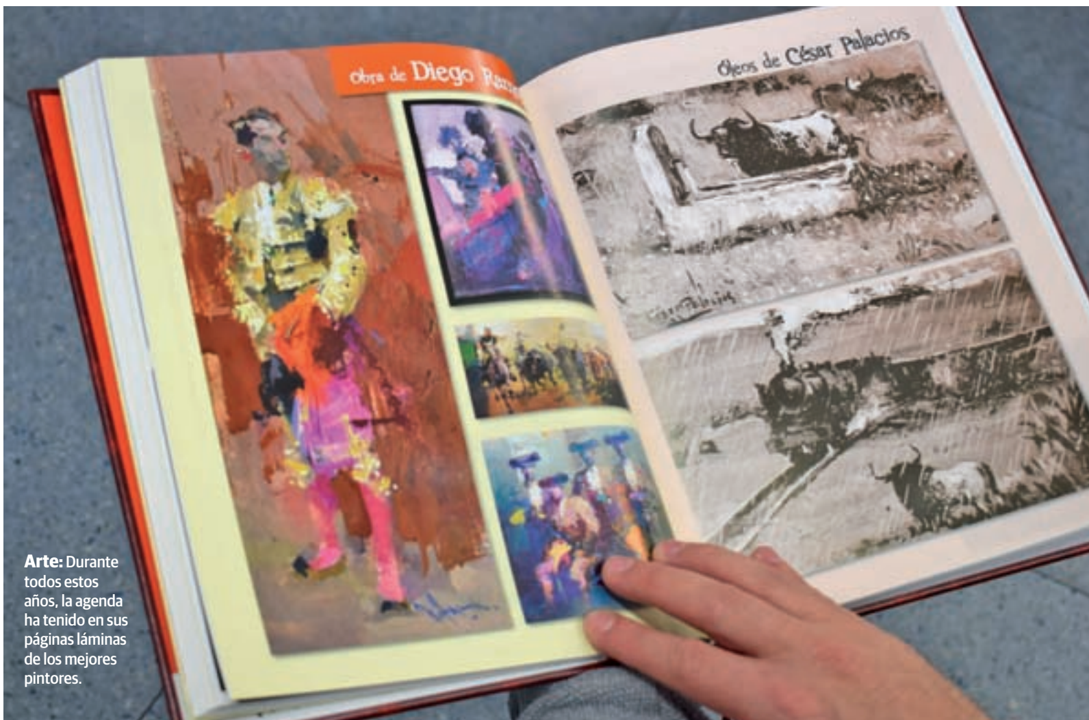
Arte: Durante todos estos años, la agenda ha tenido en sus páginas láminas de los mejores pintores.

UN ARTÍCULO PERFECTO PARA QUE CARGUEN REYES MAGOS Y PAPÁ NOEL