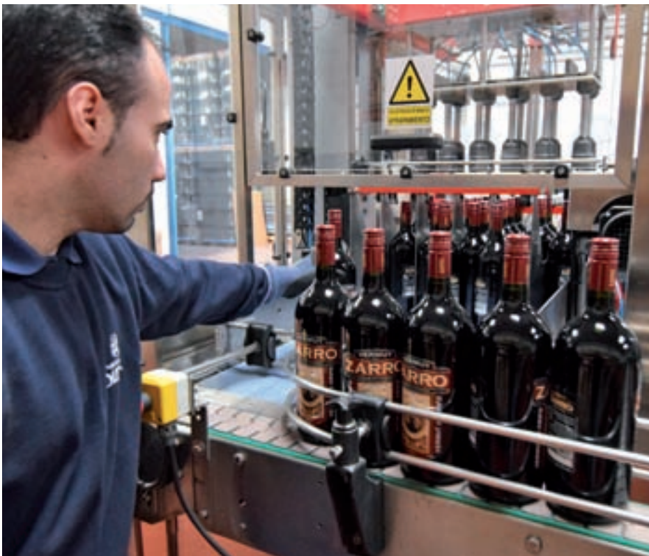
Un momento del proceso de embotellamiento

CONTENIDO ELABORADO EN COLABORACIÓN CON VERMUT ZARRO