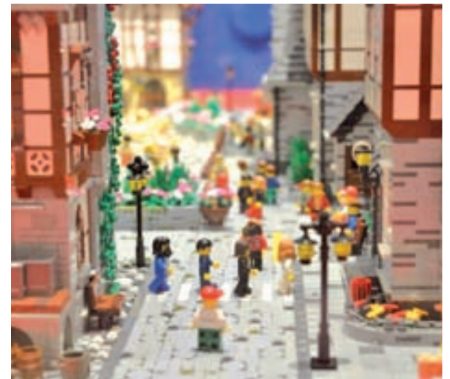
'I LOVE LEGO': El conocido Palacio de Gaviria, ubicado en el centro de Madrid, es el escenario de la exposición 'I love Lego'. El montaje, concebido por RomaBrick, está compuesto por seis instalaciones en miniatura formadas por más de un millón de piezas de este emblemático juego.

MADRID >> Plaza de Legazpi, 8 | Hasta el 23 de diciembre | Gratuito