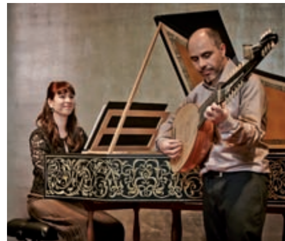
MÚSICA BARROCA: Fuera de la capital, el Palacio del infante don Luis de Boadilla del Monte acogerá un nuevo ciclo de conciertos de temática navideña que se celebrarán los próximos 22, 23, 29 y 30 de diciembre

Matadero Madrid acoge la cuarta edición de La Navideña Feria Internacional de las Culturas, una muestra de las diferentes formas de celebrar estas fechas en el mundo con más de 300 actividades que se desarrollarán hasta este domingo 23.