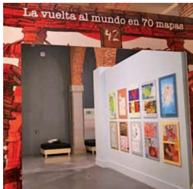
SALÓN DEL LIBRO: Madrid celebra el evento más importante especializado en libros para niños y jóvenes: el Salón del Libro Infantil y Juvenil. La iniciativa cumple 42 años y cuenta con un programa lleno de actividades gratuitas, como talleres, mesas redondas y presentaciones de autores, entre otras.

MADRID >> Palacio de Vistalegre | 28 y 29 de diciembre | Desde 17,25 euros