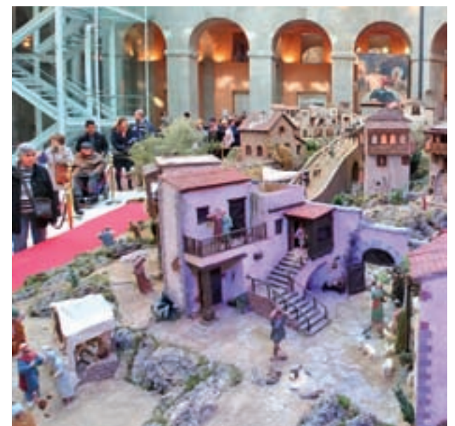
BELÉN TRADICIONAL: La sede de la Comunidad de Madrid, en plena Puerta del Sol, acoge su tradicional belén. En esta ocasión, cuenta con más de 350 figuras hechas a mano por la Asociación de Belenistas de Madrid. Lo interesante es que cuenta con réplicas de escenarios como la Puerta de Alcalá o el Museo del Prado.

MADRID >> Centro Conde Duque | Hasta el 4 de enero de 2019