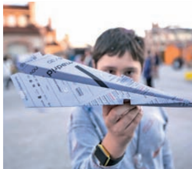
JUEGOS DE TODO EL MUNDO: Matadero, con motivo de 'La Festeña. Feria Internacional de las Culturas', se ha convertido en un gran salón con juegos de diferentes partes del mundo. Entre otros, los niños podrán jugar a mangala (de inspiración africana y asiática), el tejo chileno, el coreano jegichai o el roller derby.

MADRID >> Plaza Puerta del Sol, 7 | Hasta el 5 de enero | Gratuito