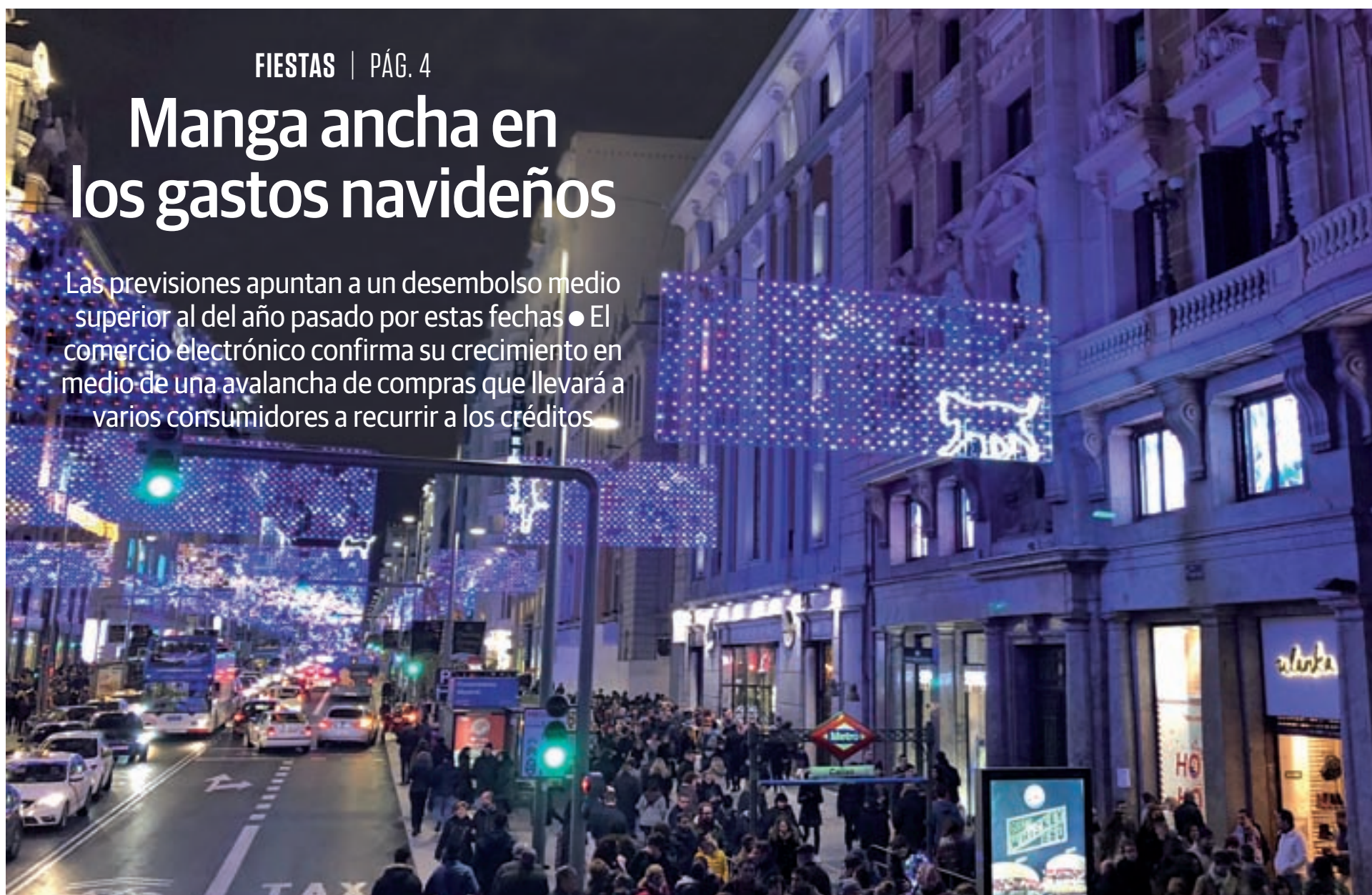
LUCA JIMÉNEZ / GENTE

Las previsiones apuntan a un desembolso medio superior al del año pasado por estas fechas ● El comercio electrónico confirma su crecimiento en medio de una avalancha de compras que llevará a varios consumidores a recurrir a los créditos