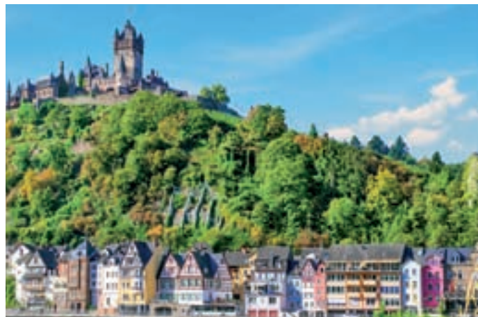
Un crucero por el Rin ofrece paisajes dignos de postal