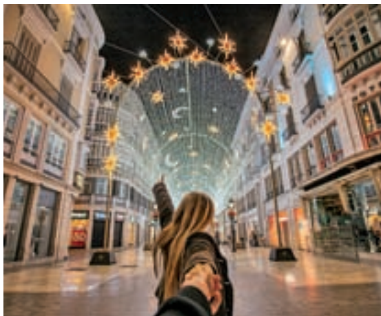
Málaga brilla con su alumbrado

COMO UN PRESIDENTE: La que fuera casa de veraneo de Adolfo Suárez abre al público convertida en un hotel boutique con cinco estrellas a los pies de la Muralla de Ávila.