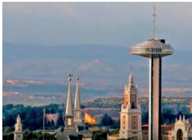
FARO DE MONCLOA: Se trata de un mirador desde el que poder disfrutar de una de las mejores vistas de la ciudad. Situado a 92 metros de altura, supone un gran reclamo turístico. Además, quien quiera podrá conocer la historia de la ciudad contada a través de paneles

Un ejemplo de ello es que los amantes del patinaje sobre hielo podrán elegir entre varias pistas repartidas por la región entre las que destaca la Galería de Cristal del Palacio de Cibeles, que se abre este viernes 21 hasta el 5 de enero. Además, el