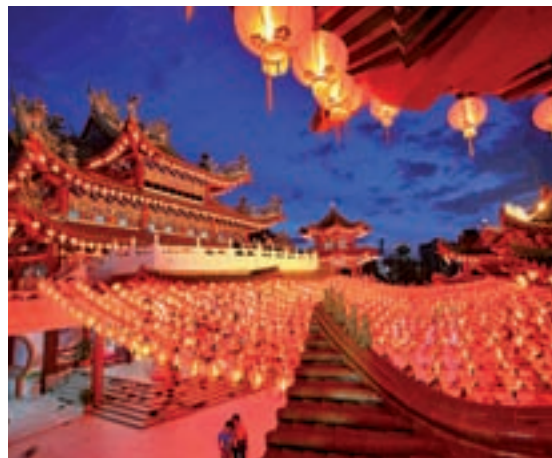
China, una interesante oportunidad a final de año