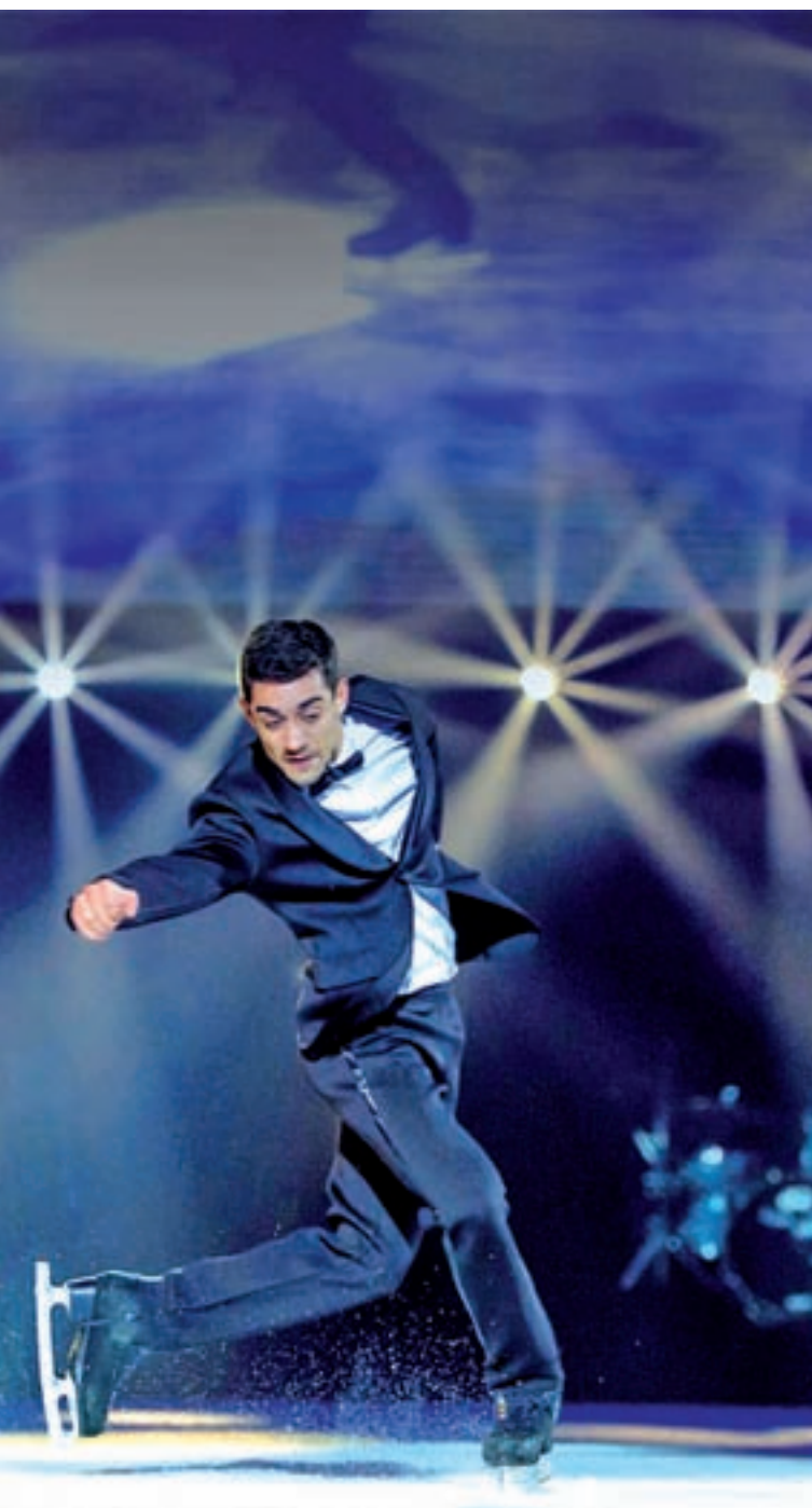
'REVOLUTION ON ICE TOUR': El patinador español Javier Fernández, medallista de bronce en los juegos de PyeongChang, lidera 'Revolution On Ice Tour', un show en el que estrellas mundiales del patinaje muestran su talento sobre la pista de hielo con música en directo de artistas de primera línea.

MADRID >> Palacio de Vistalegre | 28 y 29 de diciembre | Desde 17,25 euros