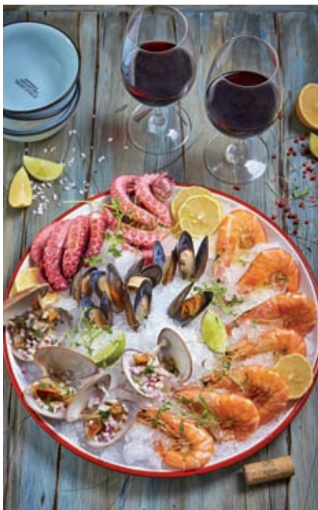
El marisco es una opción festiva poco calórica

● Entrantes Es preferible decantarnos por el marisco, que proporciona proteínas de alta calidad, vitaminas A y E y ácido fólico; mientras que es bajo en hidratos de carbono y grasas. Además, se puede optar por una ensalada de quinoa, una crema suave de calabaza o calabacín o un guacamole, a base de aguacate y zumo de limón.