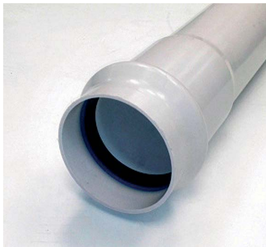
El componente de plástico de la junta Caud-E-Lock, singularidad del proyecto, ofrece una cómoda y rápida fijación manual de la junta dentro de la campana del tubo.

La experiencia de la que ya disponía Caudenor en la inclusión de un anillo de plástico en pequeños diámetros sirvió de gran ayuda para el diseño de las nuevas juntas de gran tamaño.