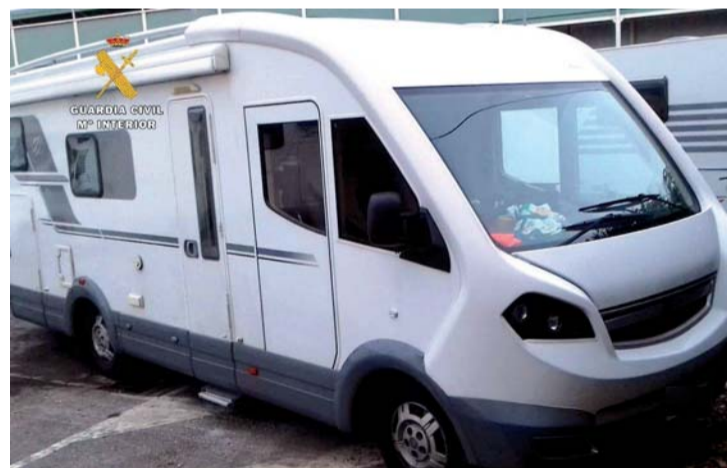
La caravana tenía matrícula falsa y el número de bastidor modificado.