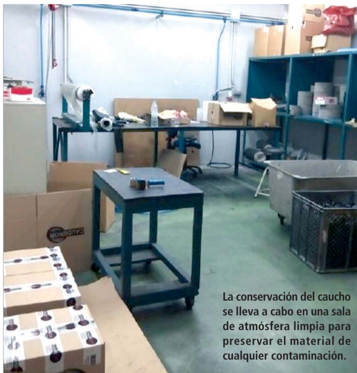
La conservación del caucho se lleva a cabo en una sala de atmósfera limpia para preservar el material de cualquier contaminación.

El producto final de todo este trabajo de investigación y desarro-