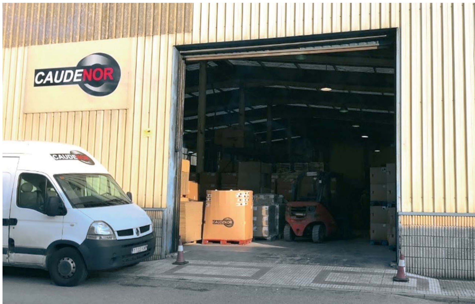
La empresa Caudenor, fundada en 2014, se encuentra radicada en el Polígono de Trascueto, en Revilla de Camargo.

Caudenor, empresa cántabra radicada en Revilla de Camargo, lleva un año trabajando en un proyecto de investigación de nuevas juntas de estanqueidad para canalizaciones de PVC de grandes diámetros