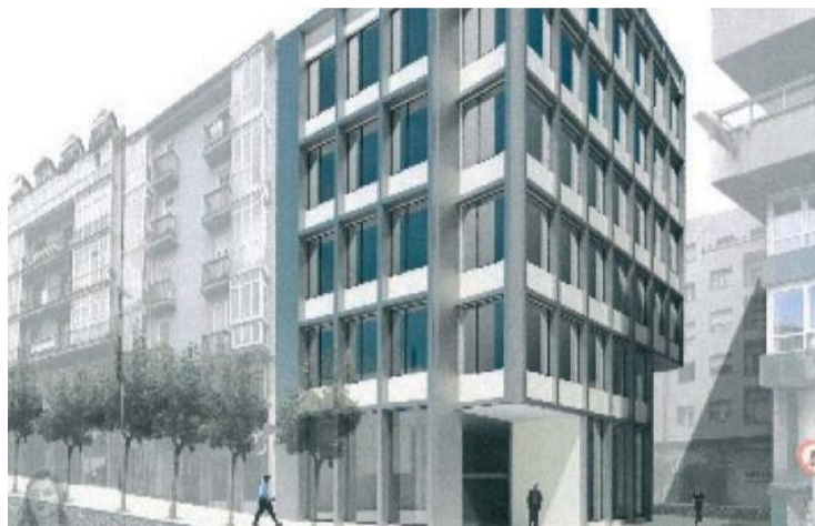
Infografía de lo que será el futuro edificio administrativo en la calle La Paz.

Las obras se han suspendido ahora hasta después de las fiestas y cuando se reanuden en enero se podrá comenzar ya la excavación para las dos plantas de sótano que tendrá el futuro edificio, en el que se pretende aglutinar en un futuro todos los servicios relacionados con el área económica del Ayuntamiento. El proyecto, que se ejecuta a través de la Sociedad de Vivienda y Suelo (SVS), conlleva una inversión de 2,6 millones de euros y tiene un plazo de ejecución de 14 meses. El edificio tendrá una superficie