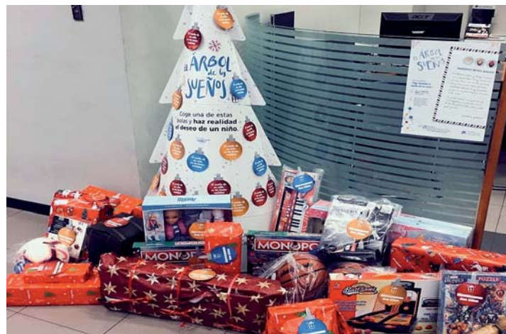
Árbol de los Sueños en una oficina de Caixabank.