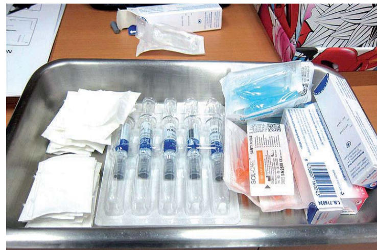
Se continuará el suministro de vacunas hasta que se agoten las existencias.

La tasa global de incidencia de gripe asciende a 43,6 casos por 100.000 habitantes, si bien se sitúa aún por debajo del umbral basal establecido para la temporada 2018-19 (55,5 casos por 100.000 habitantes). En cuanto a la evolución por grupos de edad, se observa un ascenso significativo de las tasas en el grupo de 5 a 14 años, si bien las tasas más elevadas se observan en los grupos menores de 15 años.