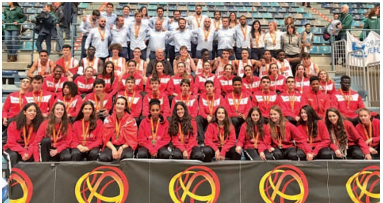
Foto de familia de los tres equipos madrileños de baloncesto que subieron al podio