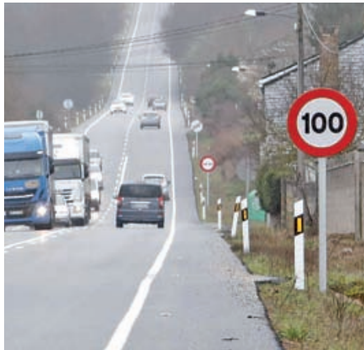
Una carretera convencional

Esta iniciativa supone reducir la diferencia de velocidad entre vehículos de transporte