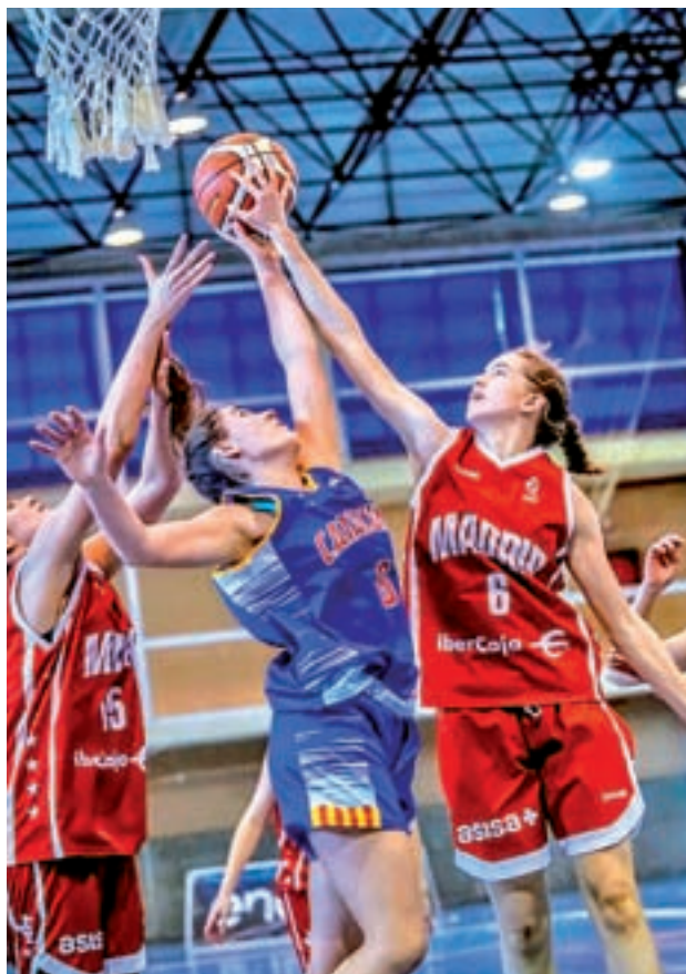
El infantil femenino no dio opción a Cataluña en la final