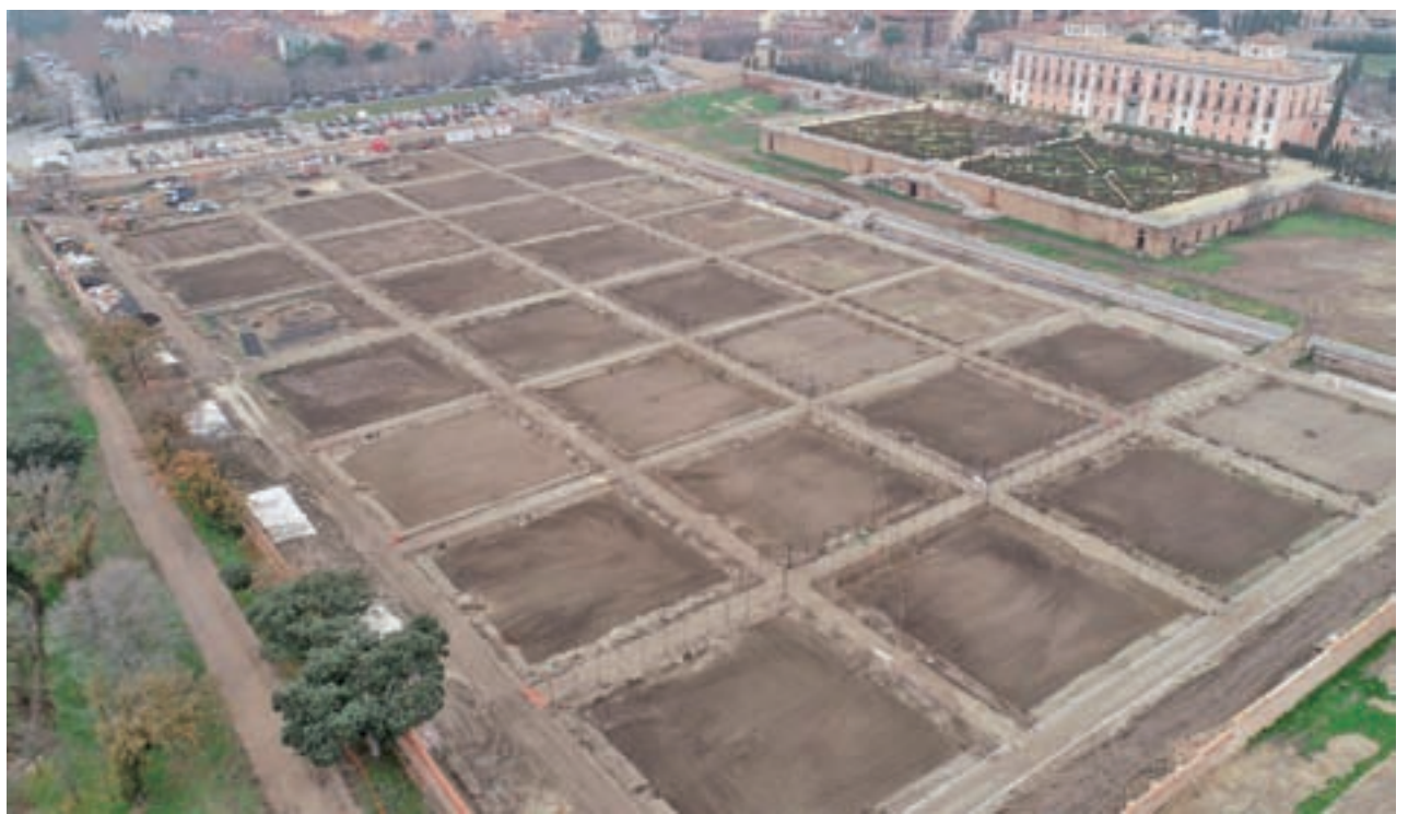
Estado de los trabajos en el Palacio del Infante

nanza por 219.000 euros y en Los Fresnos por un importe de 569.000 euros. A lo largo del año se aprobará una nueva operación de asfalto, aunque quedan por cerrar los flecos de la adjudicación.