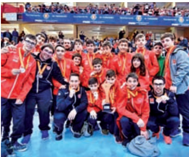
El infantil masculino de balonmano también subió al podio