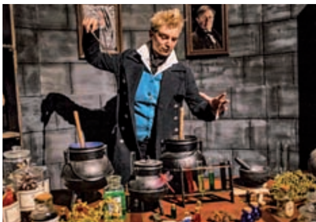
'EL ANDÉN MÁGICO': No es sólo una exposición, sino una experiencia en la que los fanáticos de la saga de Harry Potter podrán recorrer los pasillos del castillo de Hogwarts. Estará en el Espacio Fandome, en Madrid, hasta el 10 de febrero