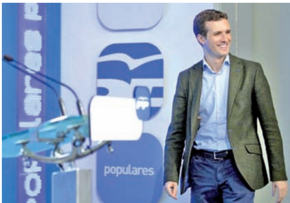
Pablo Casado revela todos sus candidatos esta semana

Con este anuncio, el líder de los populares cierra el tour por España que inició a primeros de diciembre y cumple con su compromiso de revelar a los cabezas de lista de todas las autonomías y capitales de provincia, antes de la Convención Nacional del PP que se celebrará en Madrid los días 18, 19 y 20 de enero, en la que darán por iniciada la precampaña electoral.