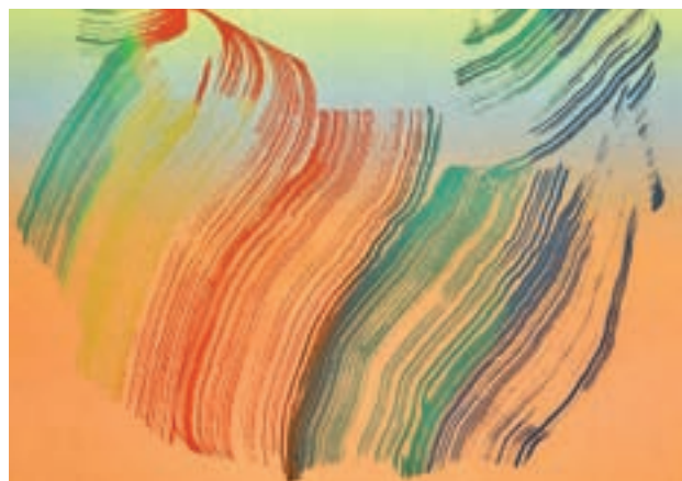
JOSÉ MANUEL BROTO: Una retrospectiva de este artista, ganador del Premio Nacional de Arte Gráfico 2017, en la que, además, se realiza un homenaje a los estampadores que trabajaron con él. Hasta el 10 de marzo en la RABASF (Madrid)