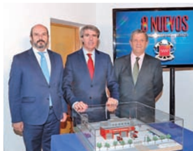
Presentación de los nuevos parques

La actuación llevará consigo la incorporación de 536 nuevos profesionales a una plantilla que estará integrada así por un total de 1.836 efectivos, frente a los 1.300 actuales. Esto convertirá a Madrid en la comunidad con un mejor ra-