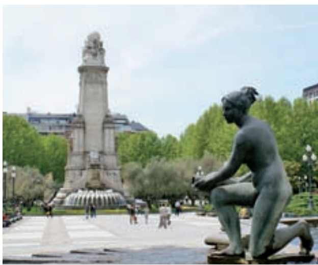
Estado actual de la Plaza de España GENTE