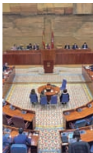
Asamblea de Madrid

Concretamente, el artículo 10.2 establece que la Asamblea estará compuesta por un diputado por cada 50.000 habitantes o fracción superior a 25.000. El último dato del Pa-