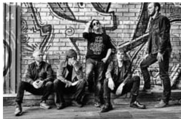
Tendrá lugar el 25 y 26 de enero