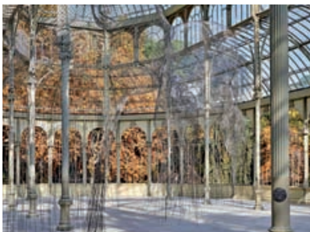
'INVISIBLES': Las mallas de acero moldeadas por su creador Jaime Plensa dibujan rostros inacabados de figuras suspendidas en el aire, atravesadas por la luz y detenidas en el tiempo en el espacio del Palacio de Cristal (Madrid). Hasta el 3 de marzo