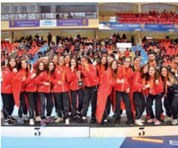
El cadete femenino de balonmano fue bronce FM BALONMANO

El otro punto de interés estuvo en Valladolid, donde tres combinados madrileños (juvenil masculino, infantil masculino y cadete femenino) se quedaron a las puertas de las finales nacionales de balonmano, aunque a cambio mostraron una gran capacidad de reacción para colgarse la medalla de bronce.