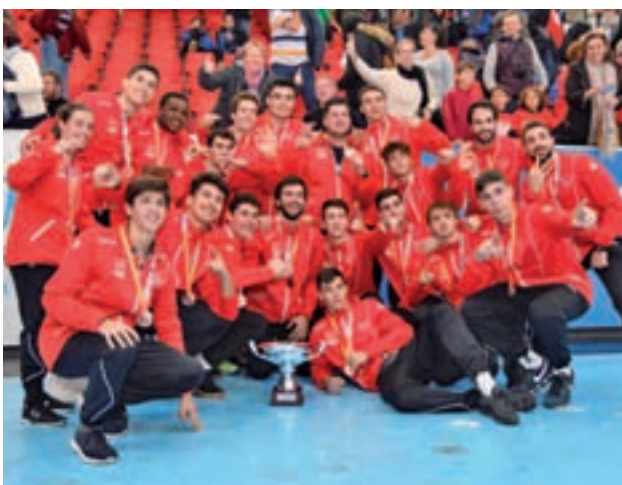
El juvenil de balonmano ganó la final de consolación