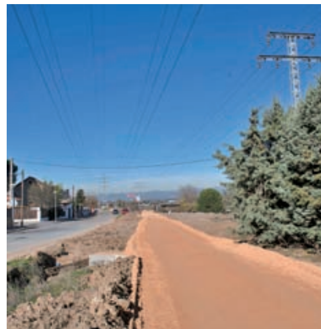
Urbanización La Cabaña