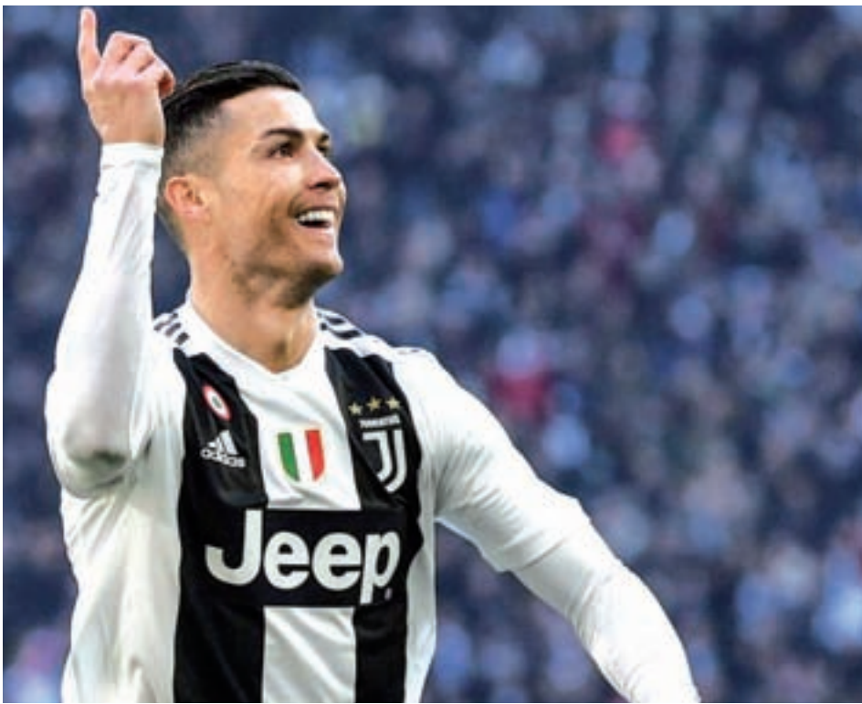
Ronaldo ha marcado 14 goles con la Juventus en la primera vuelta de la Serie A