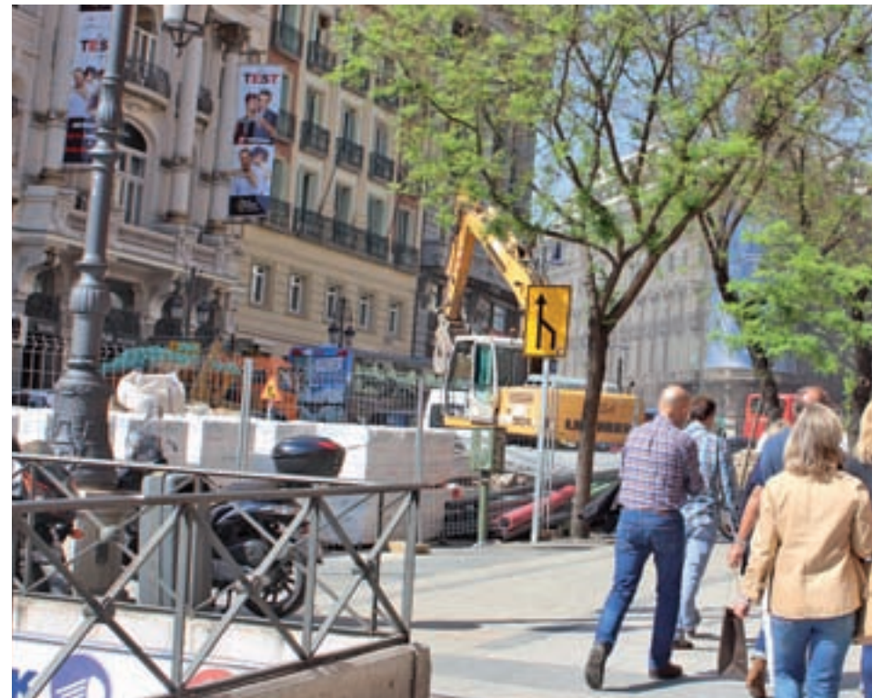
Entorno de Canalejas GENTE

El Ayuntamiento comenzará en marzo la reordenación de las calles del entorno de Canalejas ● Se eliminarán varios carriles para el tráfico y se ampliará el espacio para los peatones