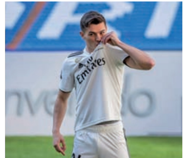
Brahim Díaz le ha costado al Real Madrid 15 millones

Con la Liga casi imposible, al Madrid le queda el comodín recurrente de los últimos años, la Champions, pero ese objetivo se antoja utópico viendo su rendimiento actual y tras la marcha de Cristiano Ronaldo, quien, sin ir más lejos, la pasada edición del torneo europeo marcó 15 tantos, seis de ellos en las eliminatorias de octavos y cuartos de final ante el PSG y la Juventus.