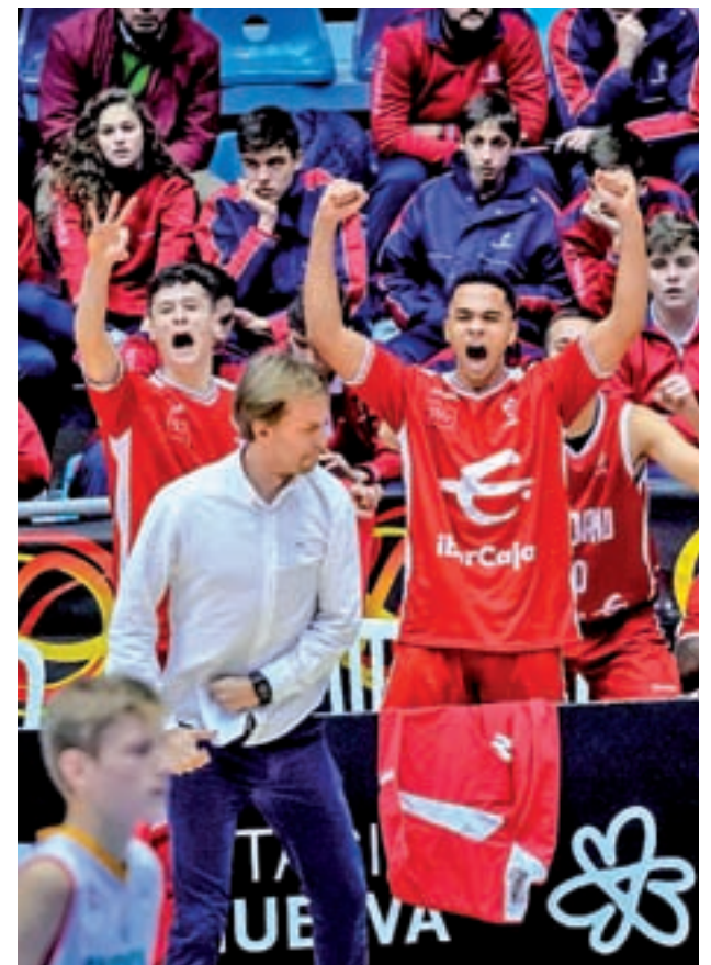
El cadete masculino, campeón por tercera vez consecutiva