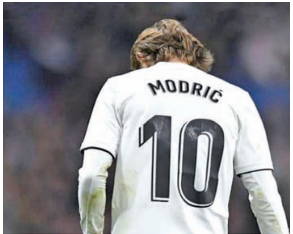
El Real Madrid vive su peor sequía goleadora desde la temporada 1993-1994