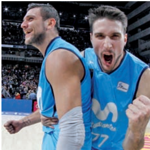
Los colegiales celebraron su triunfo en el derbi ESTUDIANTES

La situación empezó a cambiar el 3 de enero. El UCAM Murcia hincaba la rodilla ante un Movistar Estu-