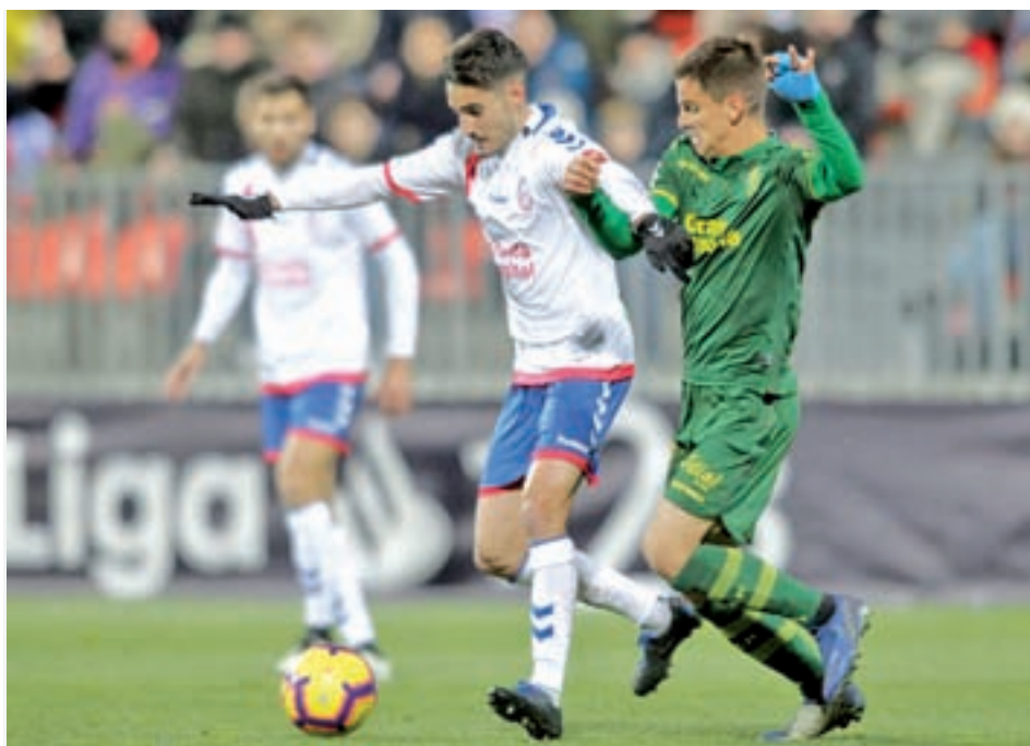
Empate en el Cerro del Espino RAYO MAJADAHONDA