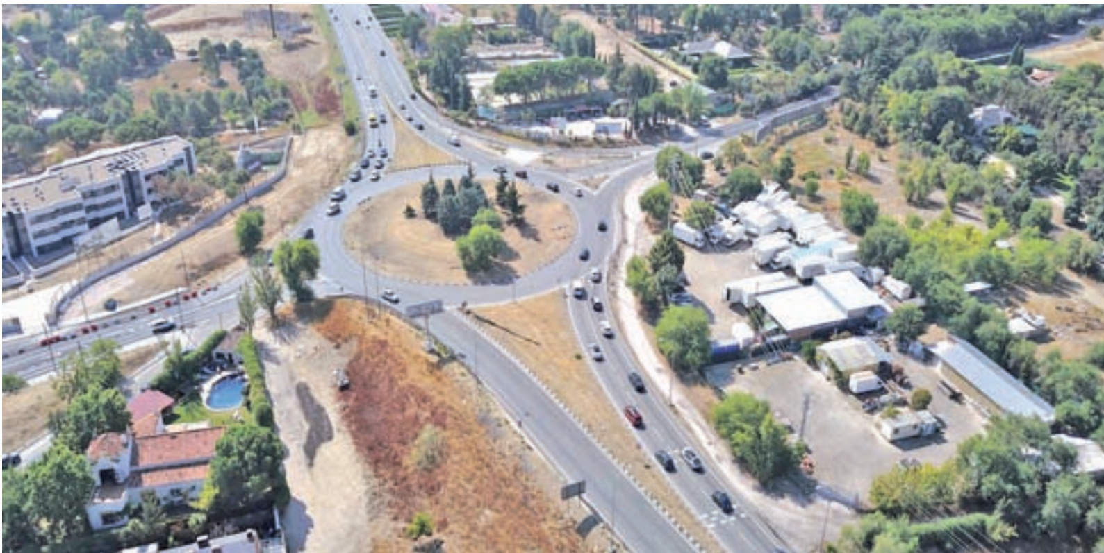
La rotonda de la M-513