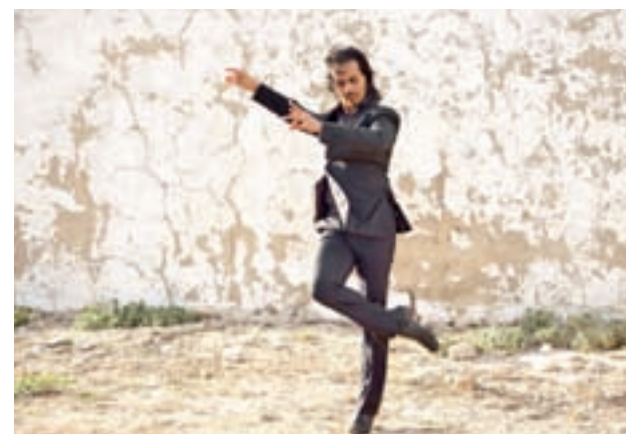
El bailar Farruquito actuará en el Teatro Circo Price

De forma paralela, la sala El Sol, apadrinará Inververso, un ciclo que busca un acercamiento mutuo entre el mundo de la música y las letras, uniendo a poetas y artistas en un mismo plató.