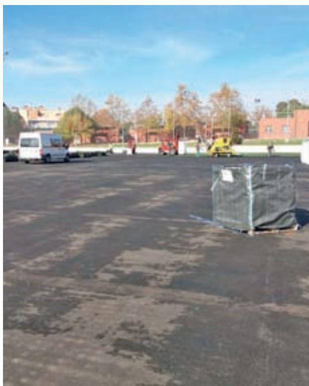
Trabajos en Navalcarbón