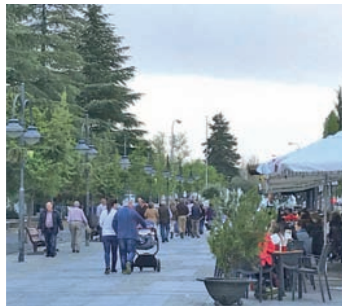
Zona de Roza Martín

El Consistorio también tiene previsto este año comenzar proyectos que no verán la luz hasta el 2020. Estas obras incluyen nuevas instalaciones como los campos de rugby que se van a instalar en la zona del Recinto Ferial. También la Cruz Roja tendrá un nuevo edificio, para el cual el Ayuntamiento ha cedido el suelo. Otra de las actuaciones es la reforma de la pista de atletismo, que se encuentra en fase muy inicial con la petición del proyecto.