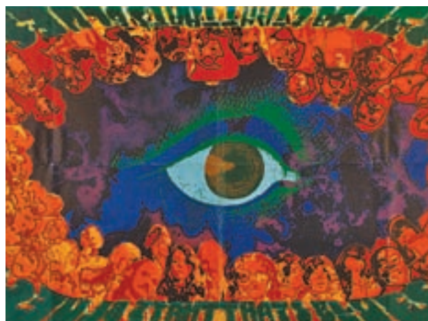
'PSICODELIA EN LA CULTURA VISUAL': La historia de la música contada a través del papel, de carteles de conciertos, de los posters checos y de más de 300 portadas de discos. Estará hasta el 20 de enero en el Círculo de Bellas Artes (Madrid)