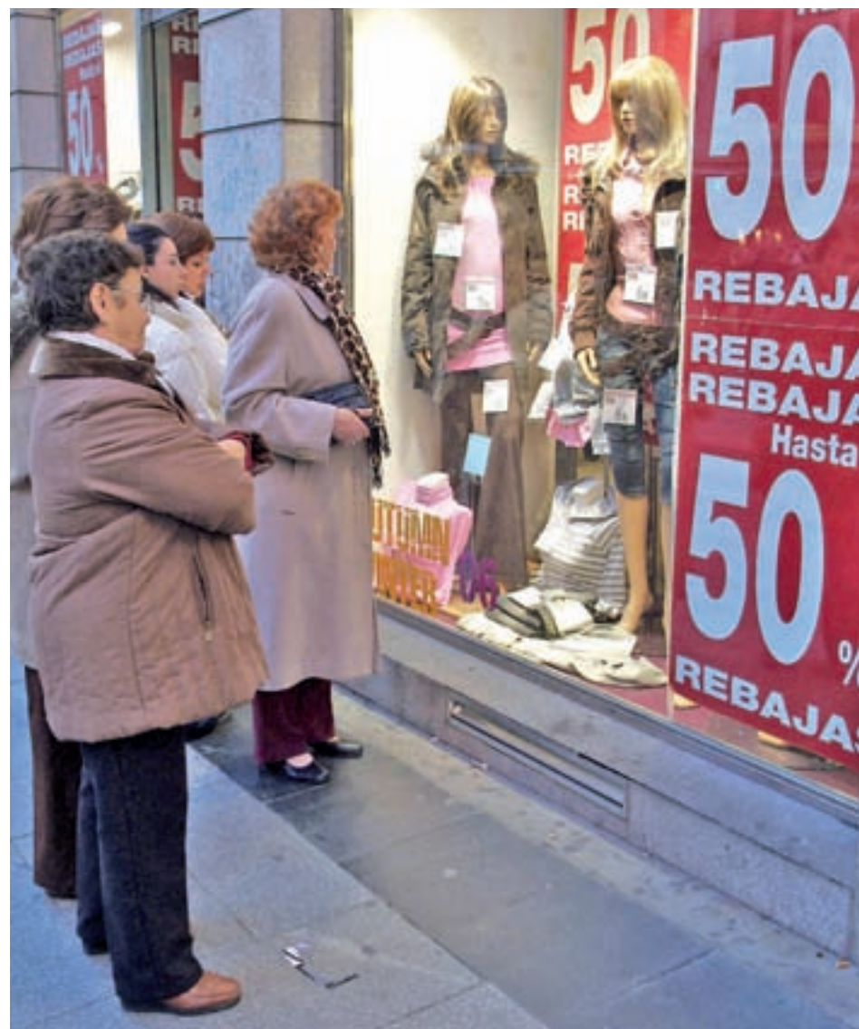
El fin de las fiestas navideñas supone el inicio de los descuentos de invierno GENTE

Antes de adquirir un producto desde el Portal del Consumidor de la Comunidad de Madrid recomiendan consultar la política de devoluciones de la tienda. Así pues, en el caso de que el cliente quiera devolver el producto por diversos motivos como cambio de talla, color o modelo, el establecimiento es libre de aceptarlo o no. Pero si durante el resto del año admite la opción de devolución y en rebajas no, debe anunciarlo claramente a los consumidores.