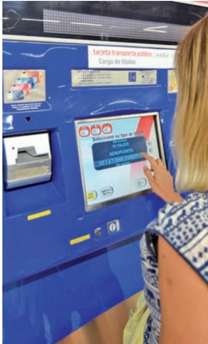
Máquina para recargar los títulos de transporte GENTE

Por último, las tarifas del taxi han experimentado un ligero incremento, aunque esta subida va ligada a la eliminación de casi todos los suplementos que se aplica-