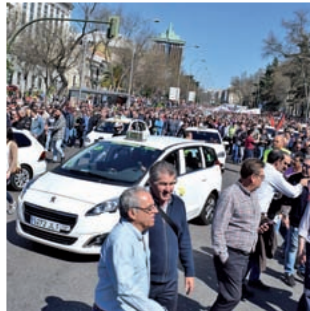
Protesta de los taxistas contra los VTC

Exigen a la Comunidad de Madrid que regule "de forma inmediata" las licencias VTC • El Gobierno regional les convoca a una reunión para ofrecerles una "reforma exprés"