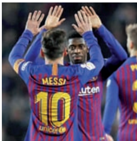
Messi lidera la tabla del 'pichichi'