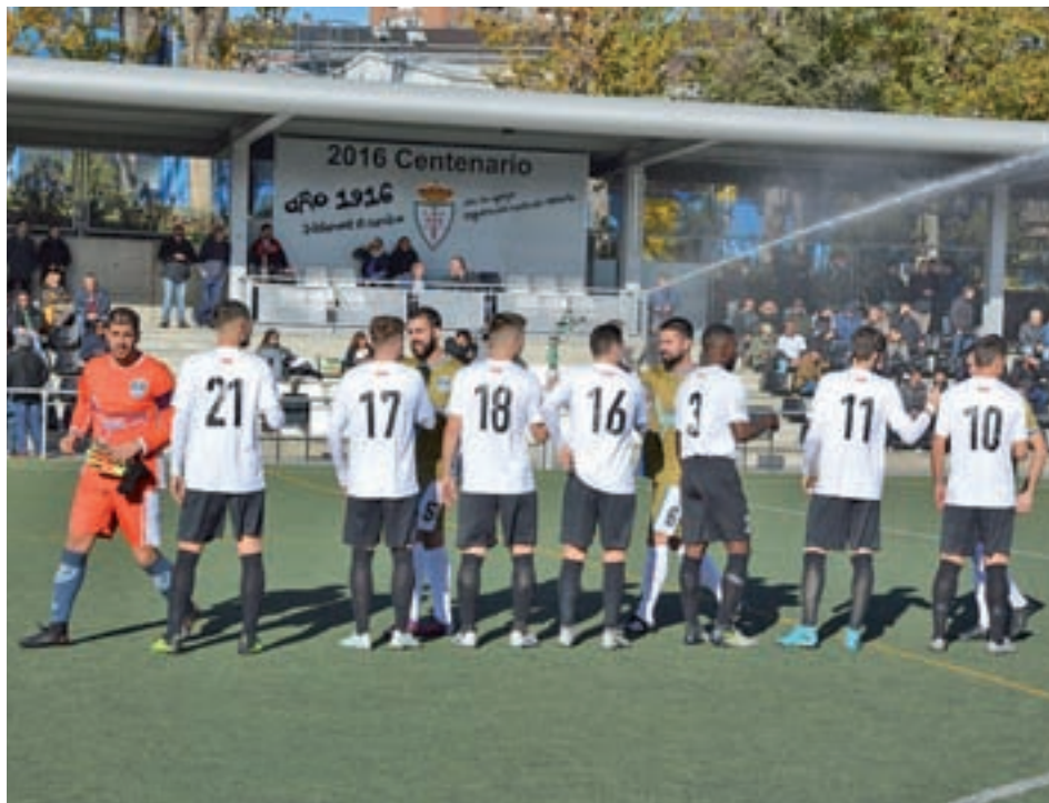
El 'Cara' no pudo pasar del empate con el San Agustín del Guadalix CARLOS ADÁN / REAL CARABANCHEL

Igualdad: En la primera vuelta, el Carabanchel y el Pozuelo firmaron las tablas en La Mina