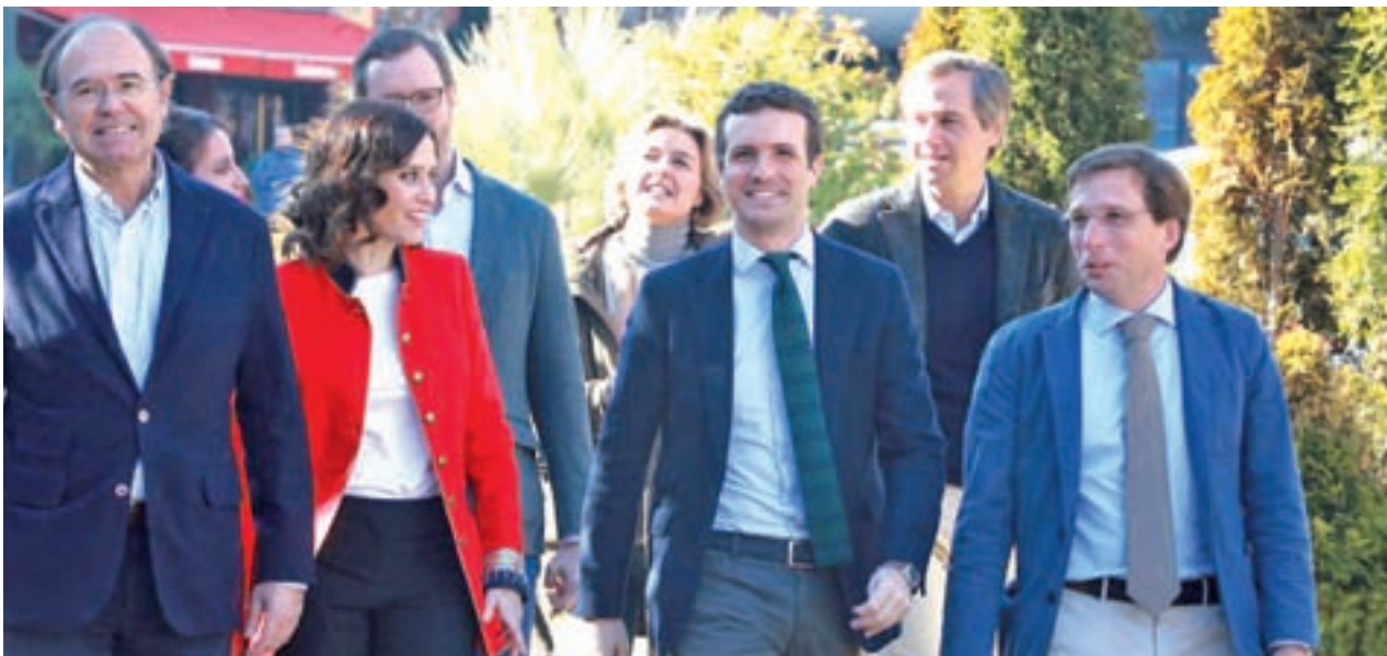
Isabel Díaz Ayuso, Pablo Casado y José Luis Martínez-Almeida, en el acto de presentación de los candidatos madrileños