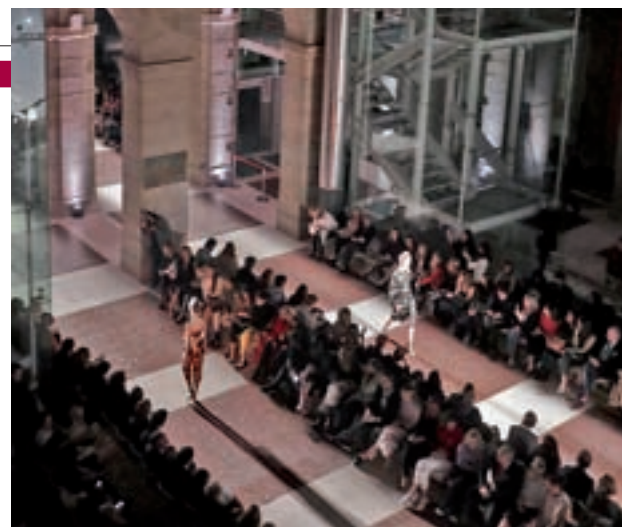
Desfile de Roberto Verino en sede de la Comunidad de Madrid

nueva configuración de espacios. De este modo, se mantendrán las dos pasarelas, si bien una de ellas aportará mayor funcionalidad al ofrecer un planteamiento po-