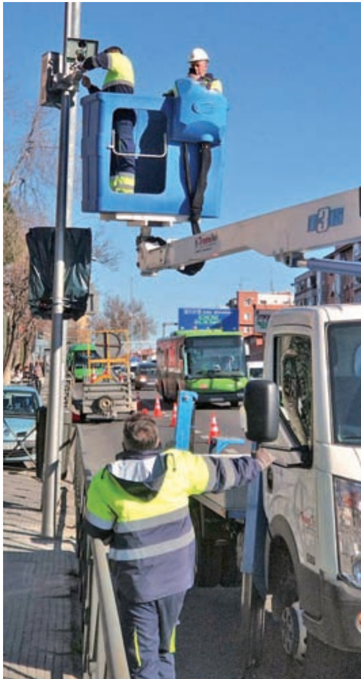
Los operarios ultiman la instalación del dispositivo @SERGIO_GFP

Al principio, el límite de velocidad se situará en 70 kilómetros por hora, pero la intención del Consistorio de Ahora Madrid es reducirlo a 50, una vez concluya la transformación de la A-5 en vía urbana, un proyecto que debe-