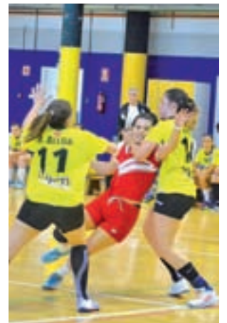
El Base es décimo