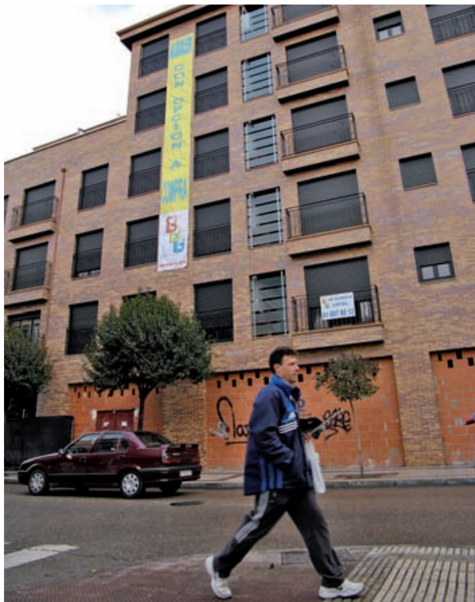
Pisos en venta en Madrid GENTE

Fijándose en los municipios, la capital se situó algo por debajo de la media regional, con una subida del 19,79% y un metro cuadrado que se eleva hasta los 3.623 euros, solo por detrás de Barcelona (4.788