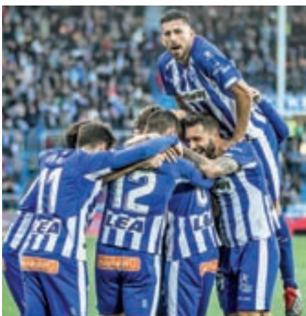
La mejor primera vuelta histórica del Alavés