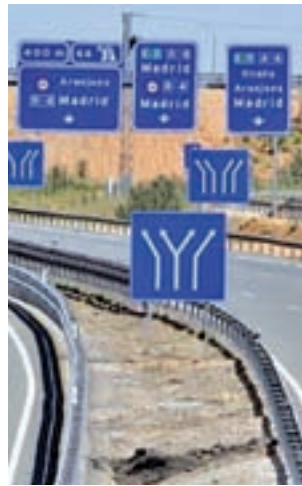
Autopista de peaje R-4

Con esta bajada, Fomento pretende igualar los distintos peajes que cada una presentaban e incentivar el aumen-