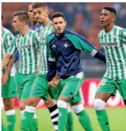
El Betis es séptimo