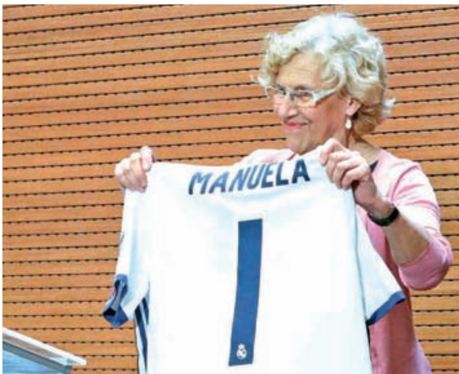
La alcaldesa de Madrid, en un acto en Cibeles