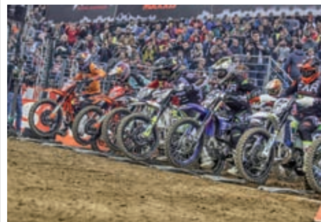
La prueba, el sábado en la Caja Mágica

El Real Madrid jugará en horario matinal (12:30 horas) para recibir a un Montakit Fuenlabrada que no sólo se quedó sin plaza en la Copa del Rey, sino que además ha caído a los puestos de descenso. De esa amenaza huye un Movistar Estudiantes que ya es decimocuarto. Los colegiales, con el empujón anímico de hacerse con un billete para el torneo del KO, cerrarán la jornada (19:30 horas) recibiendo la visita del Iberostar Tenerife.