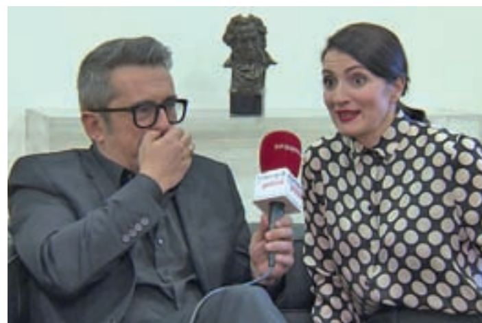
Buenafuente y Silvia Abril serán los presentadores

Ese momento será, quizás, el contrapunto de una gala en la que los presentadores, Silvia Abril y Andreu Buenafuente, ya han adelantado que "ofenderán" hablando de reivindicaciones.