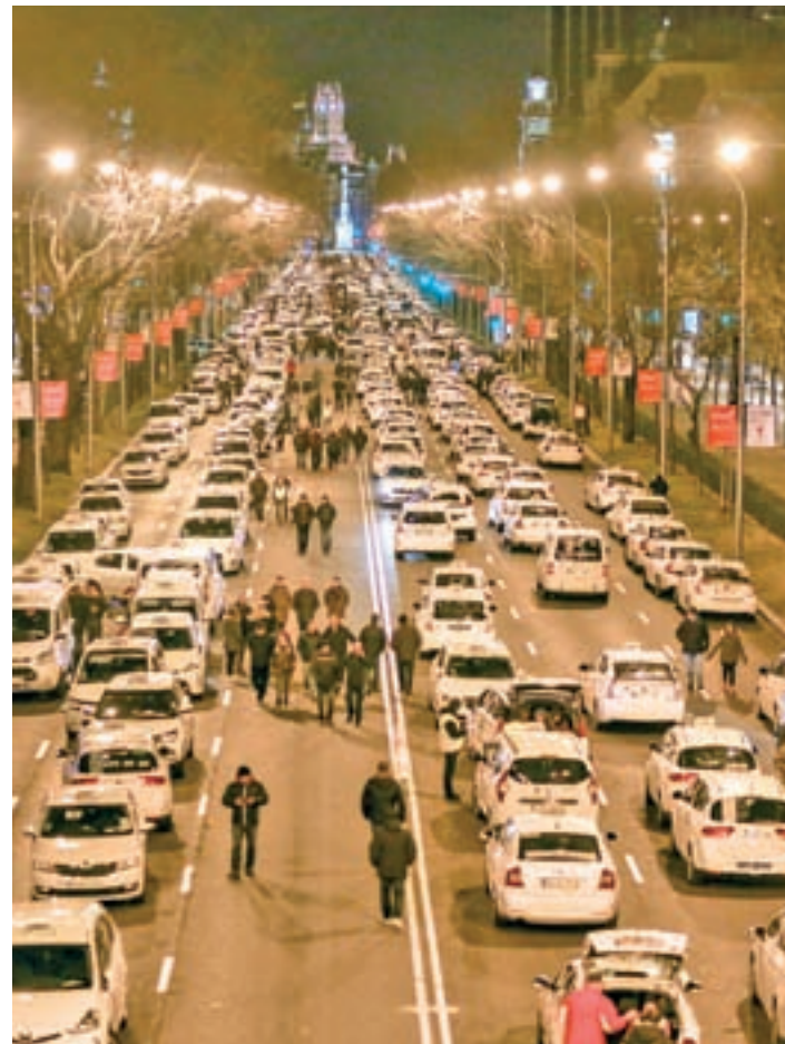
Los taxistas bloquearon el Paseo de la Castellana

En medio de este clima de tensión, la posibilidad de llegar a un acuerdo que acabe con la huelga parece lejana, al menos al cierre de estas líneas. El principal punto de fricción entre las partes está en la contratación de los servicios de los Vehículos de Al-