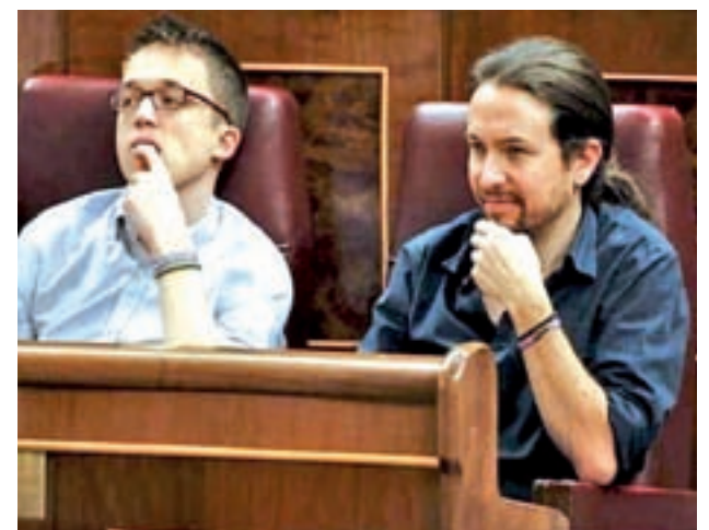
Pablo Iglesias e Íñigo Errejón, en una foto de archivo

No obstante, desde la formación quisieron dejar claro que la exploración de acuerdos con otras fuerzas políticas, en referencia a la de Errejón, irá después de que Unidos Podemos conforme una candidatura "potente" para la Comunidad de Madrid mediante un proceso "participativo".