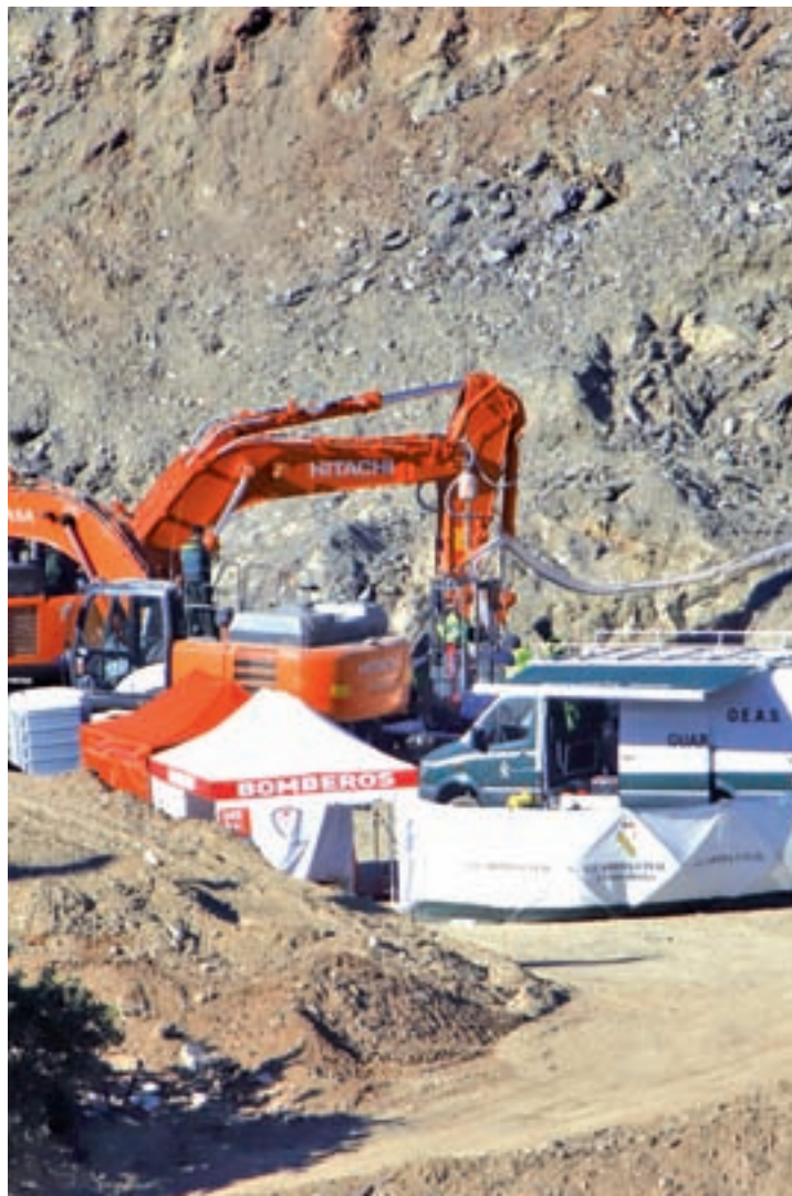
Zona donde se encuentra el pozo de Totalán

Por ello, para realizar una prospección de aguas se necesitan permisos locales y de las confederaciones hidro-