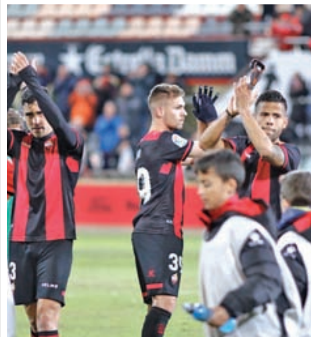
La andadura del cuadro tarraconense toca a su fin

Donde si hay unanimidad azulgrana es en la representación de medallistas del Mundial que juegan en la Asobal: el danés Mortensen y los franceses Mem, Fàbregas, Timothy N'Guessan y Sorhaindo.