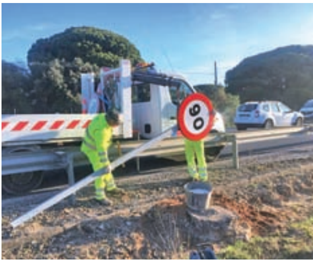
Operarios cambian una de las señales