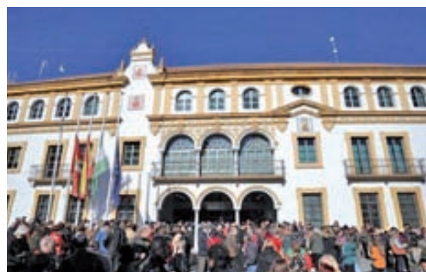
Concentración de repulsa en Dos Hermanas

En la tarde del pasado domingo, después que sobre las 17 horas del sábado el Servicio Coordinado de Emergencias 112 de Andalucía reci-