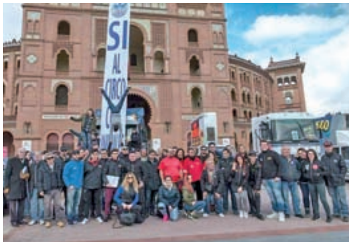
Protestas: Varios miembros de la Asociación Circo Reunidos harán huelga de hambre en las puertas del Ayuntamiento si Carmena sigue con sus planes. "No entendemos por qué quieren prohibir algo que es legal y que cumple todos los controles de bienestar animal", se lamentan.

Más de dos años después, la Junta de Gobierno ha aprobado el proyecto inicial de la modificación de la Ordenan-