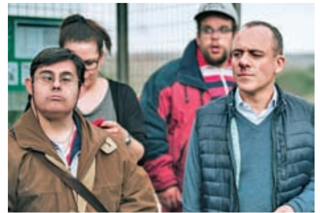
'Campeones', otra de las favoritas con 11 nominaciones

LA CATEGORÍA DE 'MEJOR ACTOR PROTAGONISTA' GENERA MUCHA EXPECTACIÓN