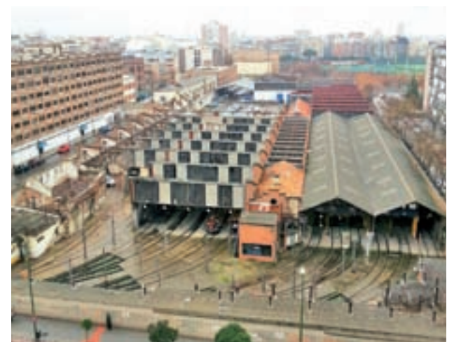
Las antiguas dependencias de Metro

"Esperamos que el PSOE reconsidere su postura a favor de las 400 familias, con su voto favorable a la aprobación definitiva de este plan parcial", concluyen.