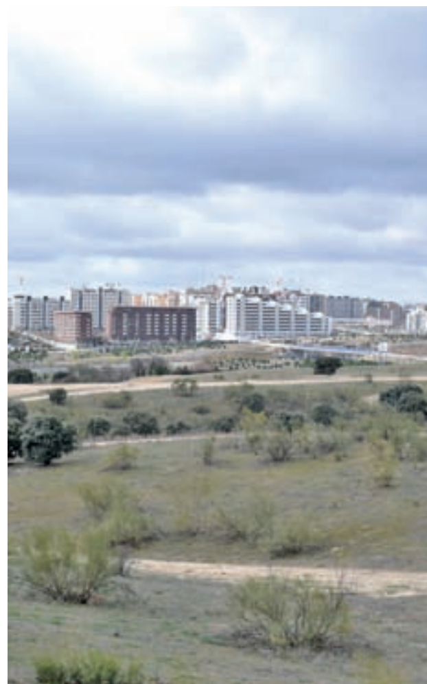
Valdebebas, visto desde Alcobendas

Por otro lado, el documento urbanístico regula la futu-