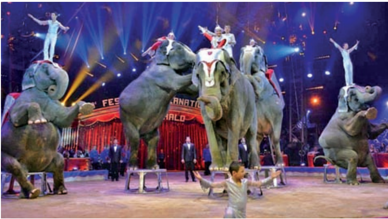
Varios elefantes, en un espectáculo circense