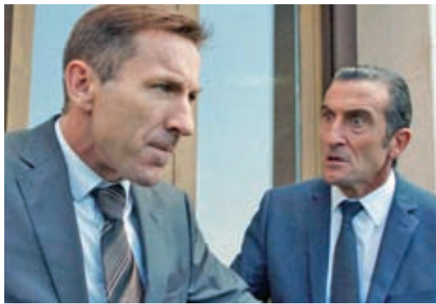
'El reino' lidera las nominaciones: opta a 13 premios

Mucho más claro es el sentido homenaje que rendirá el cine español a Narciso 'Chicho' Ibáñez Serrador, un director sin cuyo trabajo no se entendería la aparición de cineastas como Juan Antonio Bayona, Alejandro Amenábar, Álex de la Iglesia o Jaime Balagueró.