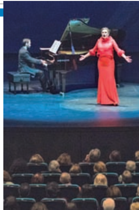
Ainhoa Arteta actuó en la Gala de la Paz