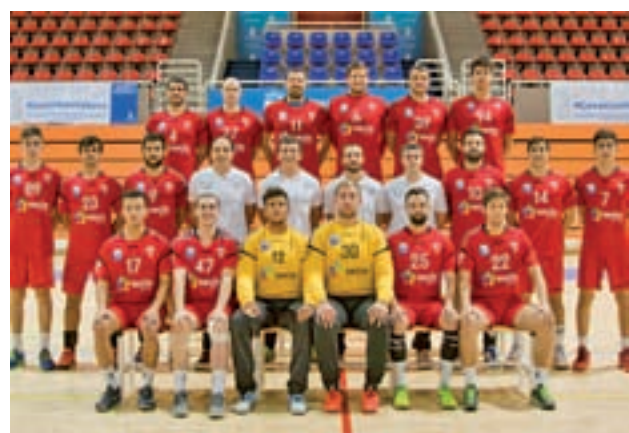
Plantilla del Secin Group

Por su parte, en Tercera División, el Alcobendas Sport jugará este domingo a las 11:30 horas contra el Alcorcón B, después de haber ganado el pasado fin de semana 2-1 al Tres Cantos. Con ello, los alcobendenses siguen terceros con 41 puntos, por detrás del Getafe B, con 48; y de Las Rozas, líder con 51.