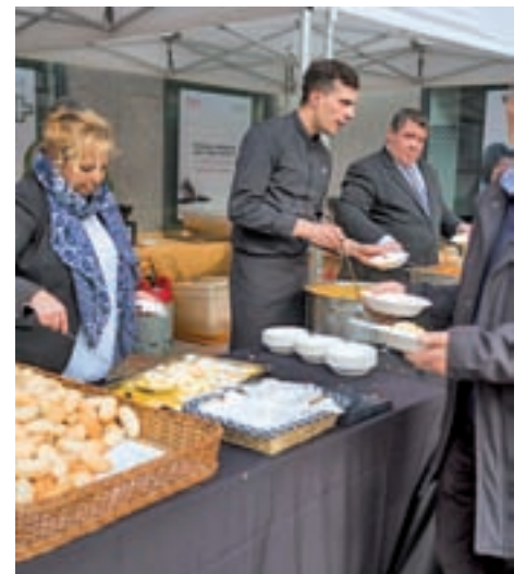
Reparto de migas y gachas

LAS FIESTAS TERMINAN ESTE SÁBADO CON EL DÍA DE LAS CANDELAS