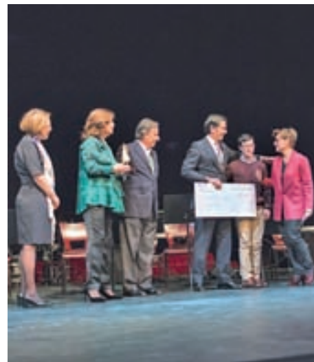
La Fundación Garrigou, Premio de la Paz