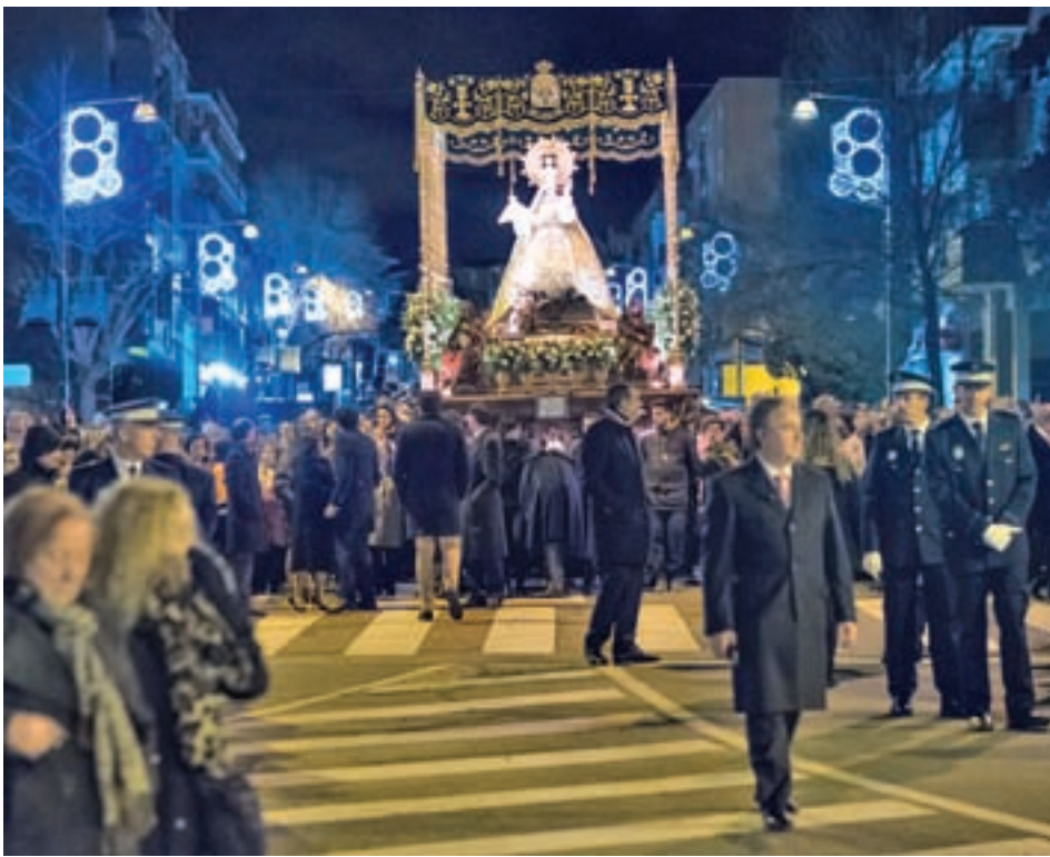
Miles de personas se dieron cita, un año más, en la procesión