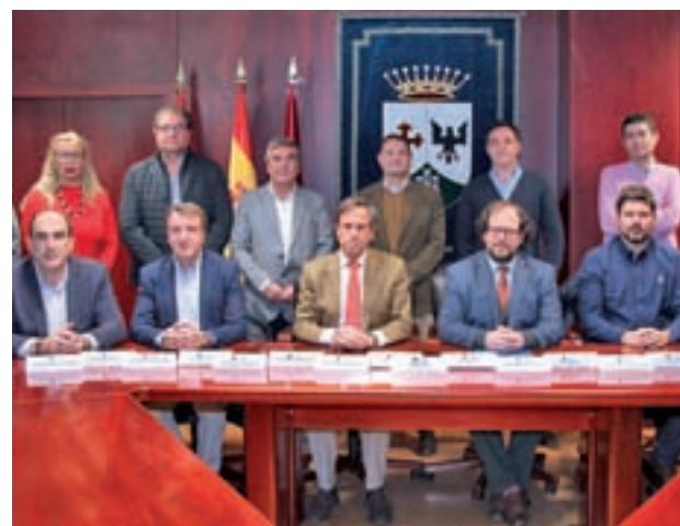
Alcaldes y concejales en la reunión

Asimismo, analizaron que los 1.000 millones de euros comprometidos el pasado