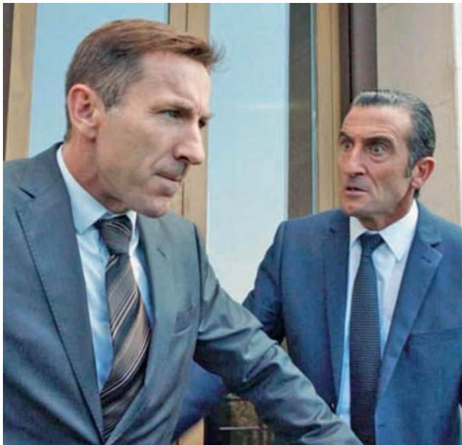
'EL REINO': Rodrigo Sorogoyen tiene el honor de poner su firma a la favorita indiscutible de cara a esta XXXIII gala. Con 13 nominaciones (entre ellas película, dirección, guion original o dirección de fotografía), esta radiografía de la corrupción política busca la guinda a una trayectoria jalonada por buenas cifras en taquilla, con una recaudación por encima del medio millón de euros.

Pero volviendo al punto de partida, los del 2019 son, a priori, unos Goya en los que los gustos de la Academia van más de la mano con los del público, una parte esta última imprescindible para que el engranaje de esta industria funcione correctamente. De entre las diez pro-