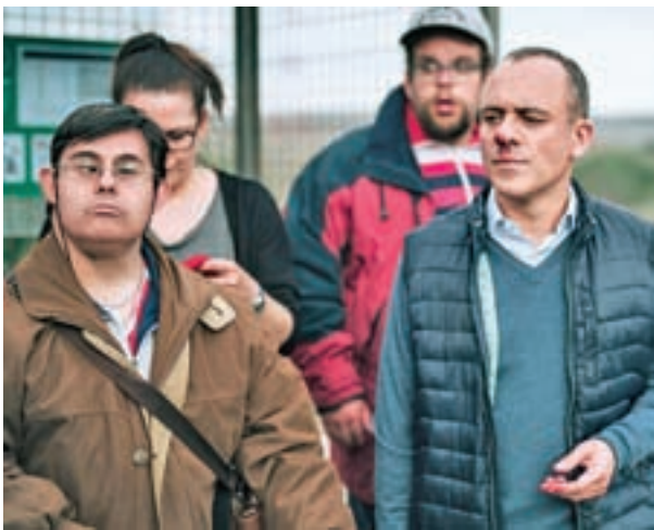
'CAMPEONES': Aunque no logró colarse en la carrera final por los Oscar, el film de Javier Fesser ha sido la única que le ha hecho sombra a 'El reino', gracias a sus 11 nominaciones. Tiene el honor, además, de ser la película nacional más taquillera.