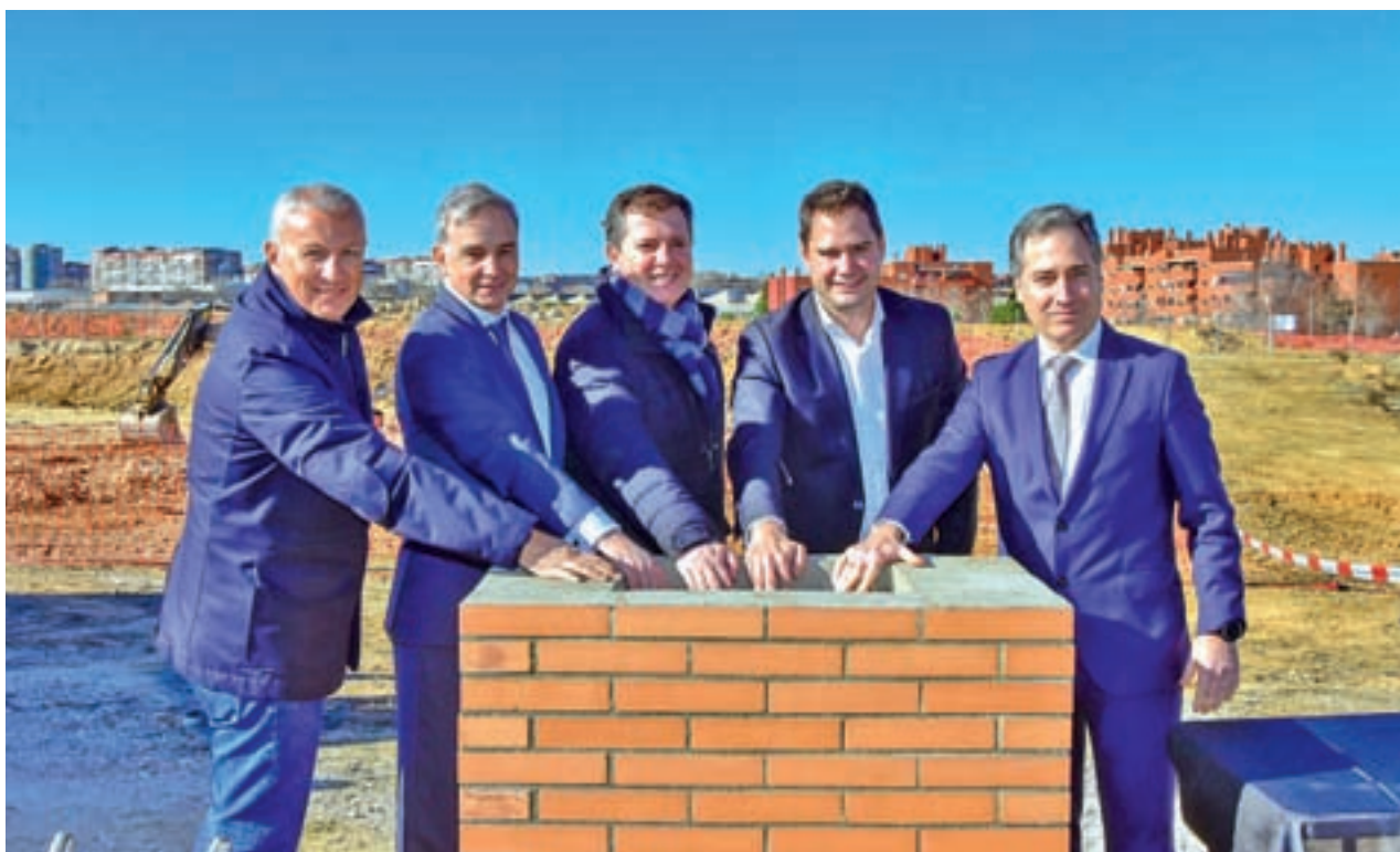
Acto de colocación de la primera piedra de las obras