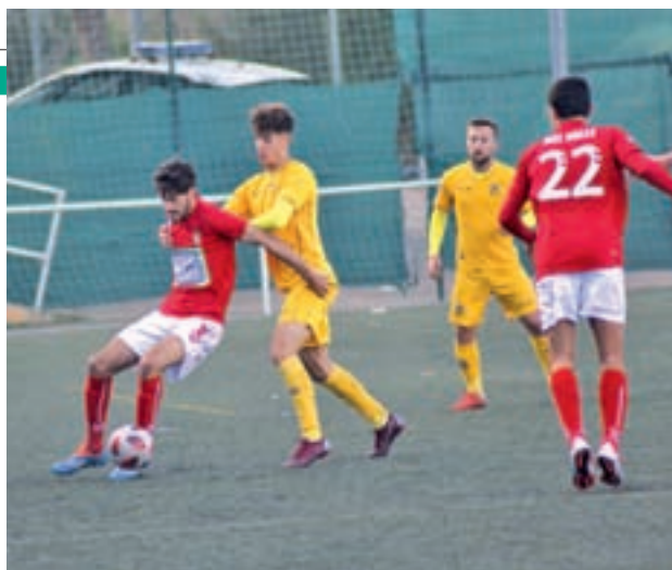
El Alcalá volvió a ganar tras siete partidos

Los 23 puntos conquistados hasta la fecha permiten al Alcalá tener un margen de 4 unidades respecto al equipo que abre los puestos de descenso, el Pozuelo. Un poco más abajo, en la penúltima plaza, aparece el San Agustín del Guadalix, el rival de este domingo (12 horas) de