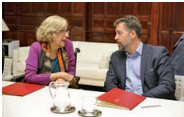
Un momento de la firma

lindes de sus términos municipales, dando cumplimiento de esta forma al Pacto Regional de la Cañada Real, suscrito en mayo del año 2017 por la Delegación del Gobierno en Madrid (PP), la Comunidad de Madrid (PP) y los ayuntamientos de Rivas Vaciamadrid (Izquierda Unida),