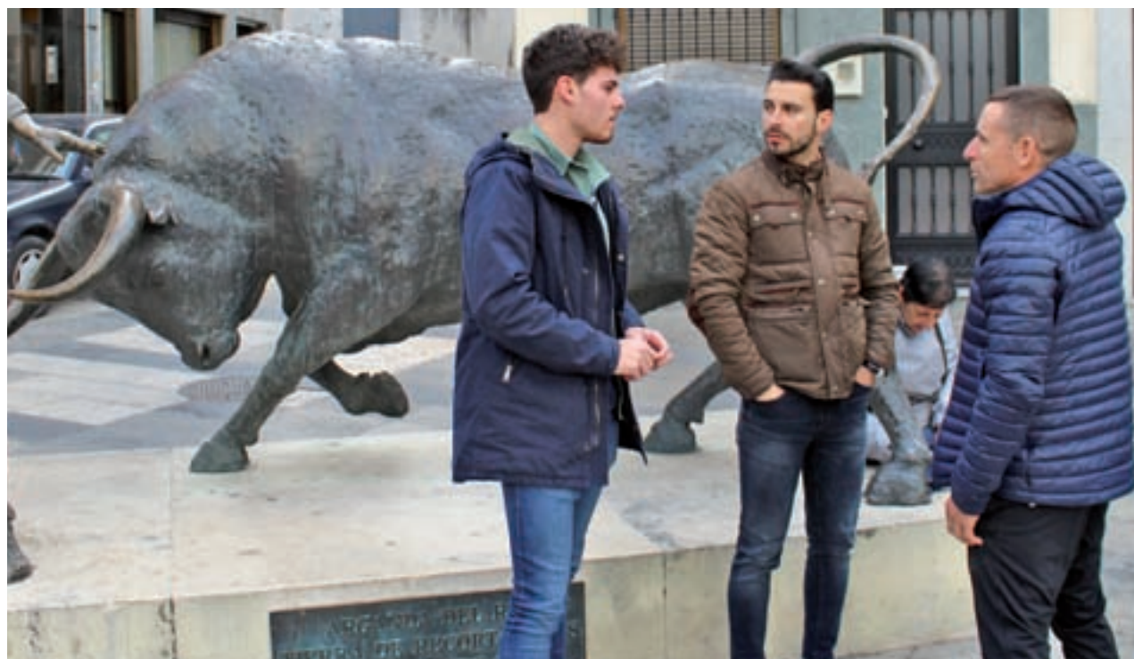
A.E. / GENTE

Las prendas en colores vibrantes junto a las blusas con detalles de volante serán clave