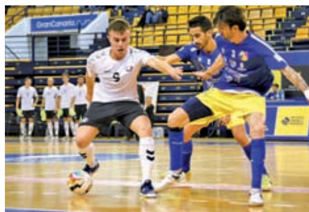
El Rivas escala hasta la novena posición

El conjunto blanco puede, por tanto, echar una mano a sus vecinos del Alcalá, aunque más allá de favores ajenos, la entidad del Santiago del Pino sólo piensa en seguir acumulando méritos para estar en los 'play-offs' de ascenso a Segunda B. Por el momento, va por el buen camino, ya que el empate con el Villaverde permitió que conservara la cuarta plaza.