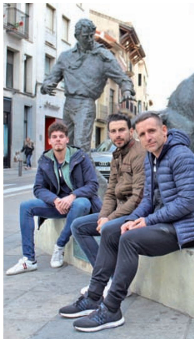
Los tres recortadores posan para GENTE en Arganda

veteranos del circuito. Campeón de España en la plaza de toros de Zaragoza en 2012 y 2013, no duda en reconocer que el momento más emotivo de su carrera fue la primera vez que levantó el trofeo como mejor recortador de nuestro país. Ha ganado dos veces en el coso argandeño y a punto estuvo, en octubre del pasado año, de repetir la gesta de proclamarse el mejor recortador de España en la plaza de Las Ventas, donde quedó en segunda posición