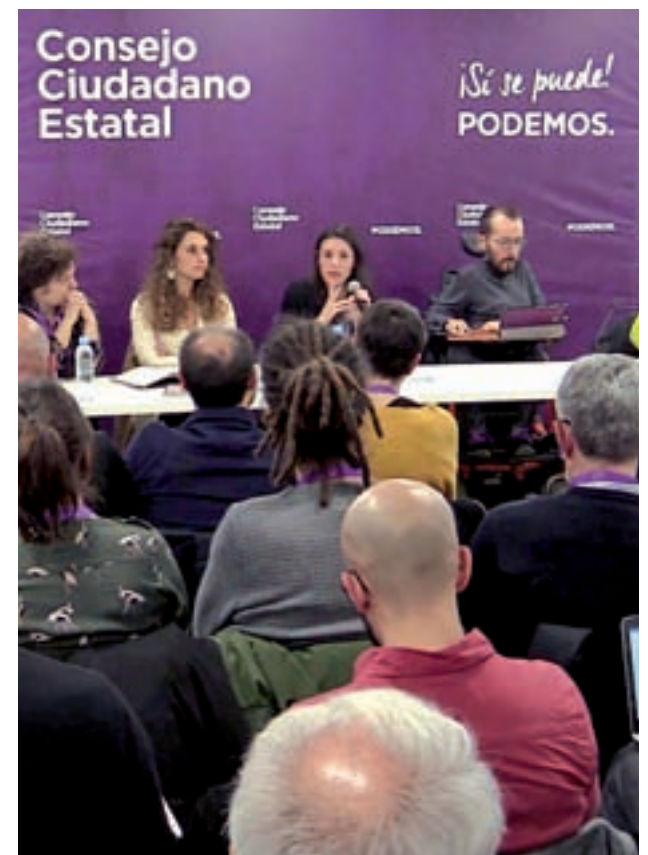
Consejo Estatal de Podemos

El paso decisivo, sin embargo, se vivió en la jornada de este miércoles. Iglesias, de baja paterna, escribió en su perfil de Facebook una serie de "consideraciones" entre las que destacan que "Íñigo no es